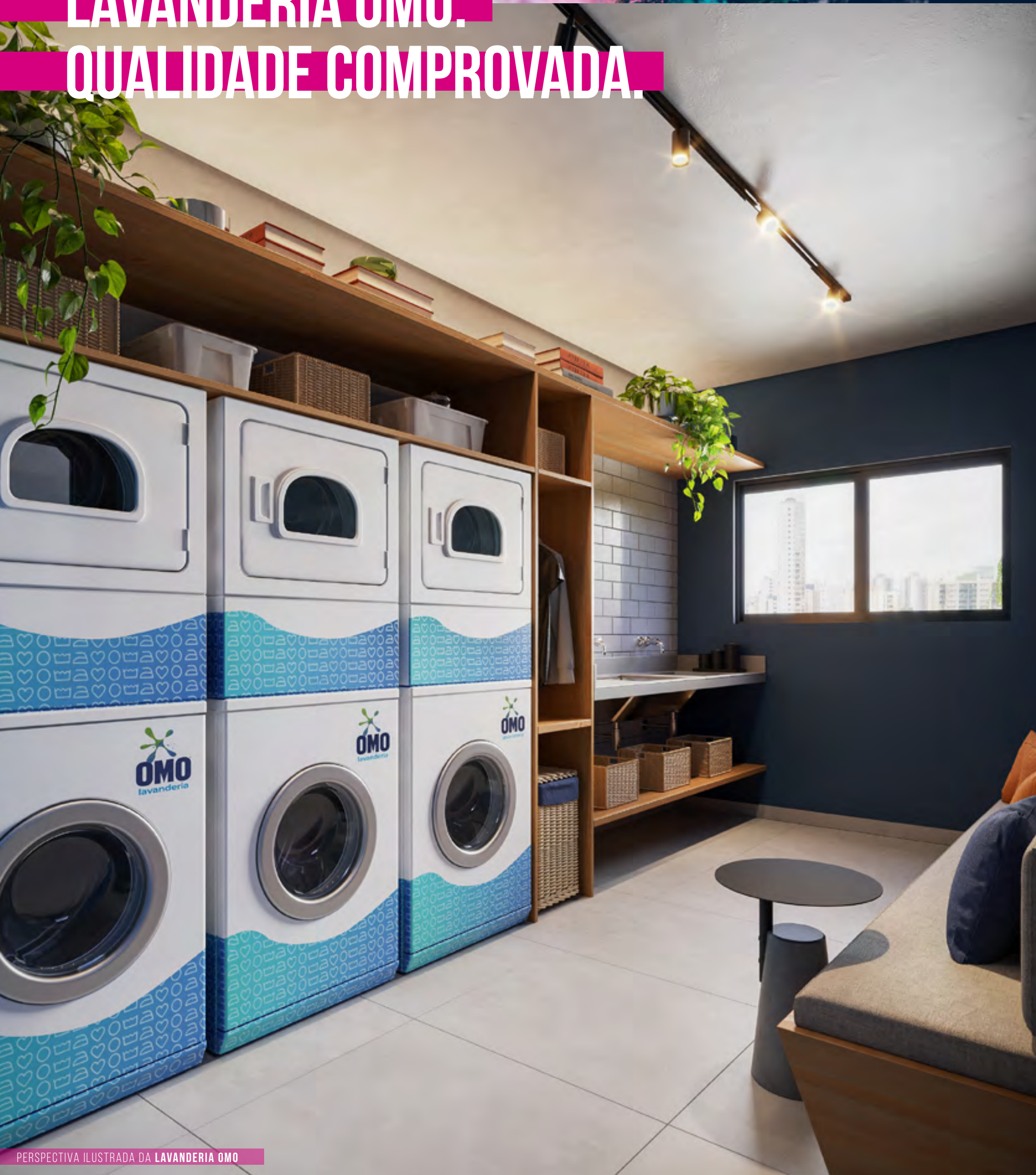
PERSPECTIVA ILUSTRADA DA LAVANDERIA OMO