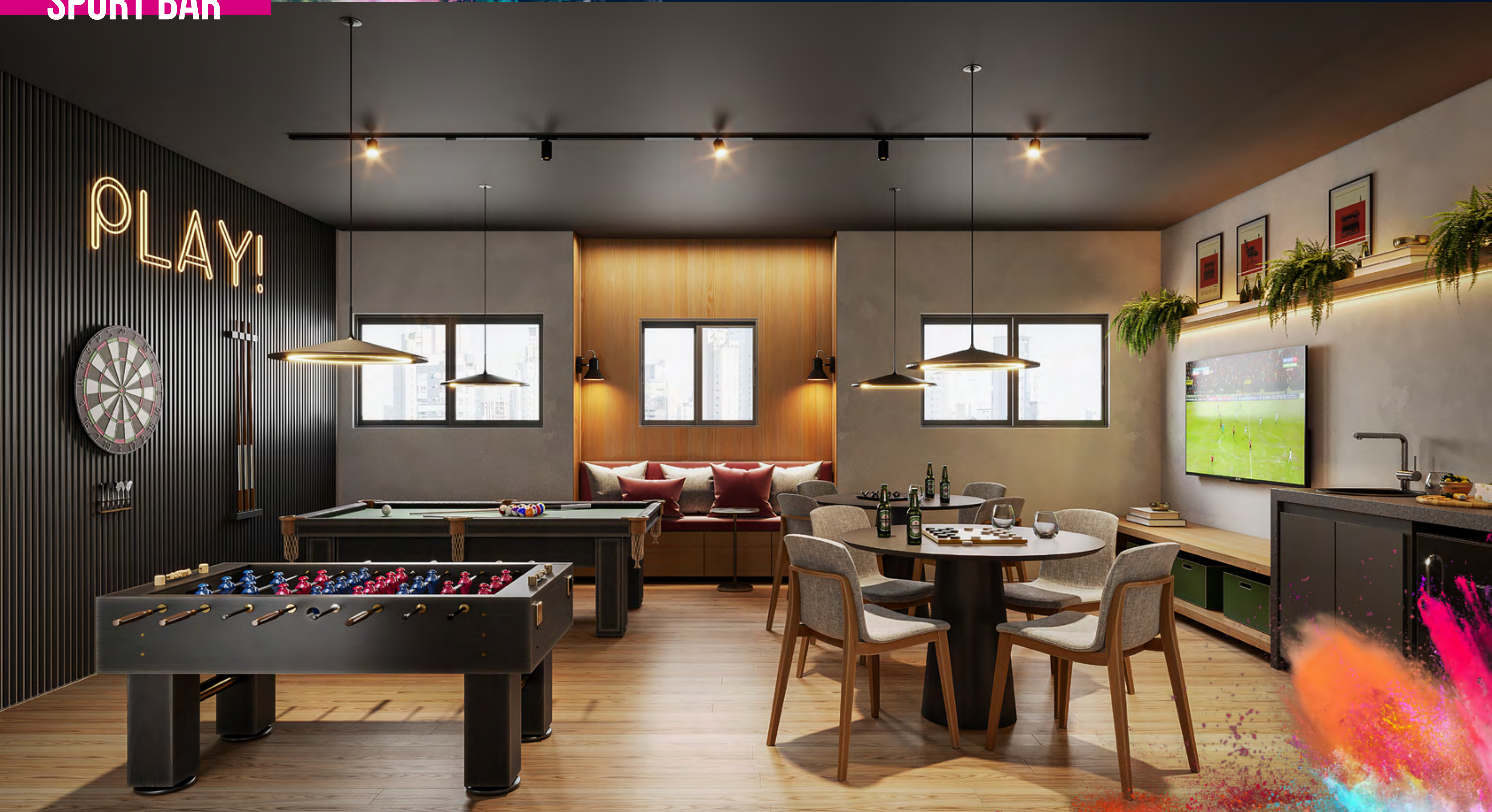
PERSPECTIVA ILUSTRADA DO SPORT BAR