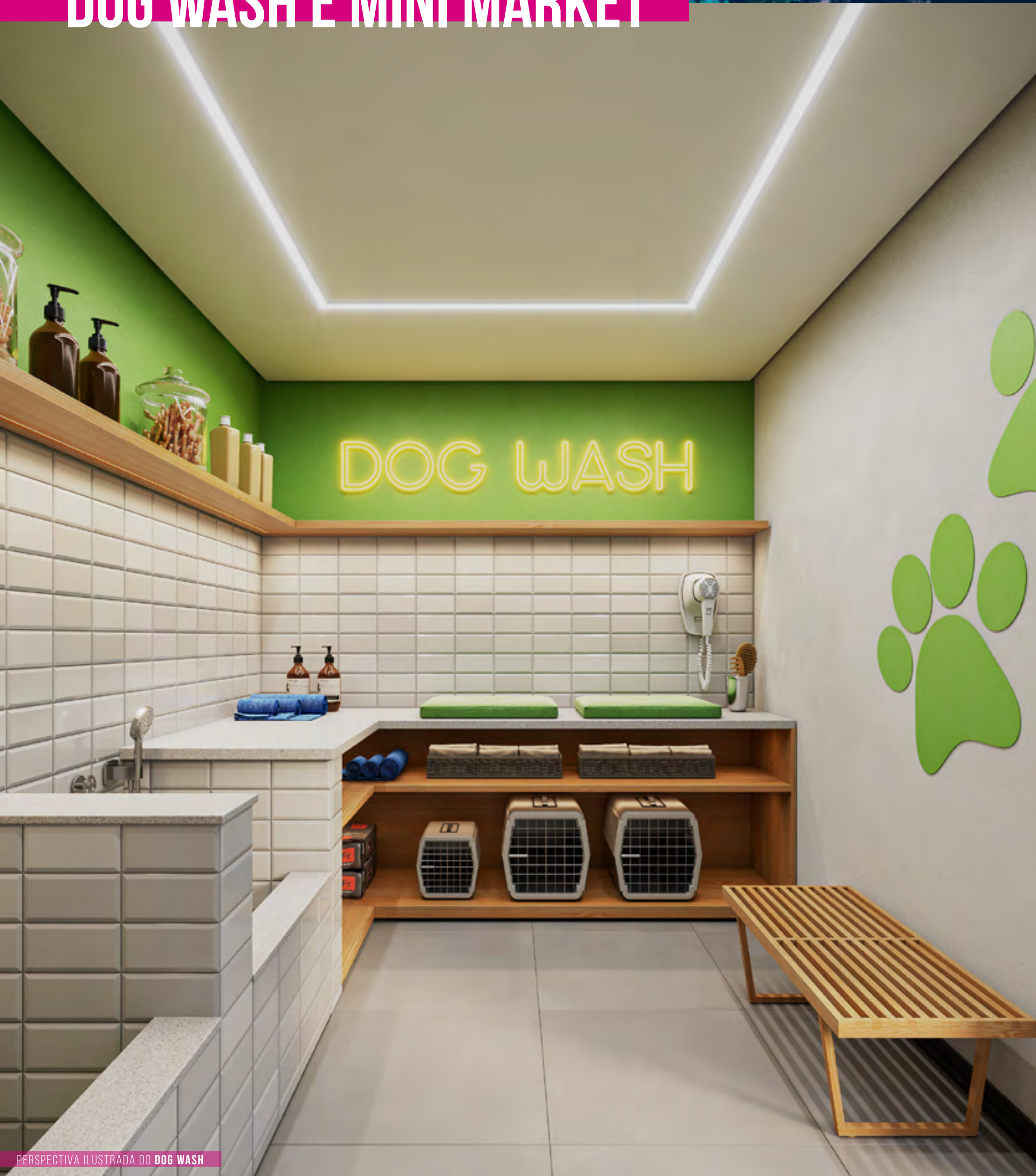
PERSPECTIVA ILUSTRADA DO DOG WASH