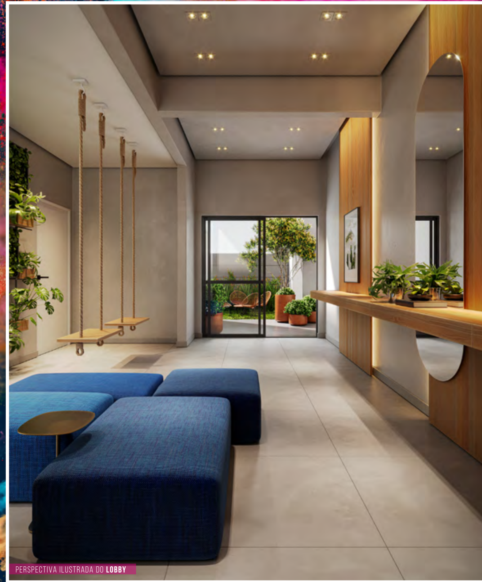
PERSPECTIVA ILUSTRADA DO LOBBY