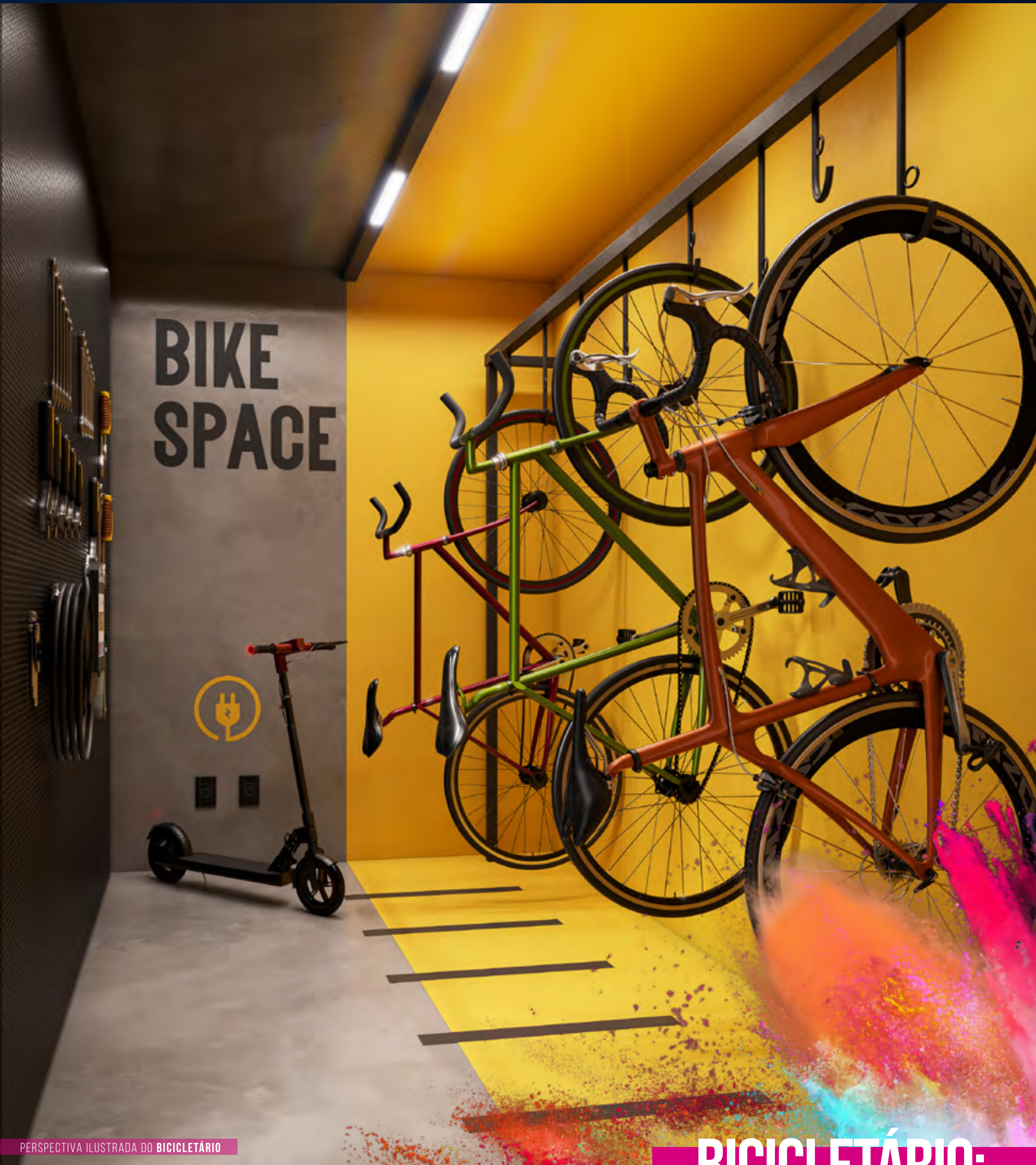
PERSPECTIVA ILUSTRADA DO BICICLETÁRIO