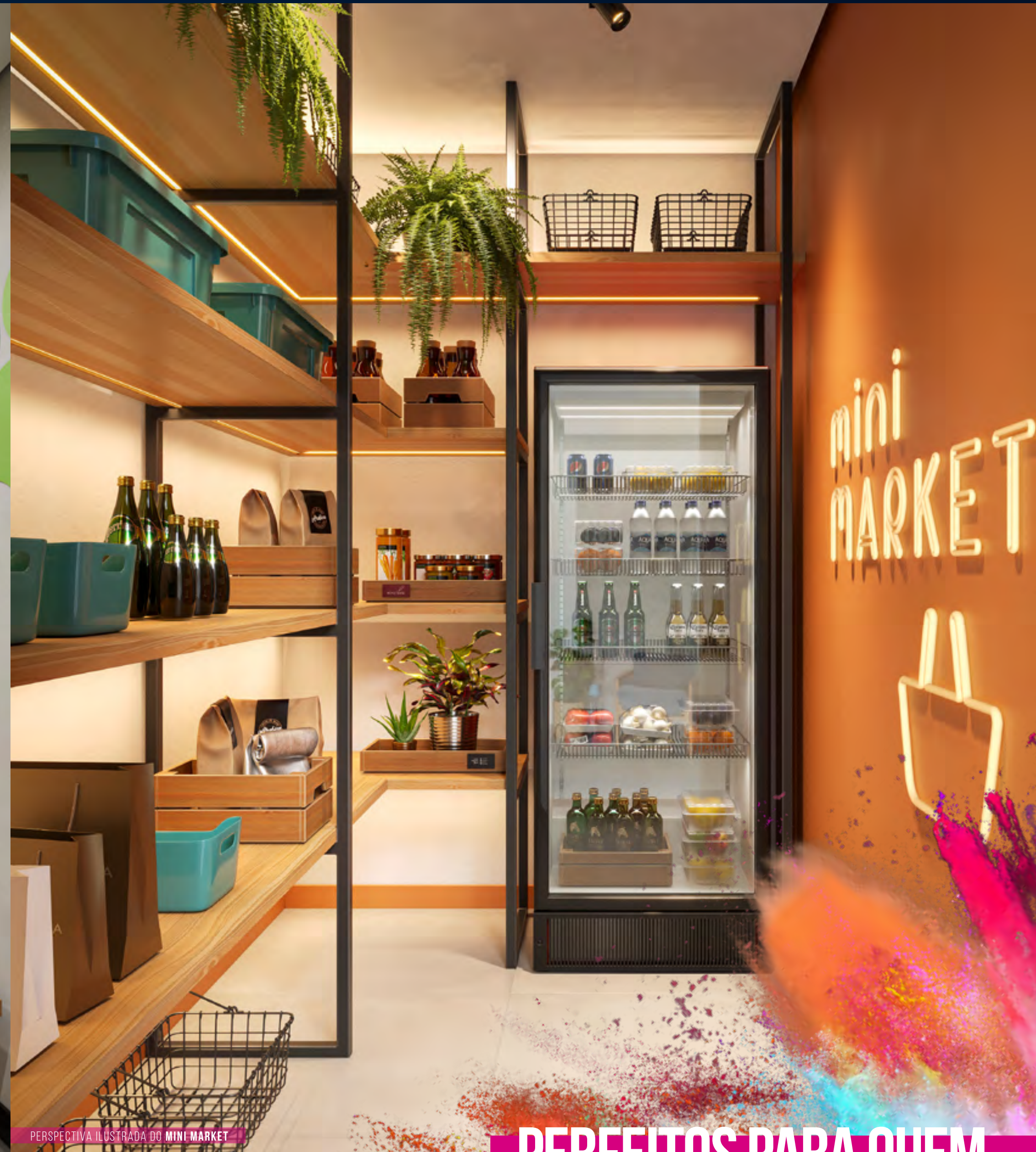
PERSPECTIVA ILUSTRADA DO MINI MARKET