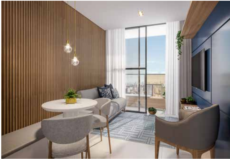
Living apto. 1 dorm.