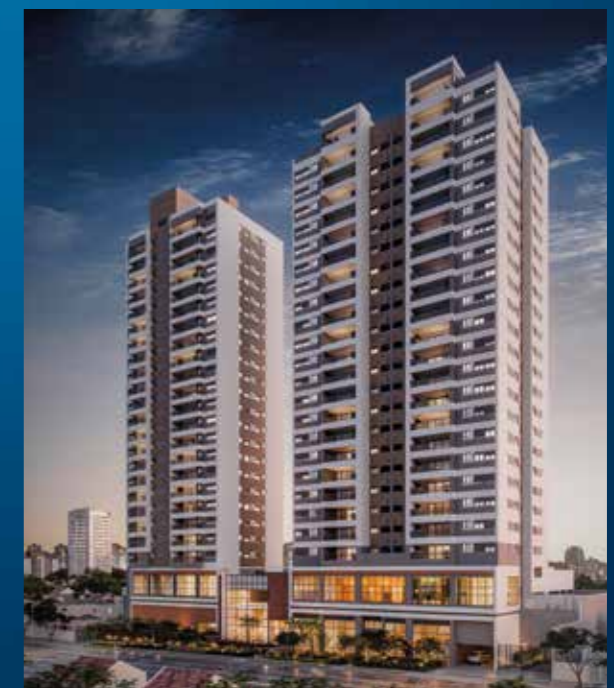
HIGH JD. PRUDÊNCIA

Rua das Flechas, 484 Jardim Prudência - São Paulo