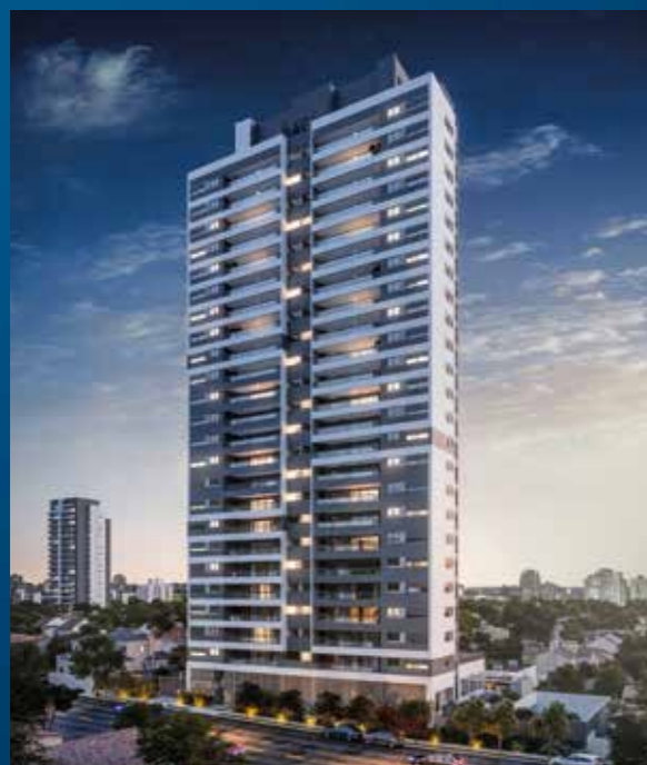
HIGH SANTA CRUZ

Rua José Cocciuffo, 76 Vila Mariana - São Paulo