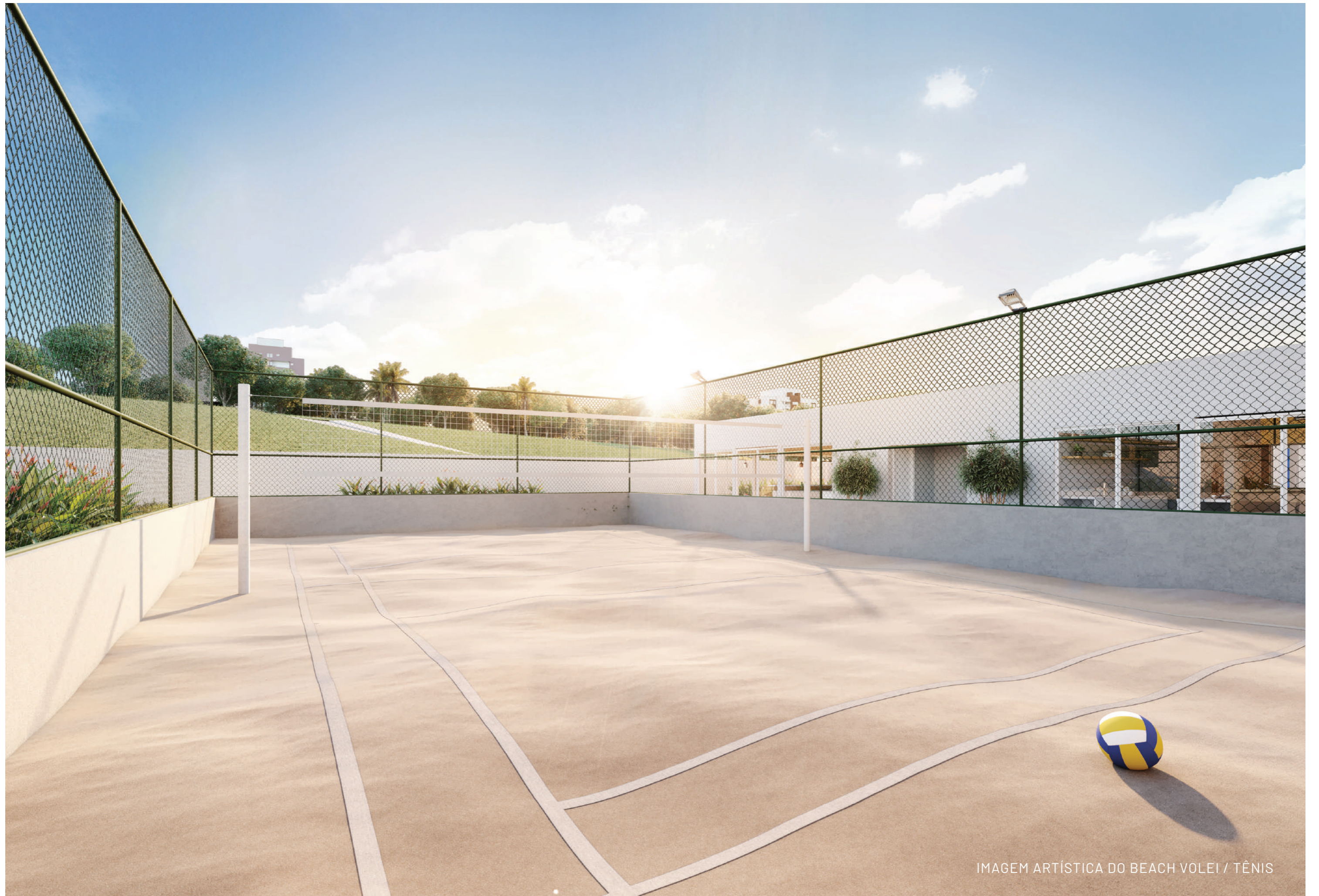
IMAGEM ARTÍSTICA DO BEACH VOLEI / TÊNIS