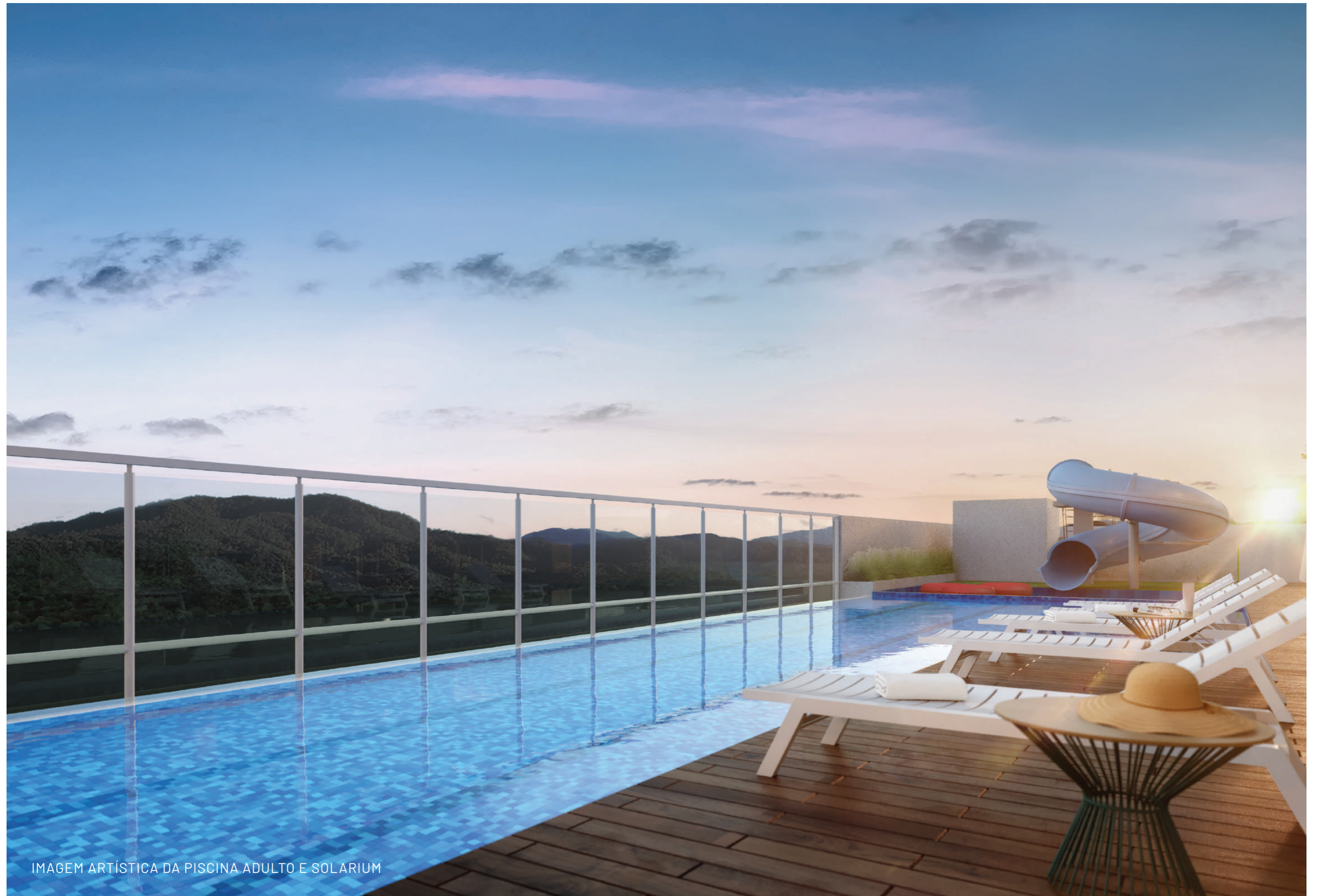
IMAGEM ARTÍSTICA DA PISCINA ADULTO E SOLARIUM