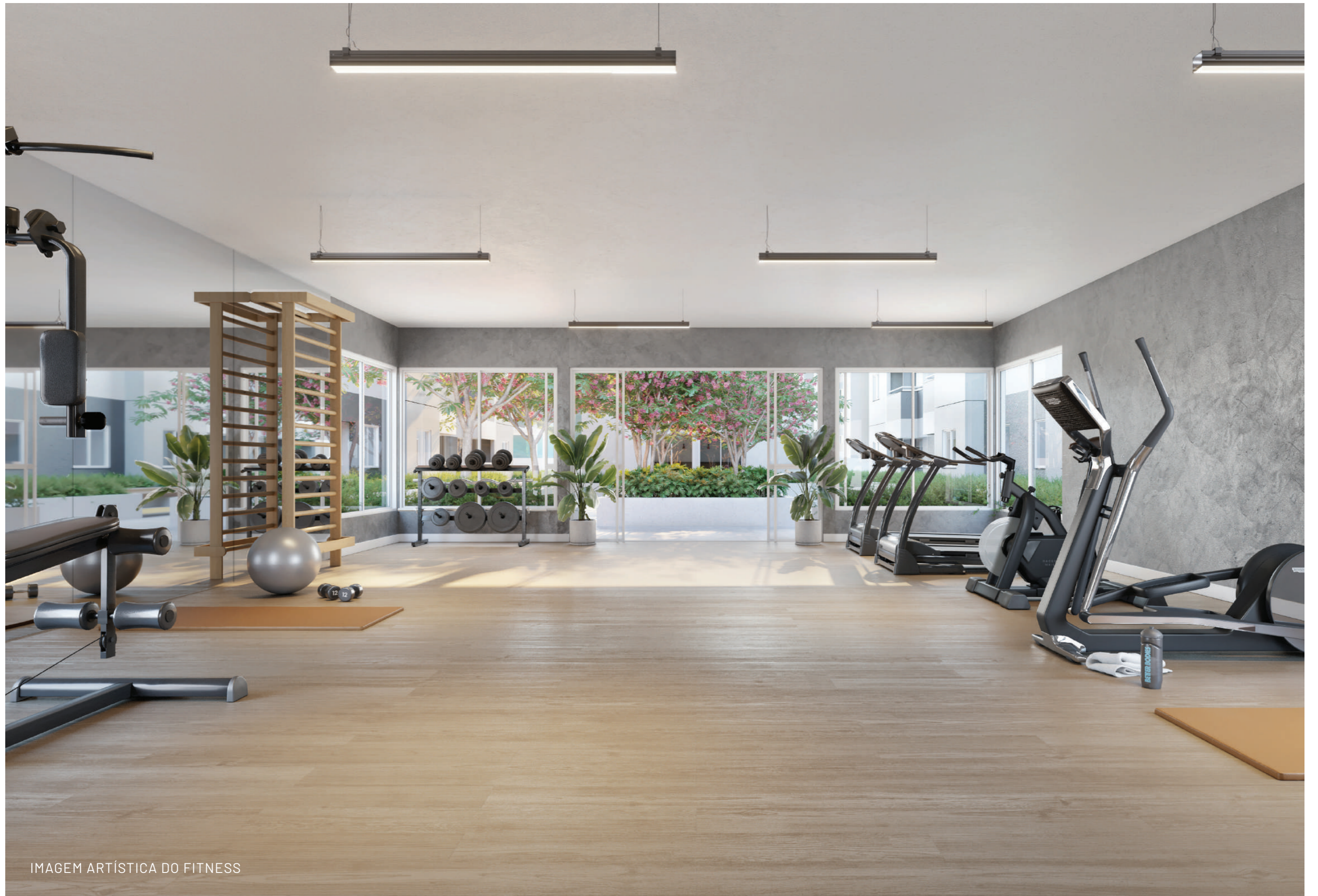
IMAGEM ARTÍSTICA DO FITNESS