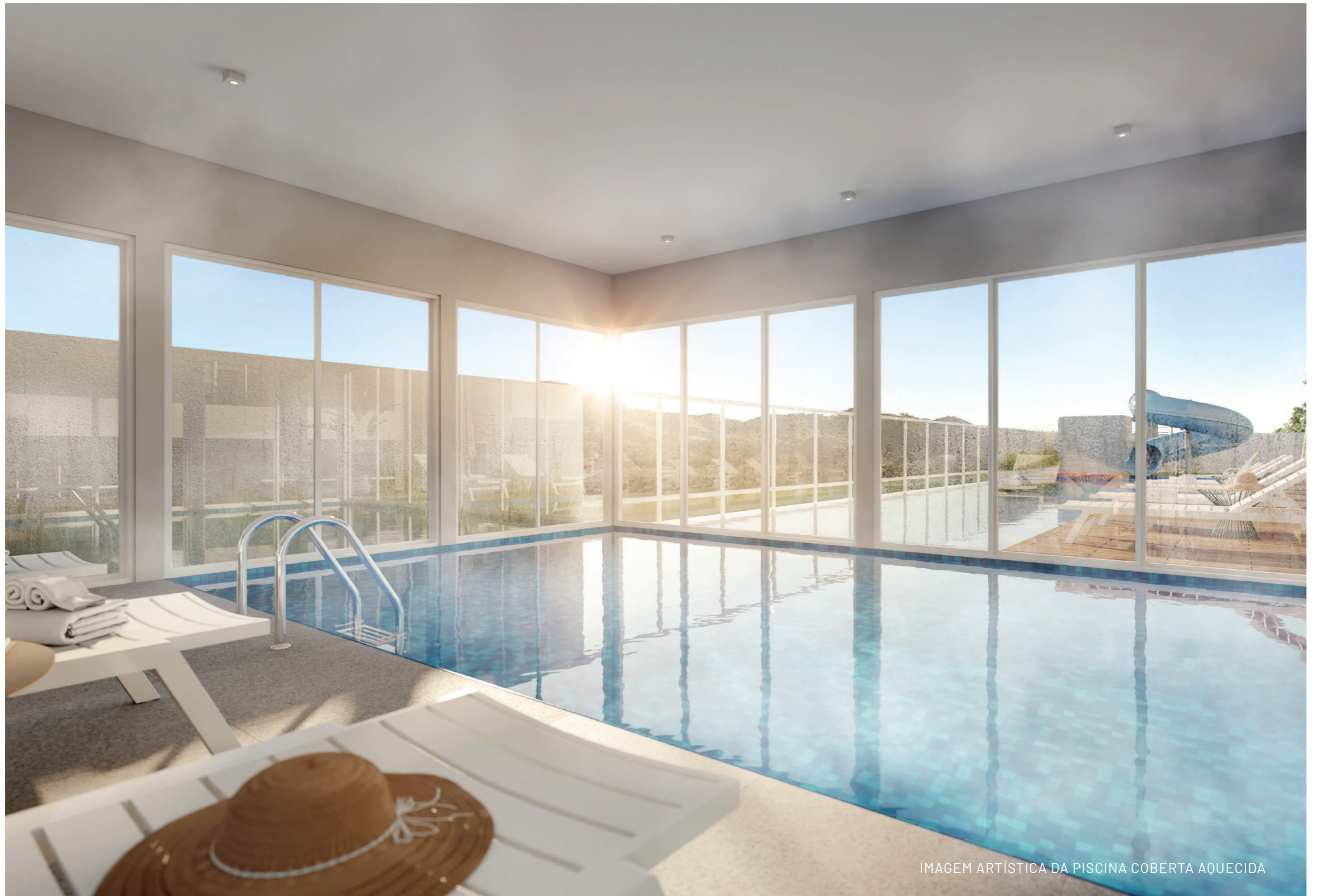
IMAGEM ARTÍSTICA DA PISCINA COBERTA AQUECIDA