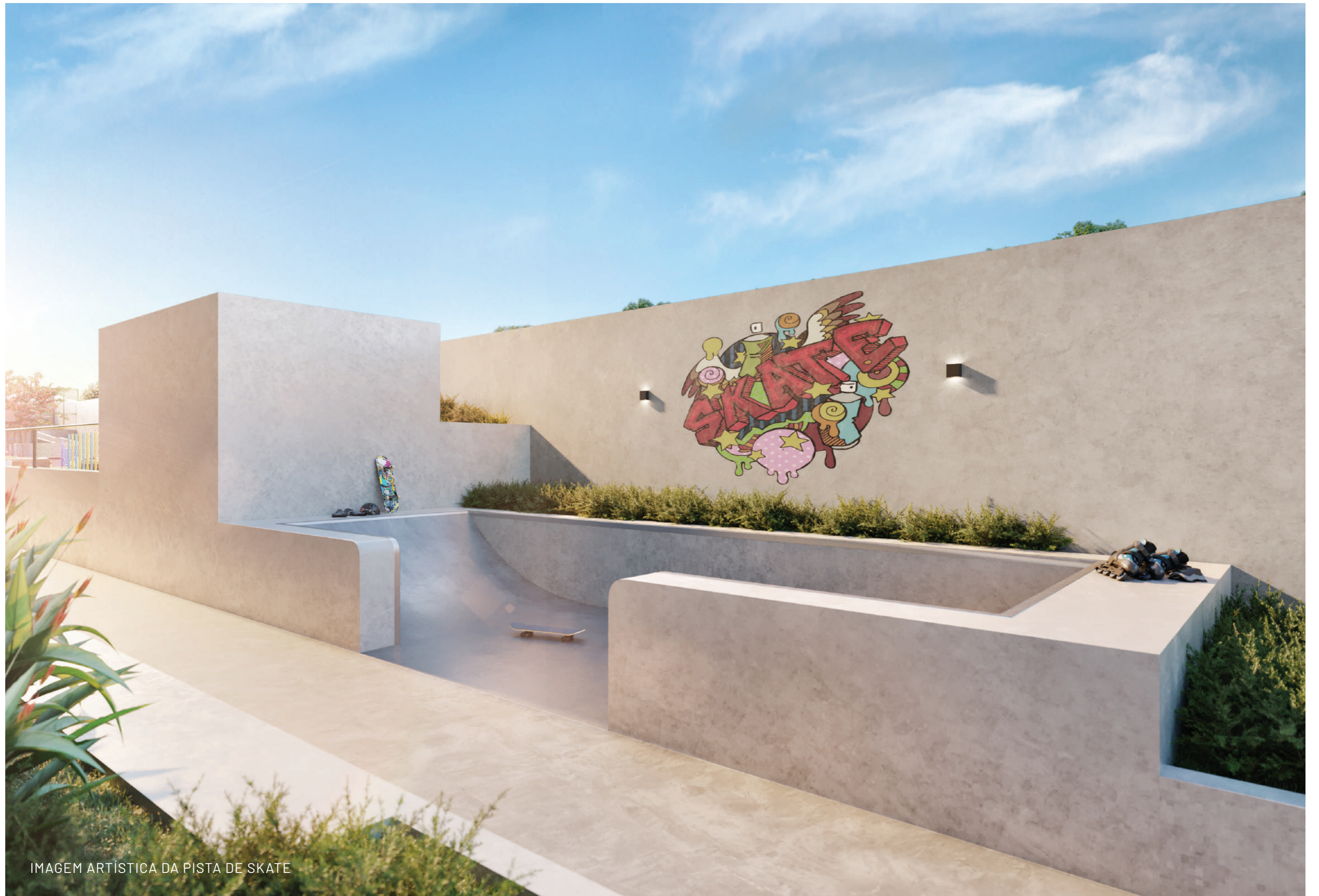
IMAGEM ARTÍSTICA DA PISTA DE SKATE