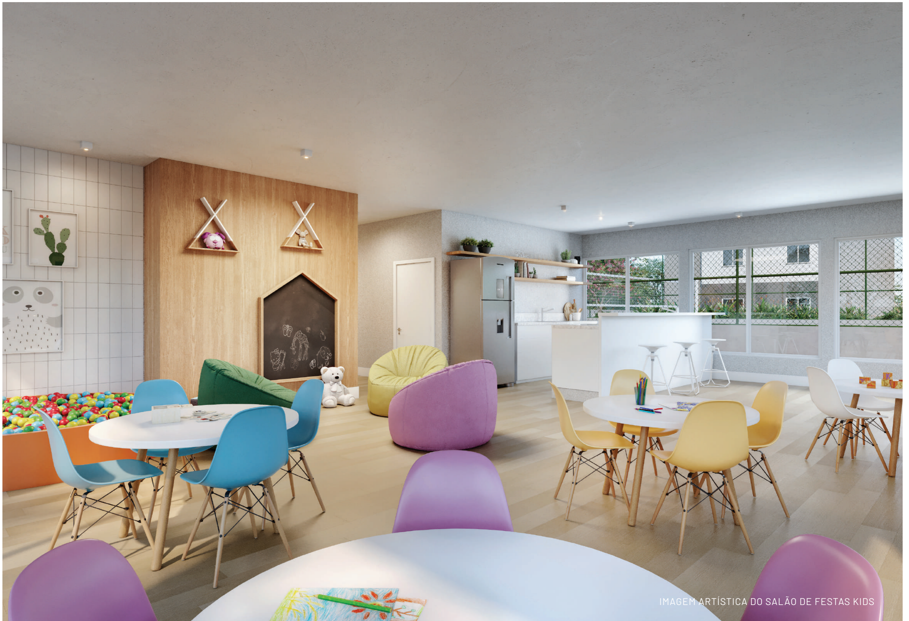
IMAGEM ARTÍSTICA DO SALÃO DE FESTAS KIDS