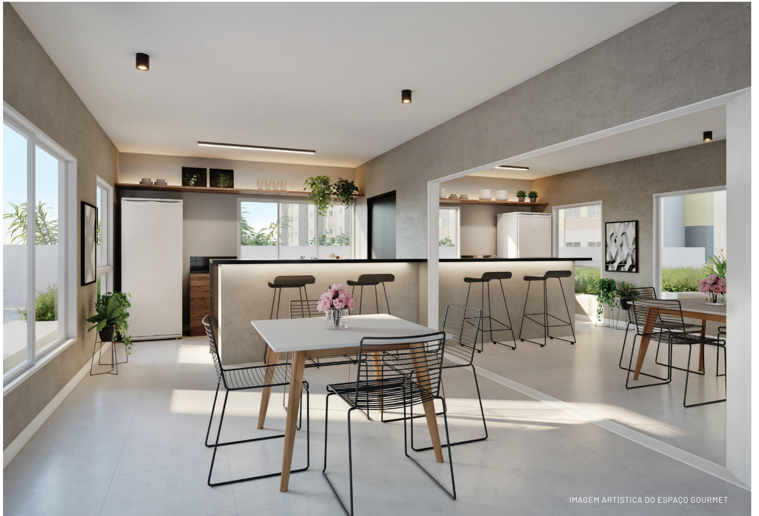
IMAGEM ARTÍSTICA DO ESPAÇO GOURMET