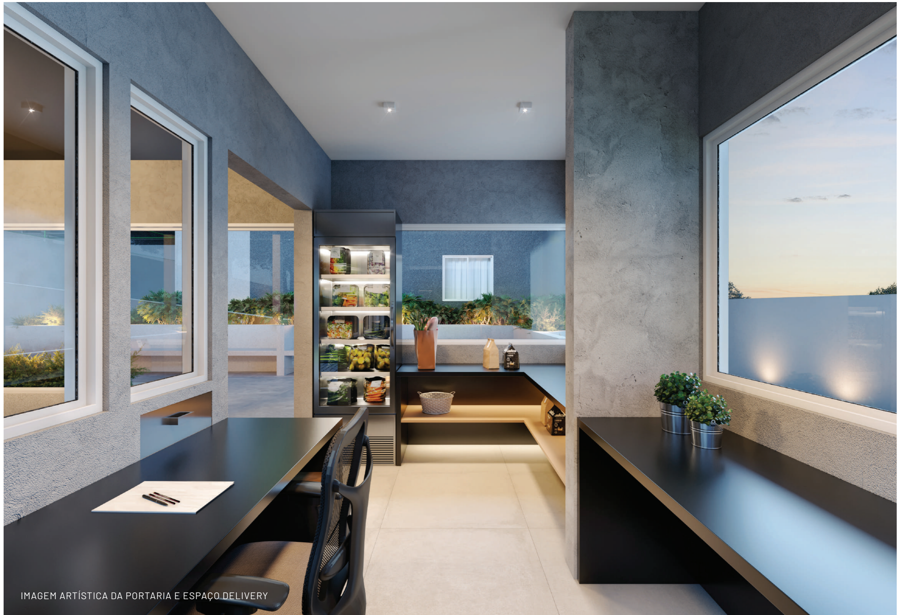
IMAGEM ARTÍSTICA DA PORTARIA E ESPAÇO DELIVERY