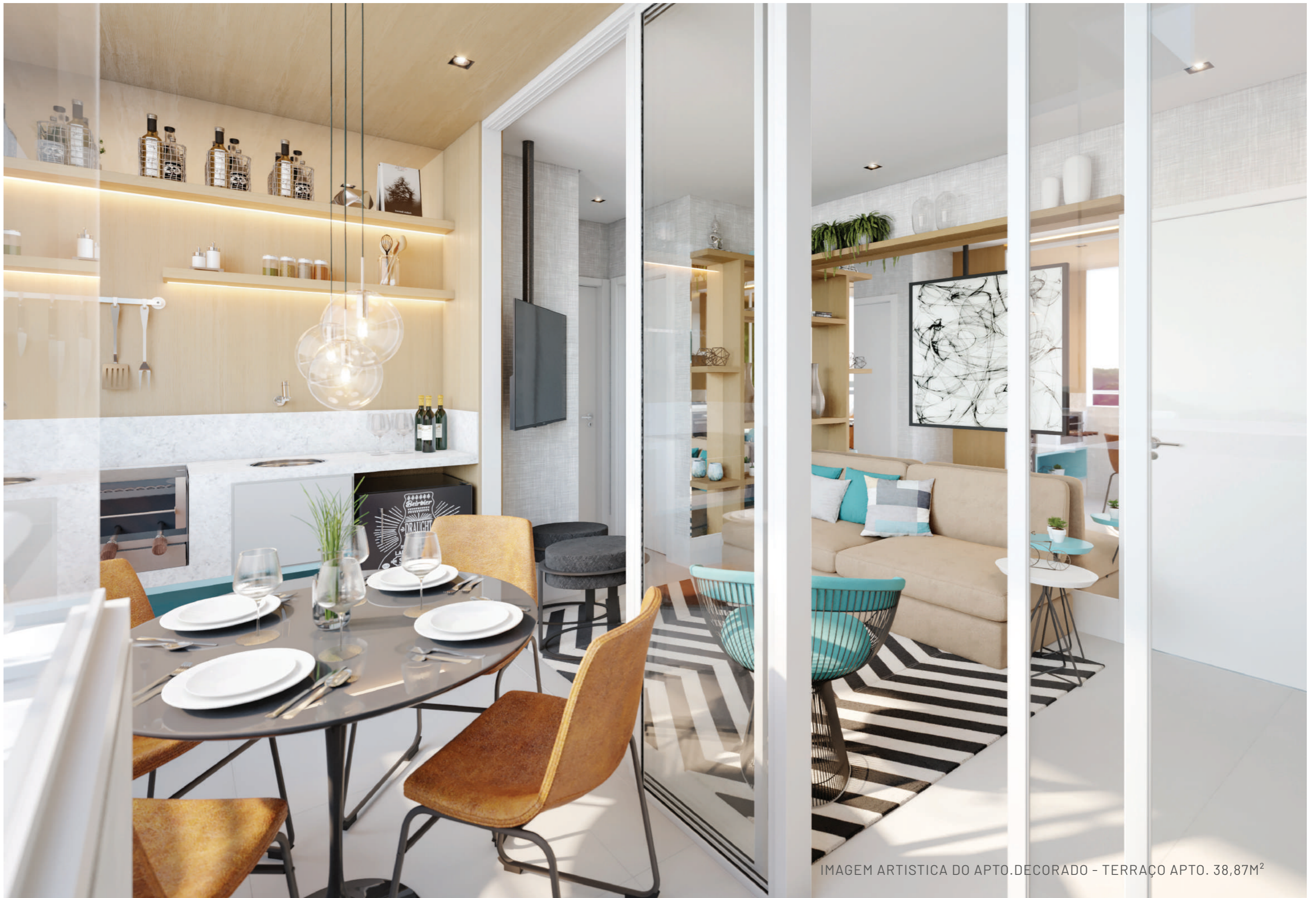
IMAGEM ARTISTICA DO APTO.DECORADO - TERRAÇO APTO. 38,87M 2