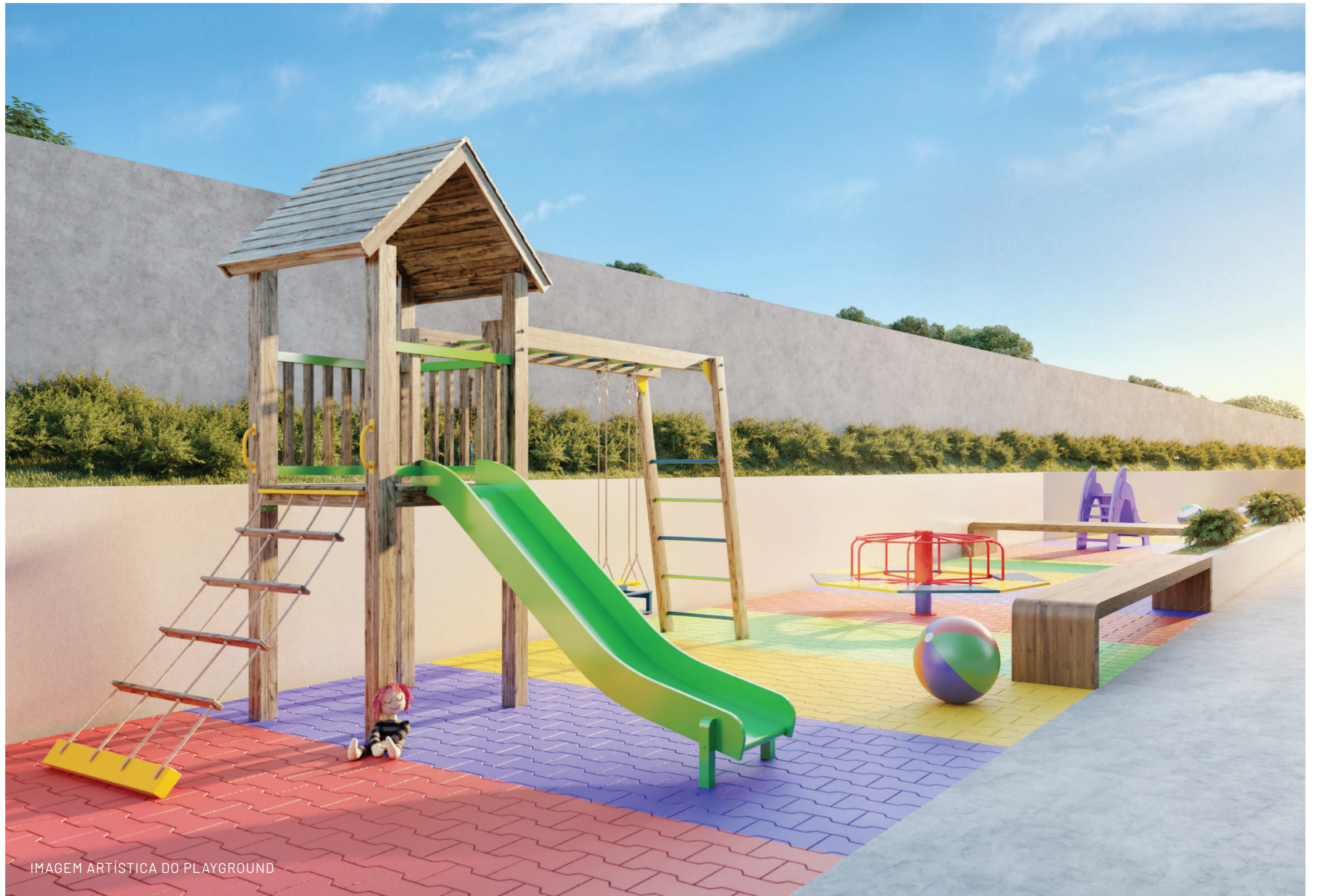
IMAGEM ARTÍSTICA DO PLAYGROUND