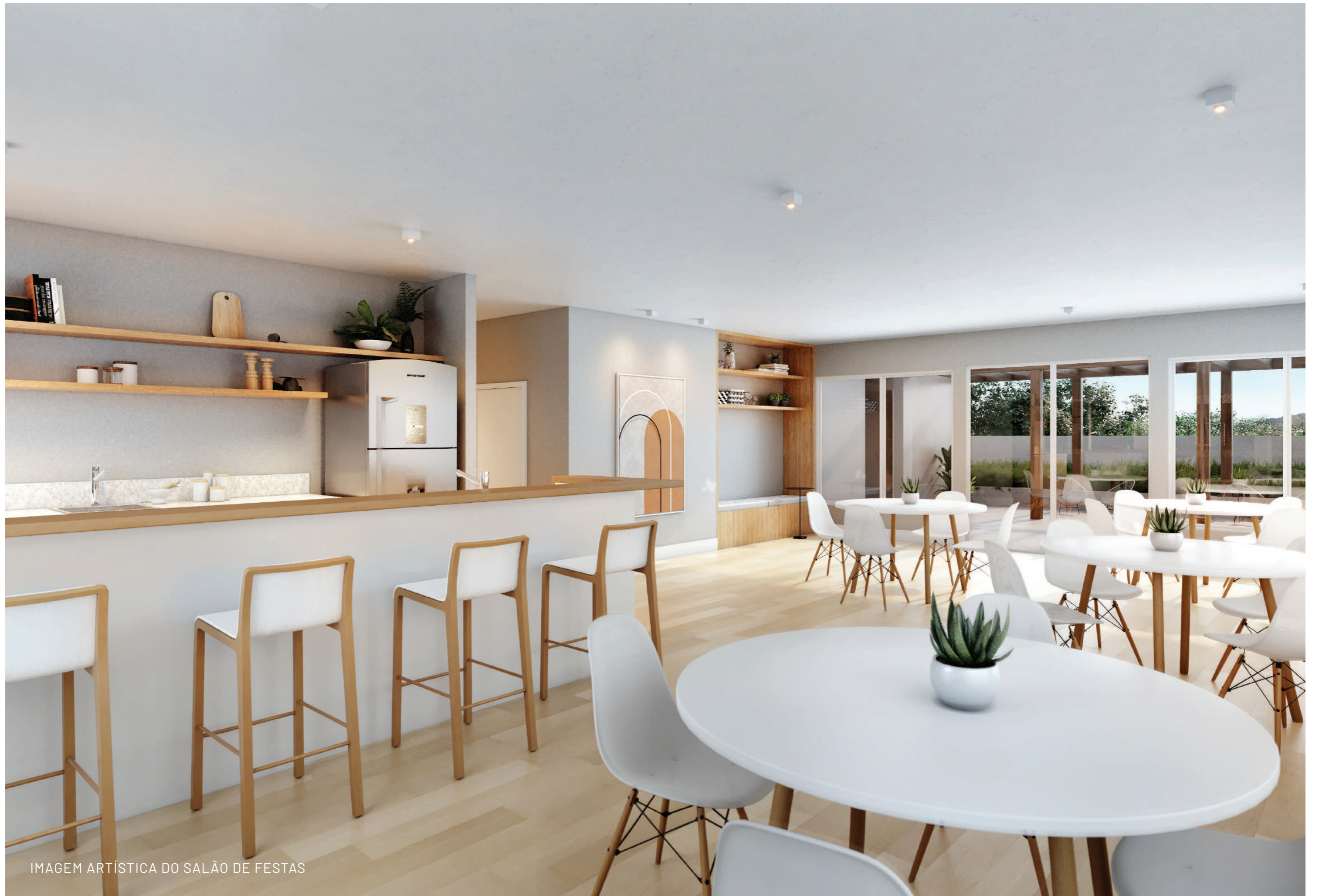
IMAGEM ARTÍSTICA DO SALÃO DE FESTAS