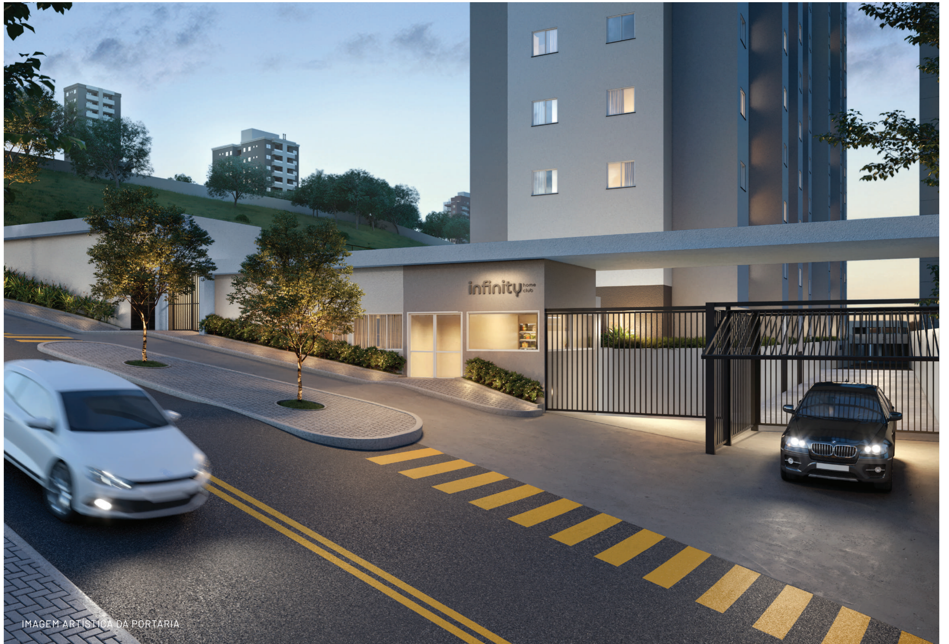
IMAGEM ARTÍSTICA DA PORTARIA