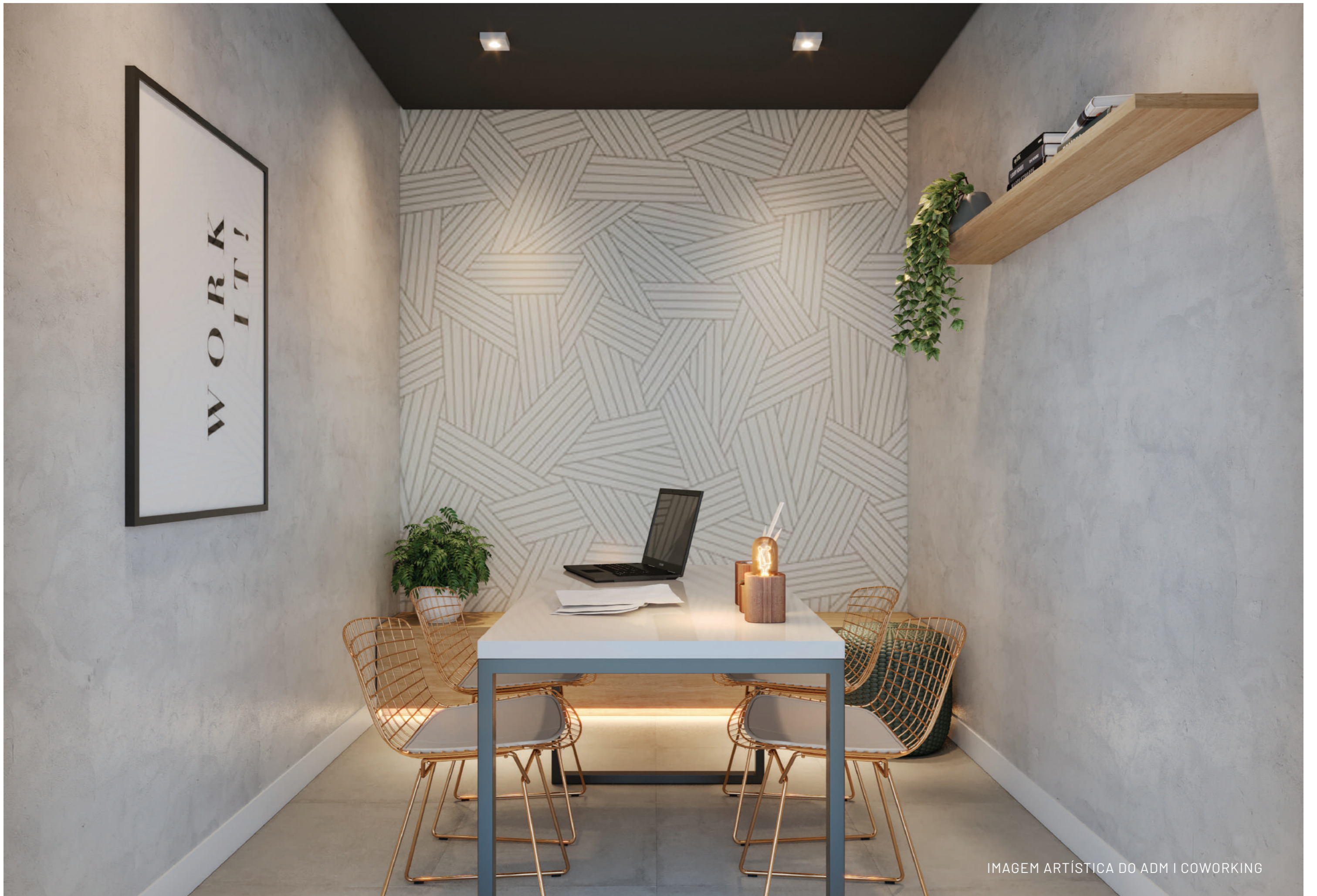
IMAGEM ARTÍSTICA DO ADM | COWORKING