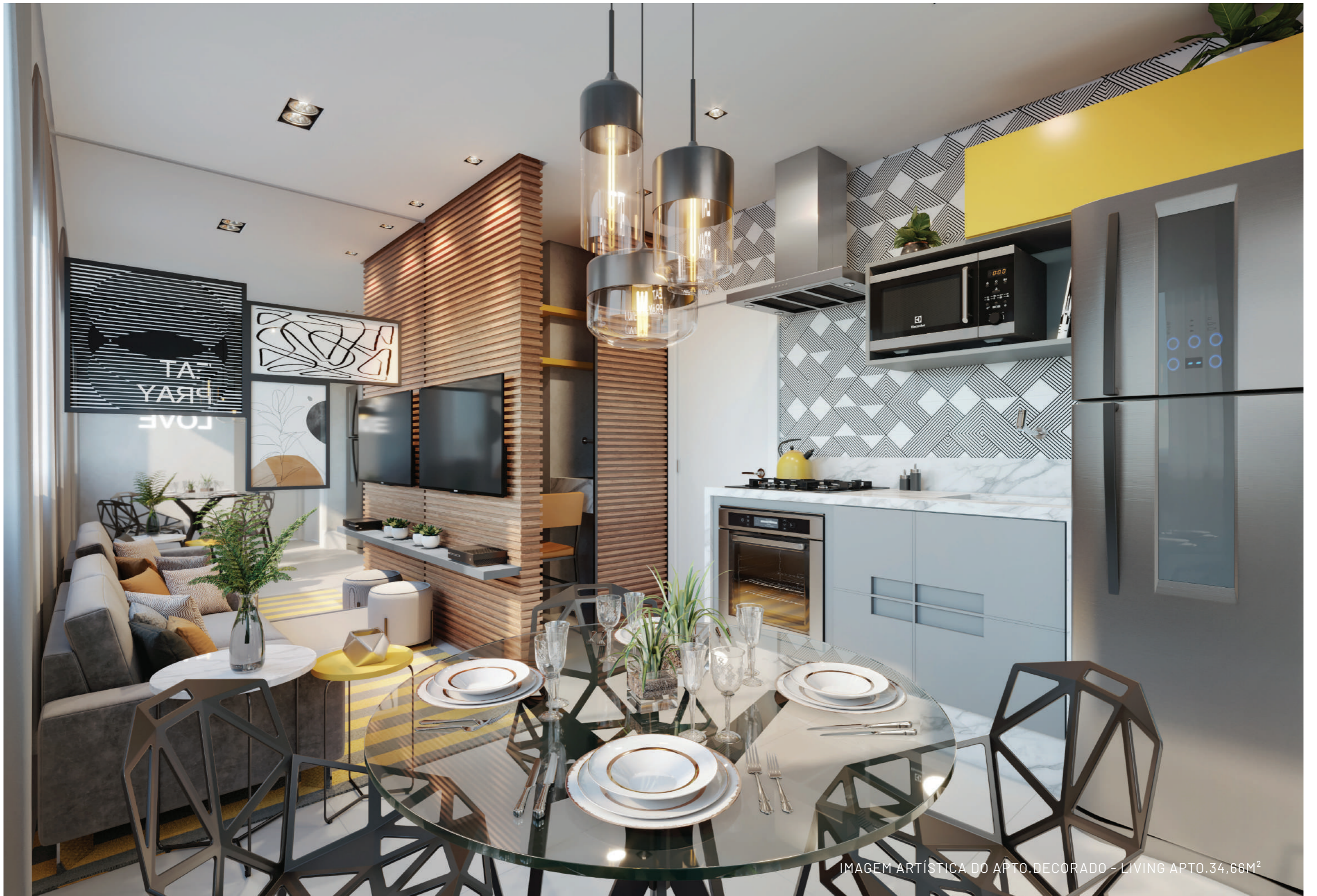
IMAGEM ARTÍSTICA DO APTO.DECORADO - LIVING APTO.34,66M 2