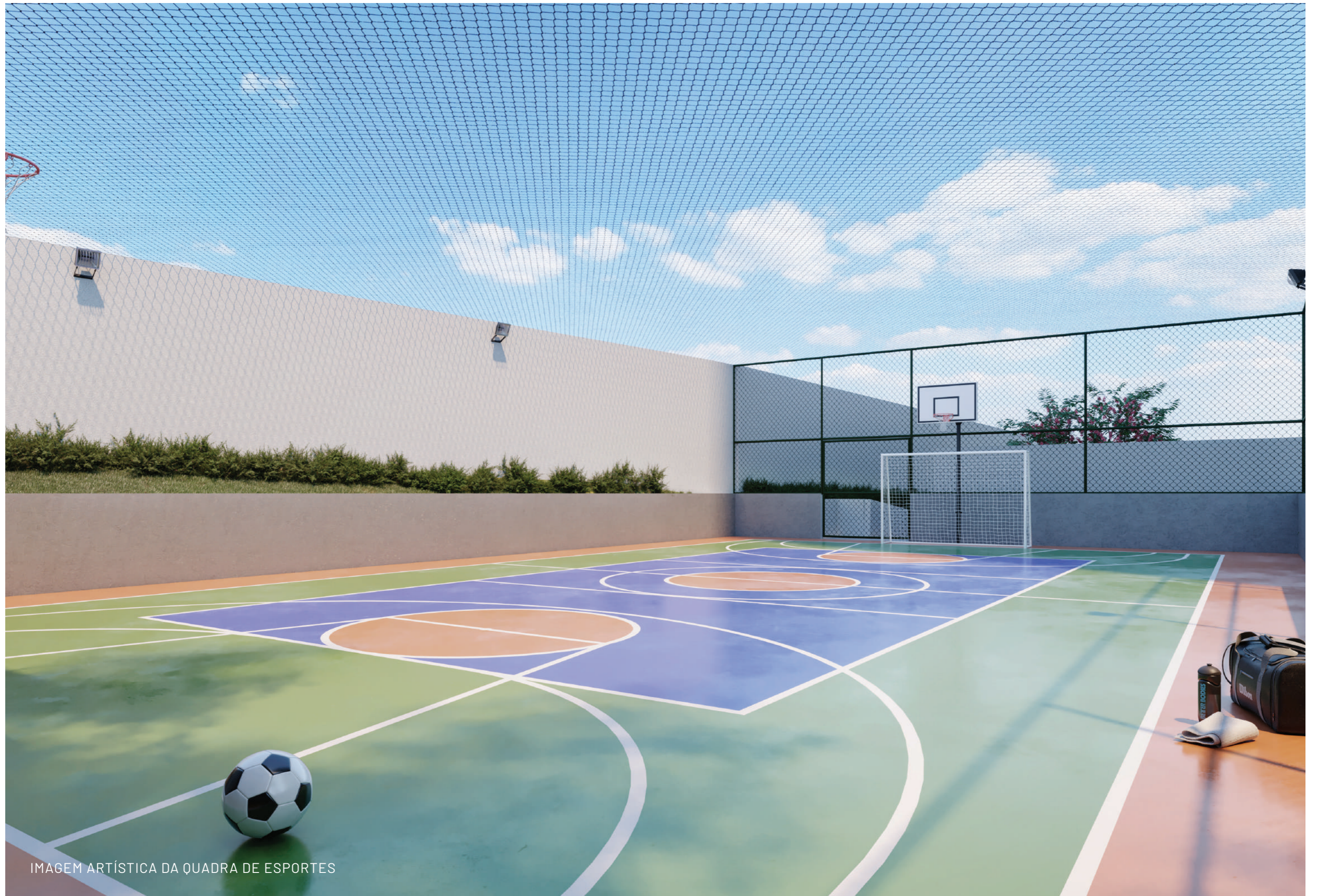
IMAGEM ARTÍSTICA DA QUADRA DE ESPORTES