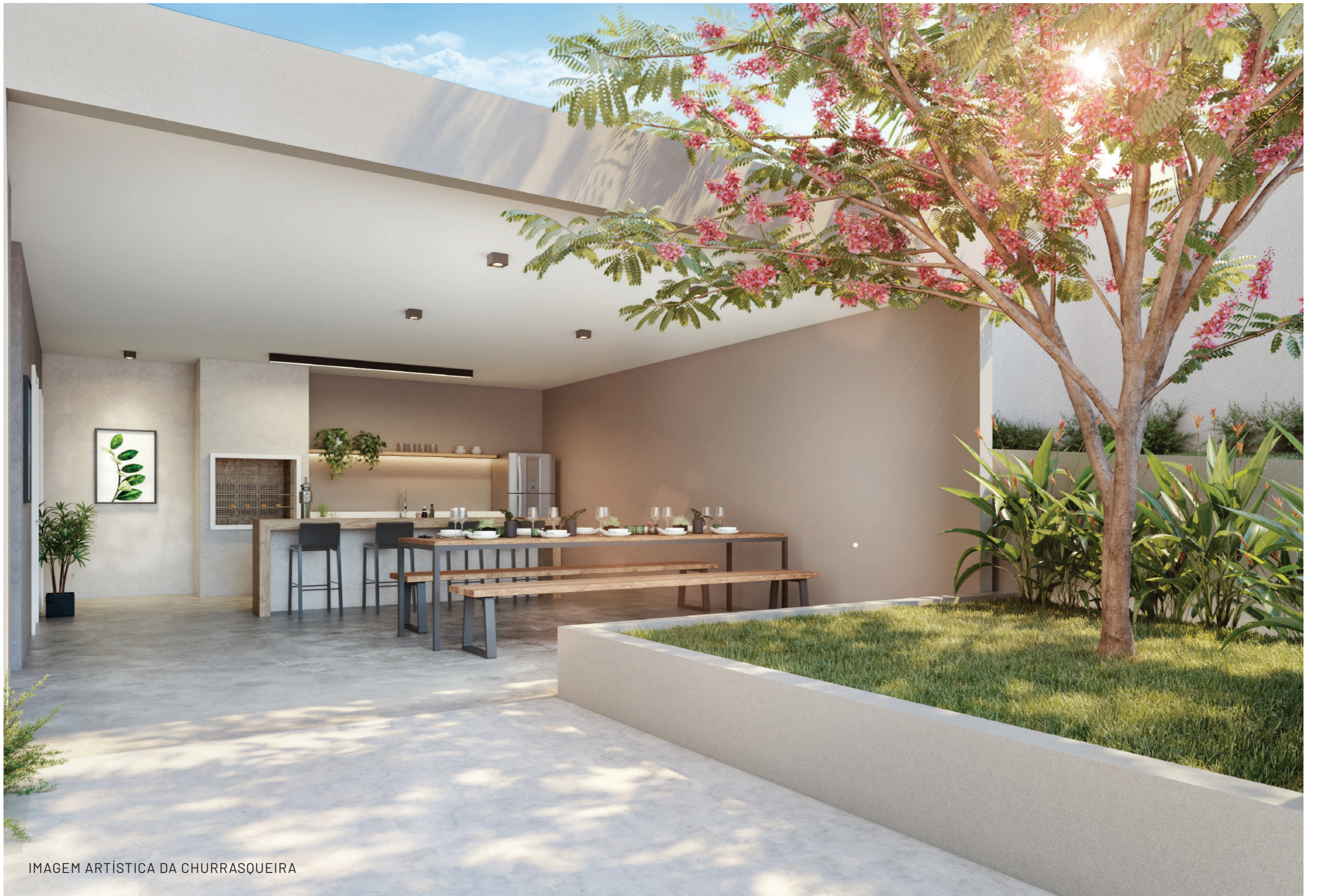
IMAGEM ARTÍSTICA DA CHURRASQUEIRA