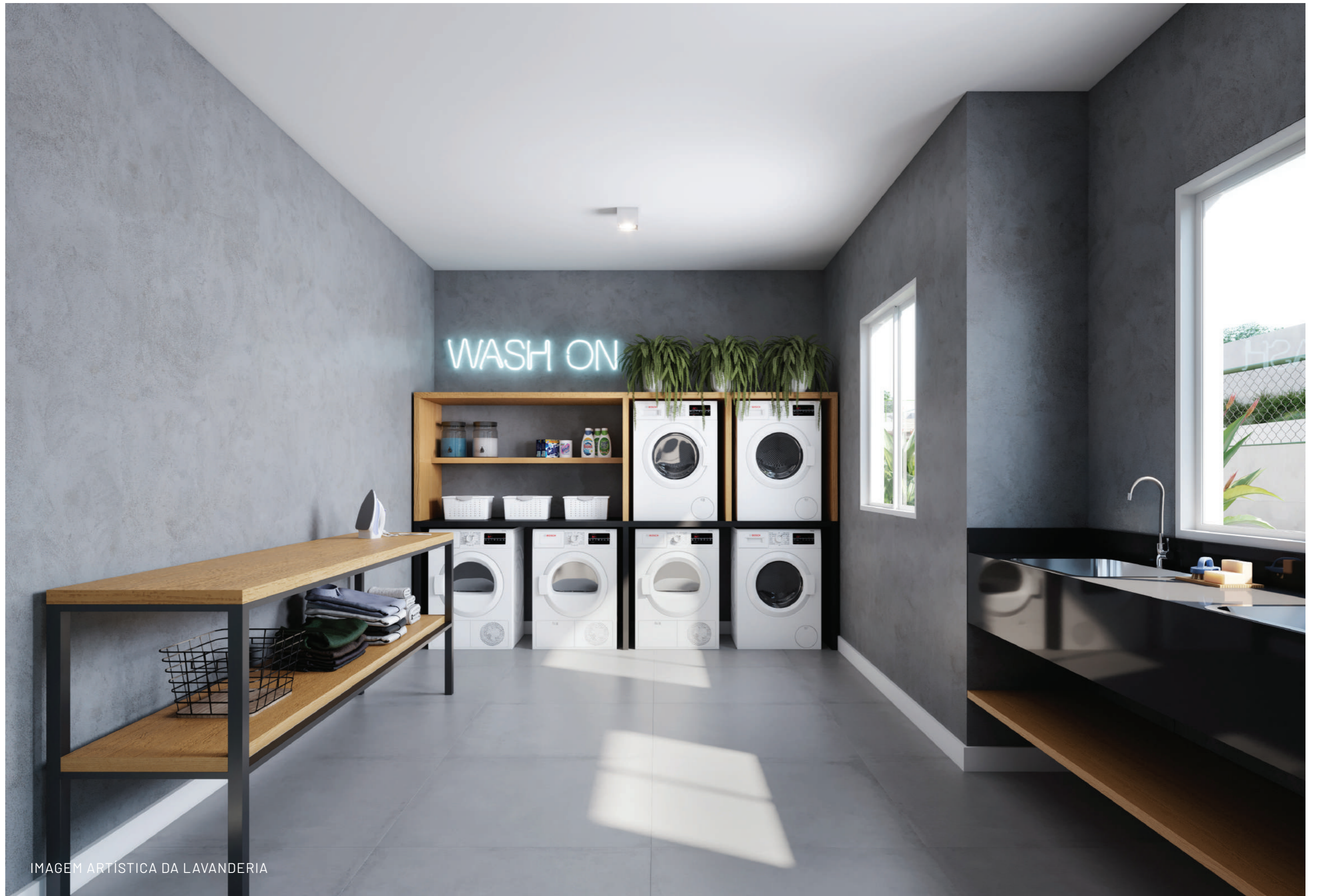
IMAGEM ARTÍSTICA DA LAVANDERIA