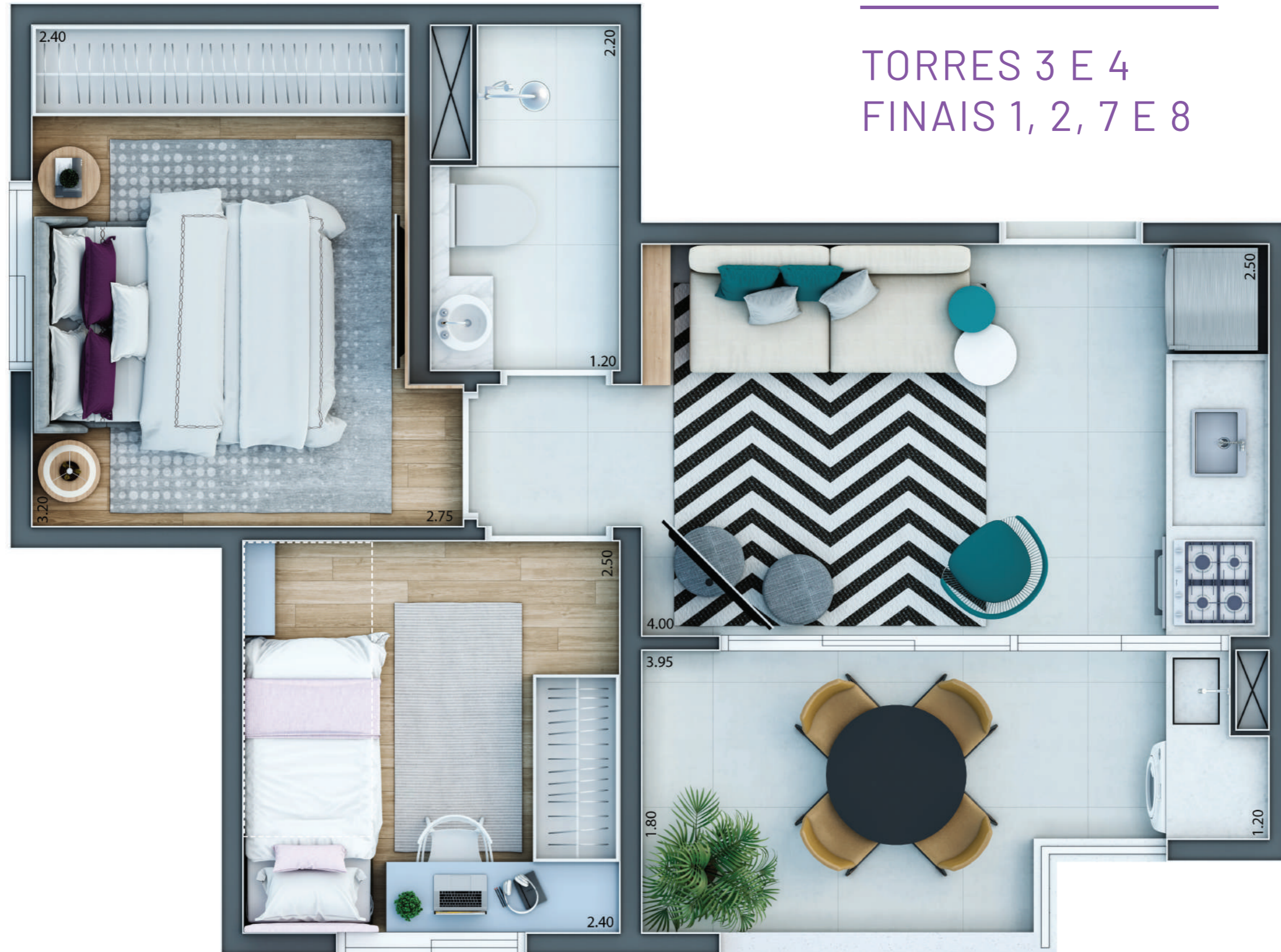
PLANTA ILUSTRADA DO APARTAMENTO DE 38,87 M 2 PRIVATIVOS, FINAIS 1, 2, 7 E 8. TÉRREO AO 21º PAVIMENTO - REFERENTE AS TORRES 3 E 4, COM SUGESTÃO DE DECORAÇÃO.