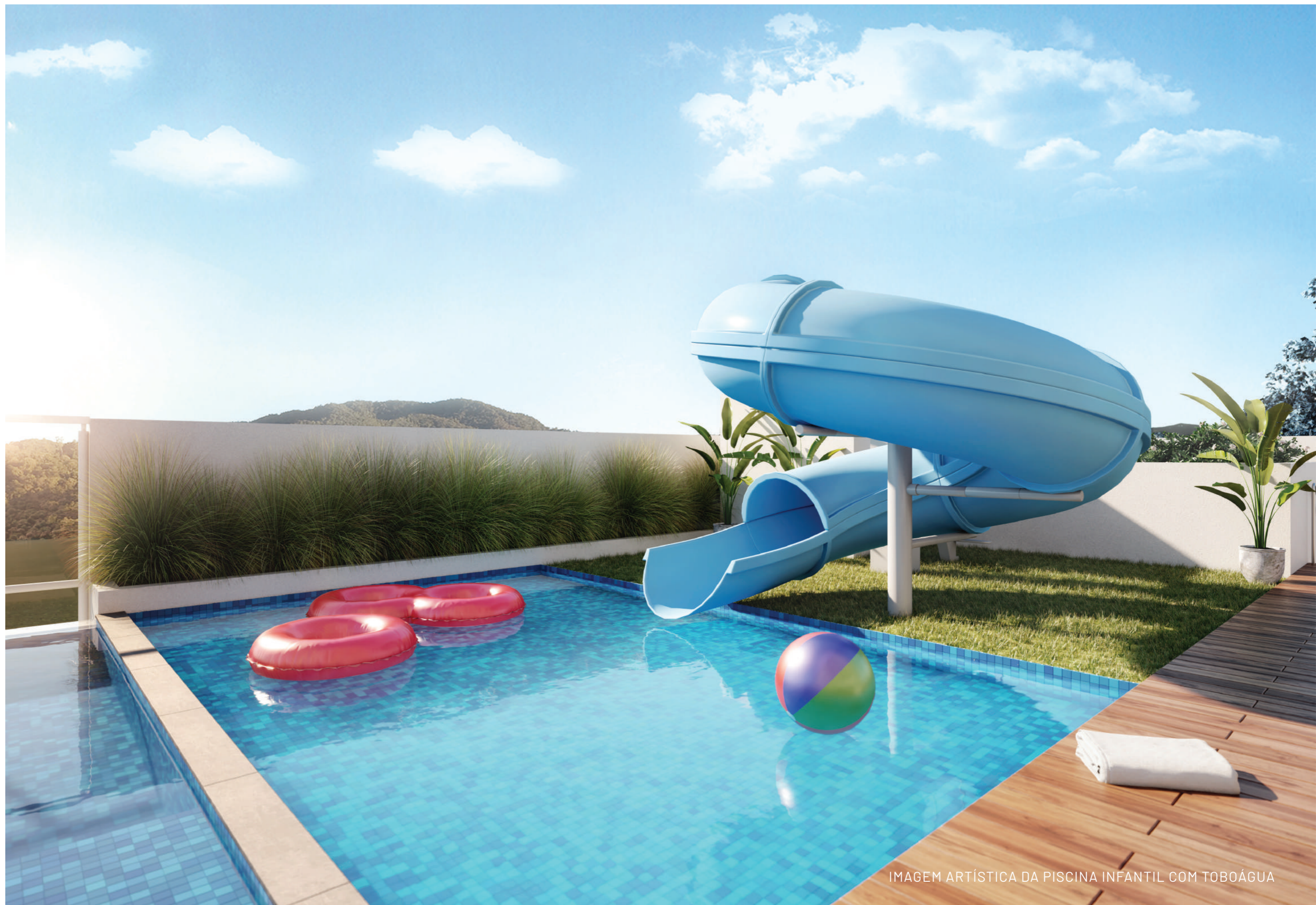
IMAGEM ARTÍSTICA DA PISCINA INFANTIL COM TOBOÁGUA