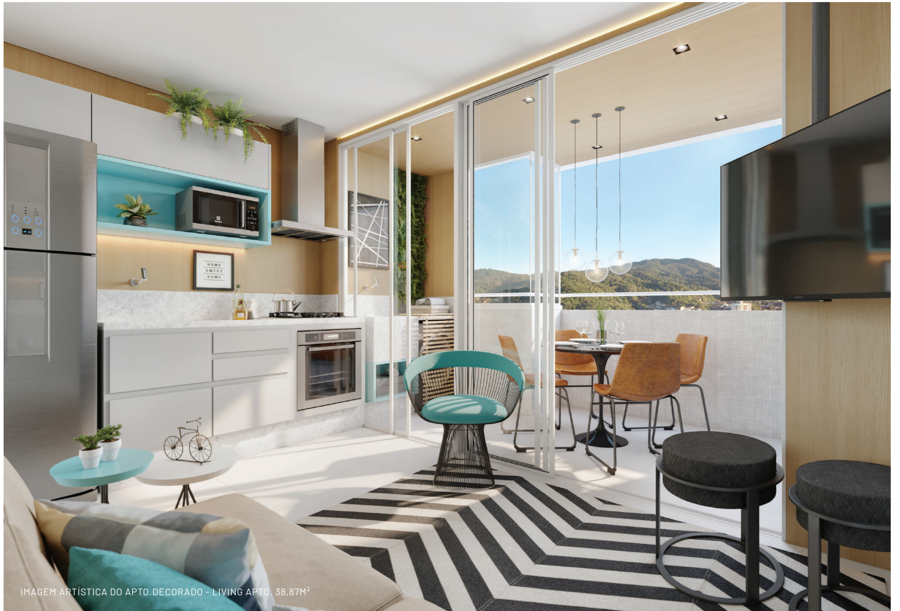
IMAGEM ARTÍSTICA DO APTO.DECORADO - LIVING APTO. 38,87M 2