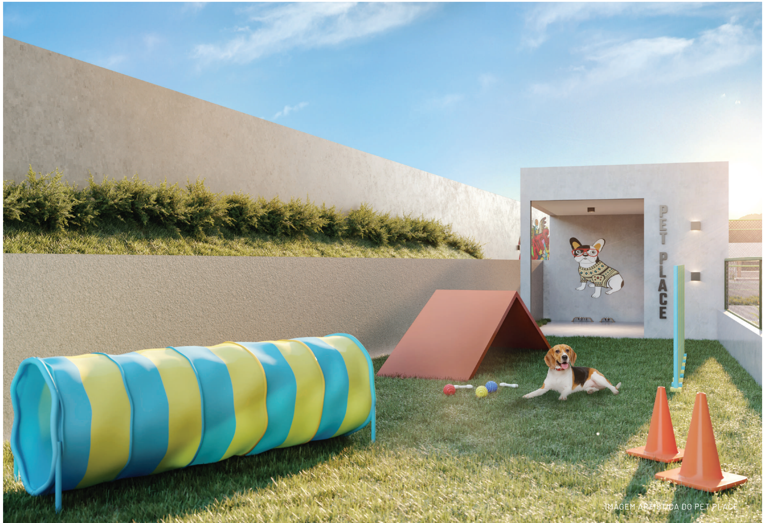
IMAGEM ARTÍSTICA DO PET PLACE