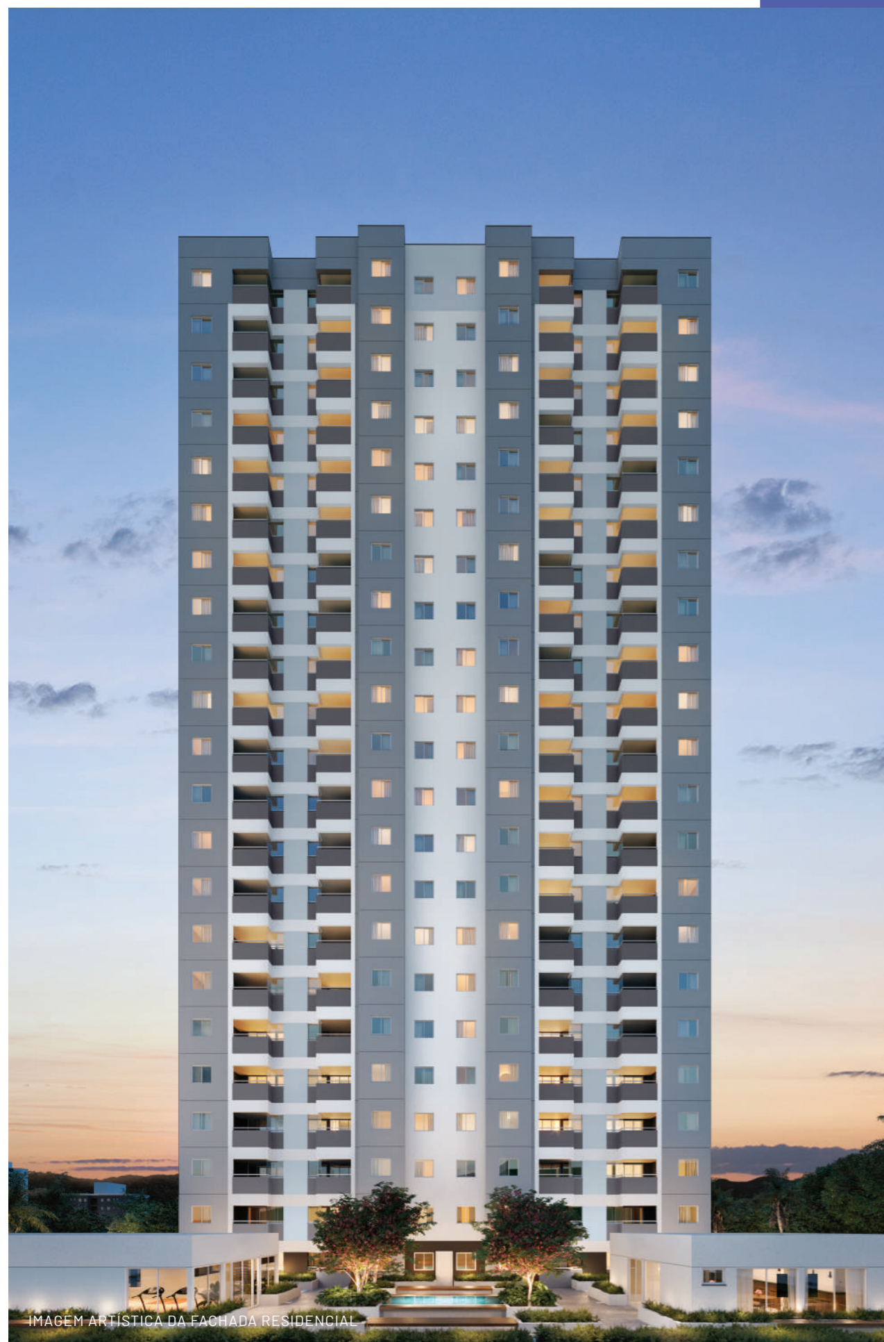
IMAGEM ARTÍSTICA DA FACHADA RESIDENCIAL