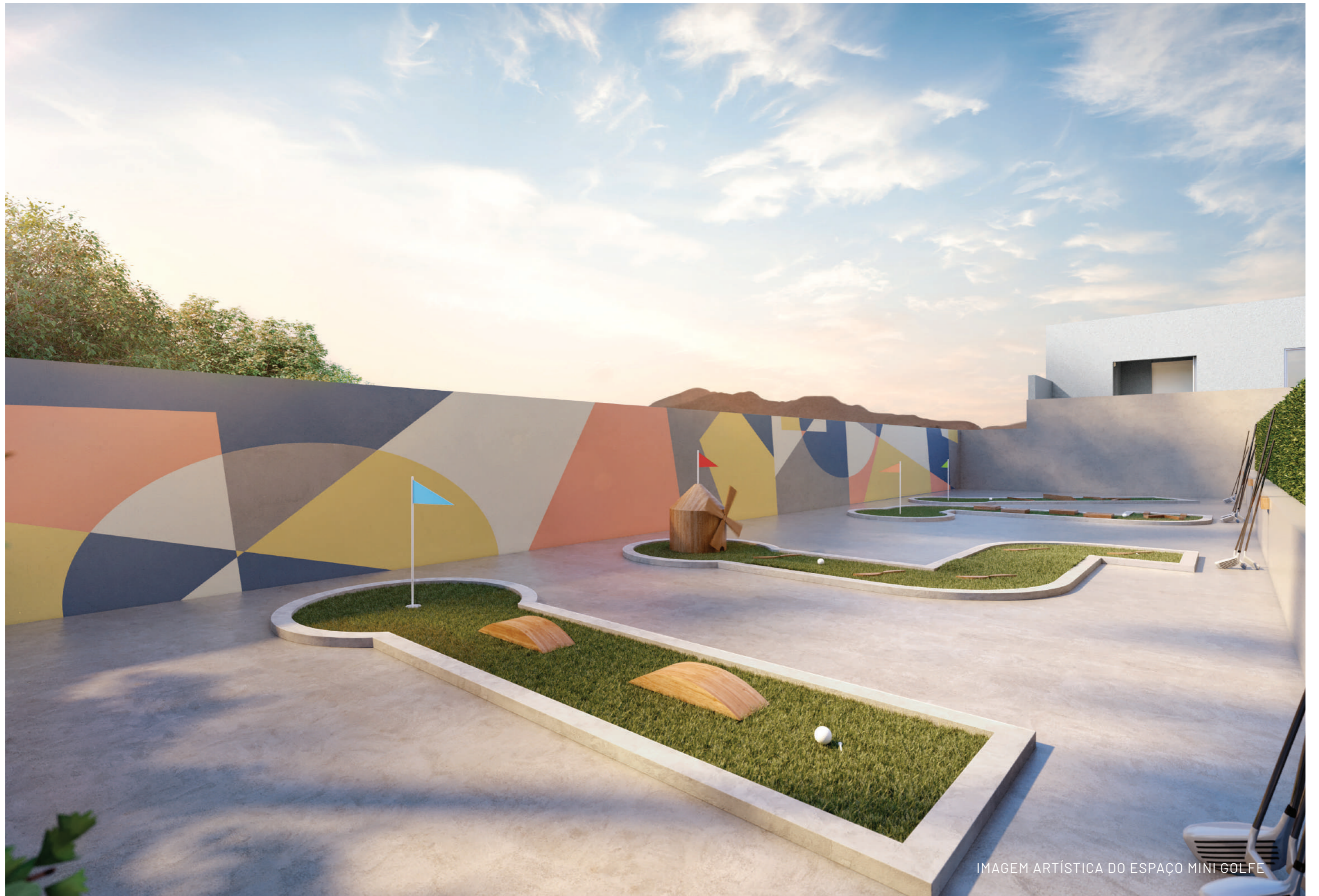
IMAGEM ARTÍSTICA DO ESPAÇO MINI GOLFE