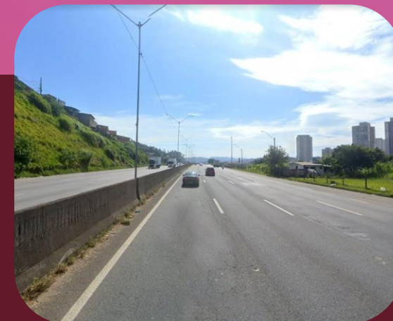
Rod. Fernão Dias