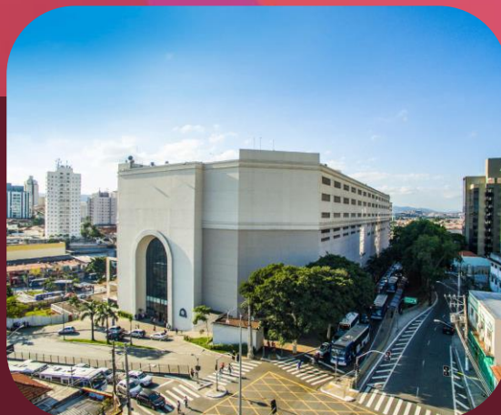
Shopping Metrô Tucuruvi