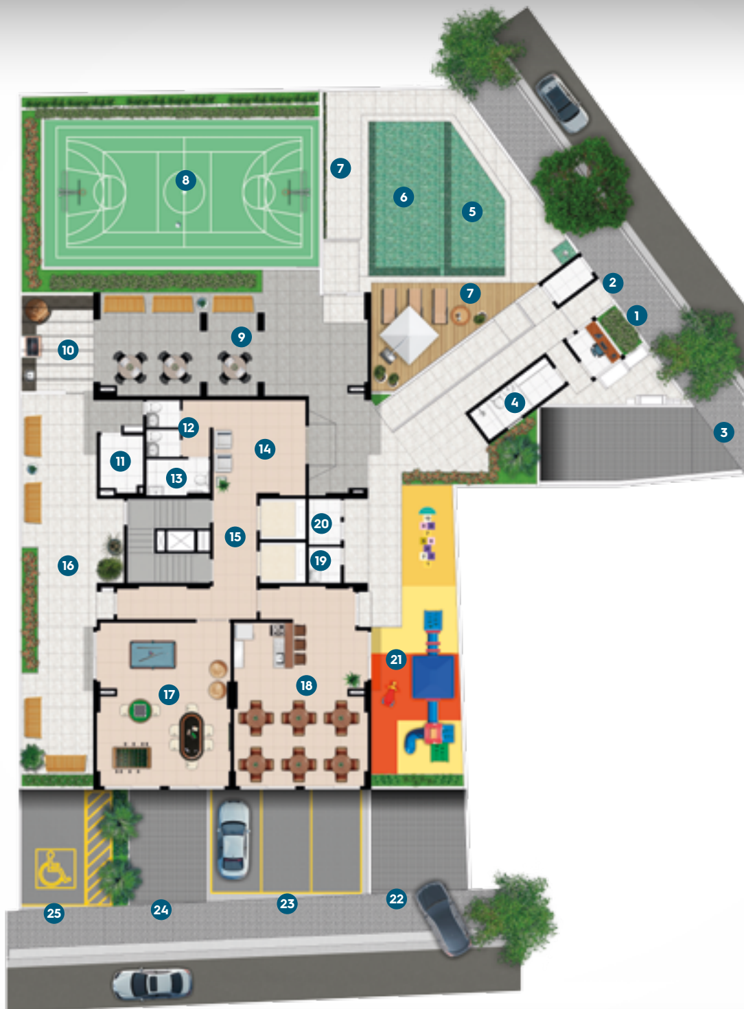
PERSPECTIVA ARTÍSTICA DA IMPLANTAÇÃO