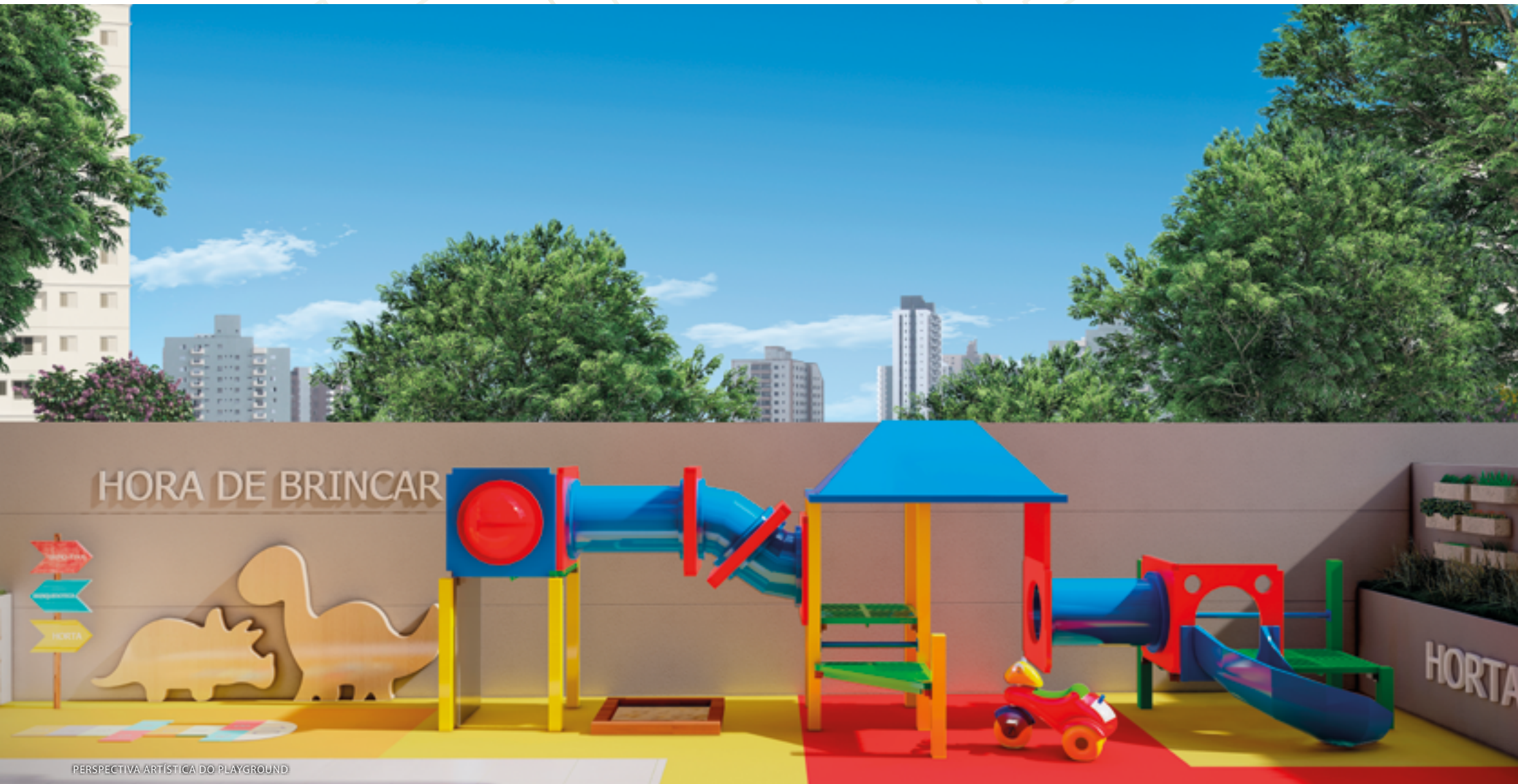
PERSPECTIVA ARTÍSTICA DO PLAYGROUND