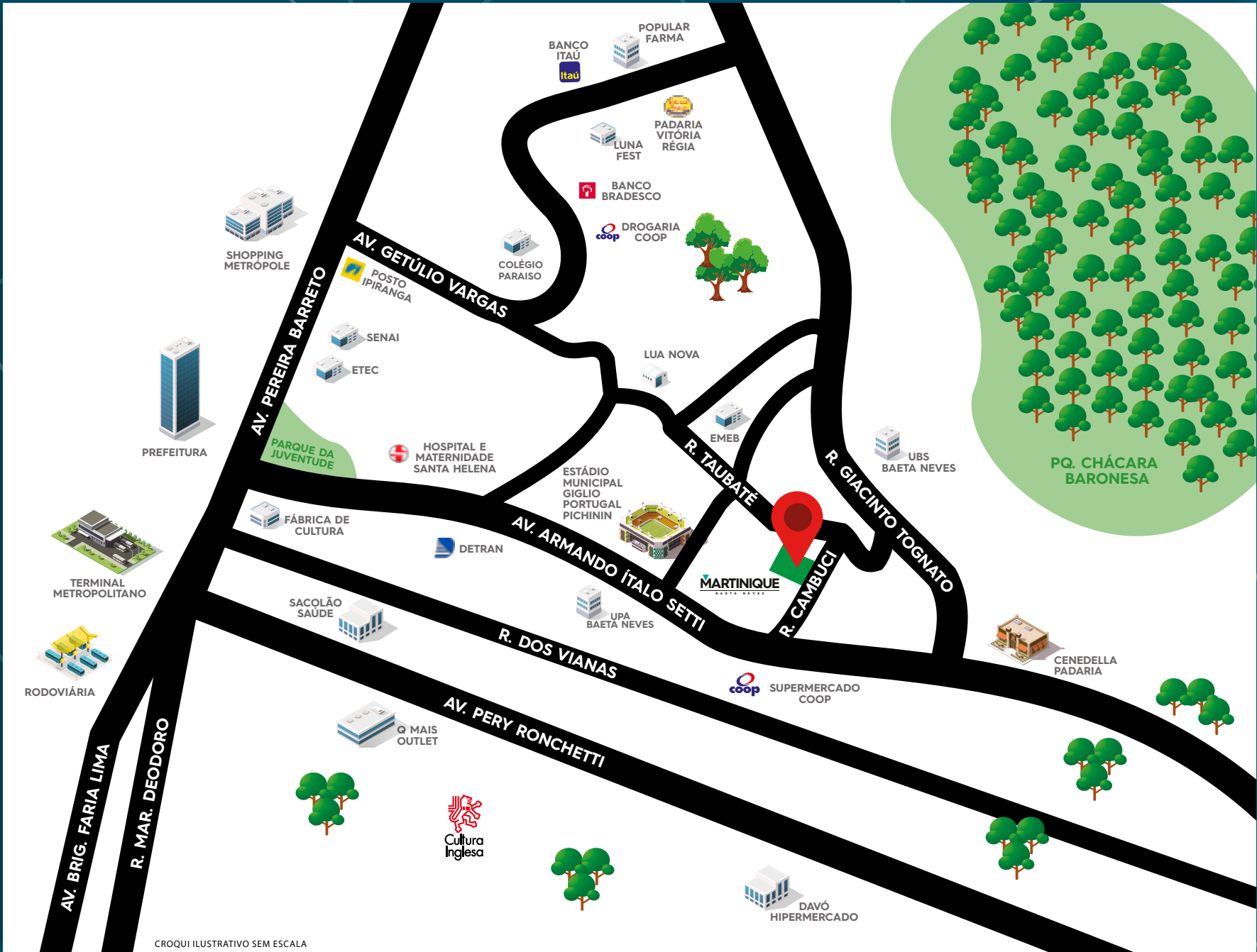
CROQUI ILUSTRATIVO SEM ESCALA