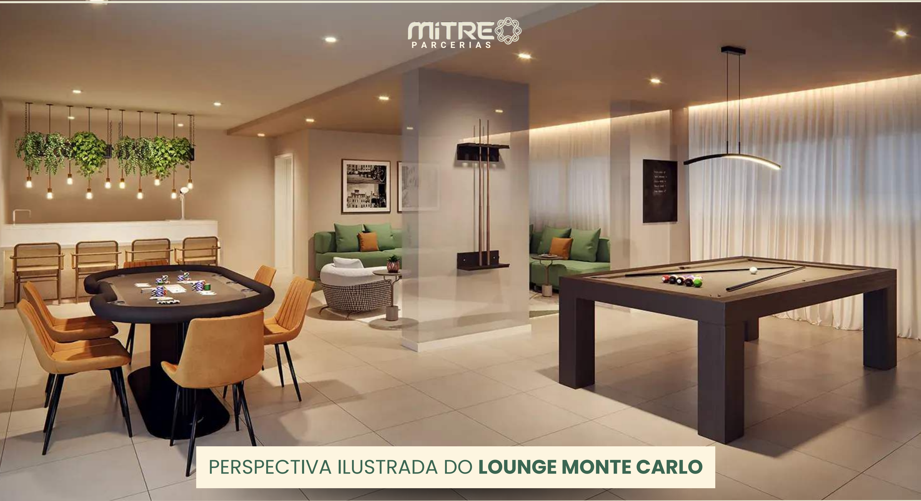
PERSPECTIVA ILUSTRADA DO LOUNGE MONTE CARLO