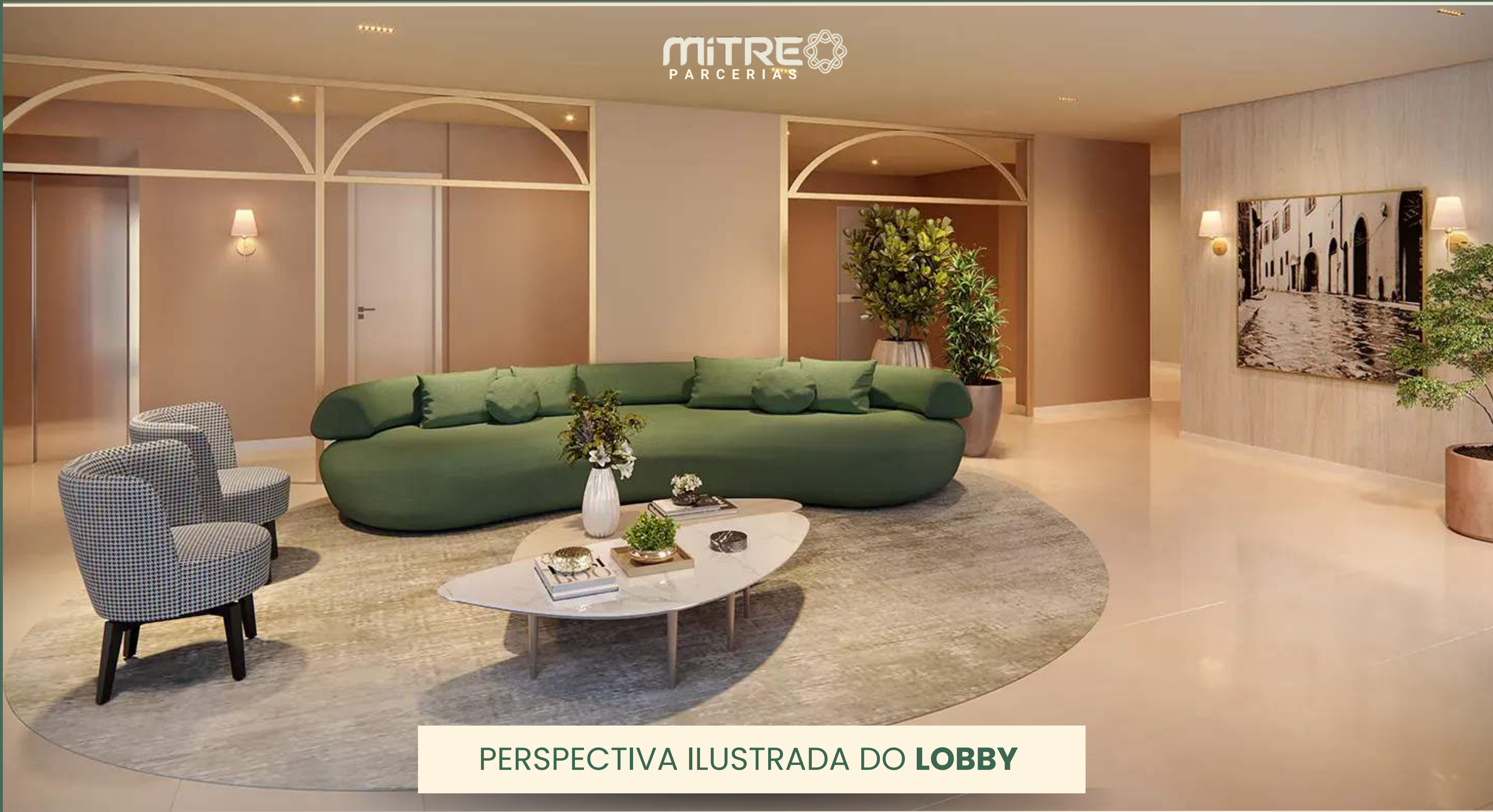
PERSPECTIVA ILUSTRADA DO LOBBY