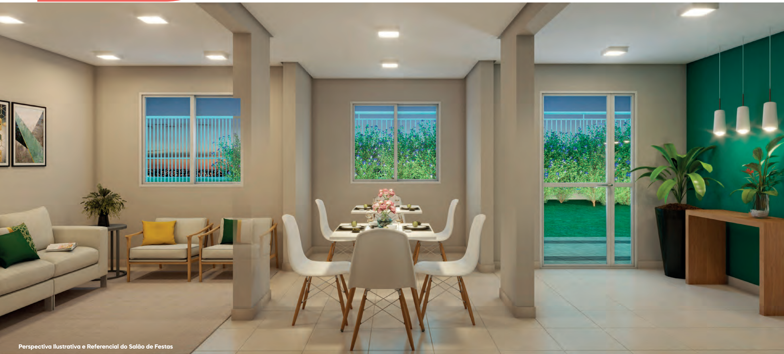
Perspectiva Ilustrativa e Referencial do Salão de Festas