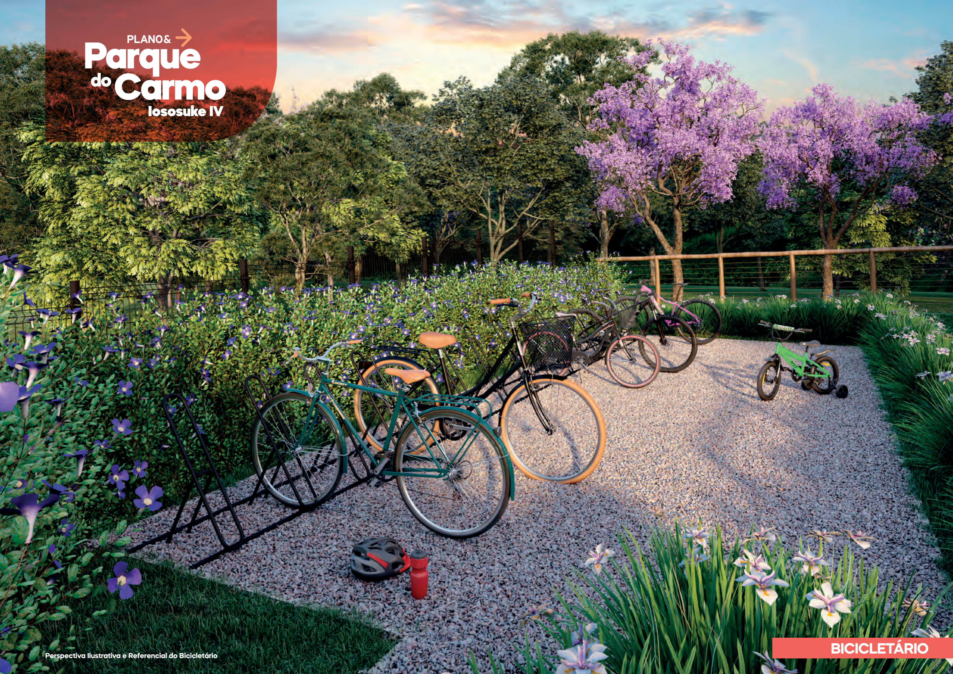
Perspectiva Ilustrativa e Referencial do Bicicletário