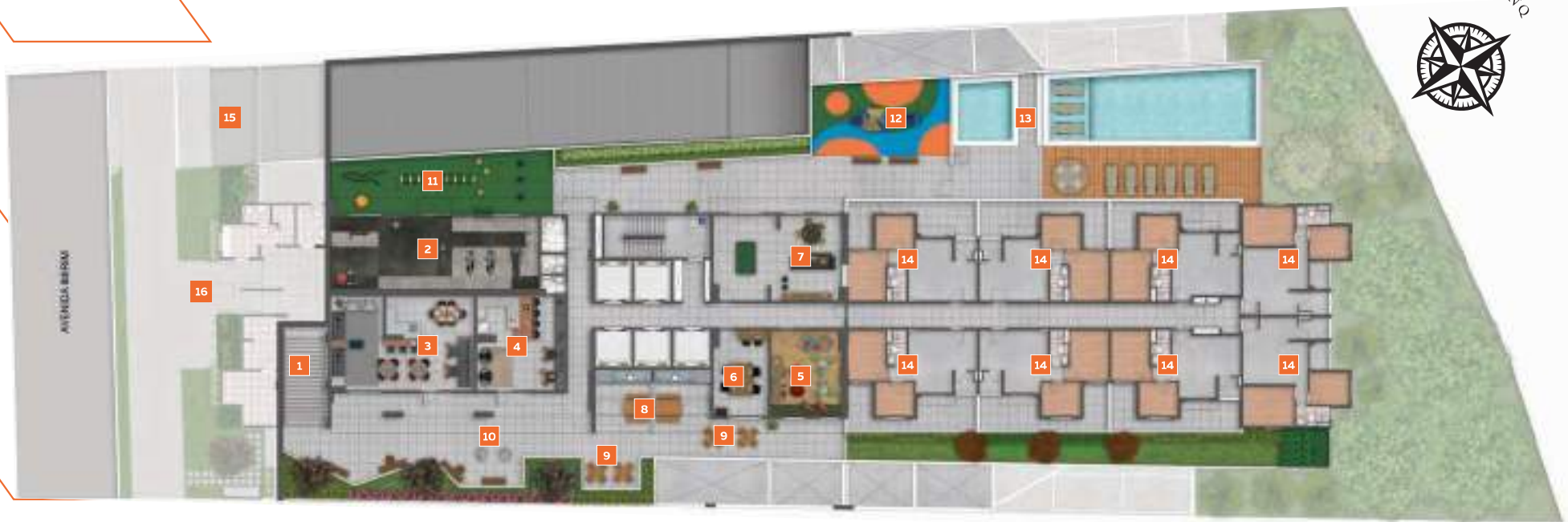
PERSPECTIVA ILUSTRADA DA IMPLANTAÇÃO DO LAZER NO 1º SUBSOLO.