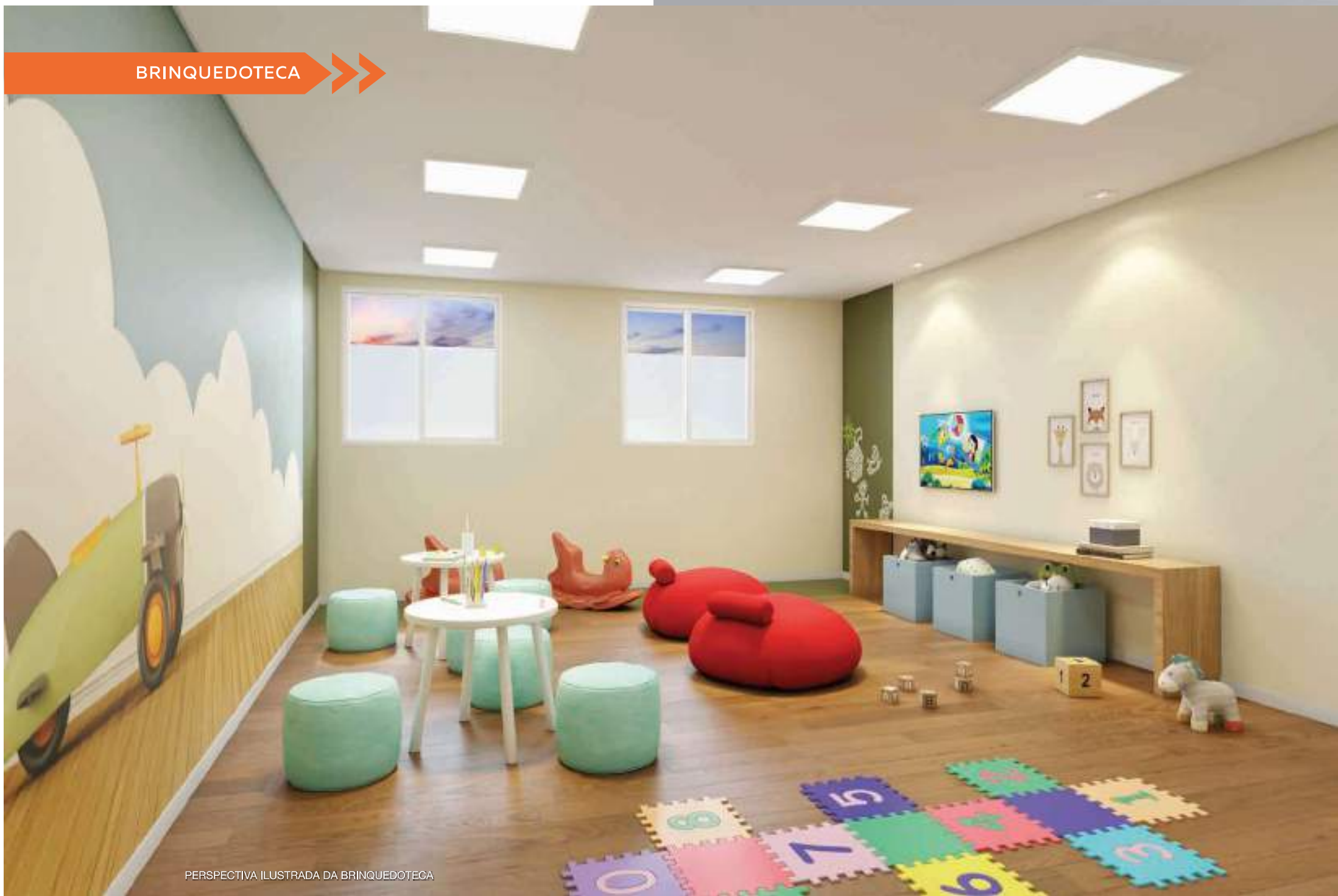
PERSPECTIVA ILUSTRADA DA BRINQUEDOTECA