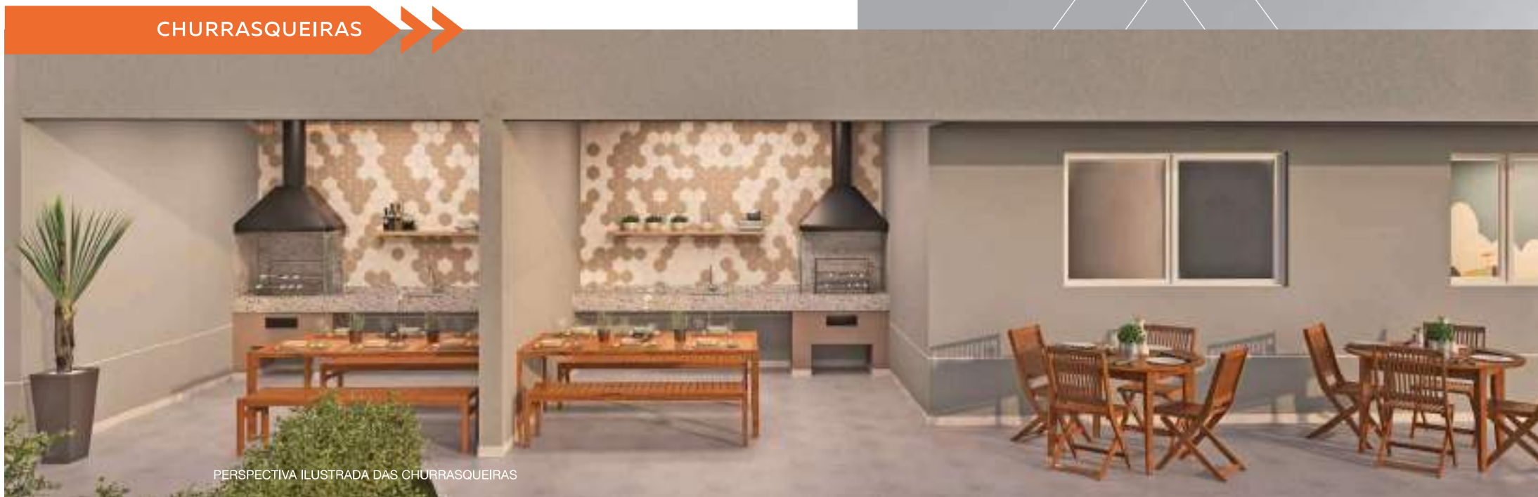
PERSPECTIVA ILUSTRADA DAS CHURRASQUEIRAS