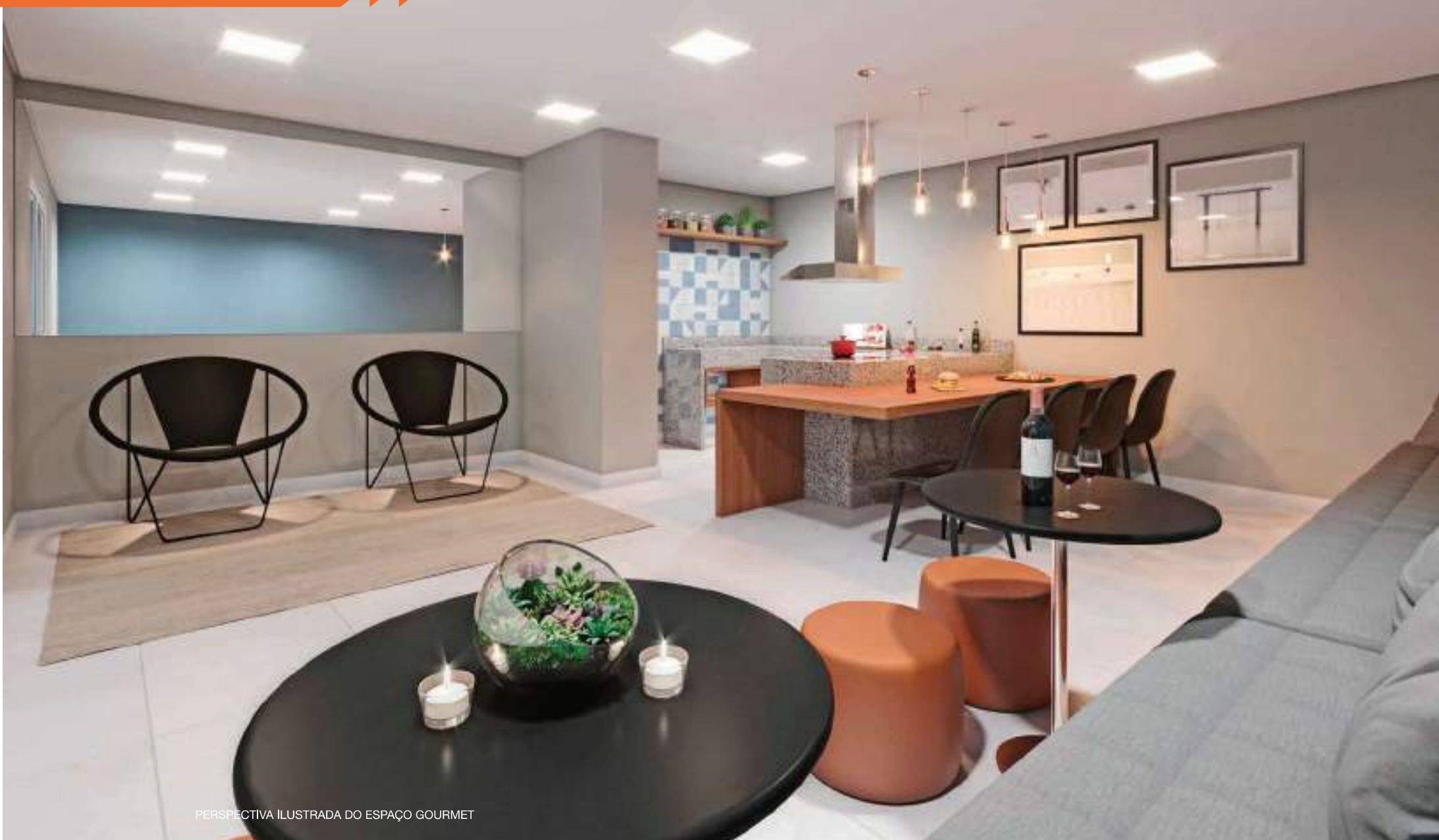
PERSPECTIVA ILUSTRADA DO ESPAÇO GOURMET