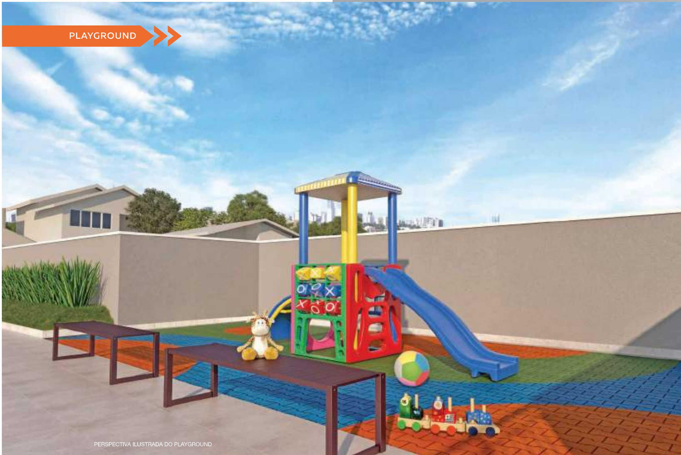
PERSPECTIVA ILUSTRADA DO PLAYGROUND