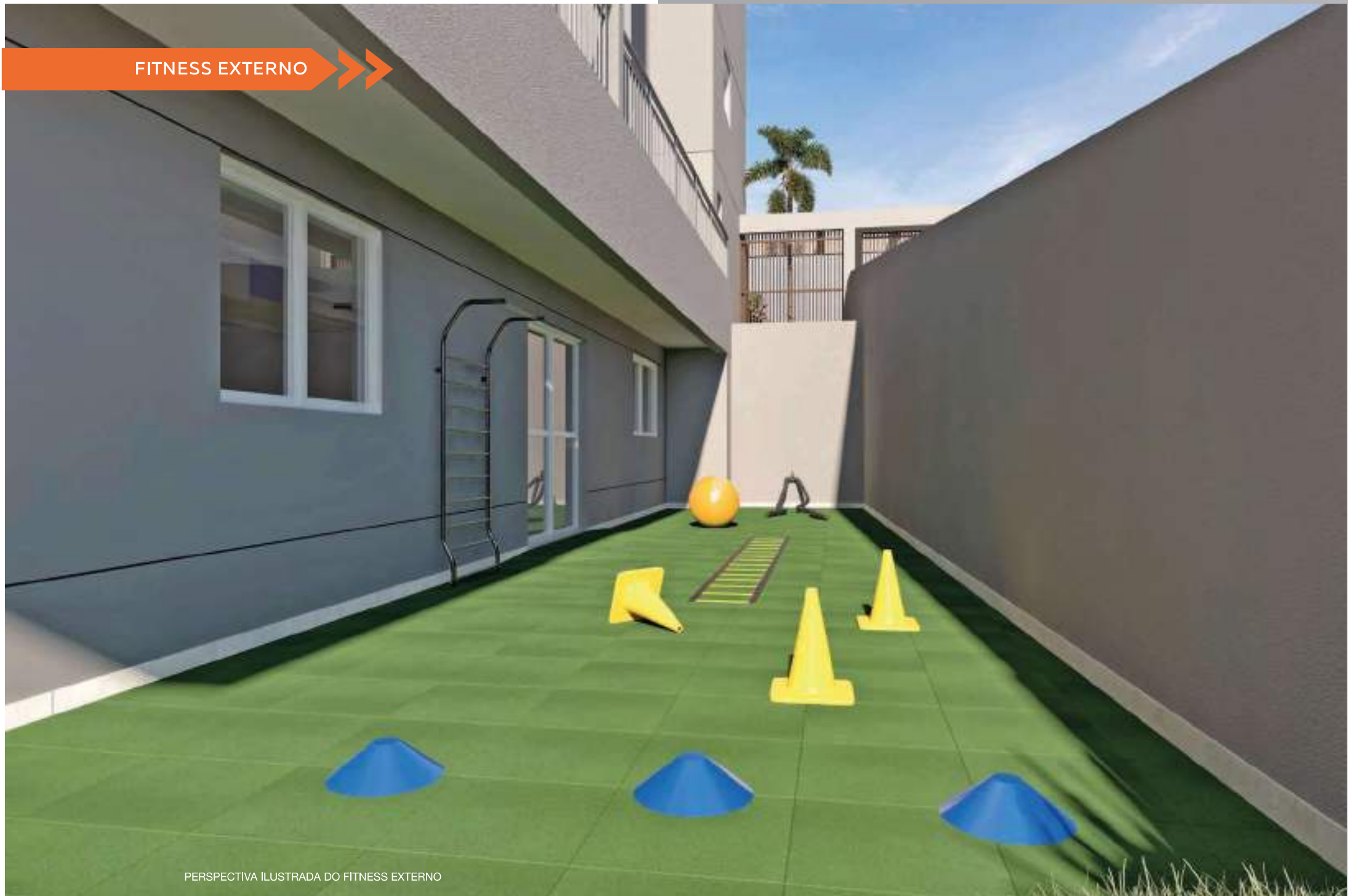
PERSPECTIVA ILUSTRADA DO FITNESS EXTERNO