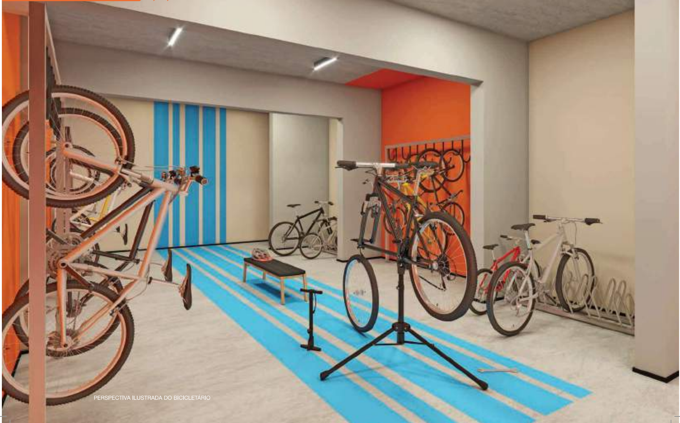
PERSPECTIVA ILUSTRADA DO BICICLETÁRIO