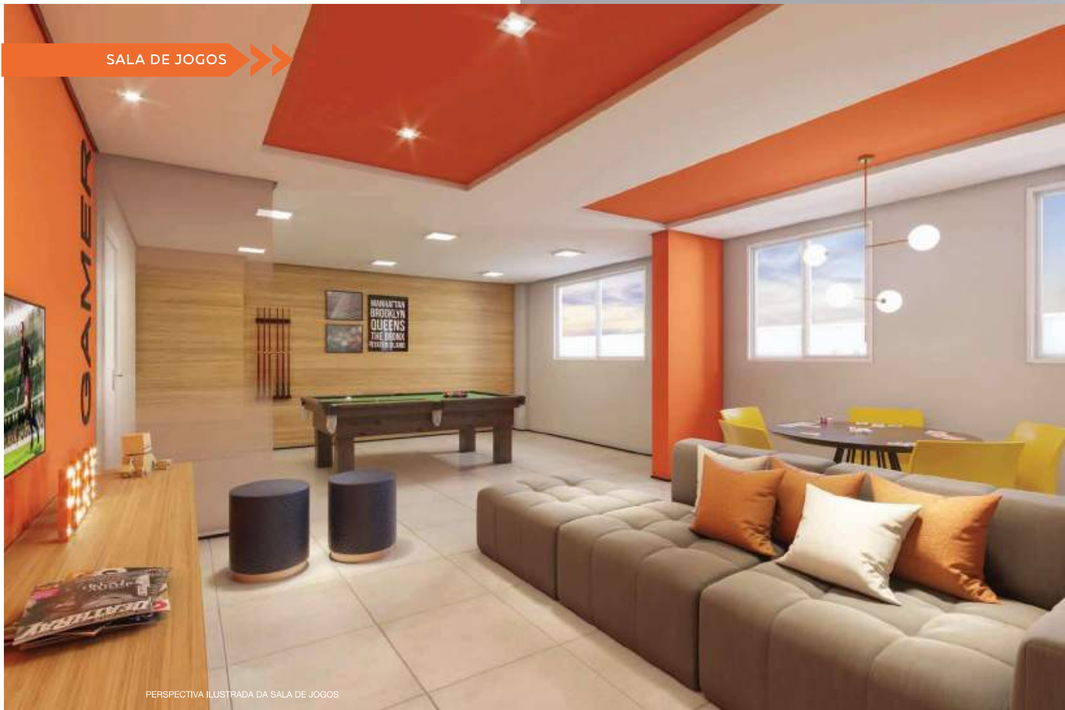
PERSPECTIVA ILUSTRADA DA SALA DE JOGOS