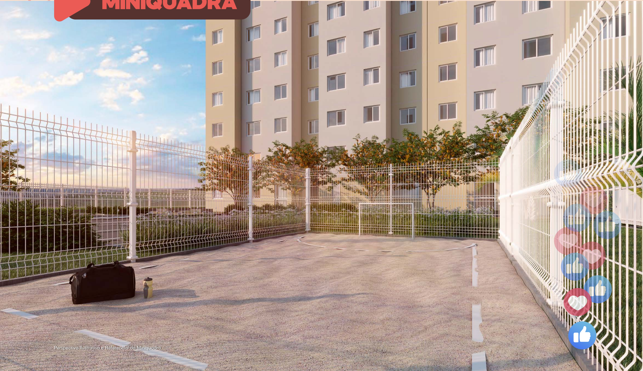
Perspectiva Ilustrativa e Referencial da Miniquadra