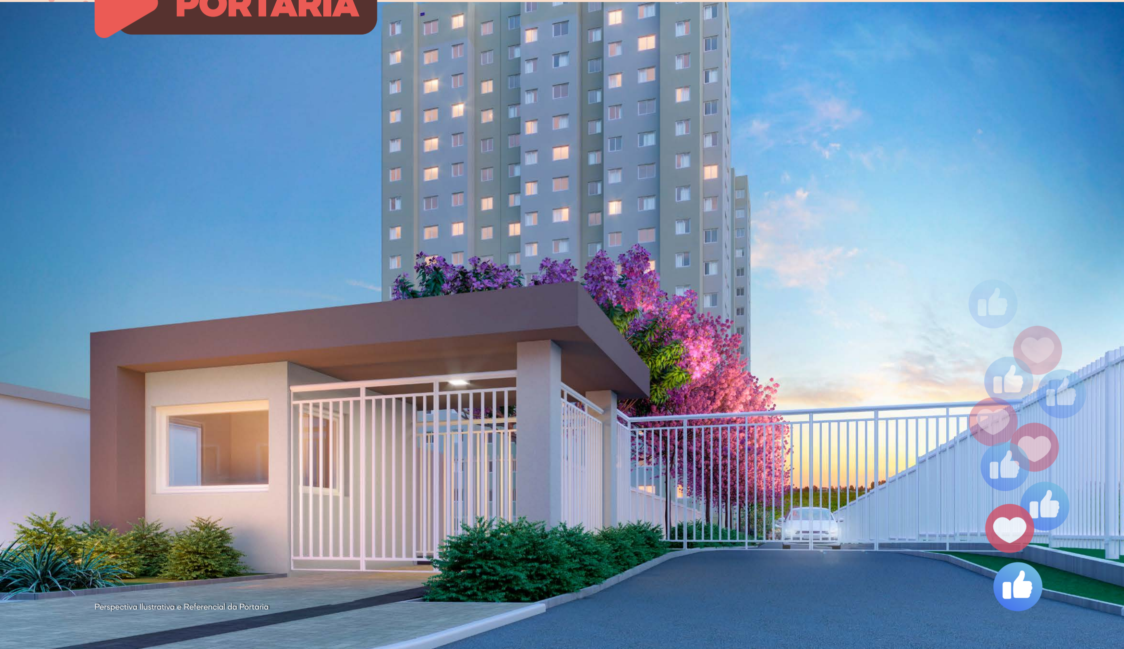
Perspectiva Ilustrativa e Referencial da Portaria