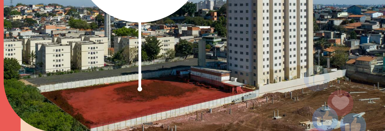
Foto Aérea do Empreendimento