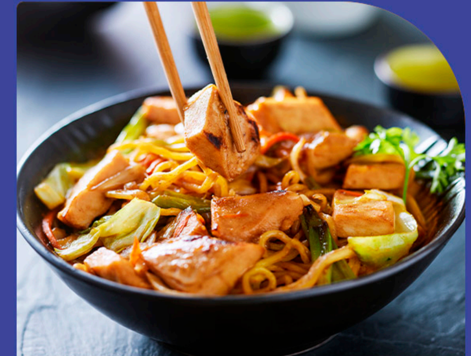
China Lins Restaurante Asiático 13 minutos a pé