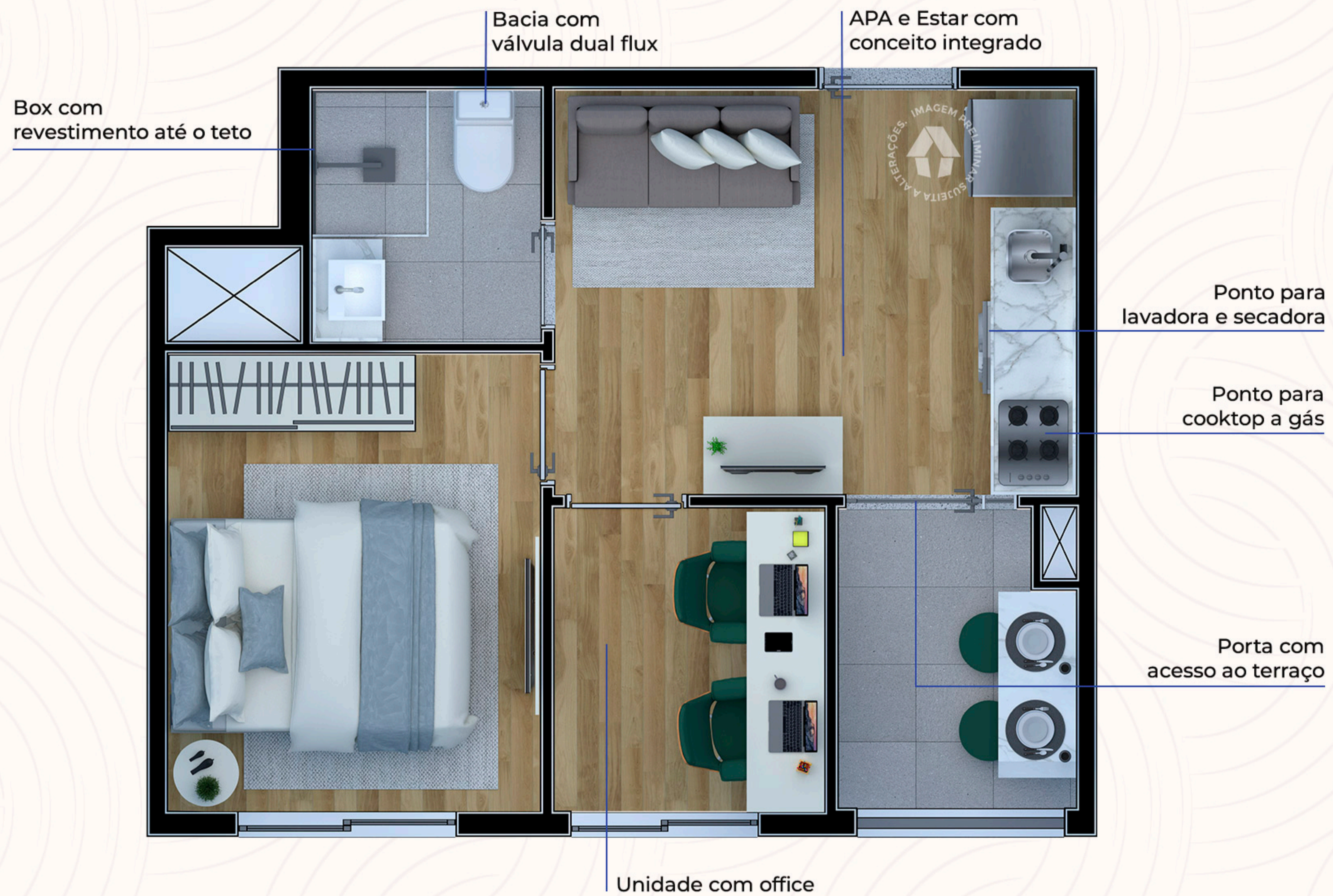
Ilustração artística da planta com sugestão de decoração. Os móveis, utensílios, adornos e equipamentos não fazem parte do contrato de venda e compra. Acabamentos e revestimentos serão entregues conforme memorial descritivo específico. Esta planta poderá sofrer variações decorrentes do atendimento de postura de órgãos públicos e concessionárias.