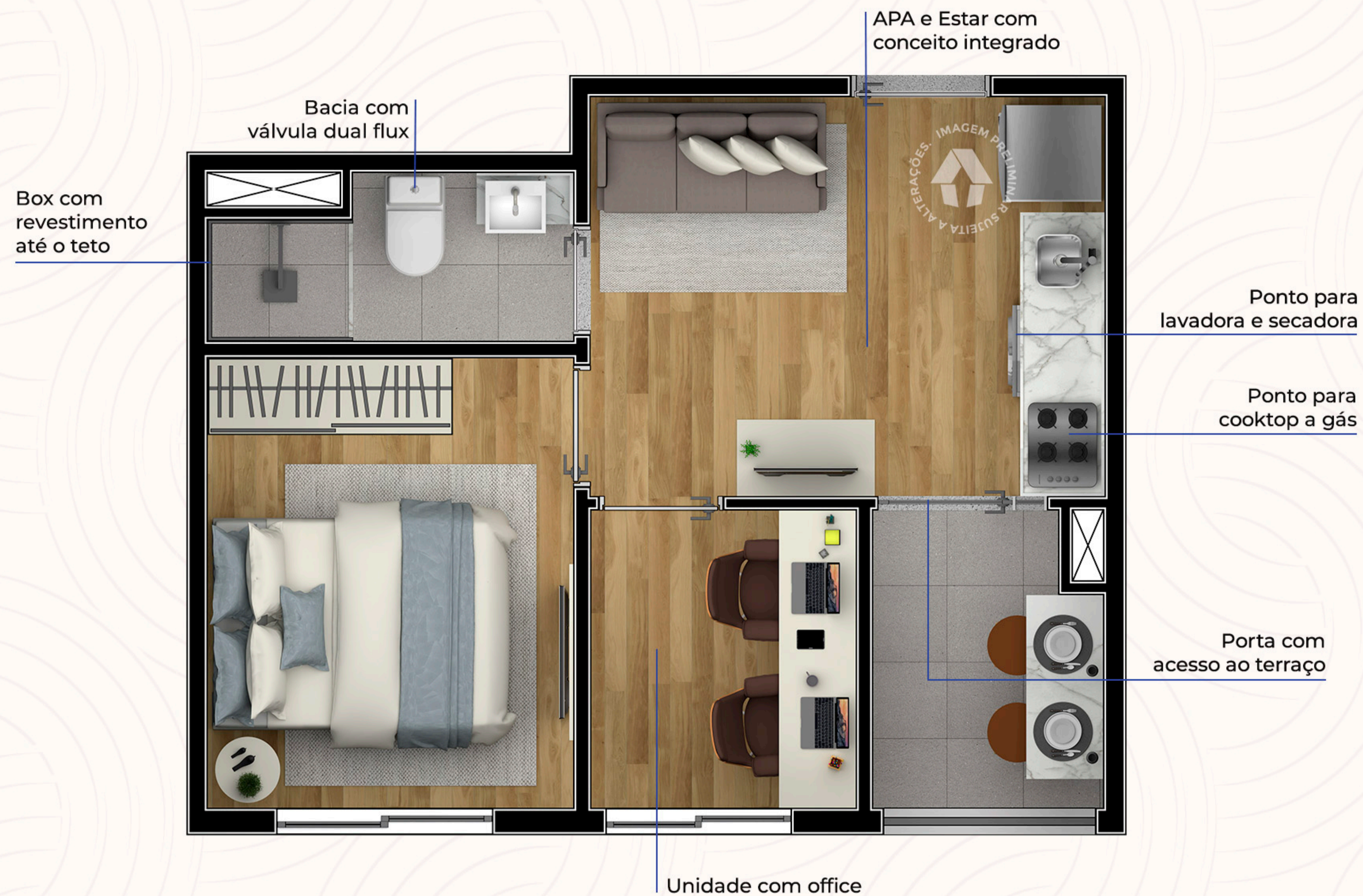
Ilustração artística da planta com sugestão de decoração. Os móveis, utensílios, adornos e equipamentos não fazem parte do contrato de venda e compra. Acabamentos e revestimentos serão entregues conforme memorial descritivo específico. Esta planta poderá sofrer variações decorrentes do atendimento de postura de órgãos públicos e concessionárias.