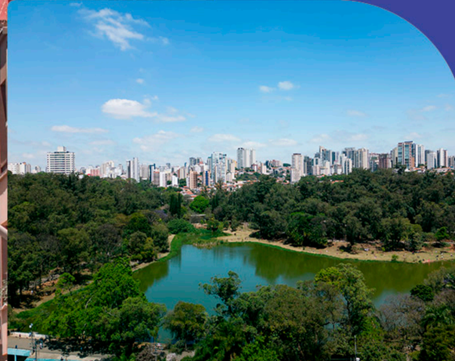
Parque Aclimação 18 minutos a pé