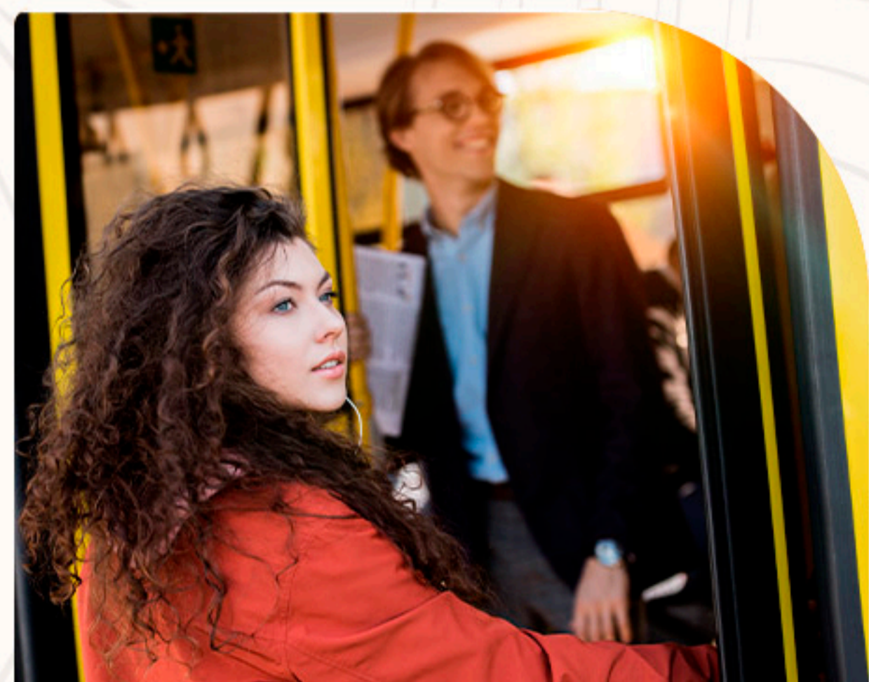
Ponto de ônibus - Rua Independência 1 minuto a pé