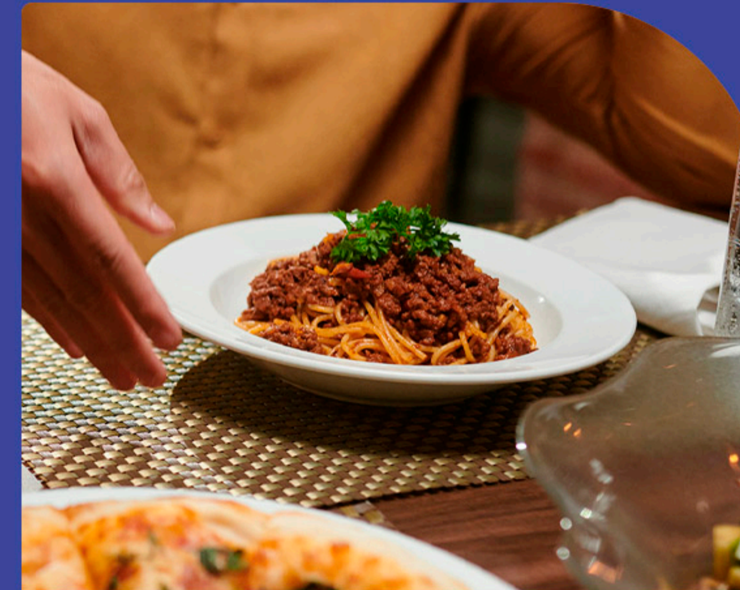
Cantina 1020 Restaurante Italiano 11 minutos a pé