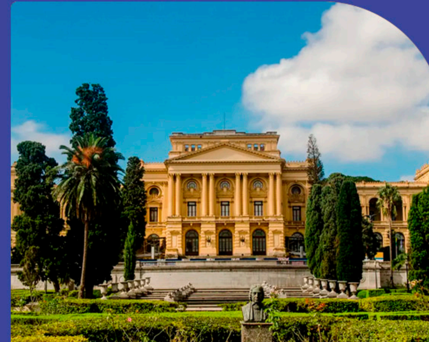
Museu do Ipiranga 12 minutos de bike