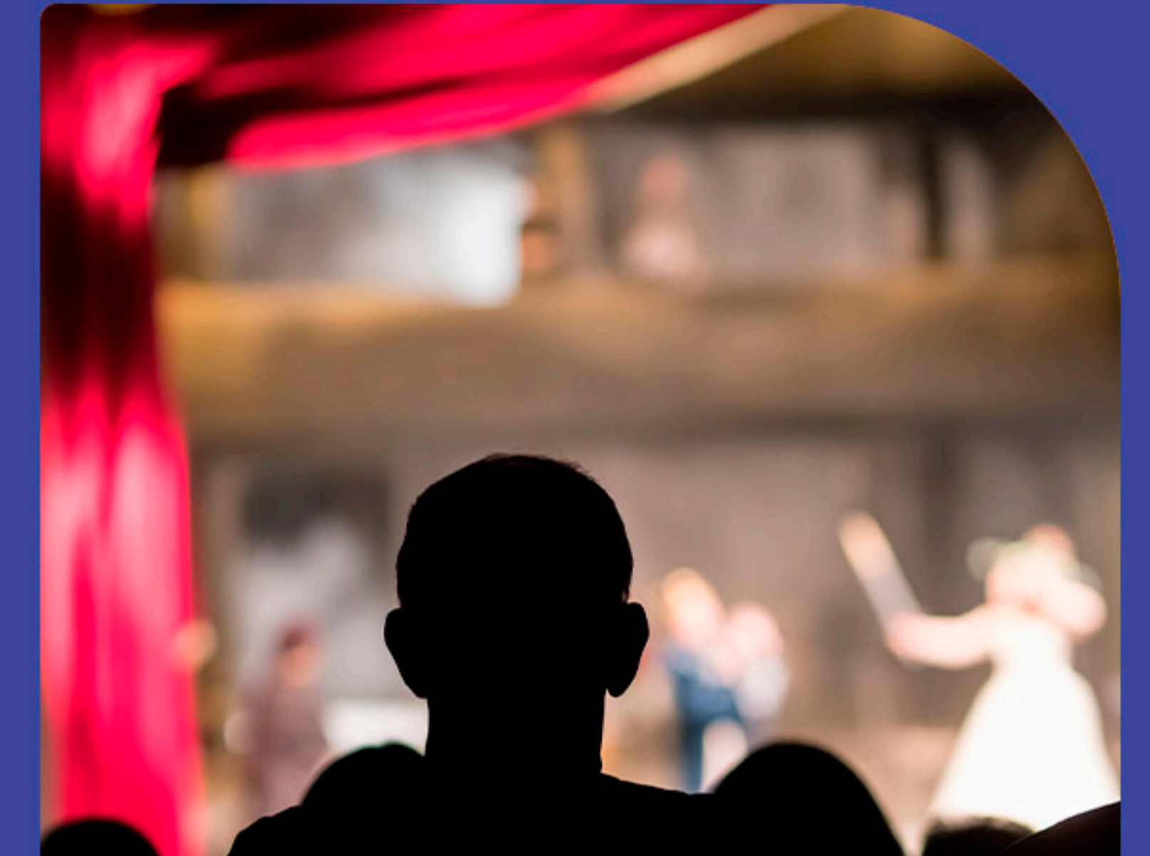
Teatro Liberdade 15 minutos de bike

Diversão e entretenimento sem precisar ir muito longe!