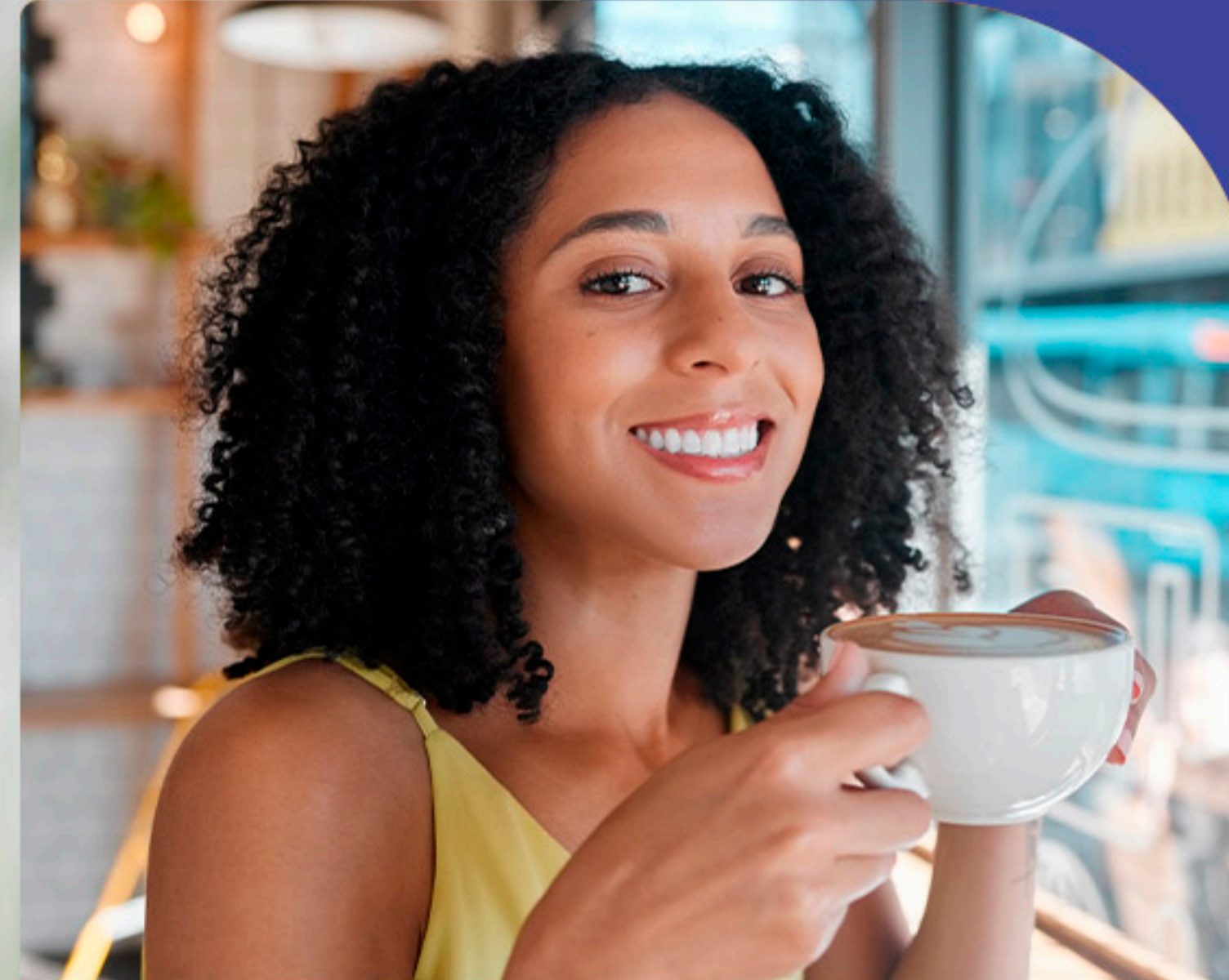
Fio de Azeite Restaurante e Cafeteria 5 minutos a pé