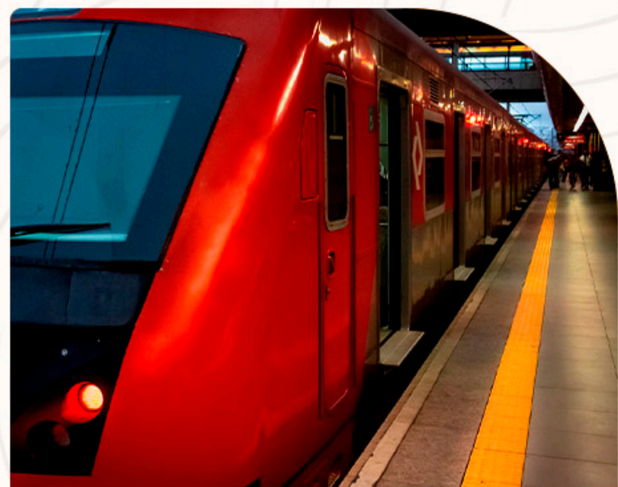
Estação Juventus-Mooça Linha 10-Turquesa 9 minutos de bike

Viver na região central possibilita aproveitar ao máximo a cidade de São Paulo, chegando a qualquer lugar em poucos minutos.