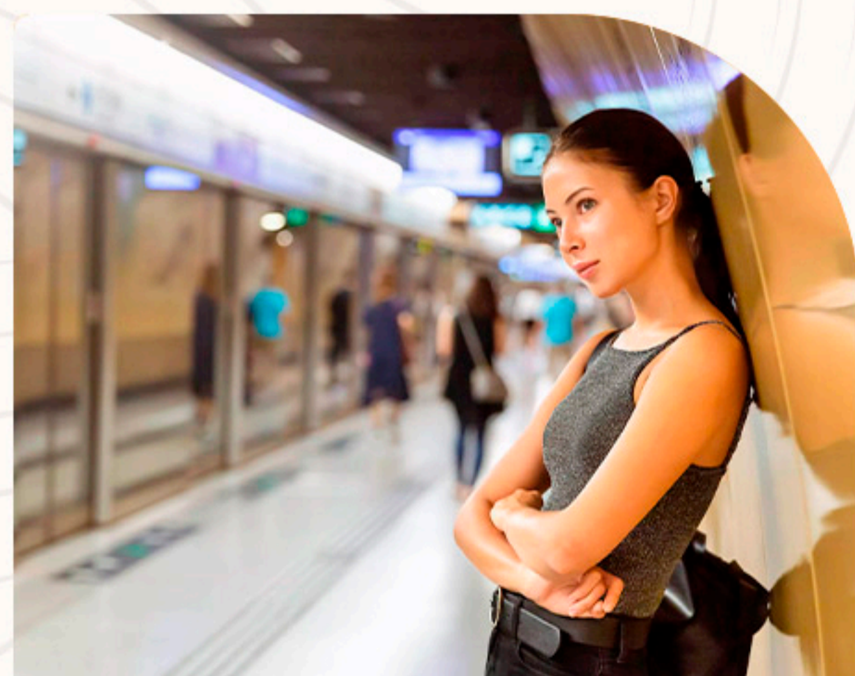
Estação Chácara Klabin Linha 5-Lilás 20 minutos de bike