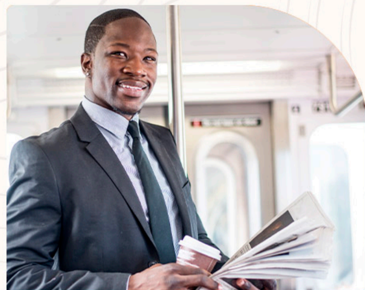
Estação Ipiranga Linha 10-Turquesa 15 minutos de bike