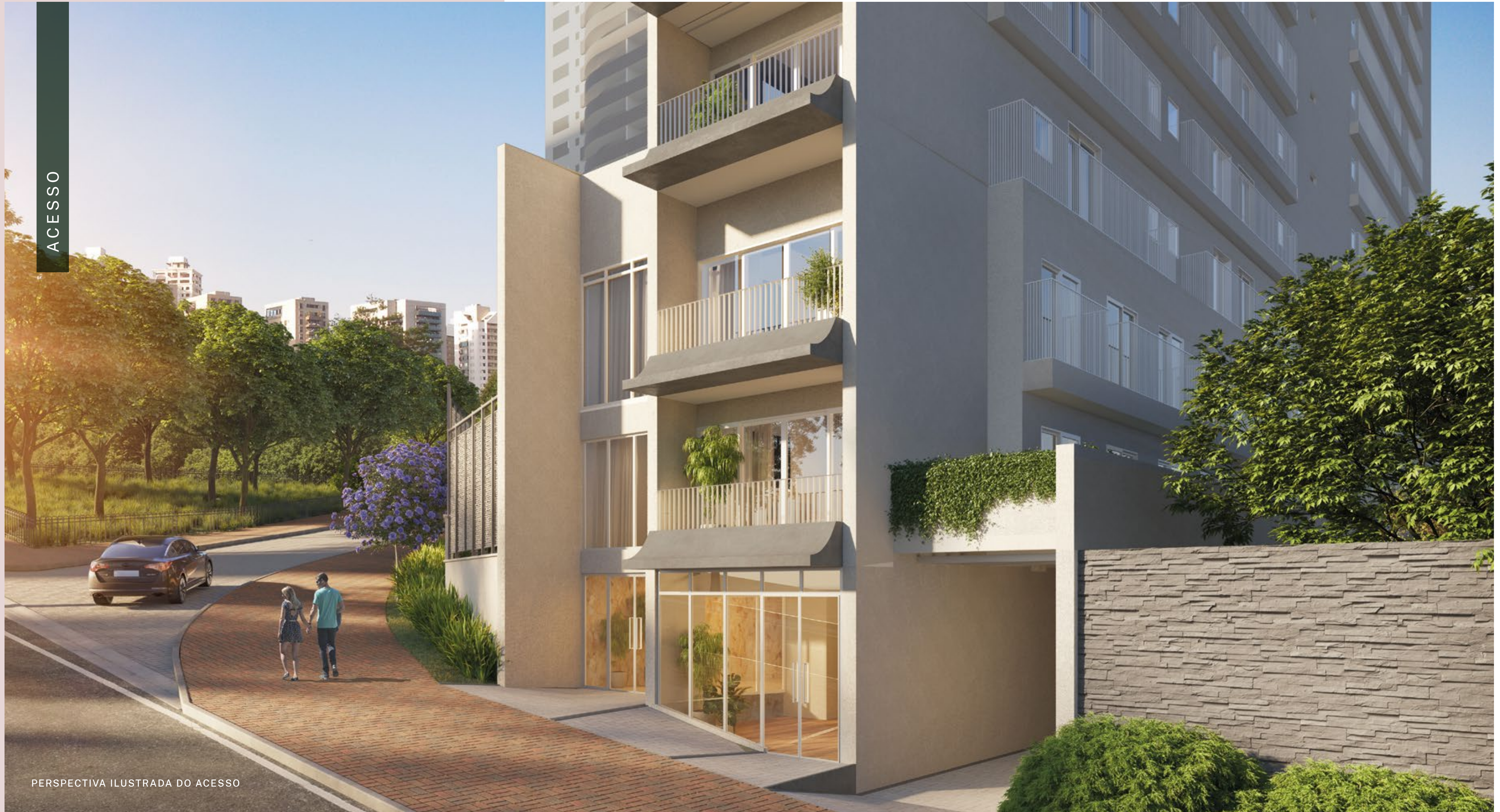
PERSPECTIVA ILUSTRADA DO ACESSO