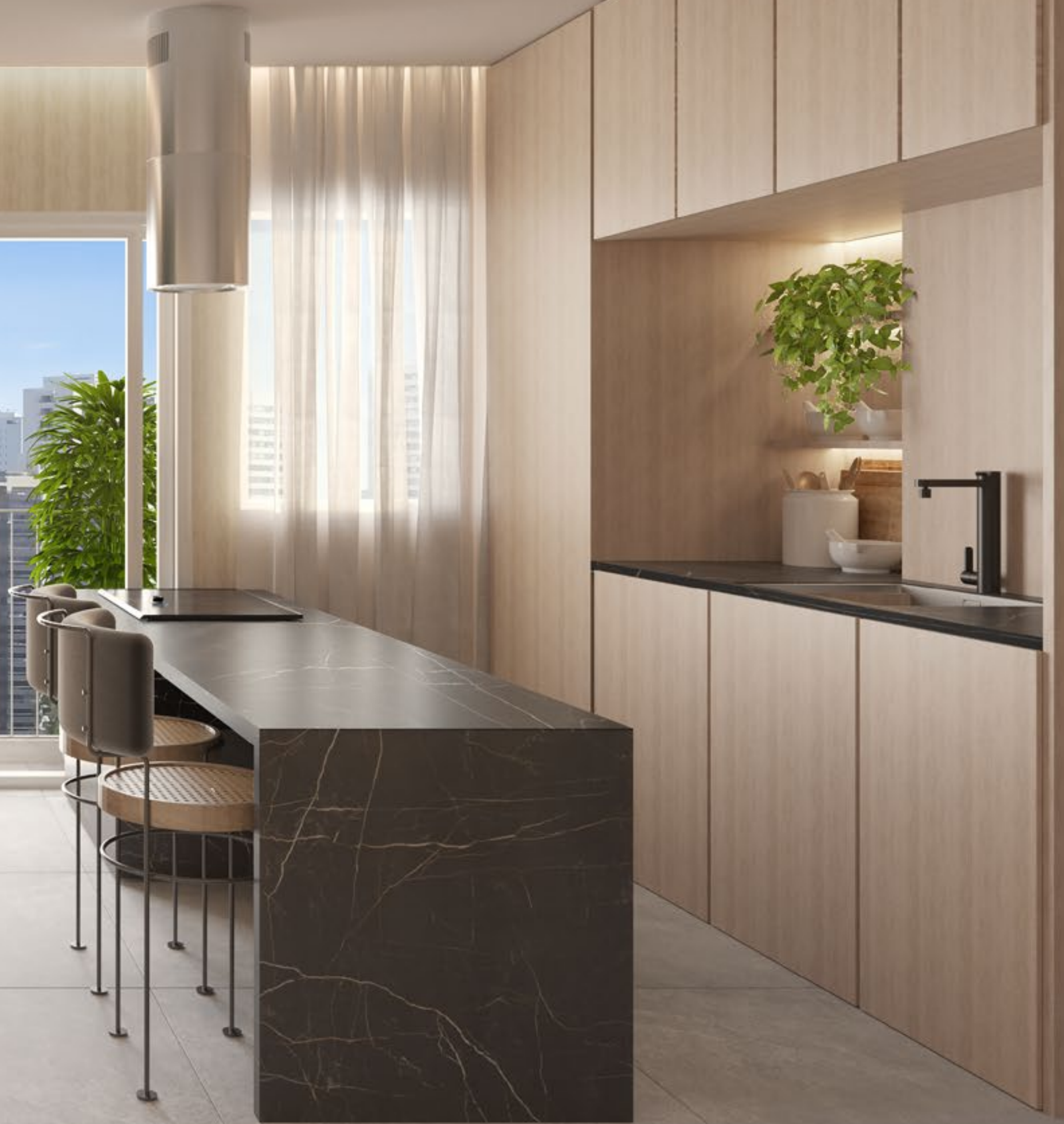
PERSPECTIVA ILUSTRADA DO LIVING APTO. DE 52M 2