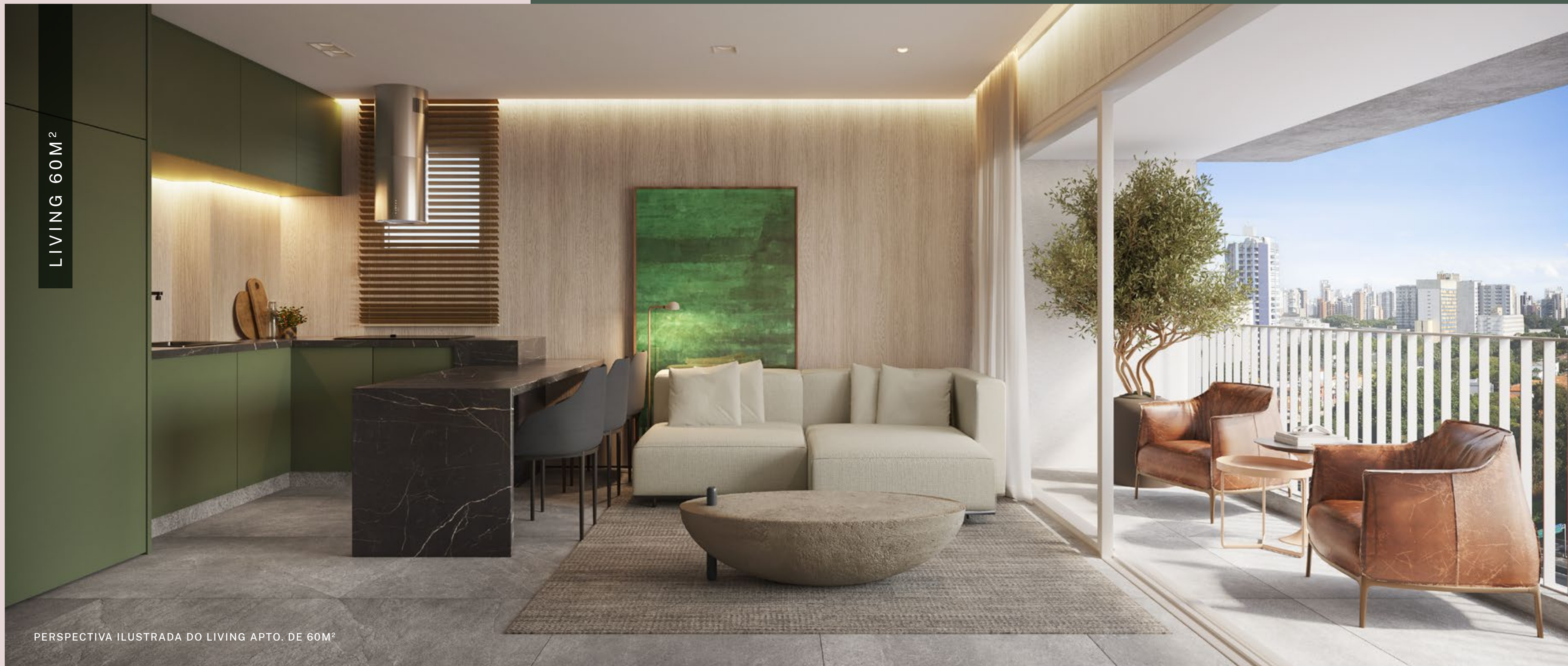
PERSPECTIVA ILUSTRADA DO LIVING APTO. DE 60M 2