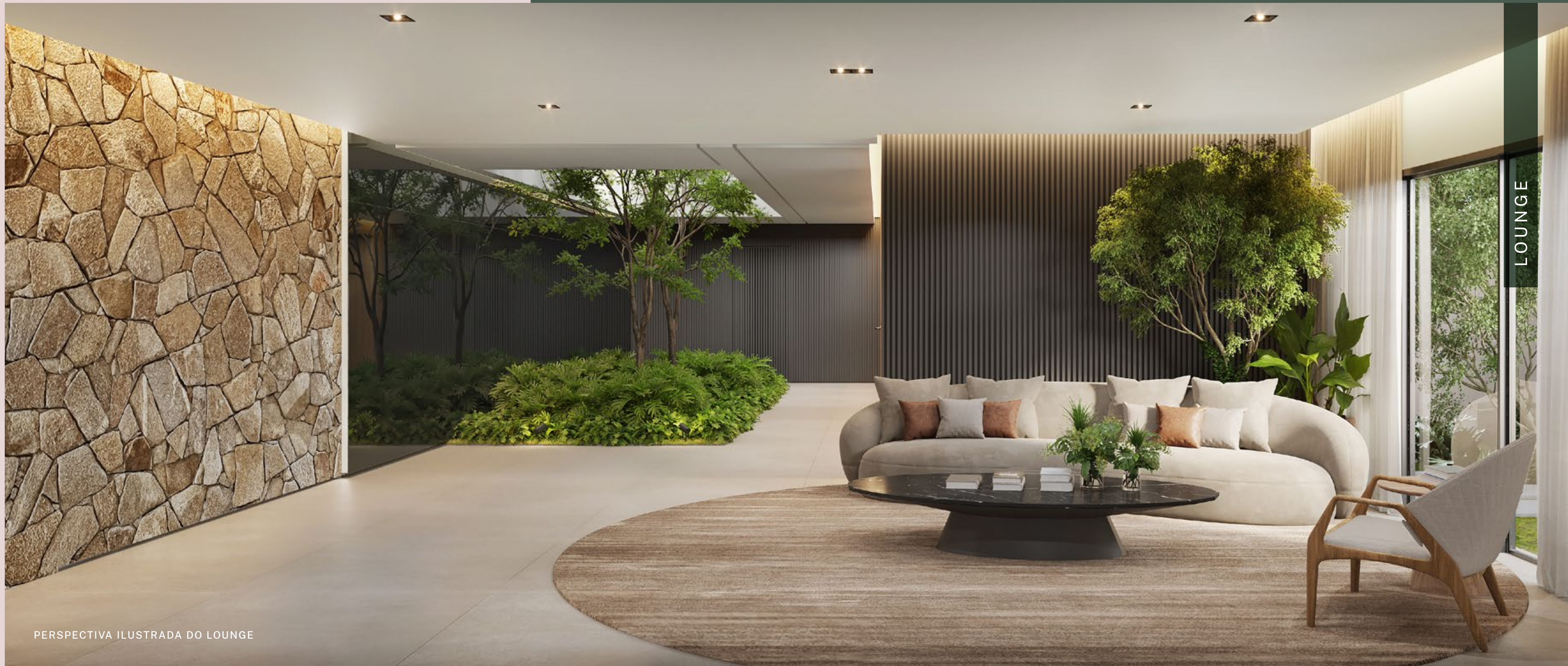
PERSPECTIVA ILUSTRADA DO LOUNGE