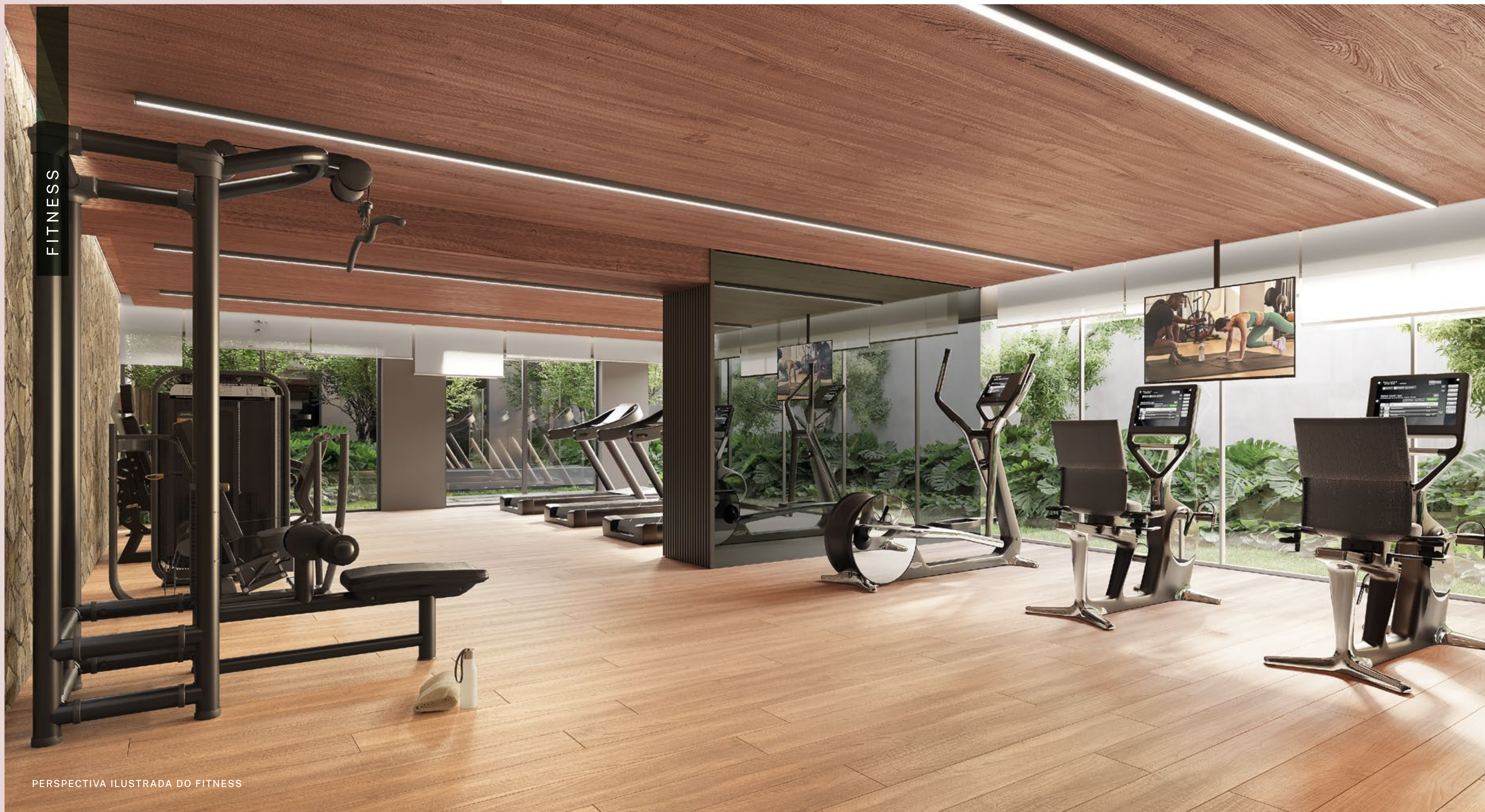
PERSPECTIVA ILUSTRADA DO FITNESS