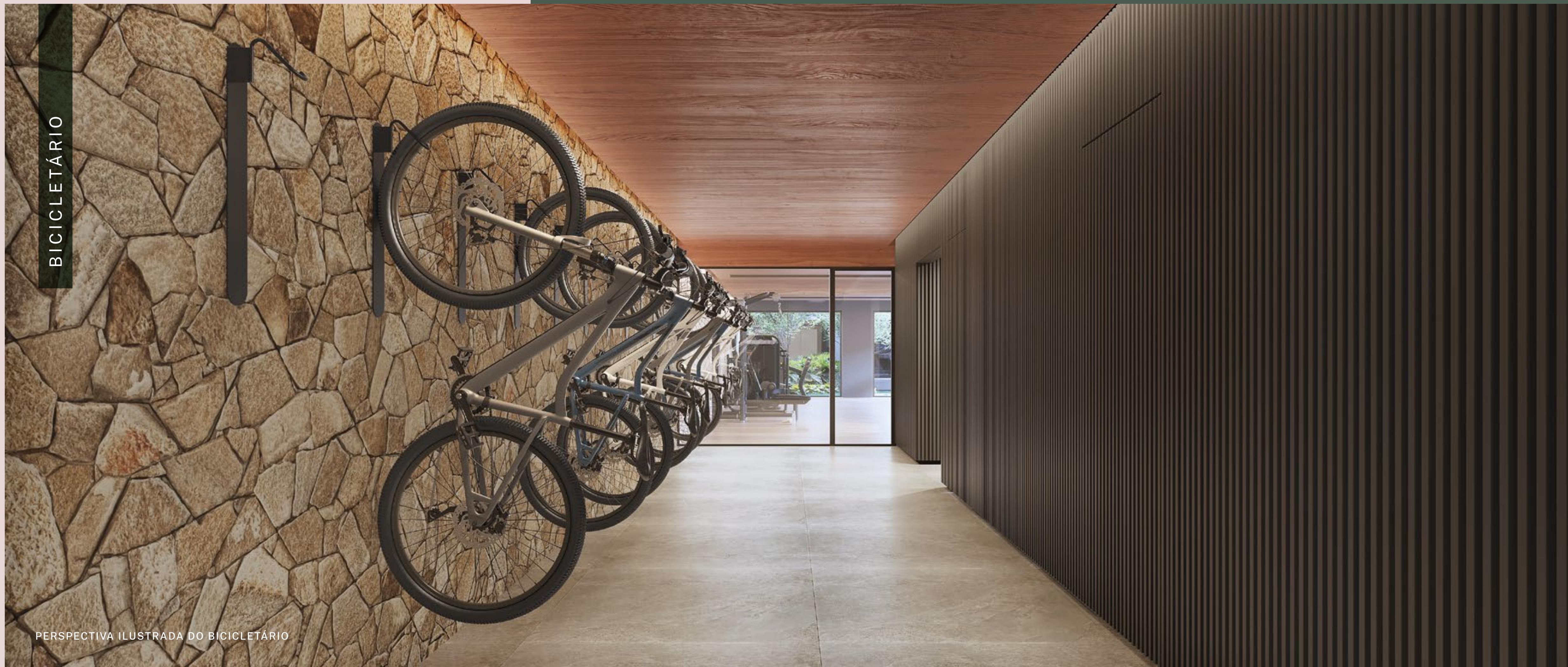
PERSPECTIVA ILUSTRADA DO BICICLETÁRIO