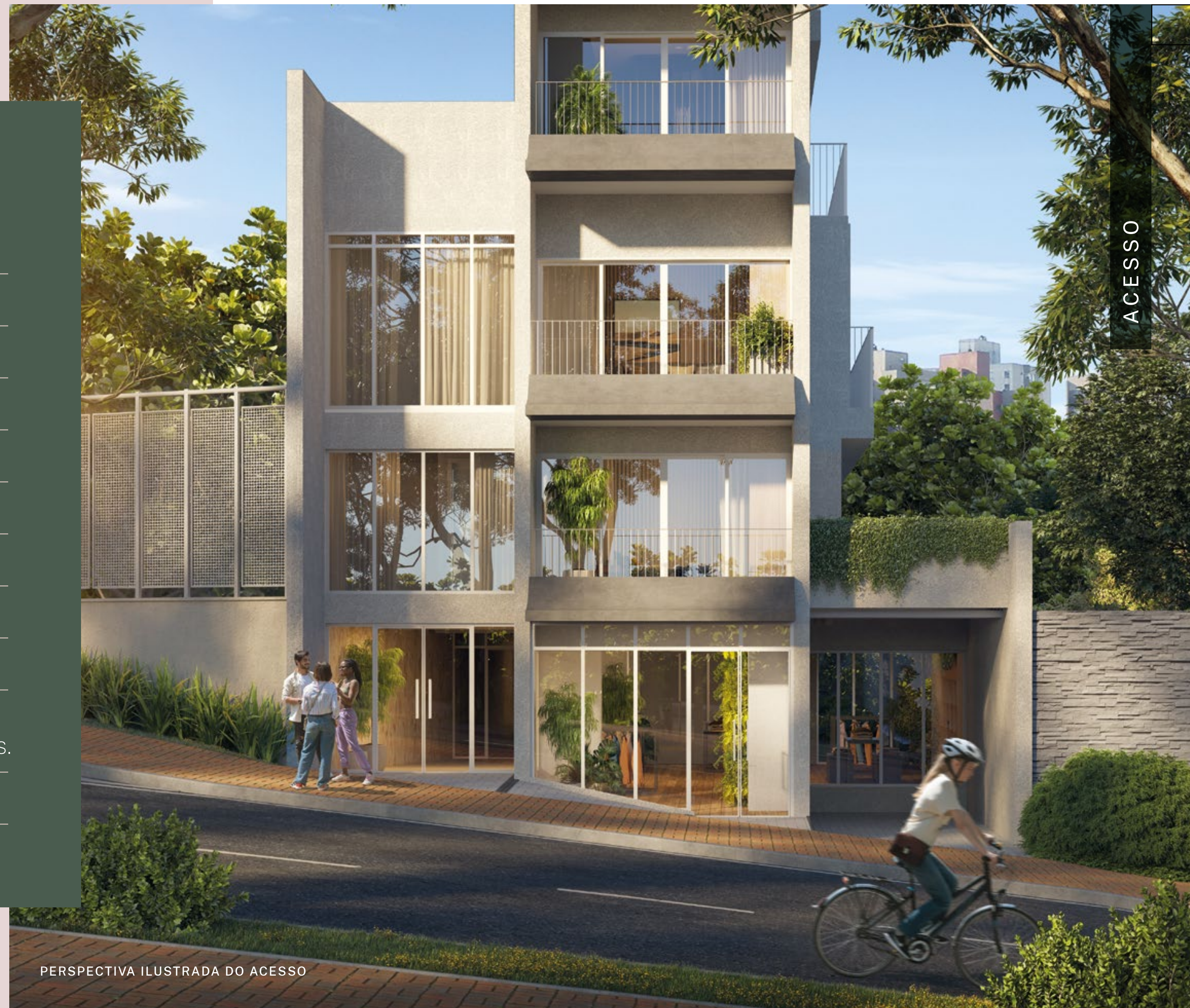
PERSPECTIVA ILUSTRADA DO ACESSO