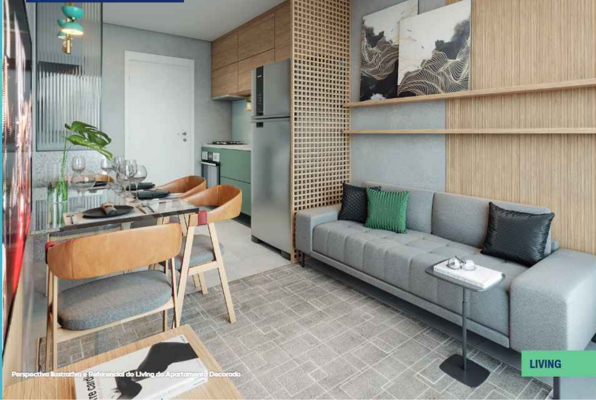
Perspectiva Ilustrativa e Referencial do Living do Apartamento Decorado