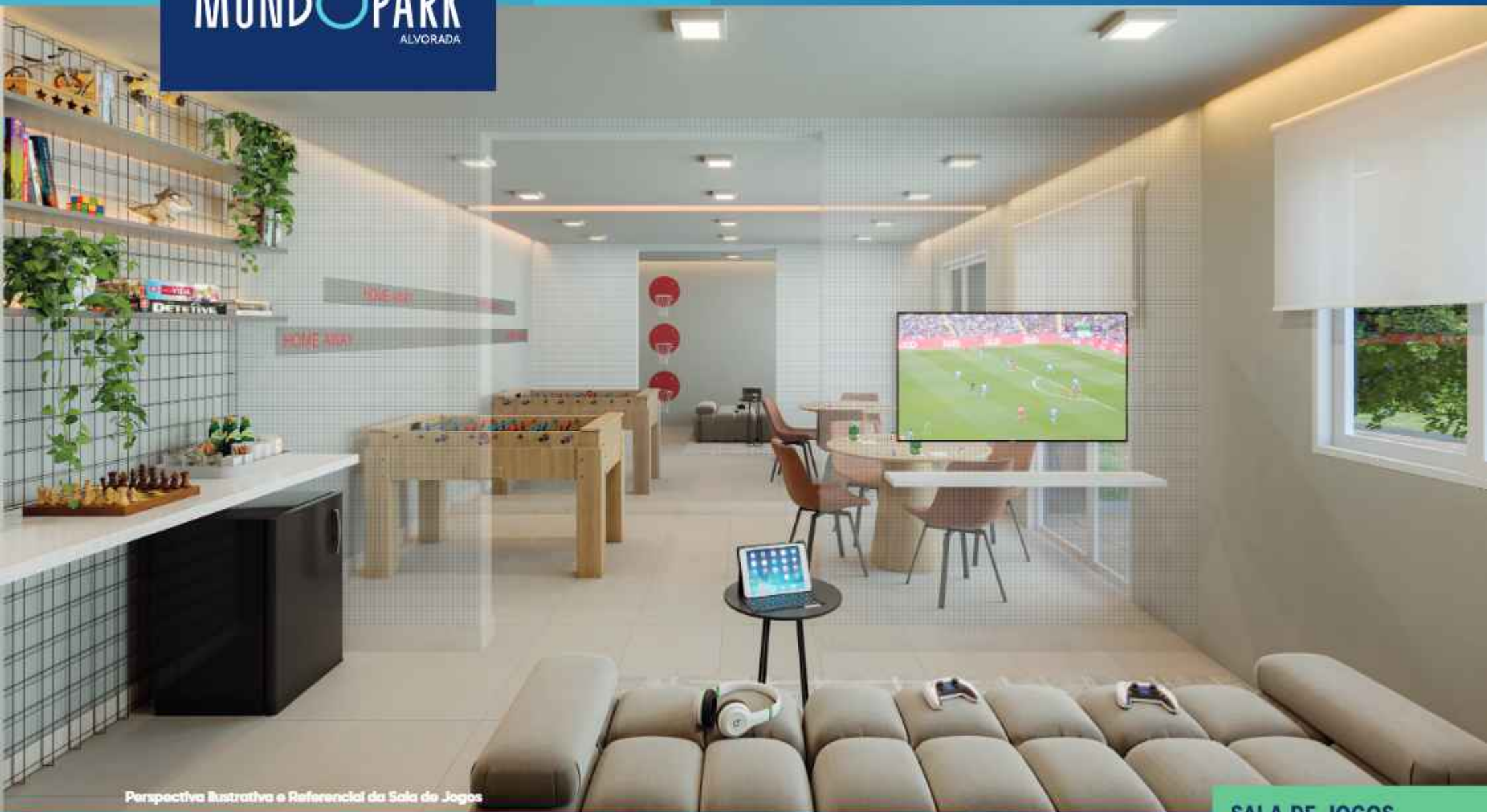
Perspectiva Ilustrativa e Referencial da Sala de Jogos