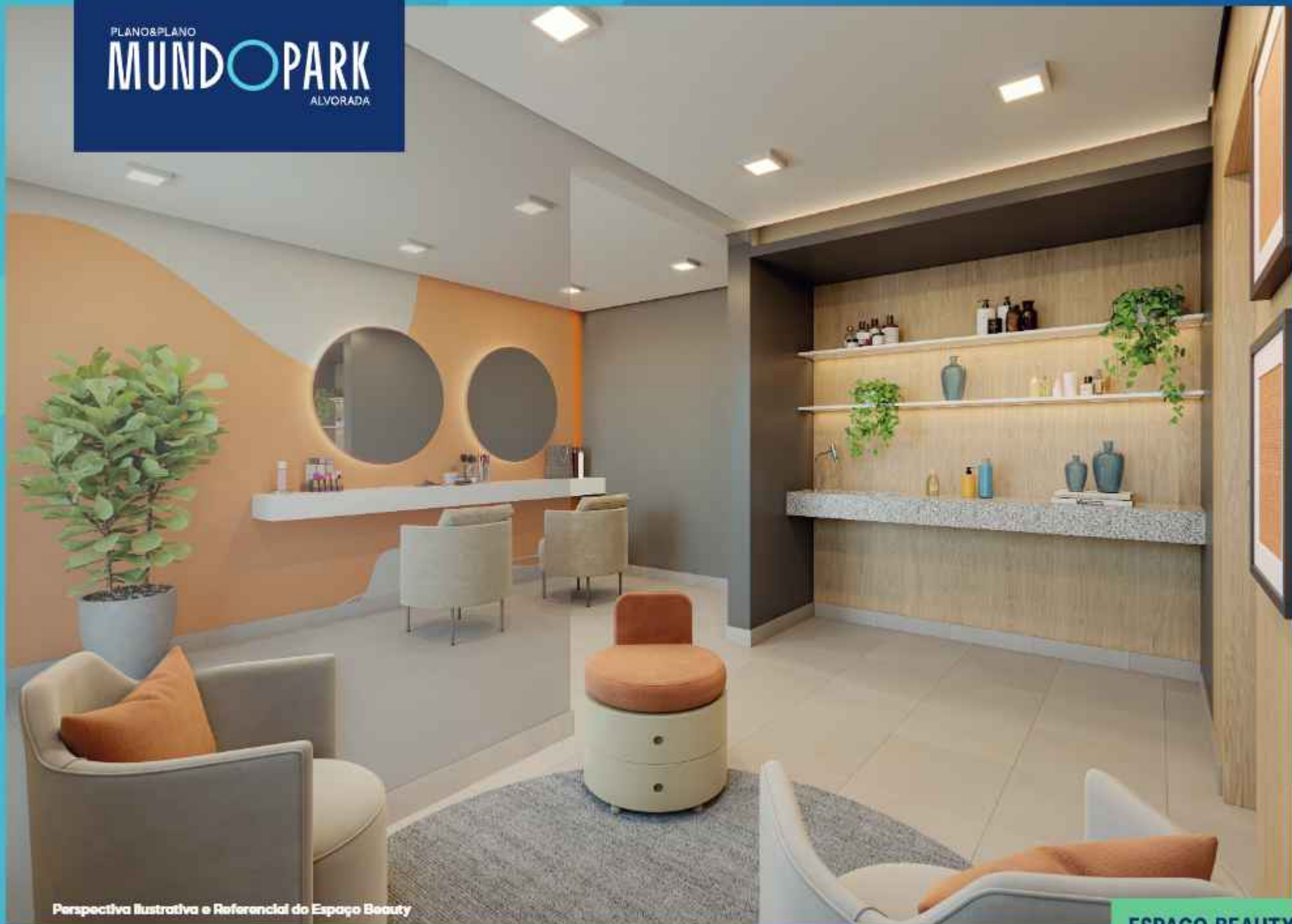
Perspectiva Ilustrativa e Referencial do Espaço Beauty