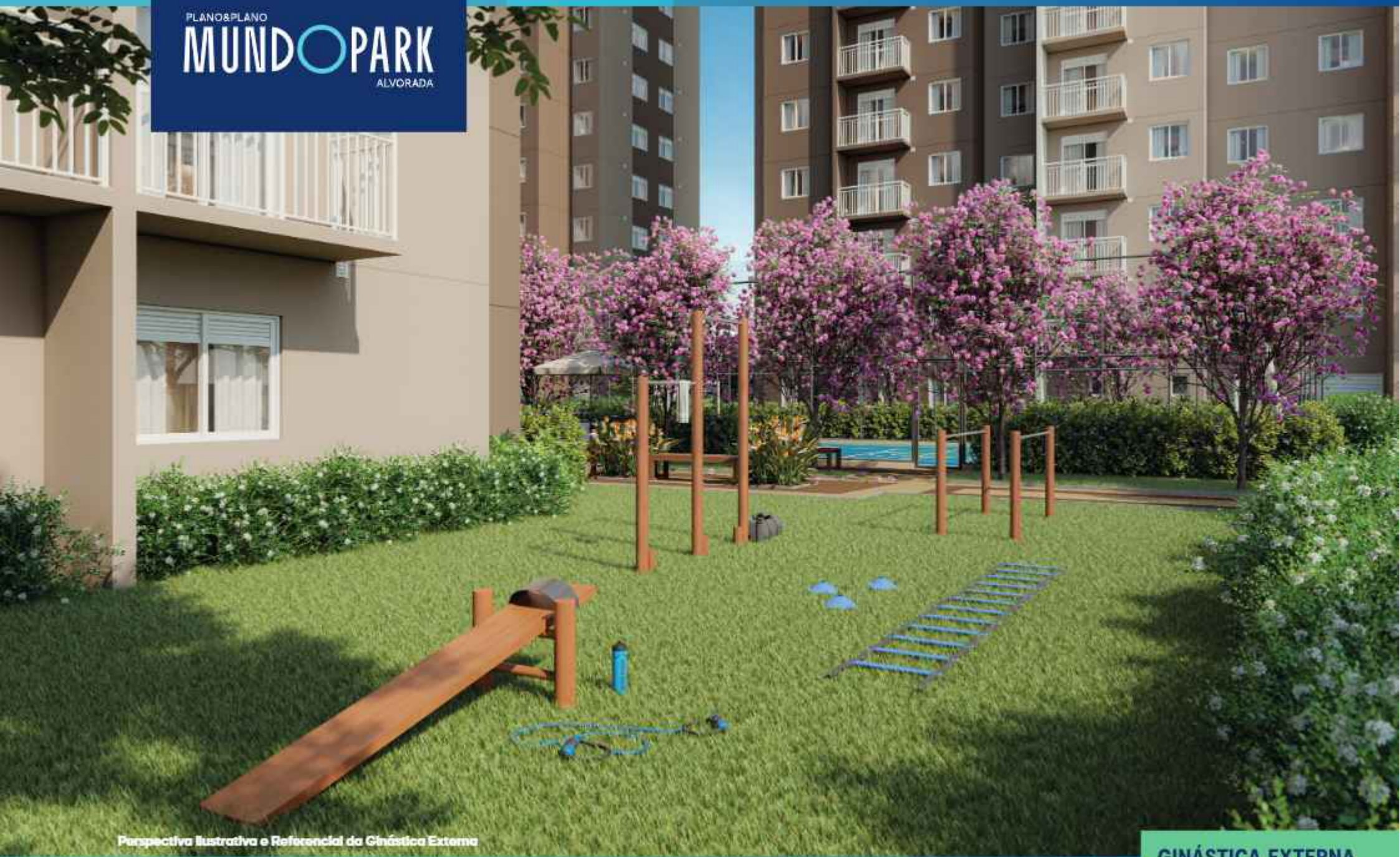
Perspectiva Ilustrativa e Referencial da Ginástica Externa