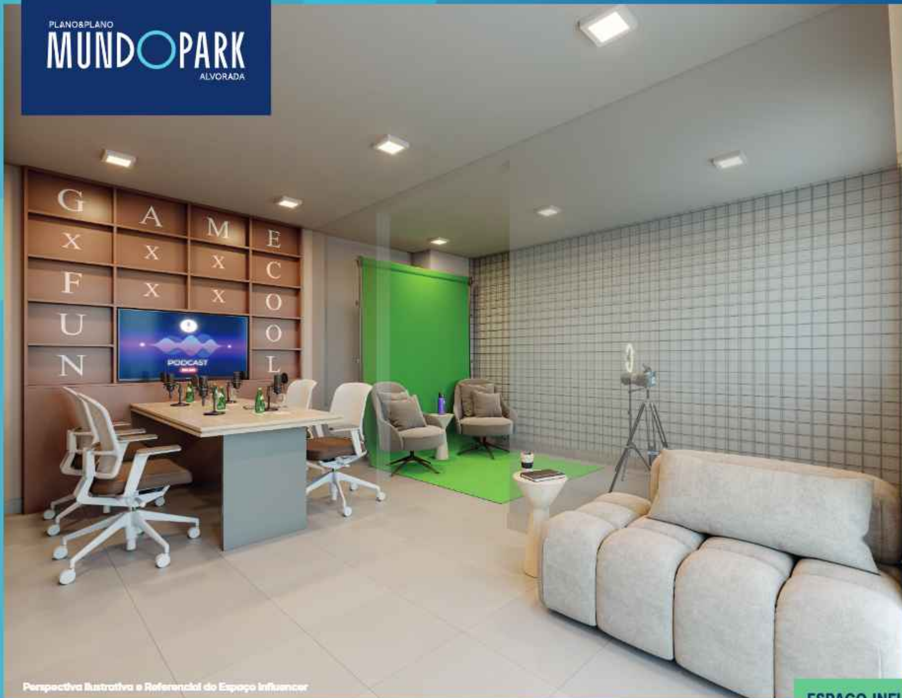
Perspectiva Ilustrativa e Referencial do Espaço Influencer