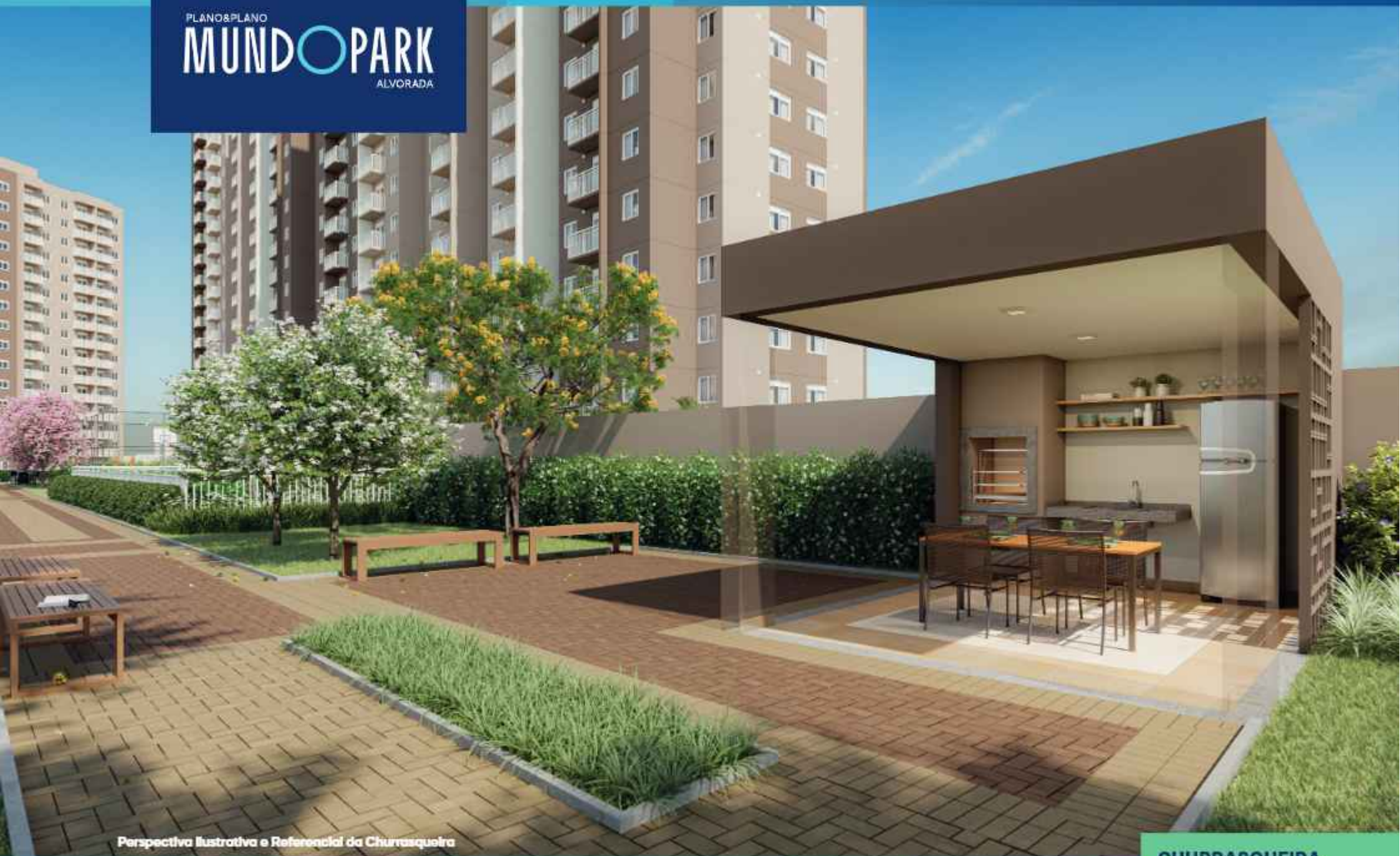
Perspectiva Ilustrativa e Referencial da Churrasqueira