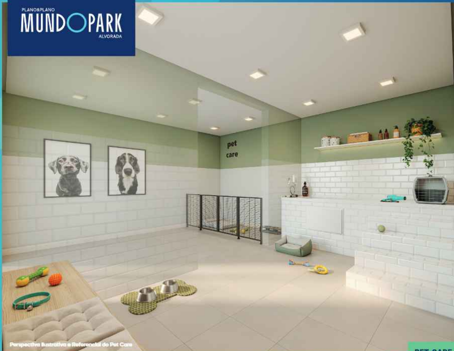
Perspectiva Ilustrativa e Referencial do Pet Care