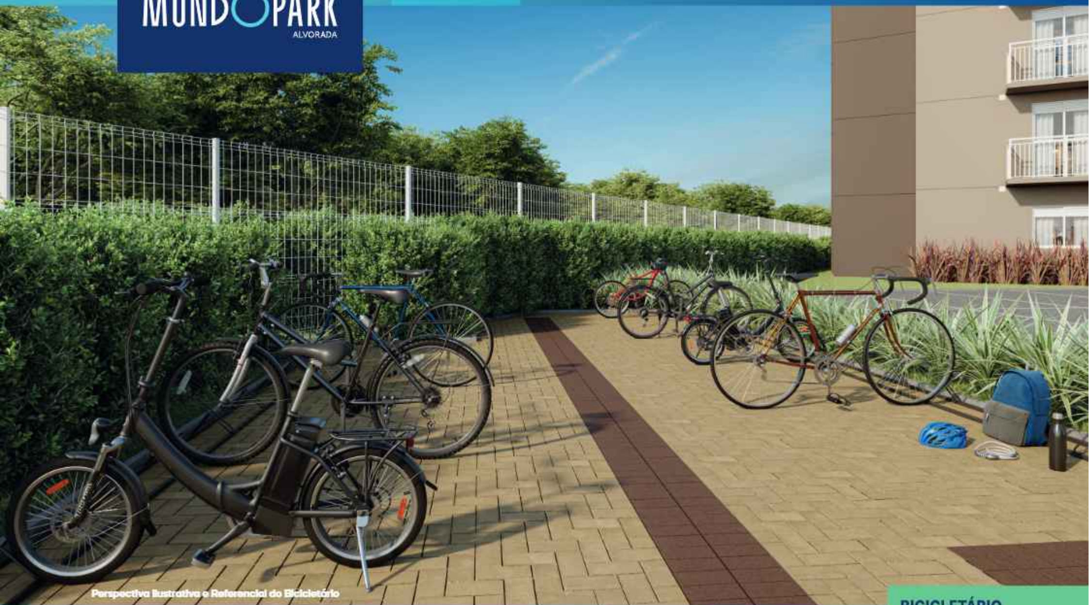
Perspectiva Ilustrativa e Referencial do Bicicletário