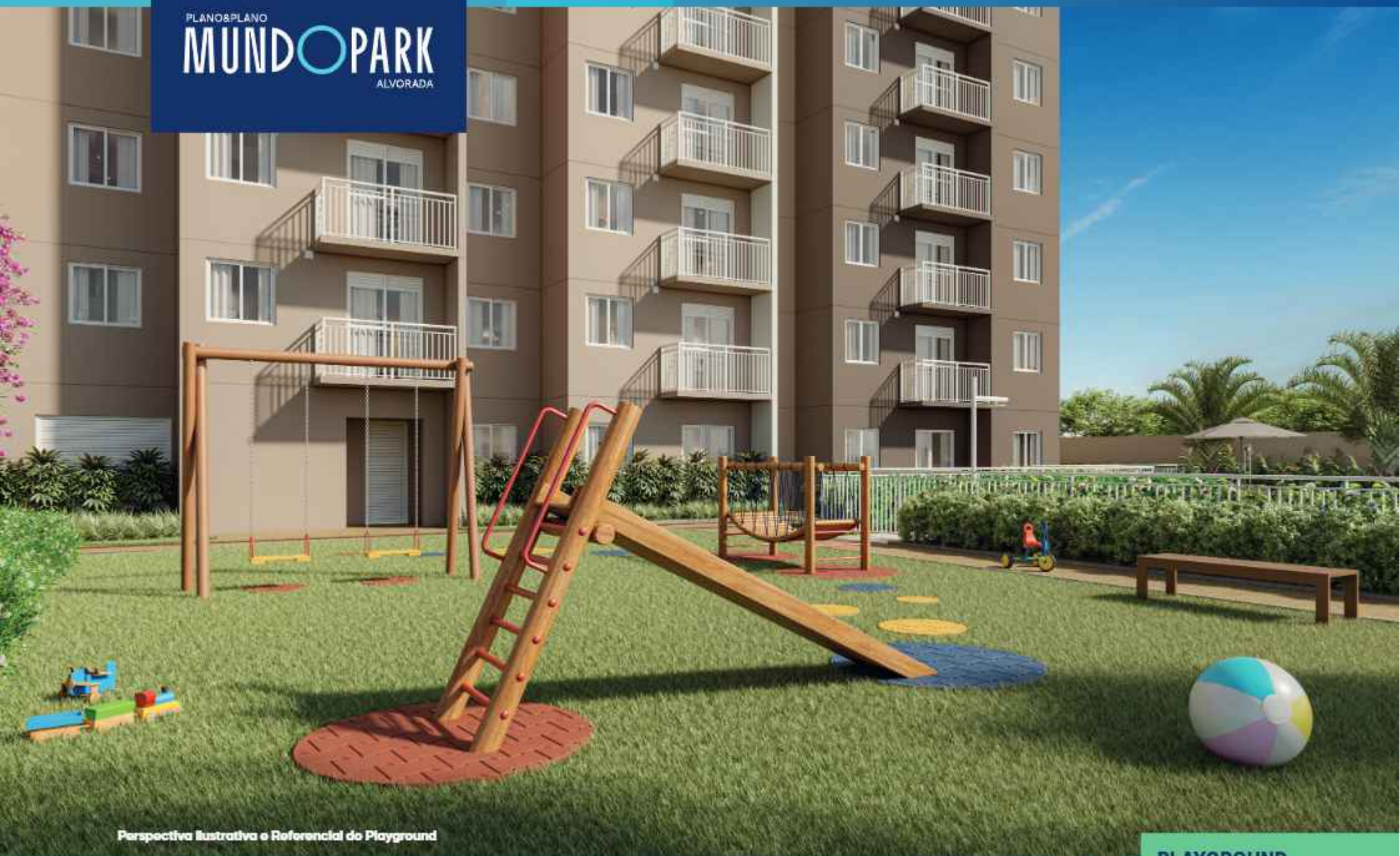
Perspectiva Ilustrativa e Referencial do Playground