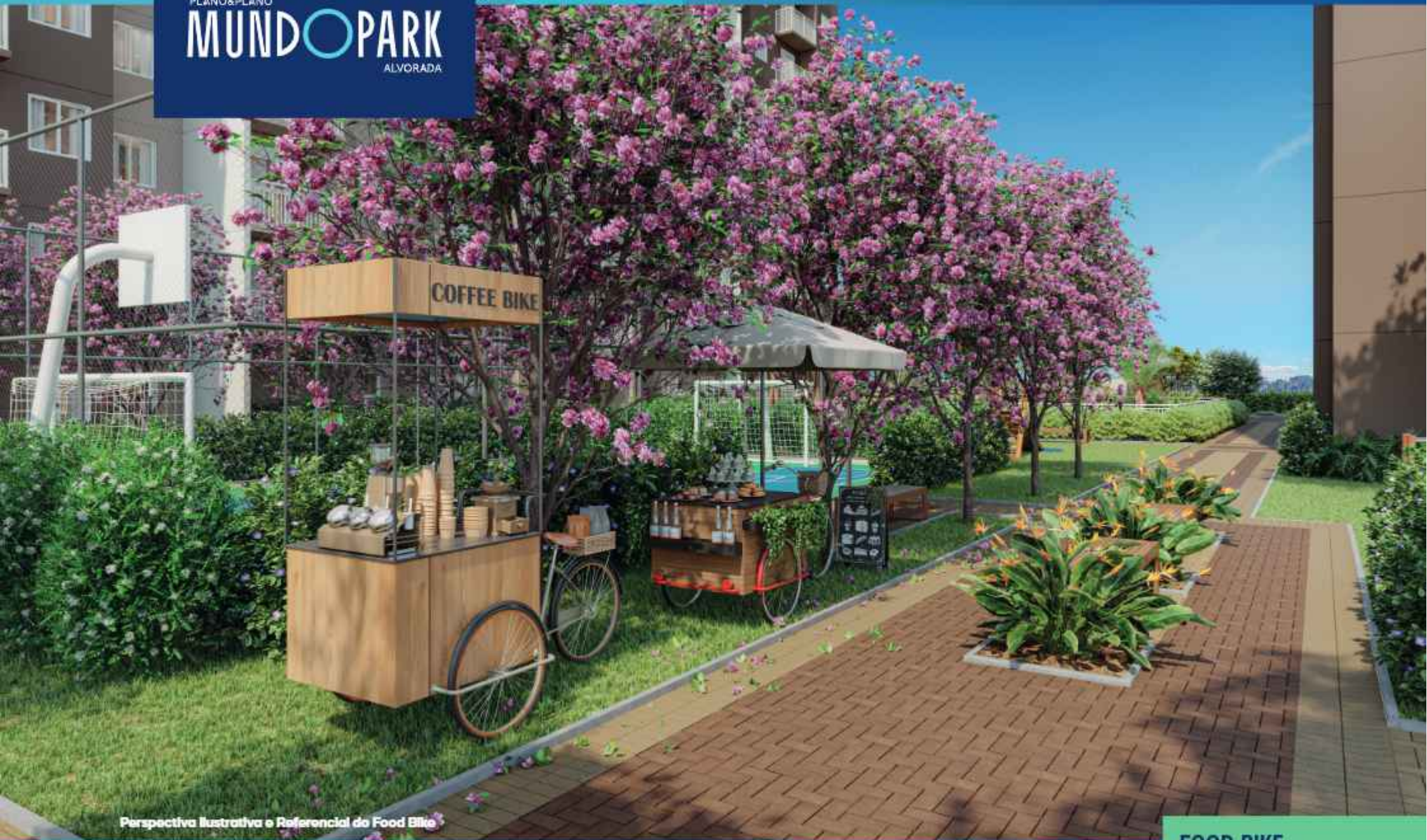
Perspectiva Ilustrativa e Referencial do Food Bike