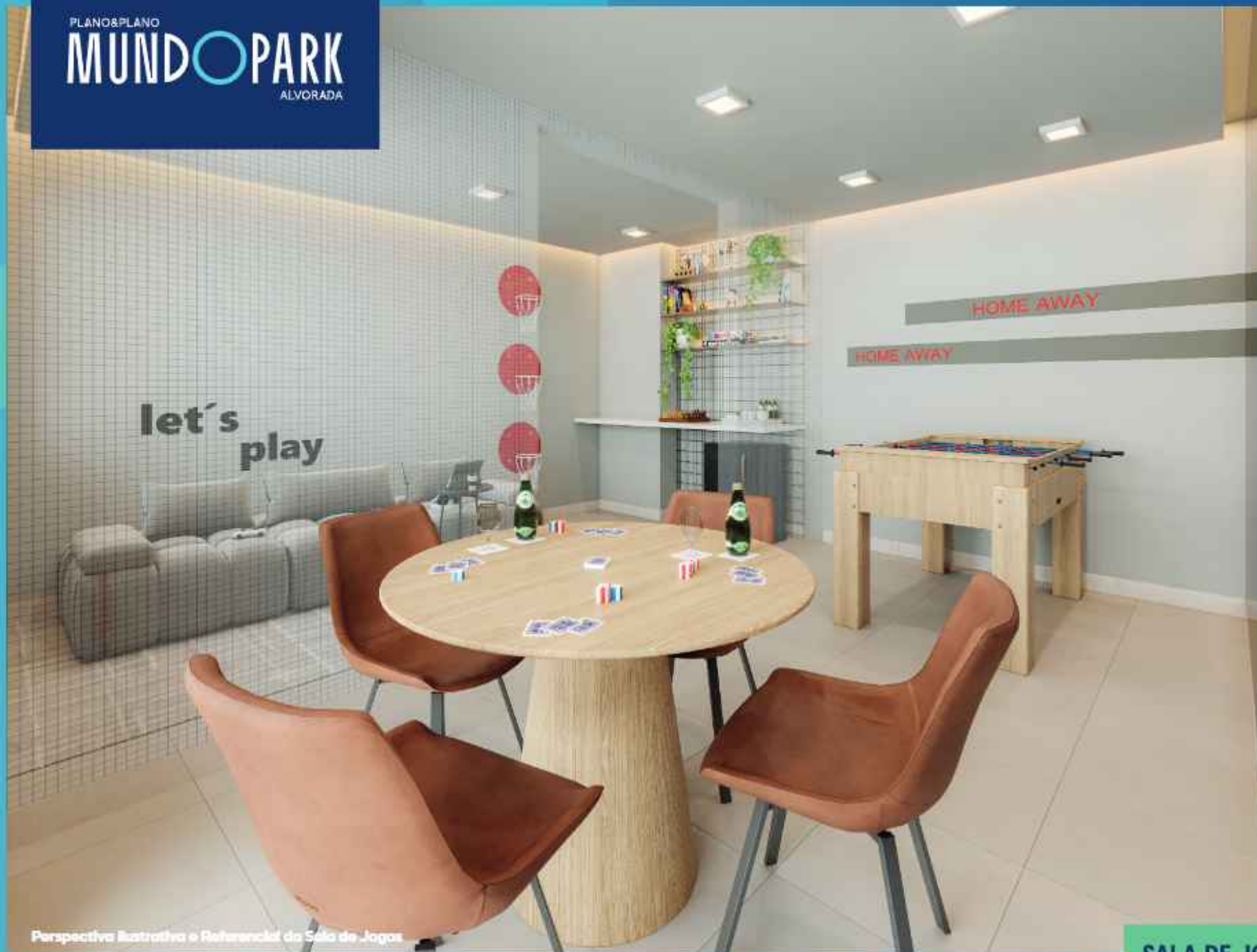
Perspectiva Ilustrativa e Referencial da Sala de Jogos