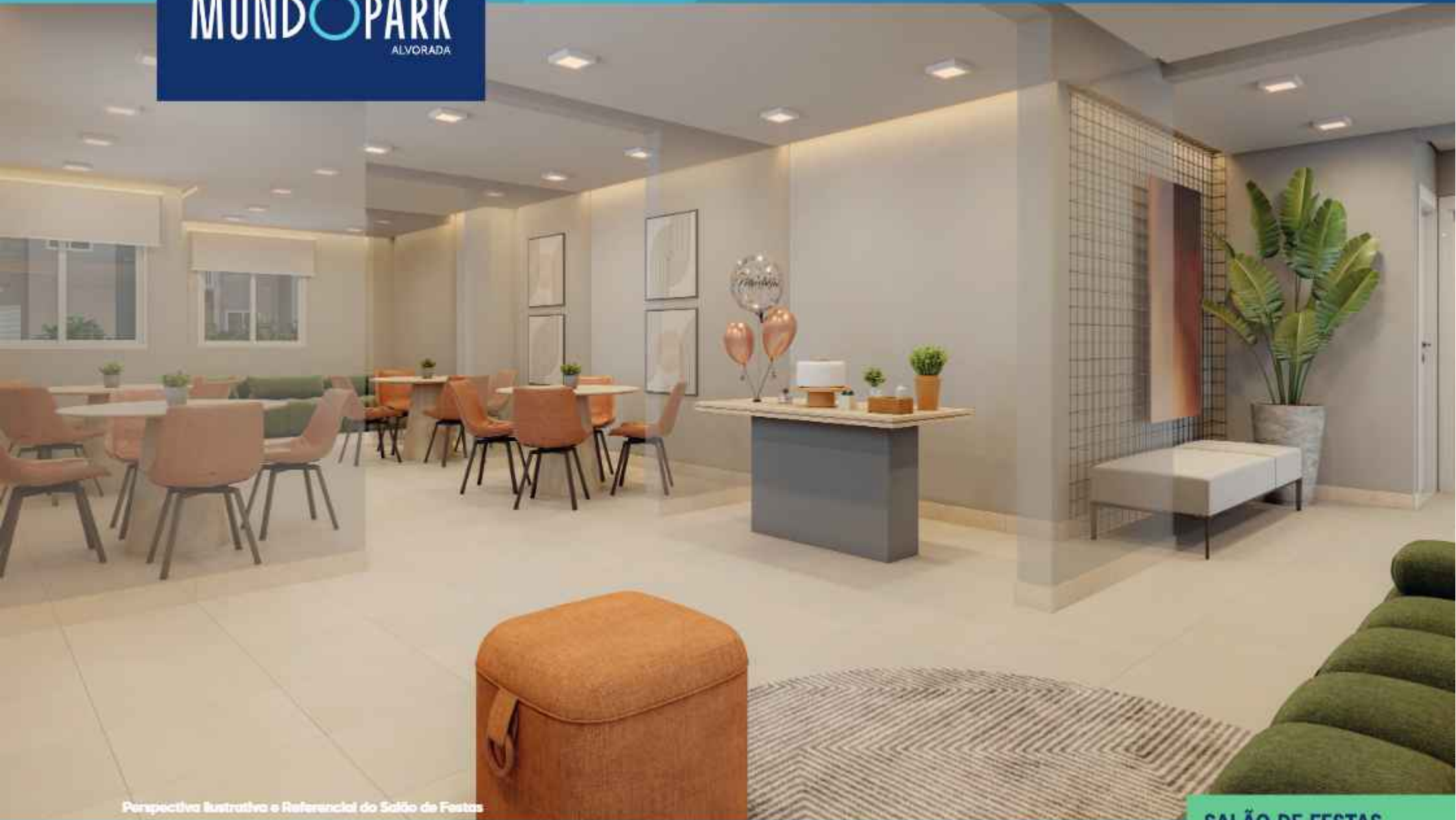
Perspectiva Ilustrativa e Referencial do Salão de Festas