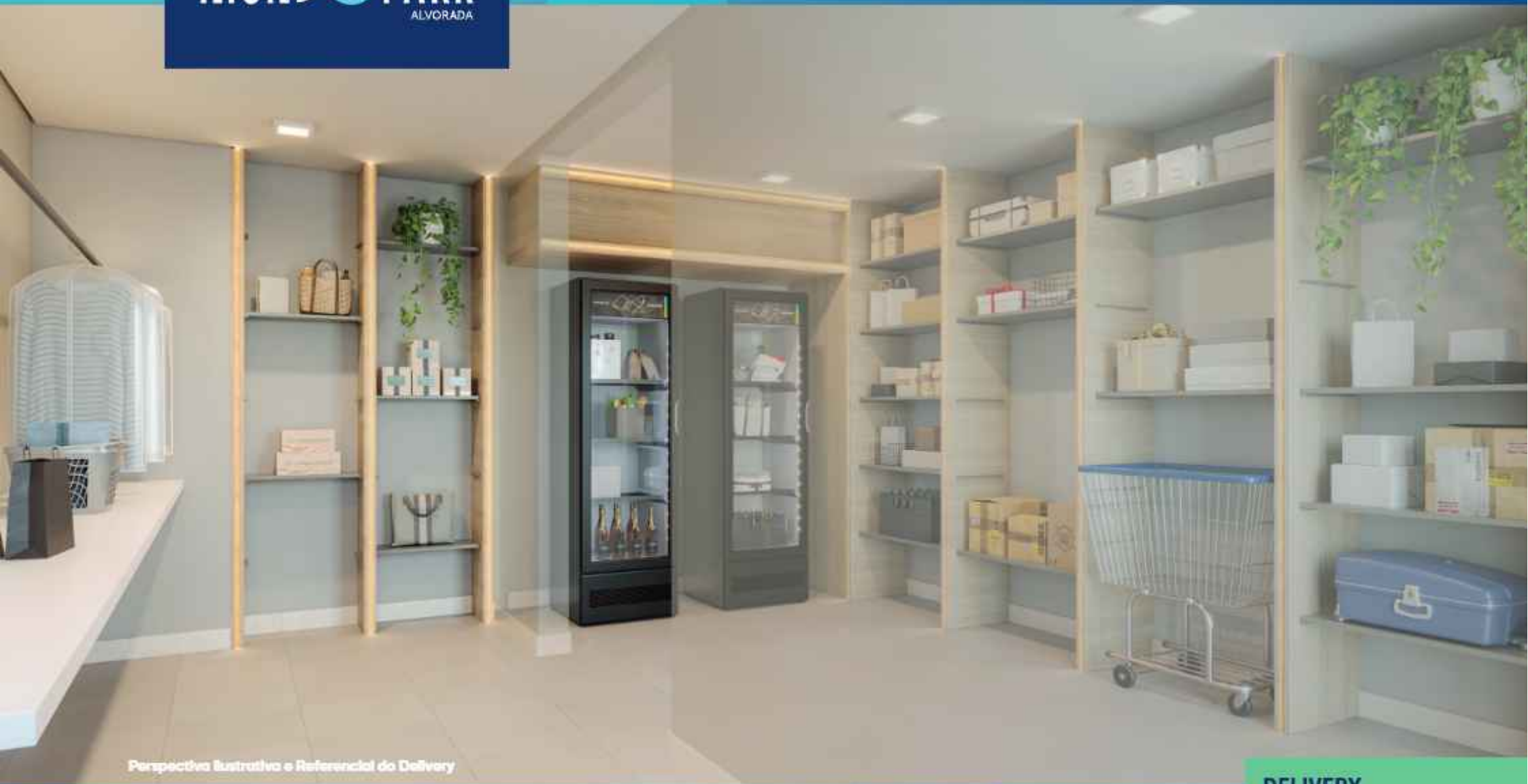
Perspectiva Ilustrativa e Referencial do Delivery