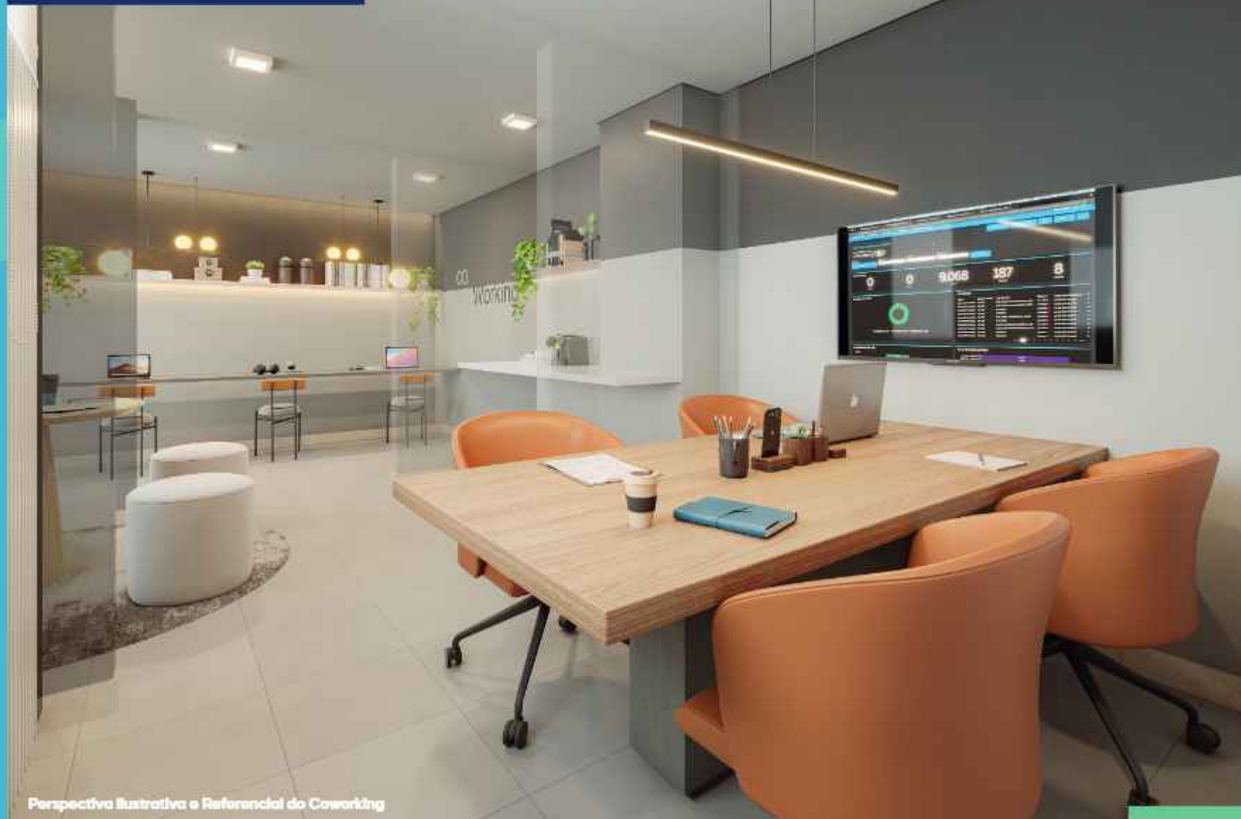
Perspectiva Ilustrativa e Referencial do Coworking