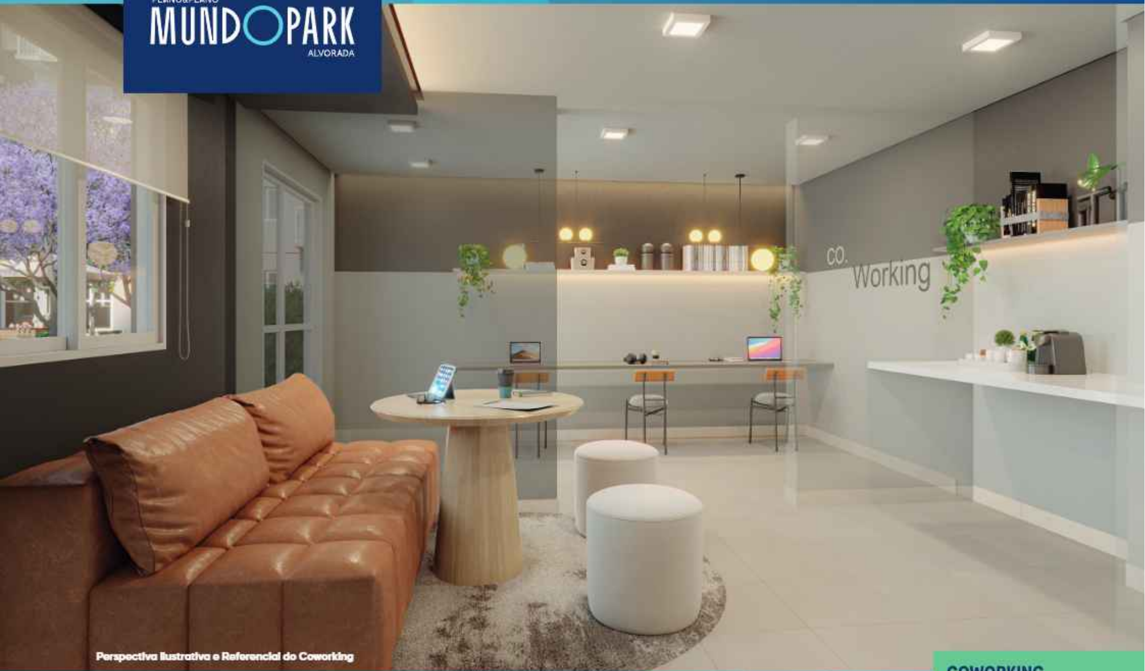
Perspectiva Ilustrativa e Referencial do Coworking