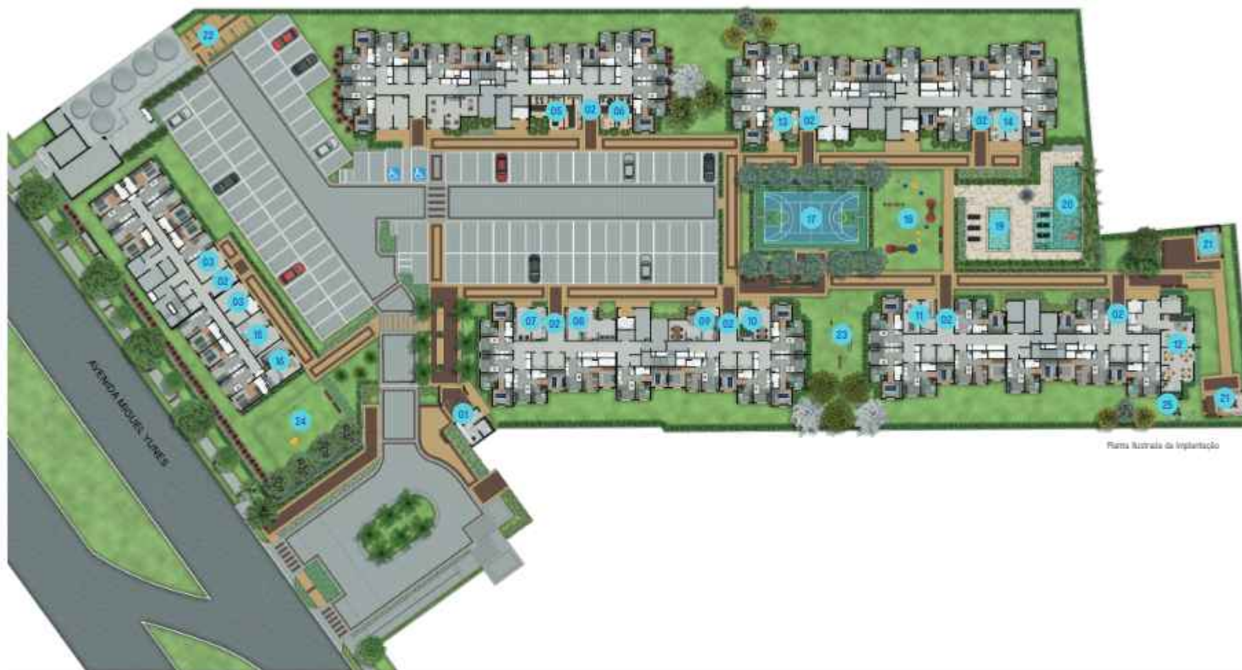
Plano ilustrado de implantação