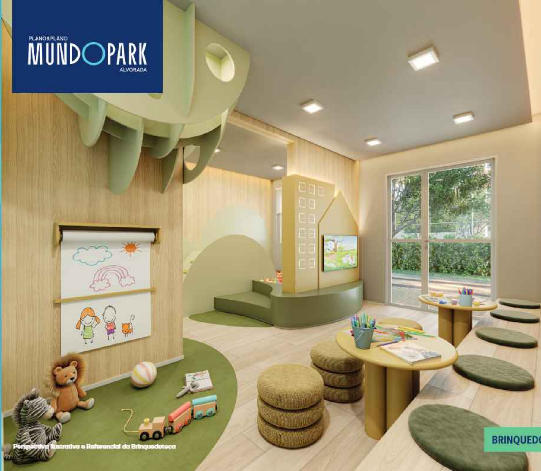
Perspectiva Ilustrativa e Referencial da Brinquedoteca