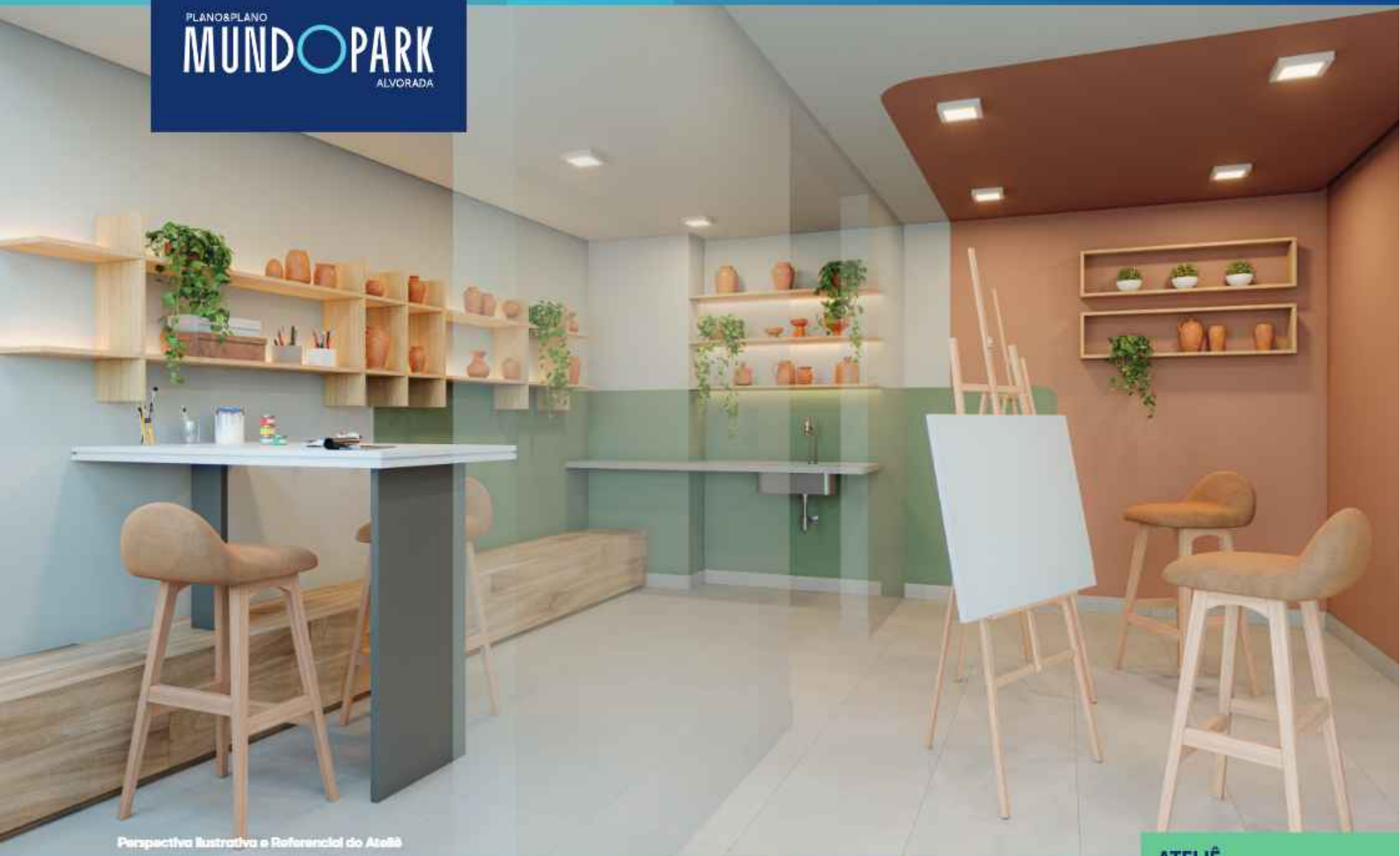
Perspectiva Ilustrativa e Referencial do Ateliê