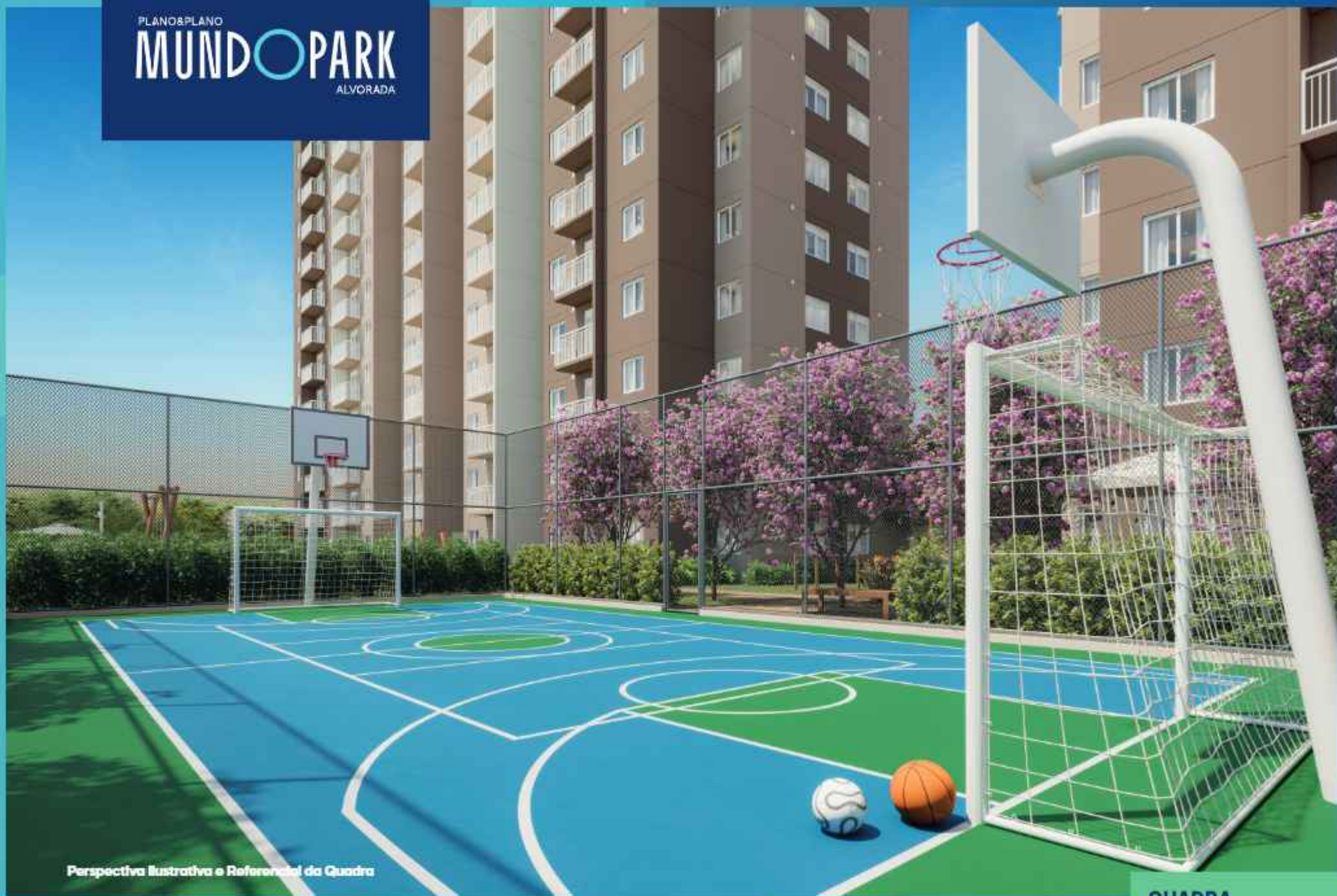
Perspectiva Ilustrativa e Referencial da Quadra