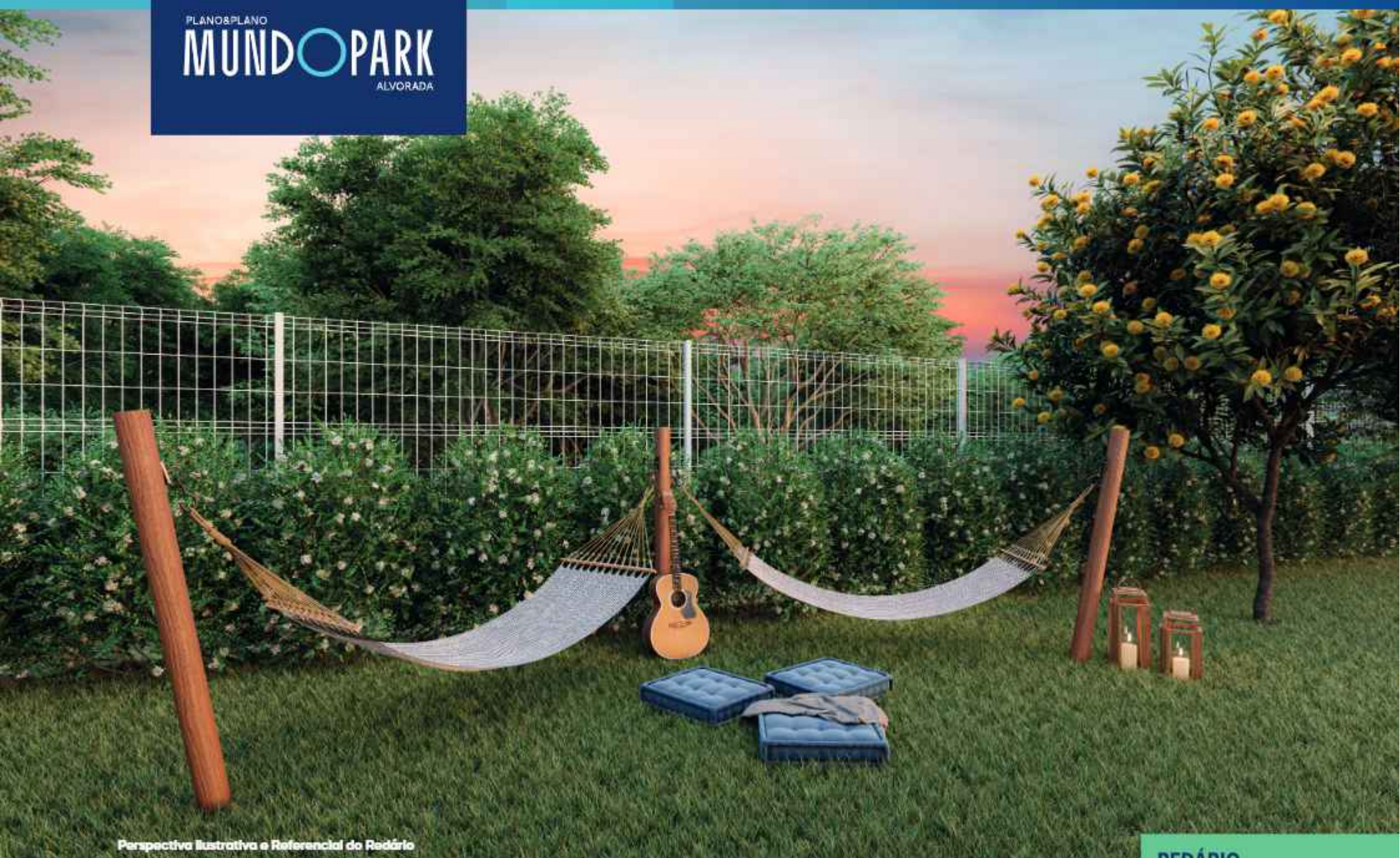
Perspectiva Ilustrativa e Referencial do Redário