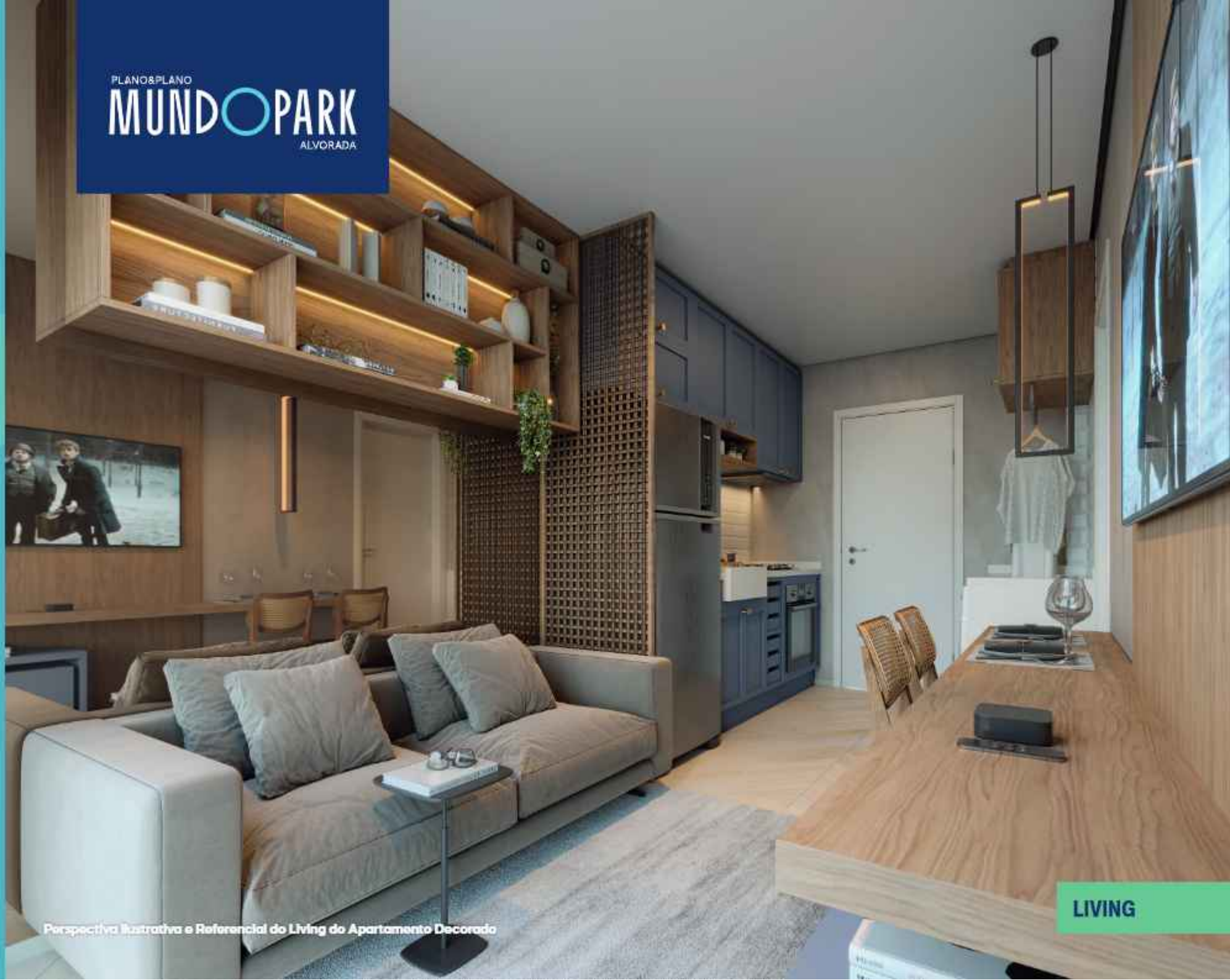
Perspectiva Ilustrativa e Referencial do Living do Apartamento Decorado