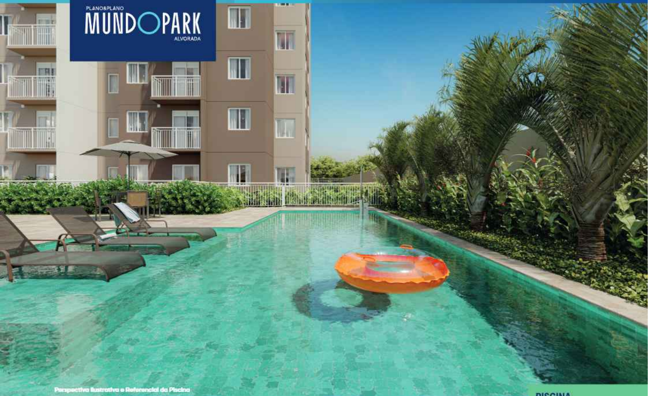
Perspectiva Ilustrativa e Referencial da Piscina