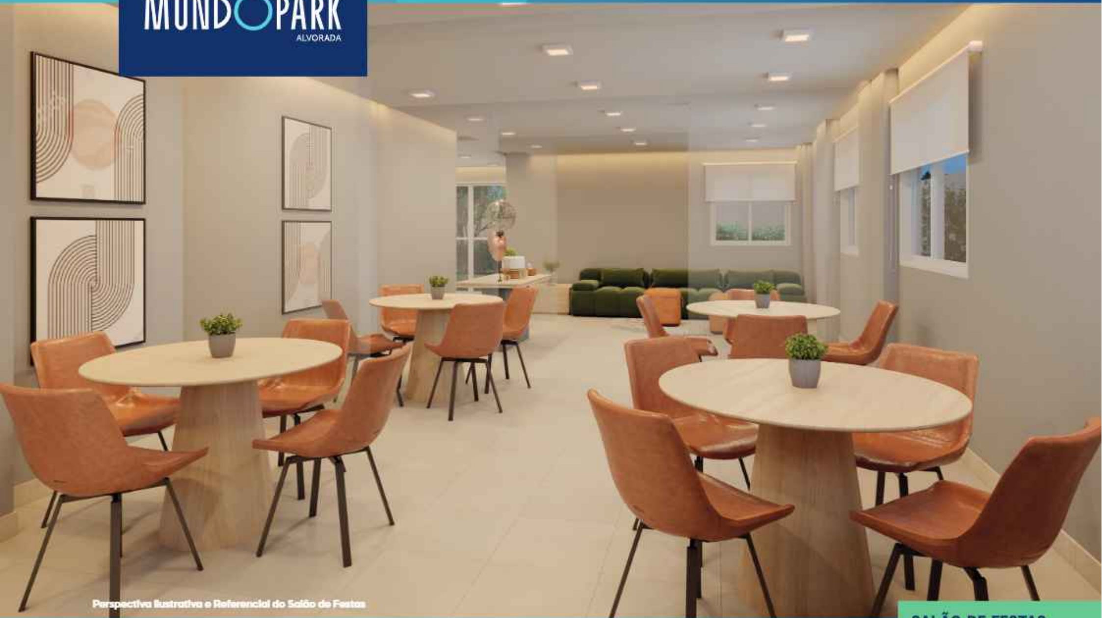
Perspectiva Ilustrativa e Referencial do Salão de Festas