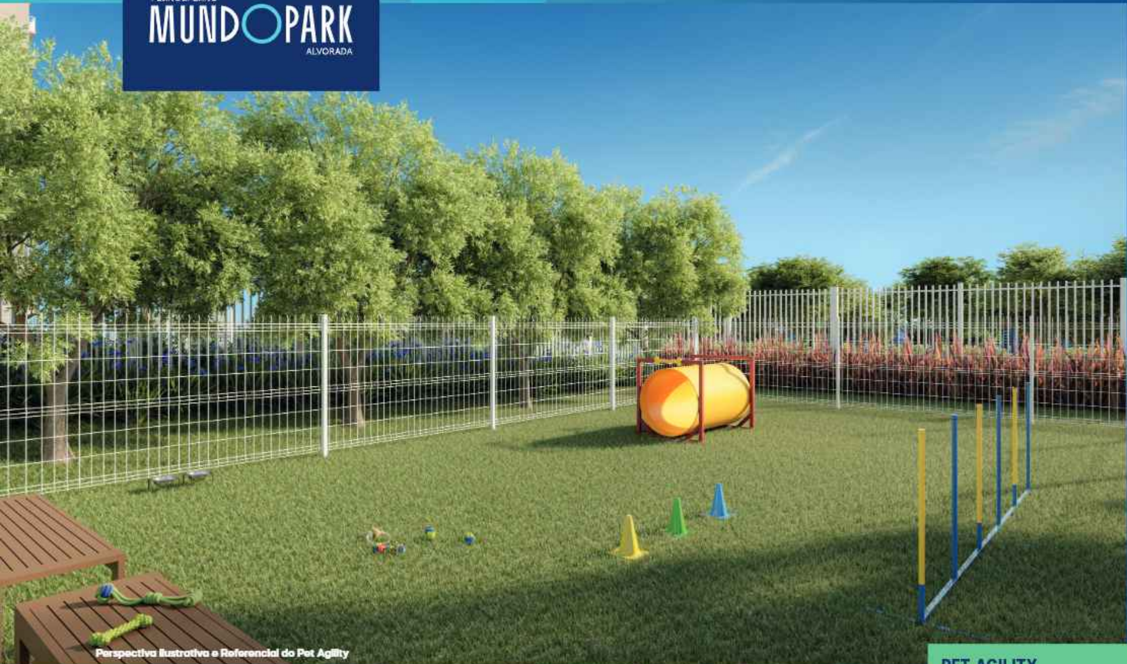
Perspectiva Ilustrativa e Referencial do Pet Agility