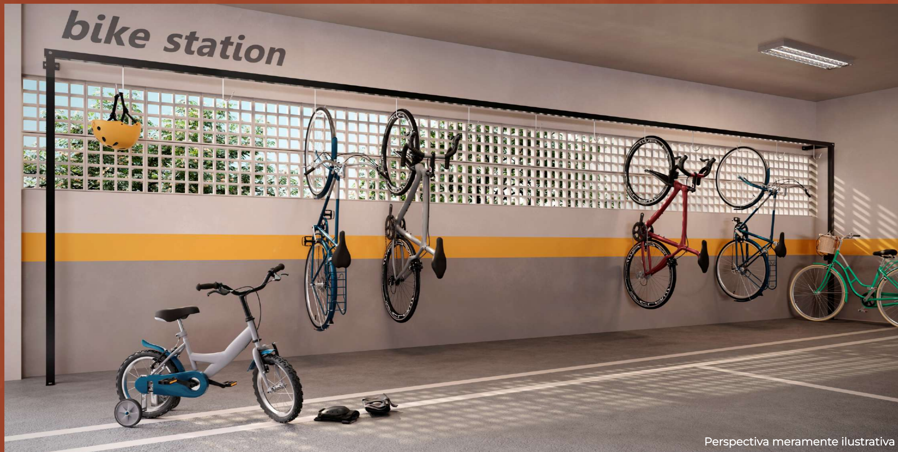
Perspectiva meramente ilustrativa