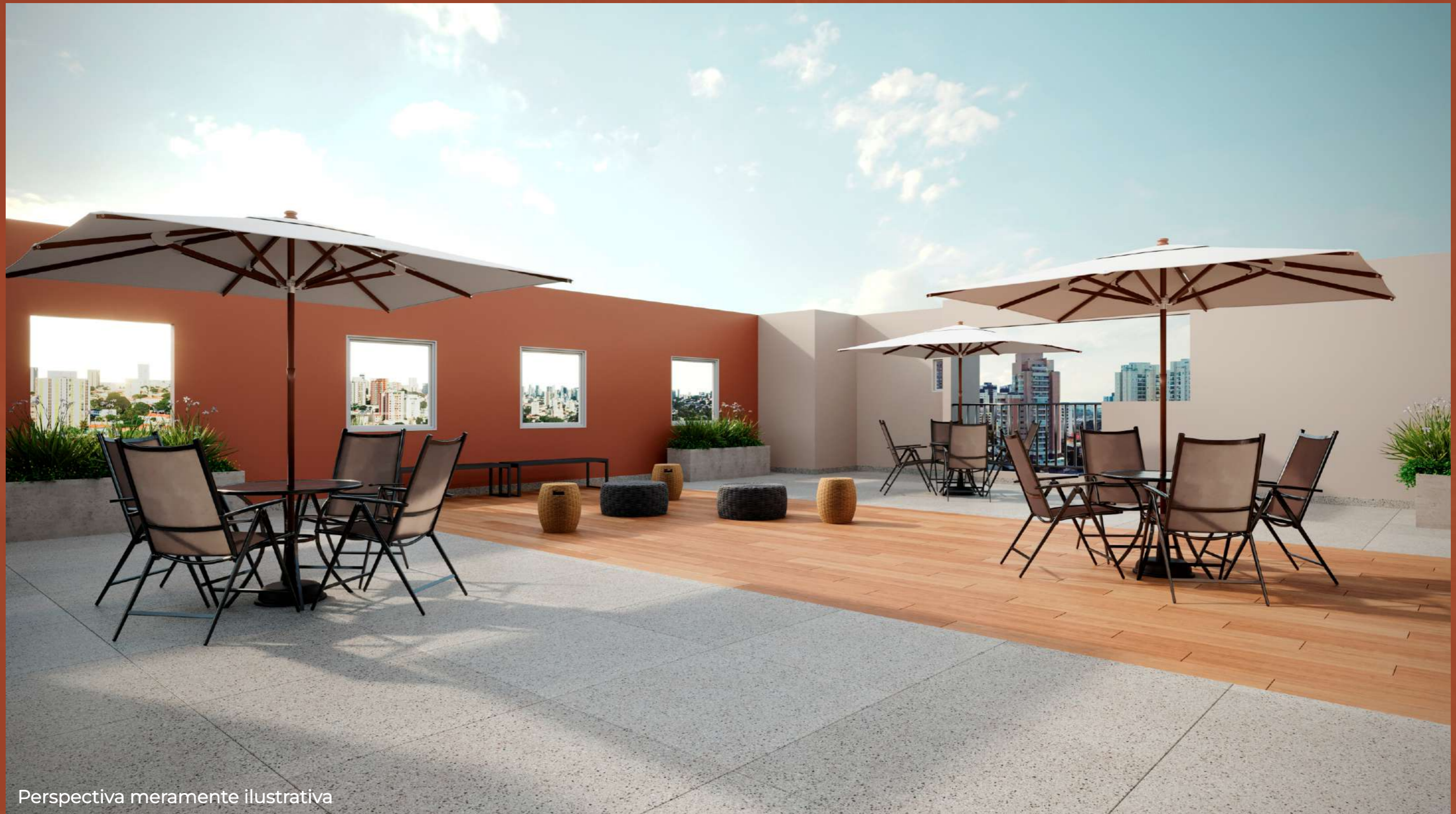
Perspectiva meramente ilustrativa