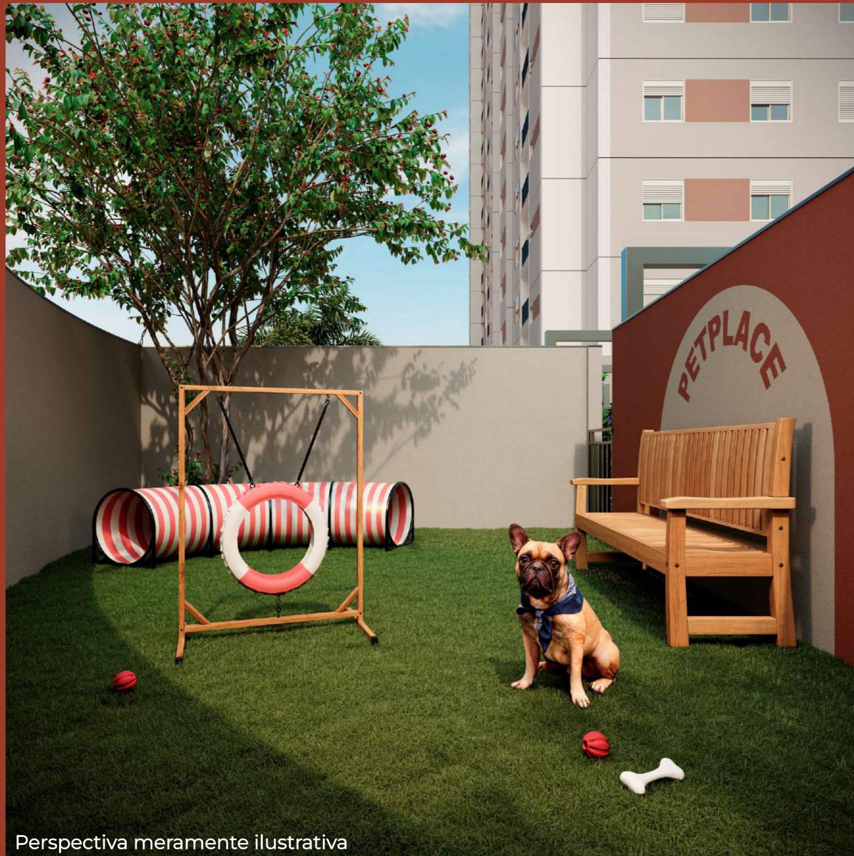
Perspectiva meramente ilustrativa