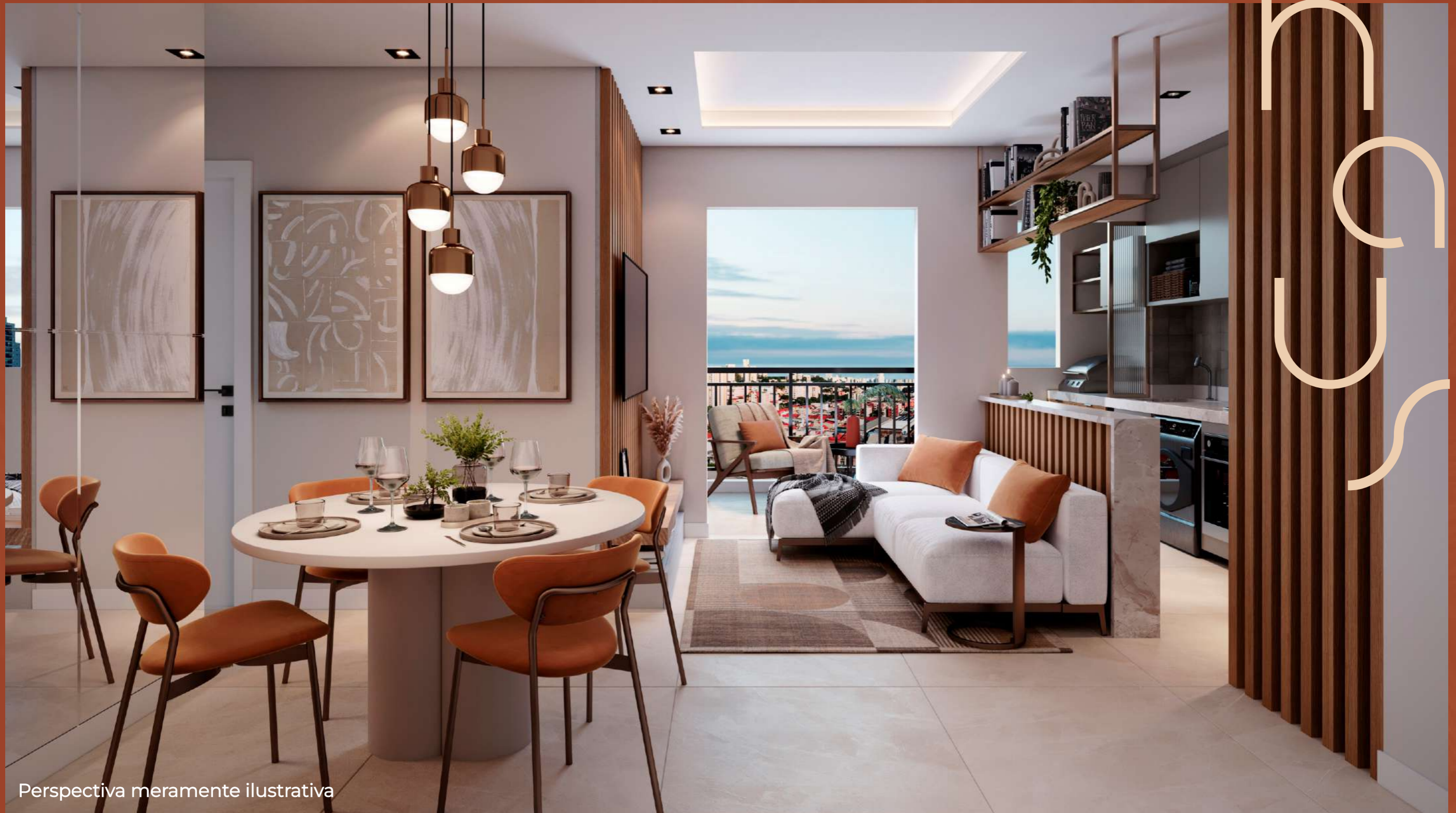
Perspectiva meramente ilustrativa