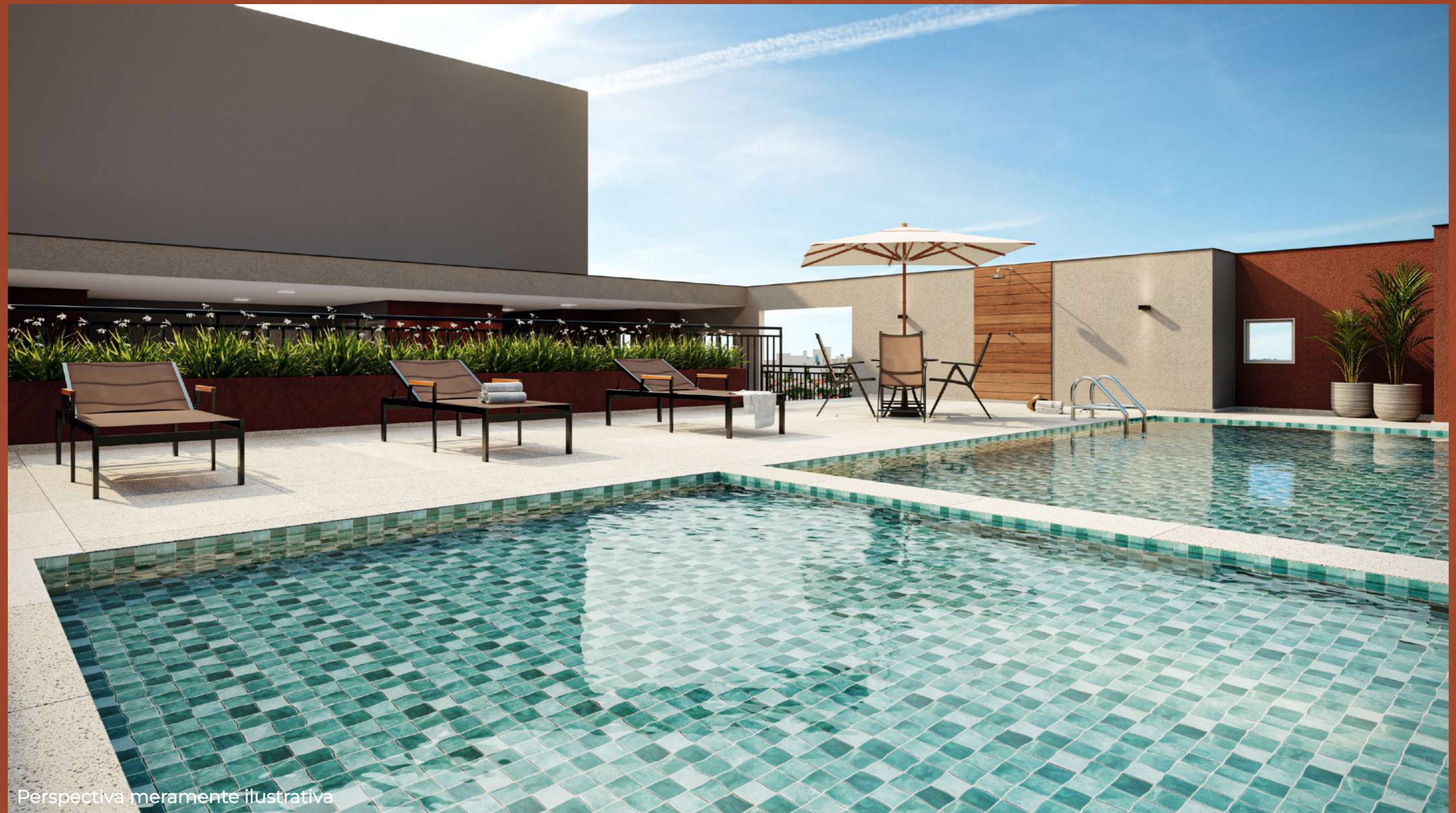
Perspectiva meramente ilustrativa