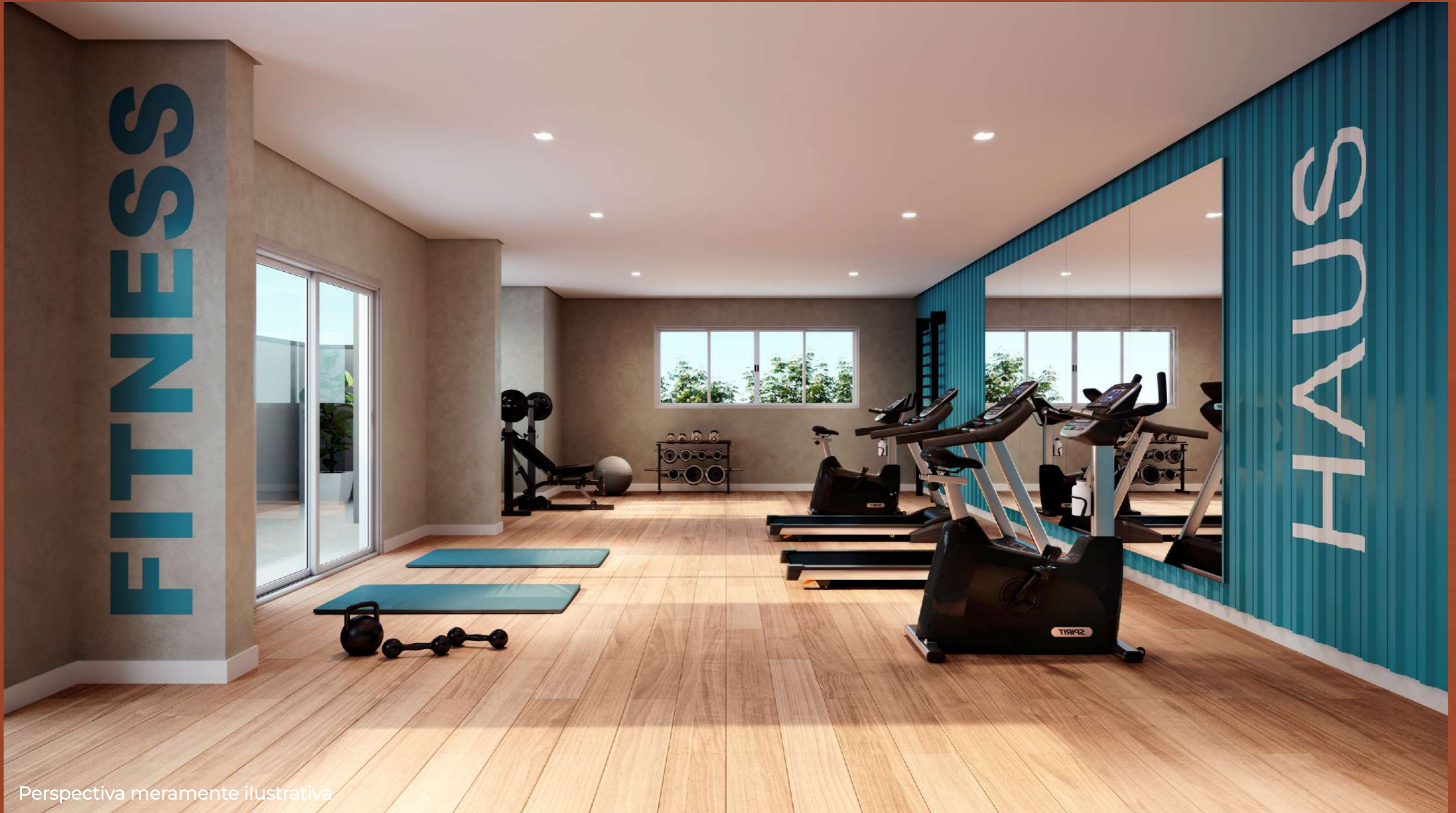
Perspectiva meramente ilustrativa