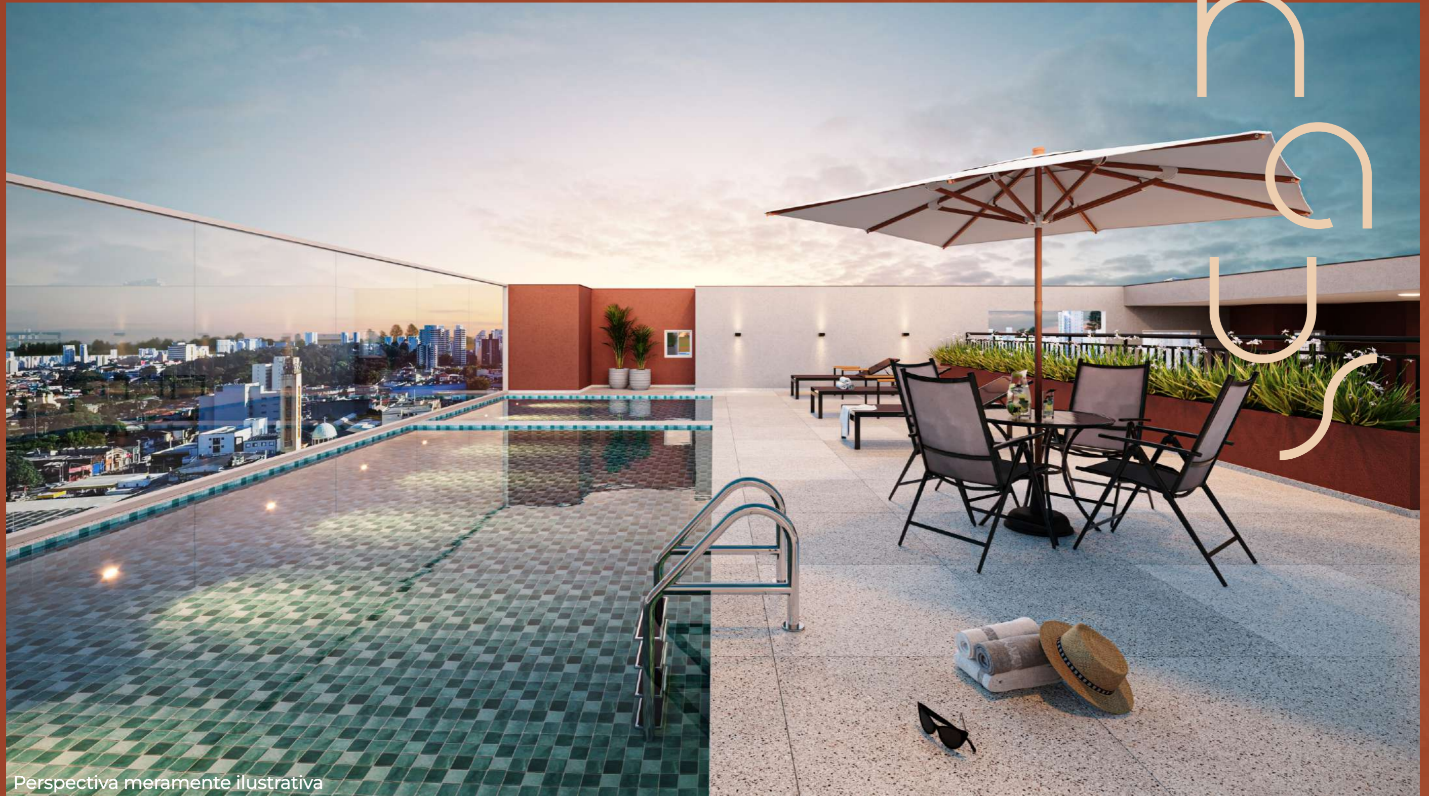
Perspectiva meramente ilustrativa