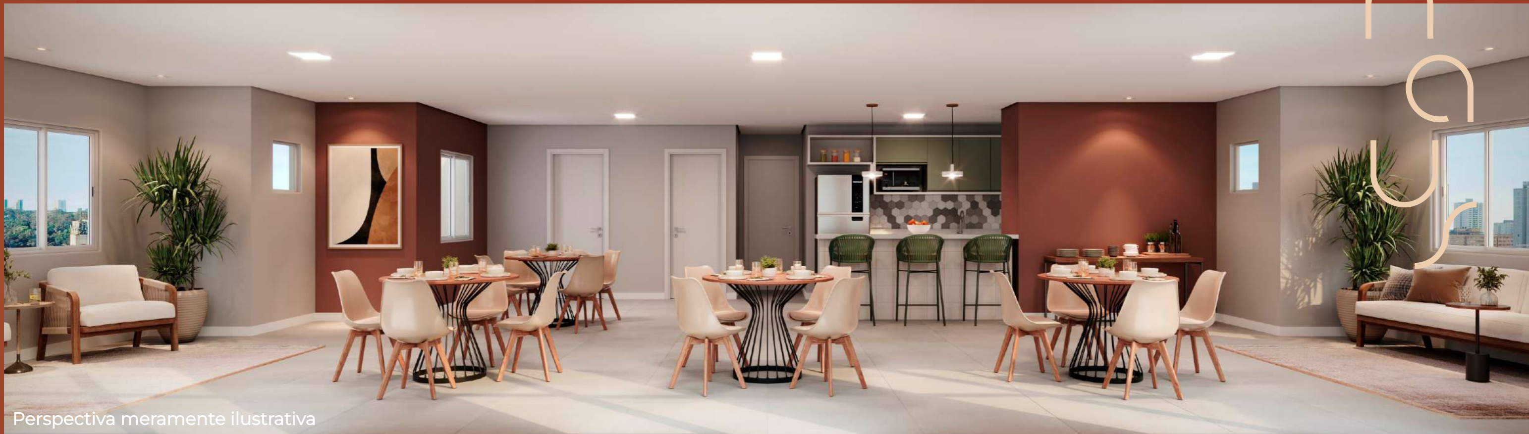
Perspectiva meramente ilustrativa