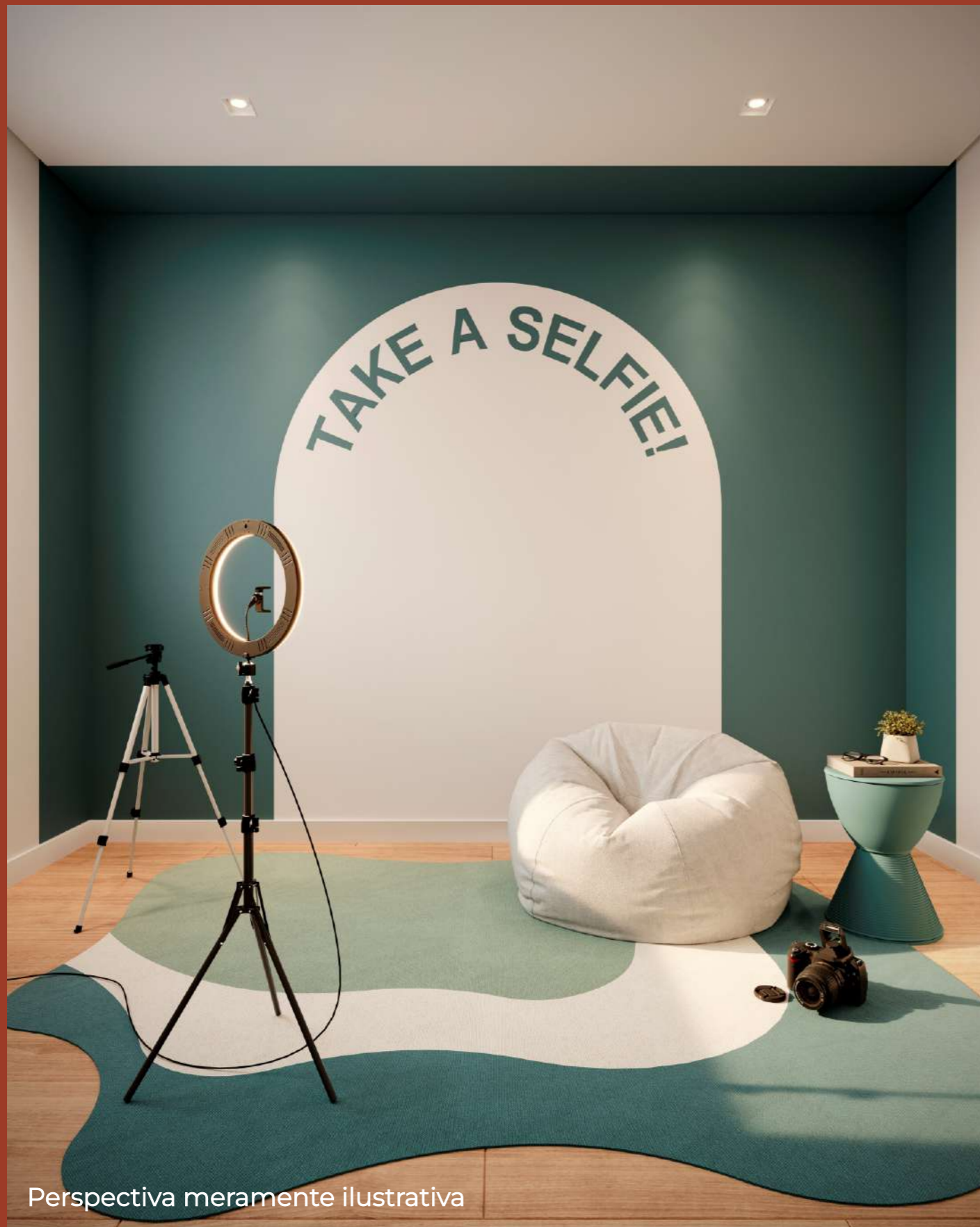
Perspectiva meramente ilustrativa