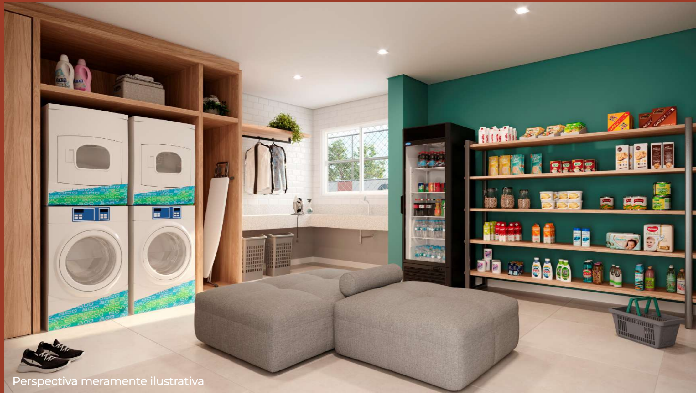
Perspectiva meramente ilustrativa