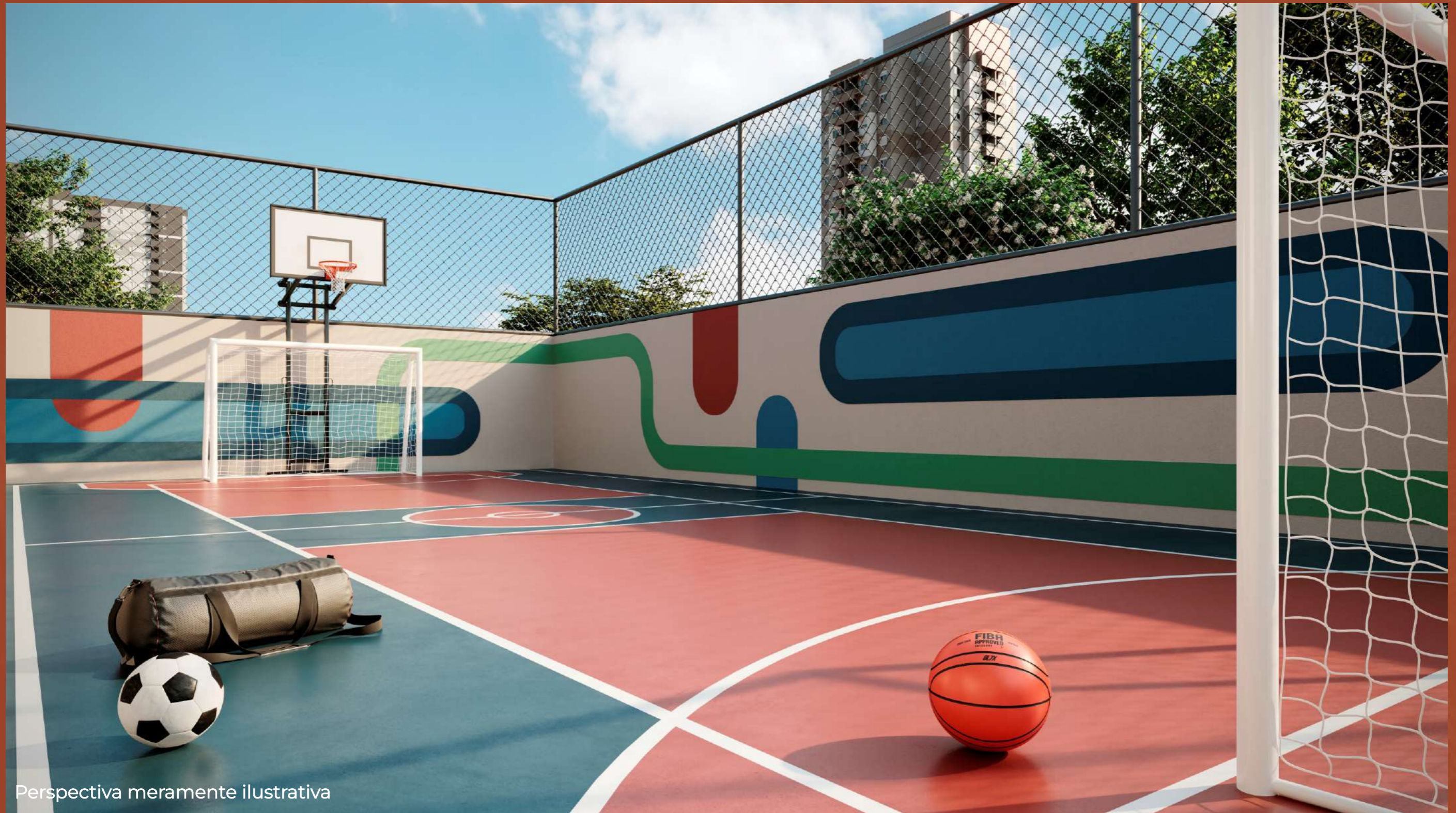
Perspectiva meramente ilustrativa