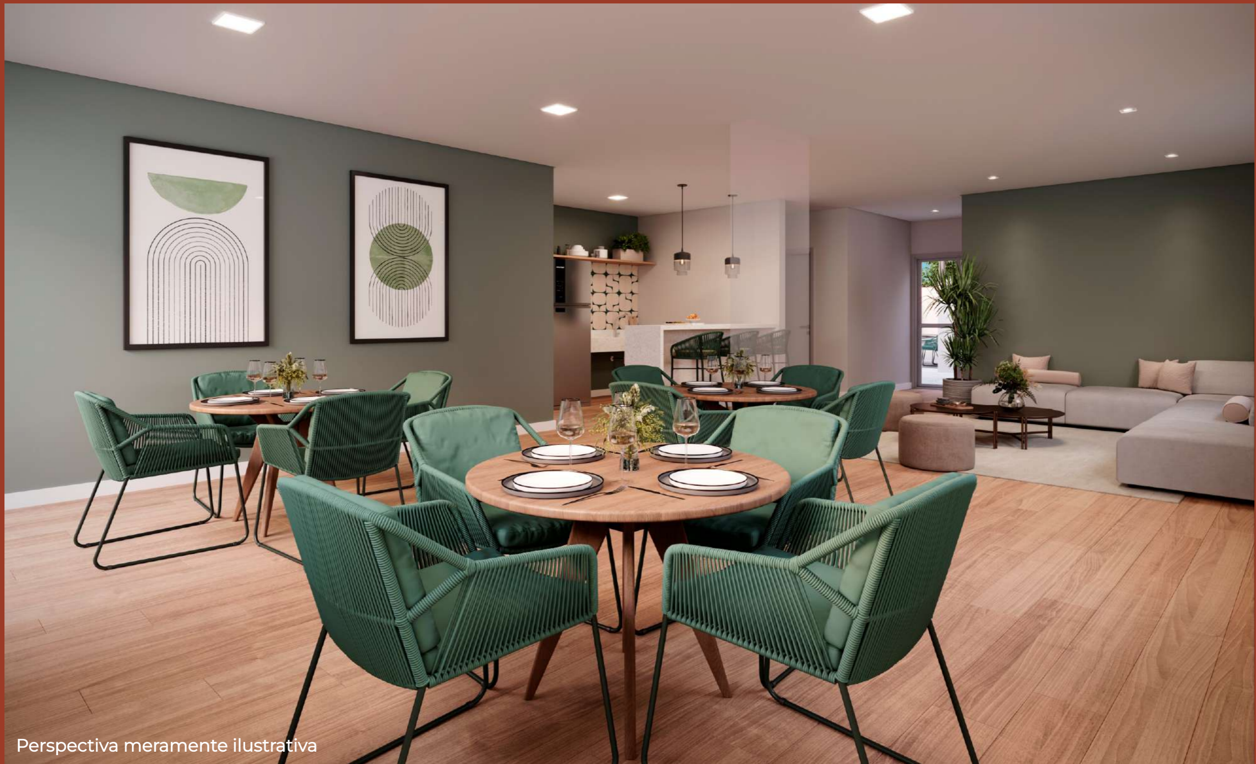
Perspectiva meramente ilustrativa