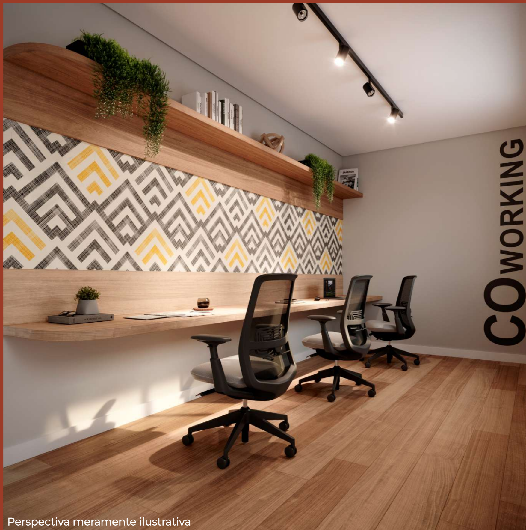
Perspectiva meramente ilustrativa

ANAZARÉ | 51 CONSTRUTORA & INCORPORADORA ANOS