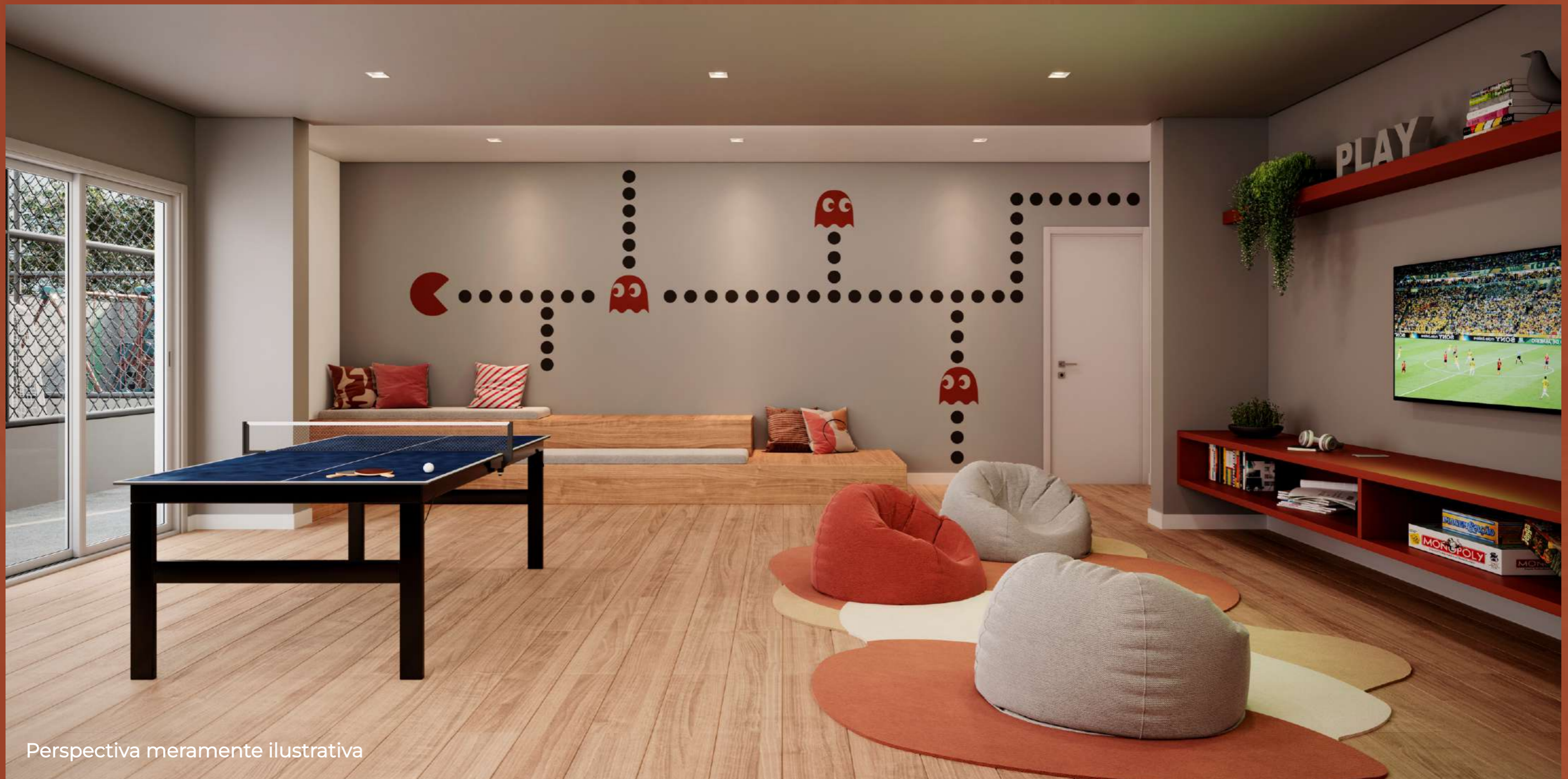
Perspectiva meramente ilustrativa