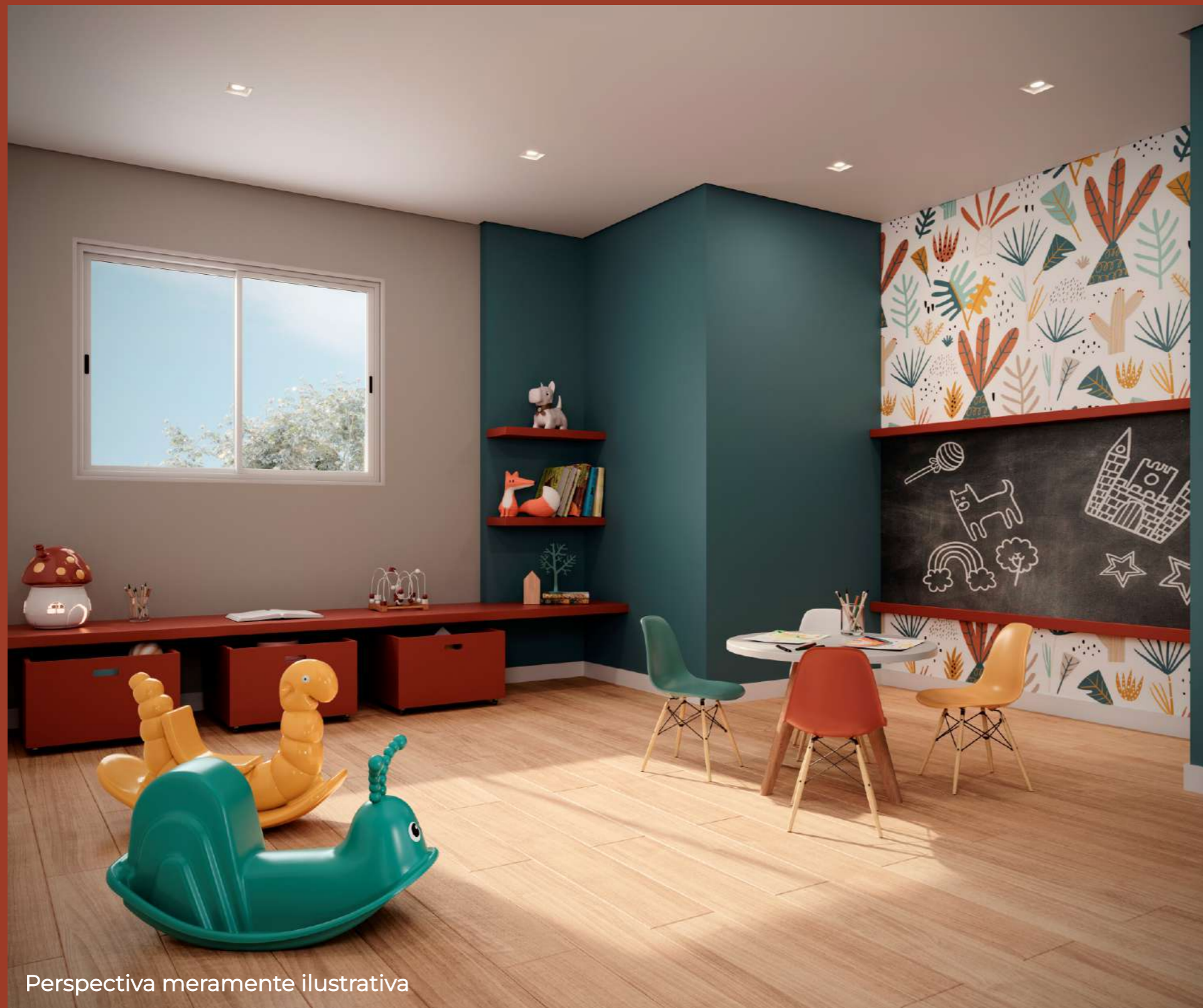
Perspectiva meramente ilustrativa