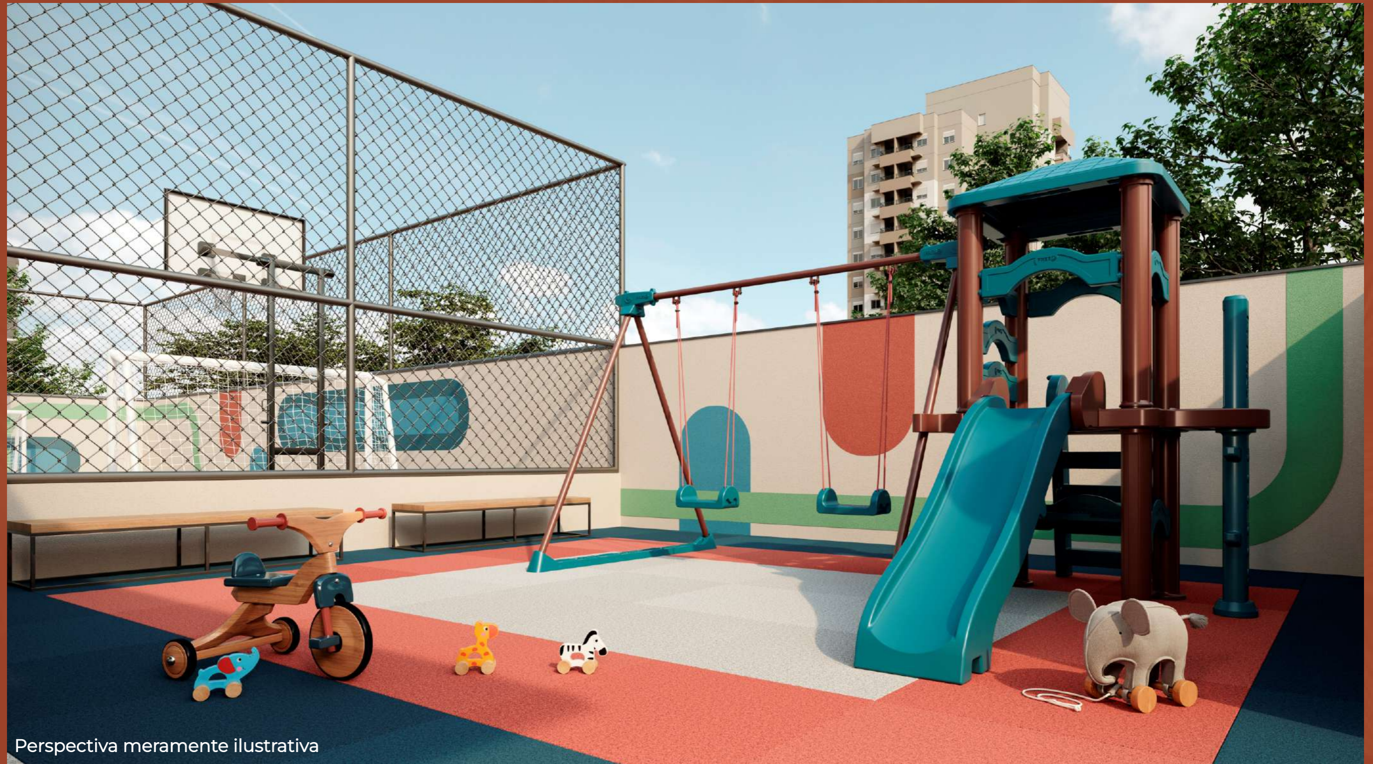
Perspectiva meramente ilustrativa