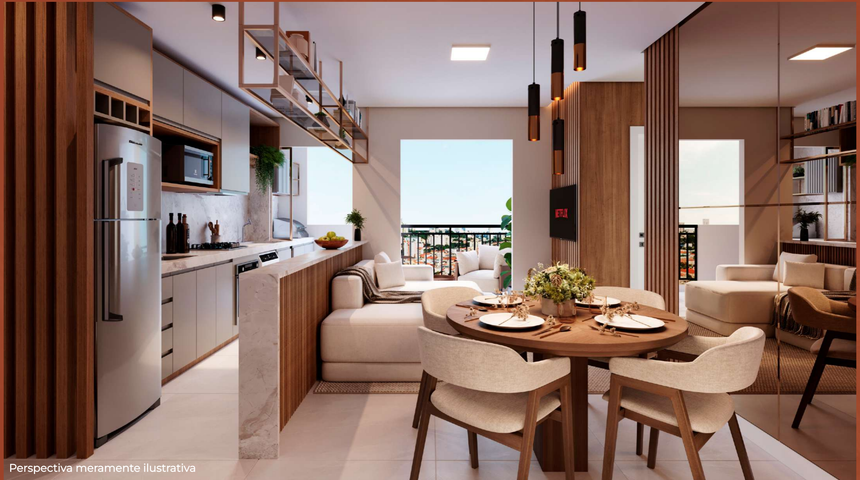
Perspectiva meramente ilustrativa