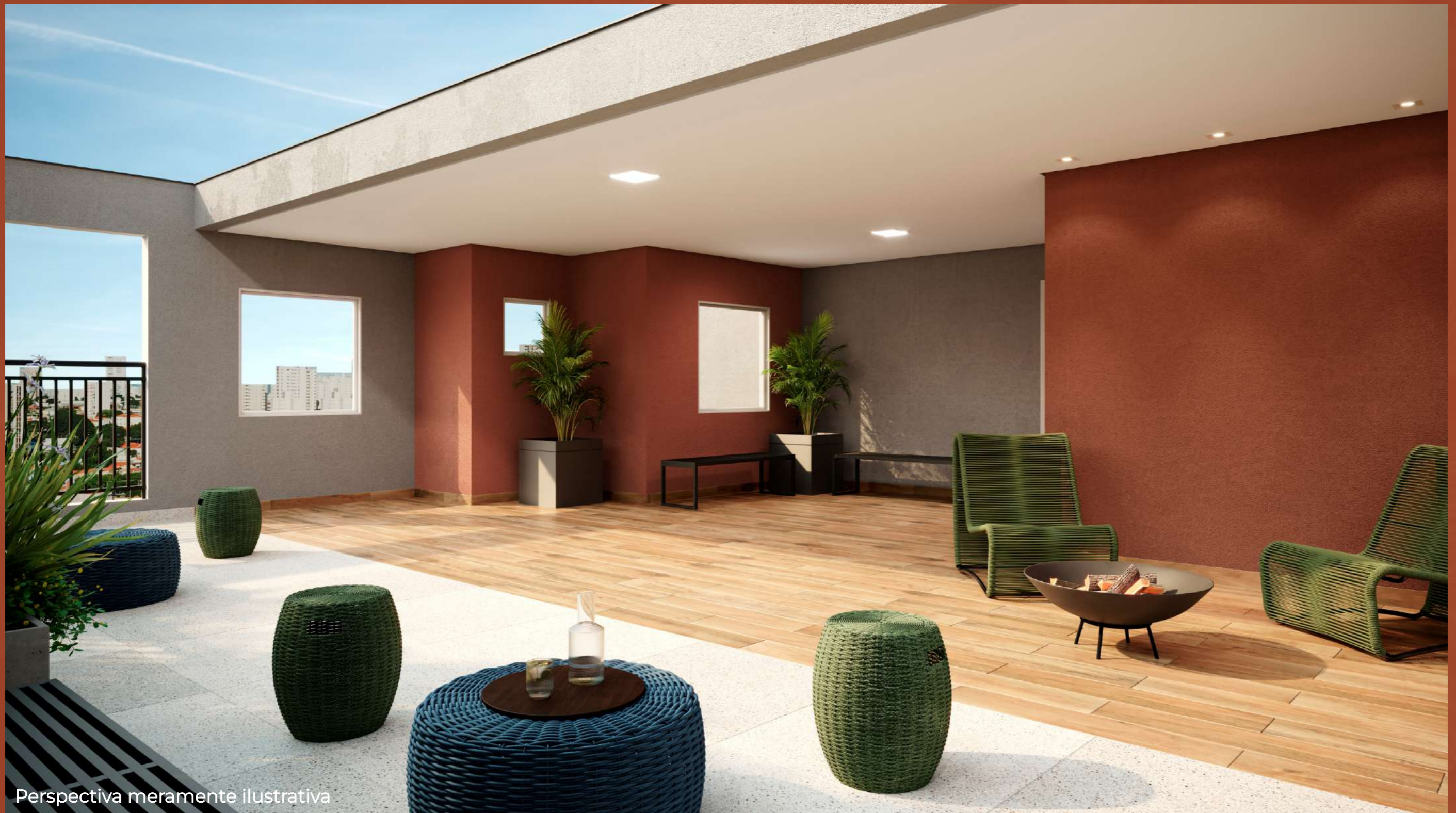
Perspectiva meramente ilustrativa