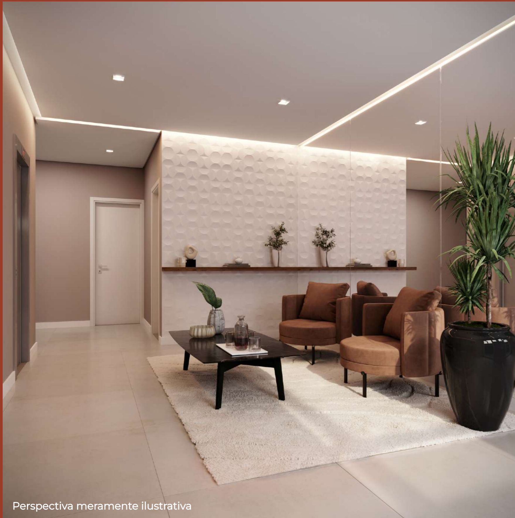
Perspectiva meramente ilustrativa