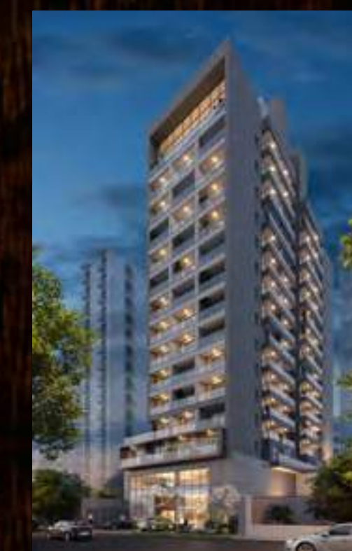
BELINT BELA CINTRA