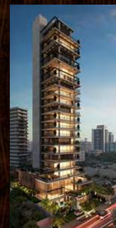
AGIA FARIA LIMA