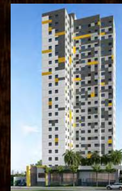
GO BARRA FUNDA