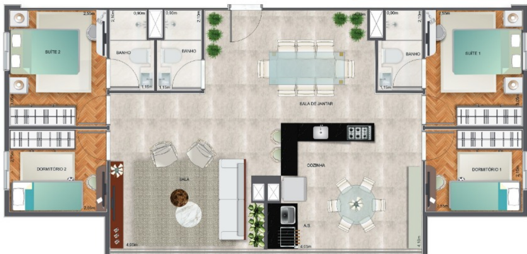
PLANTA APARTAMENTO DUPLO - 4 DORMITÓRIOS