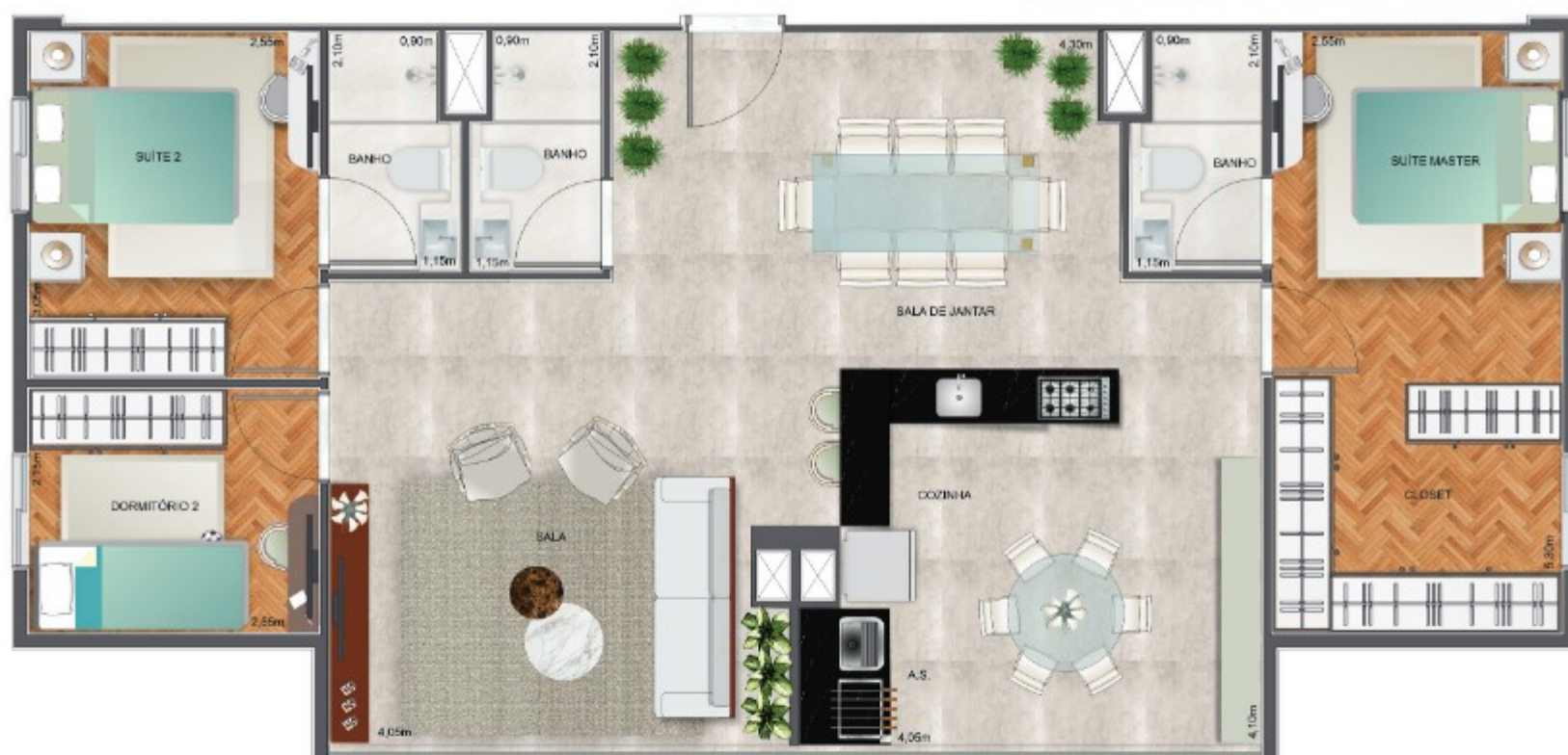
PLANTA APARTAMENTO DUPLO - 3 DORMITÓRIOS