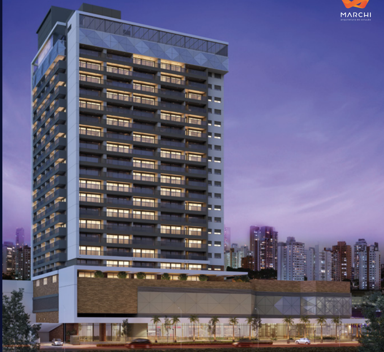
Perspectiva artística da fachada.