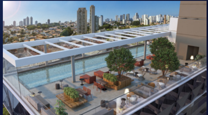
Perspectiva artística da piscina aquecida com skyline.