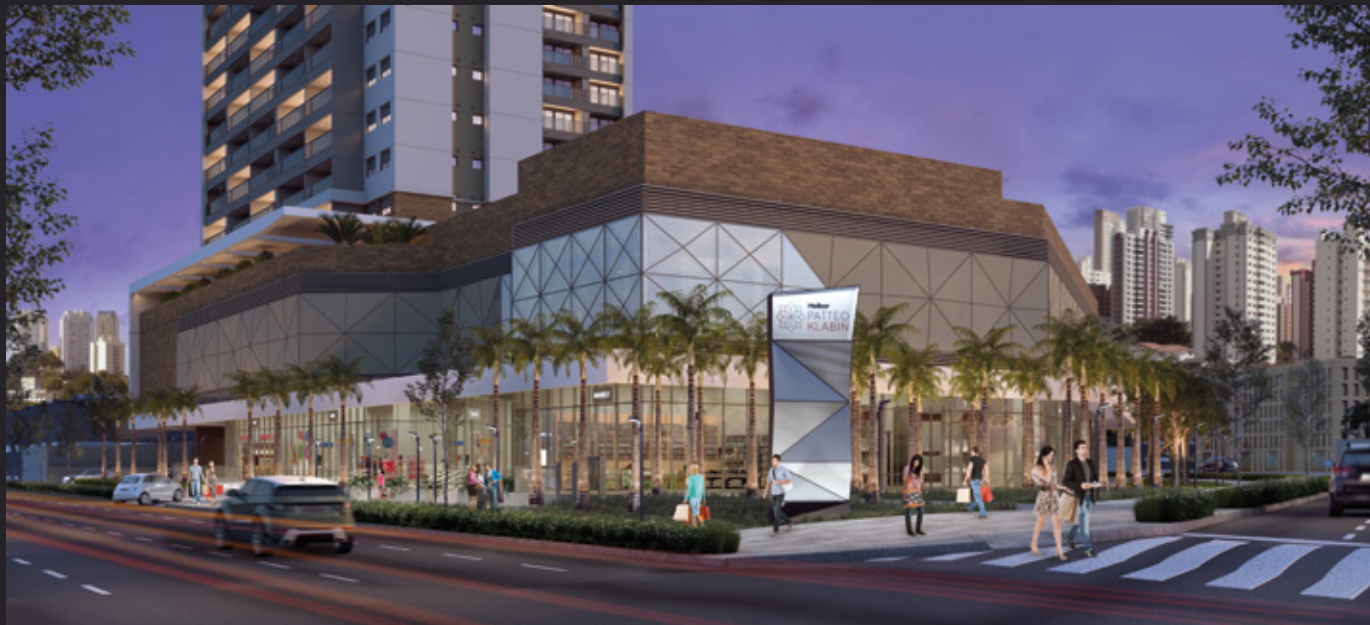
Perspectiva artística do acesso ao ComVem.

O supermall ComVem Patteo Klabin oferece uma variedade de serviços. Você tem entretenimento com 4 salas de cinema Cinépolis e muito mais opções de alimentação, serviço e conveniência. Para chegar lá? É só chamar o elevador.