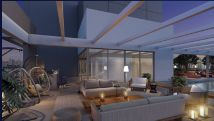
Perspectiva artística do rooftop.

ESPAÇO LOUNGE NO ROOFTOP E PISCINA ADULTO AQUECIDA COM RAIA DE 25 M.