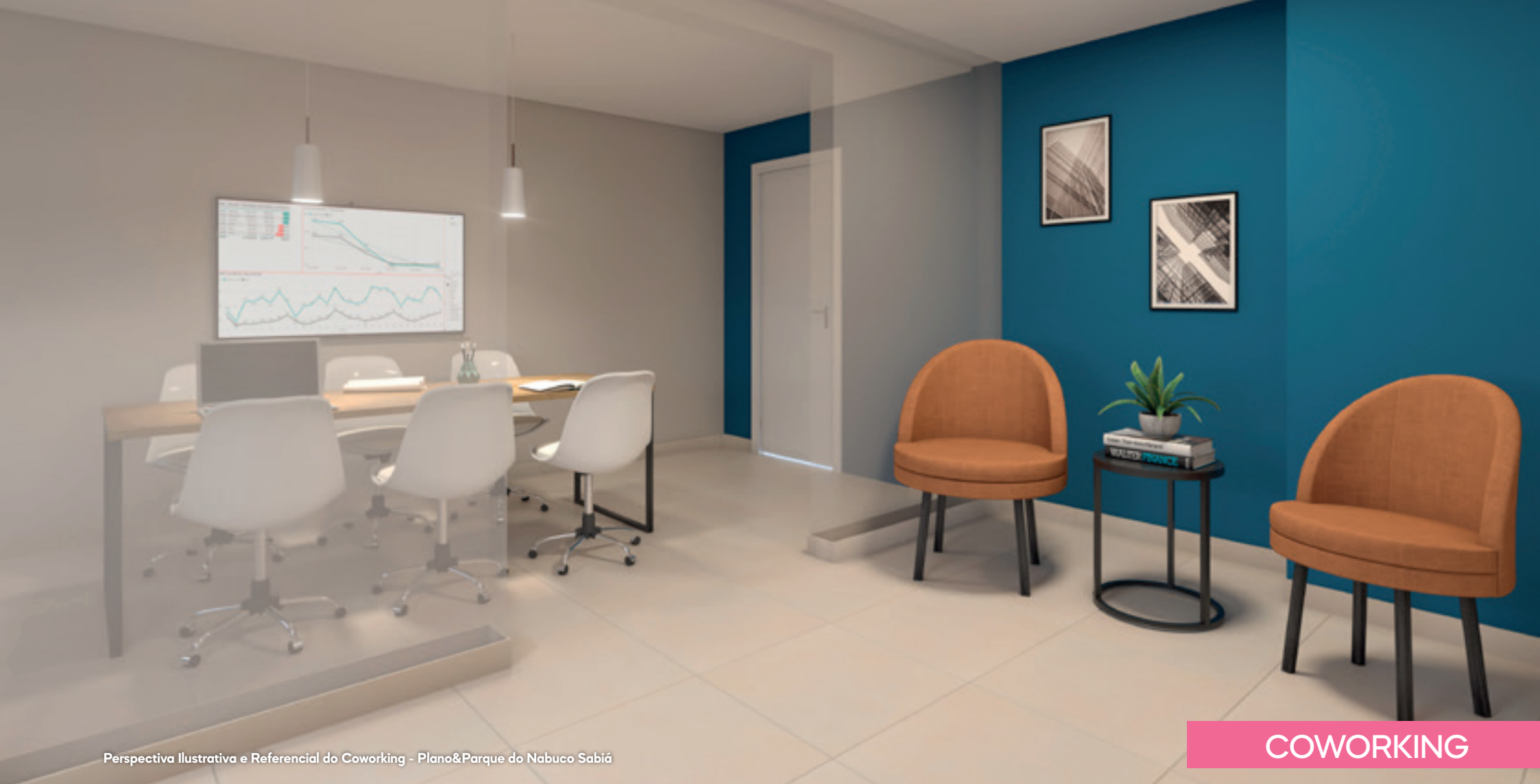
Perspectiva Ilustrativa e Referencial do Coworking - Plano&Parque do Nabuco Sabiá