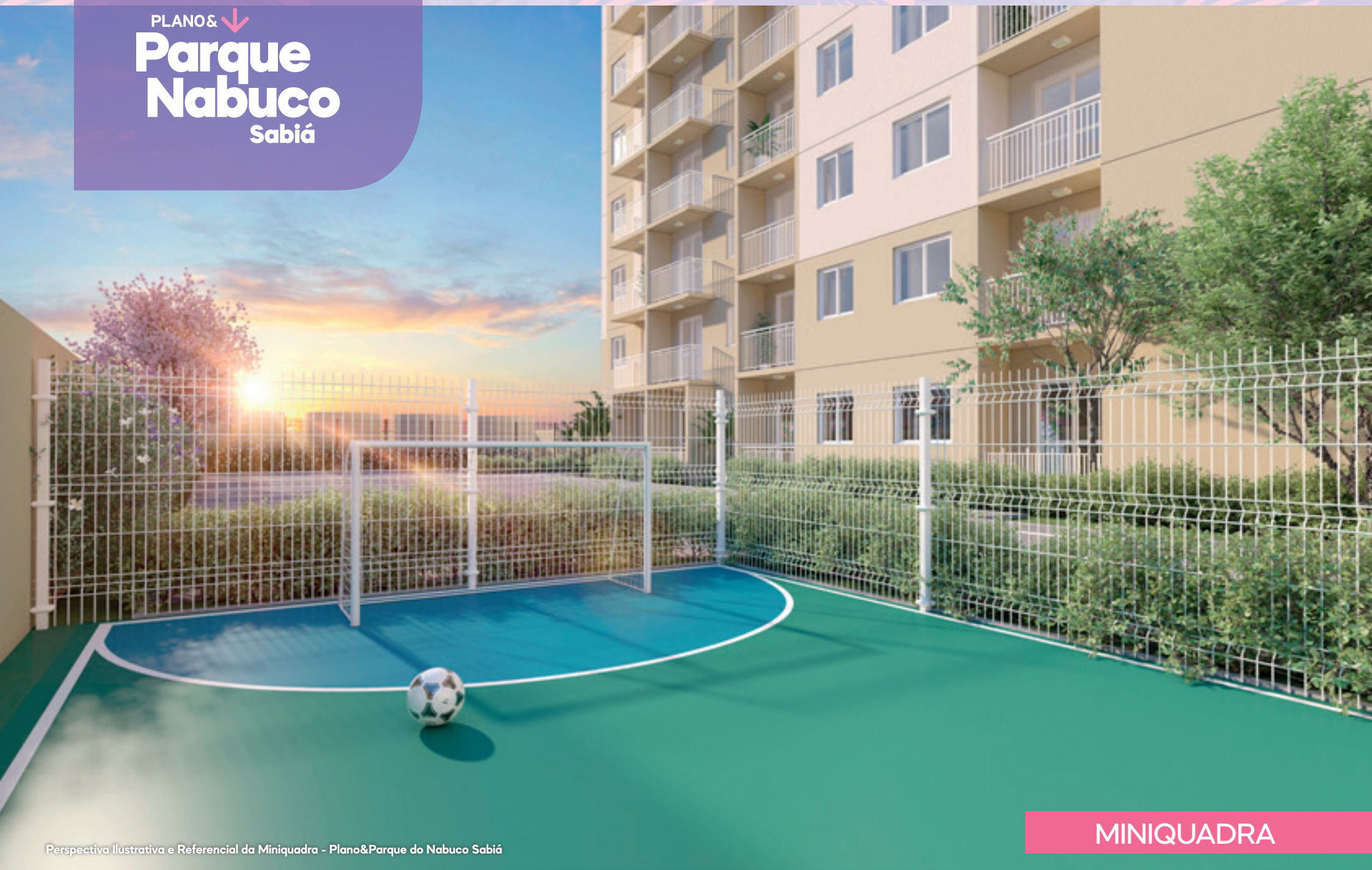
Perspectiva Ilustrativa e Referencial da Miniquadra - Plano&Parque do Nabuco Sabiá