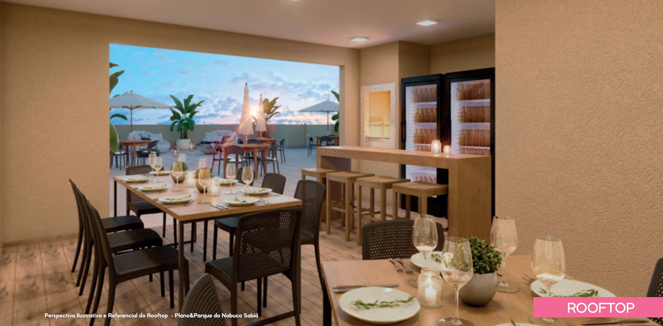
Perspectiva Ilustrativa e Referencial do Rooftop - Plano&Parque do Nabuco Sabiá