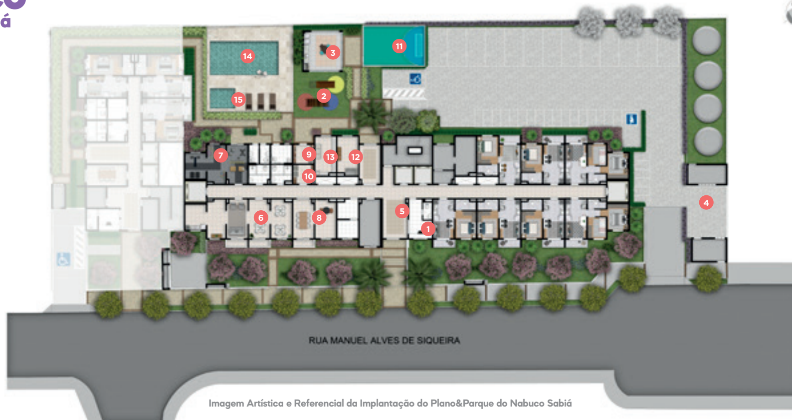
Imagem Artística e Referencial da Implantação do Plano&Parque do Nabuco Sabiá