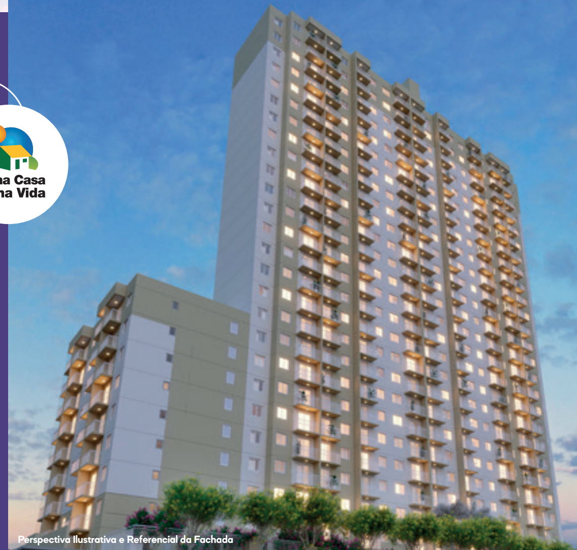
Perspectiva Ilustrativa e Referencial da Fachada