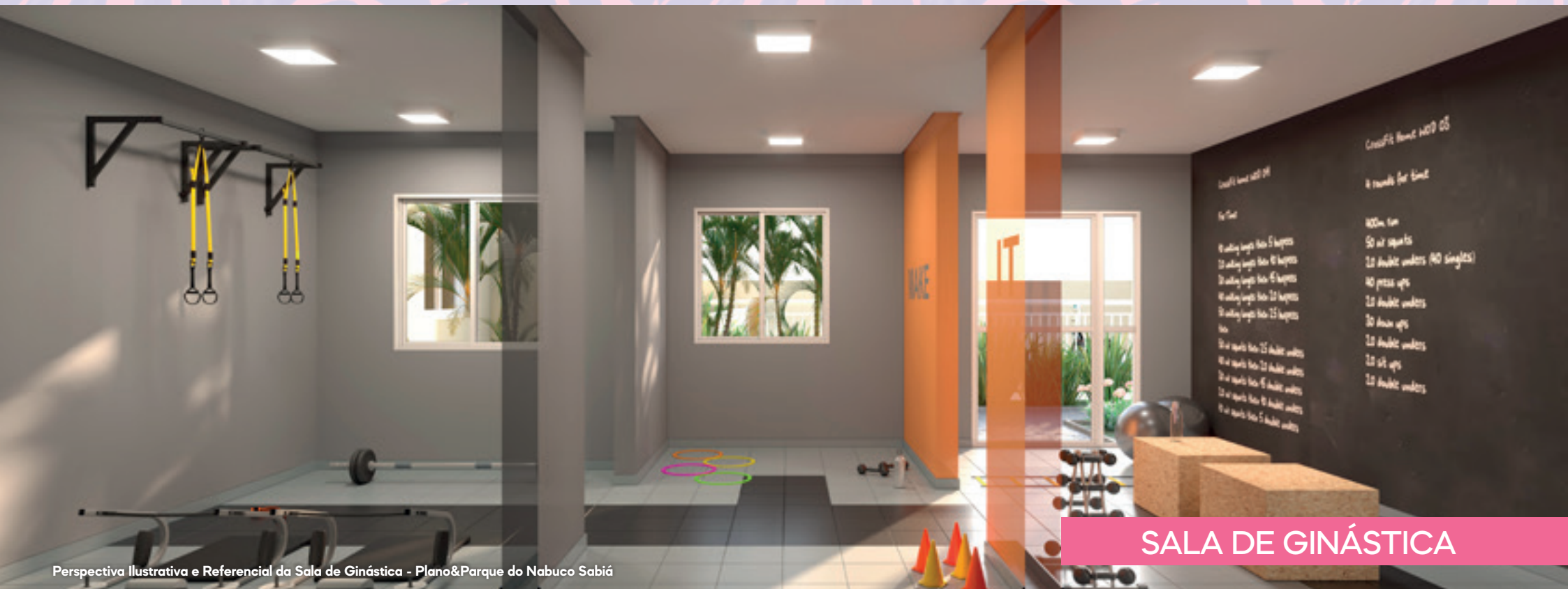
Perspectiva Ilustrativa e Referencial da Sala de Ginástica - Plano&Parque do Nabuco Sabiá