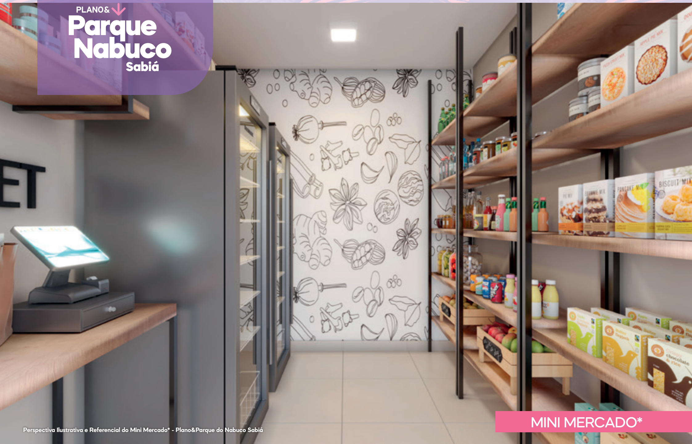
Perspectiva Ilustrativa e Referencial do Mini Mercado* - Plano&Parque do Nabuco Sabiá