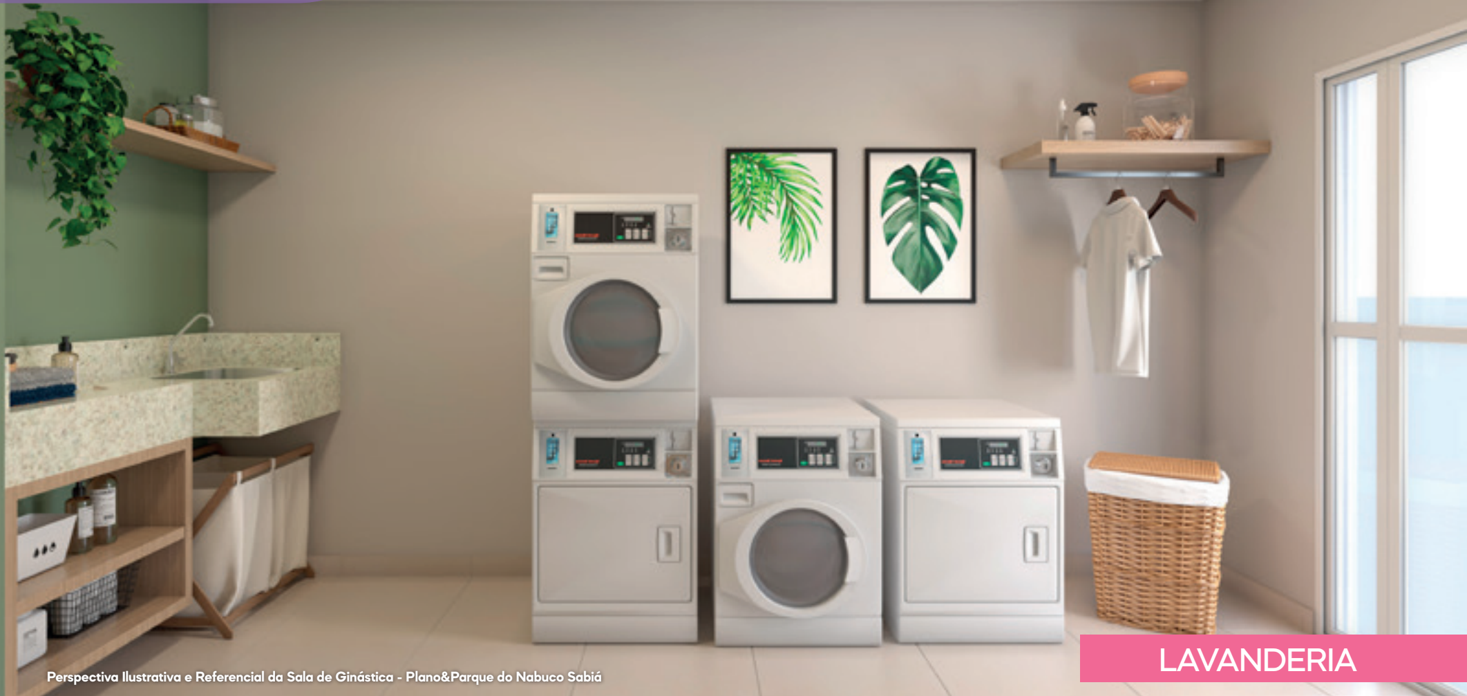
Perspectiva Ilustrativa e Referencial da Sala de Ginástica - Plano&Parque do Nabuco Sabiá