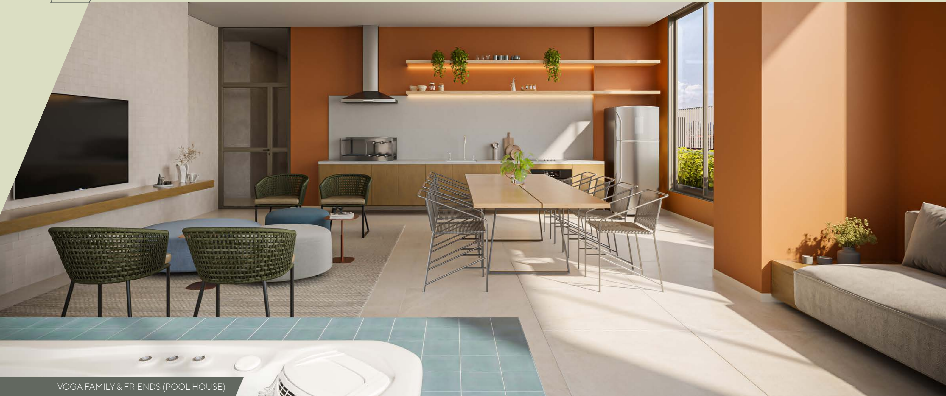
VOGA FAMILY & FRIENDS (POOL HOUSE)