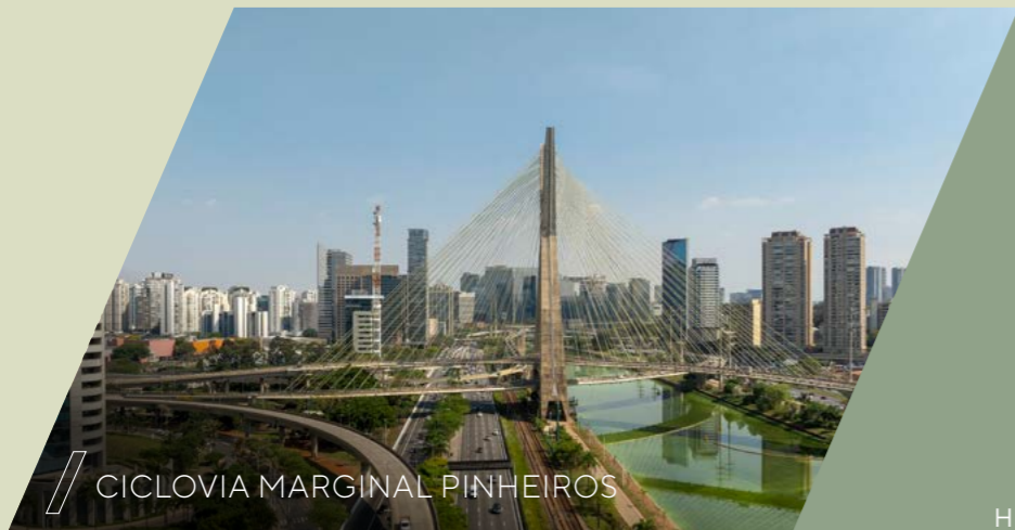
CICLOVIA MARGINAL PINHEIROS