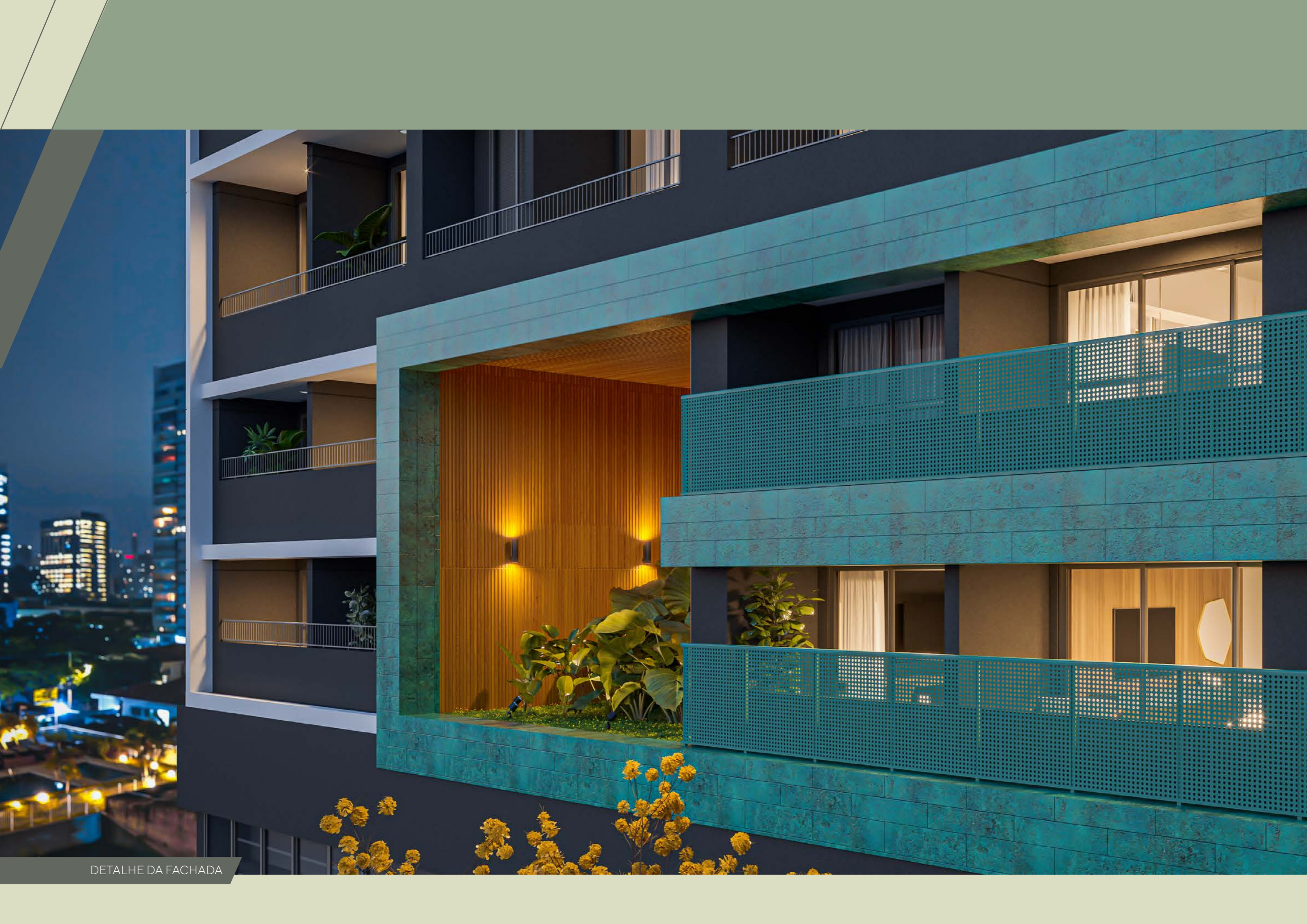
DETALHE DA FACHADA