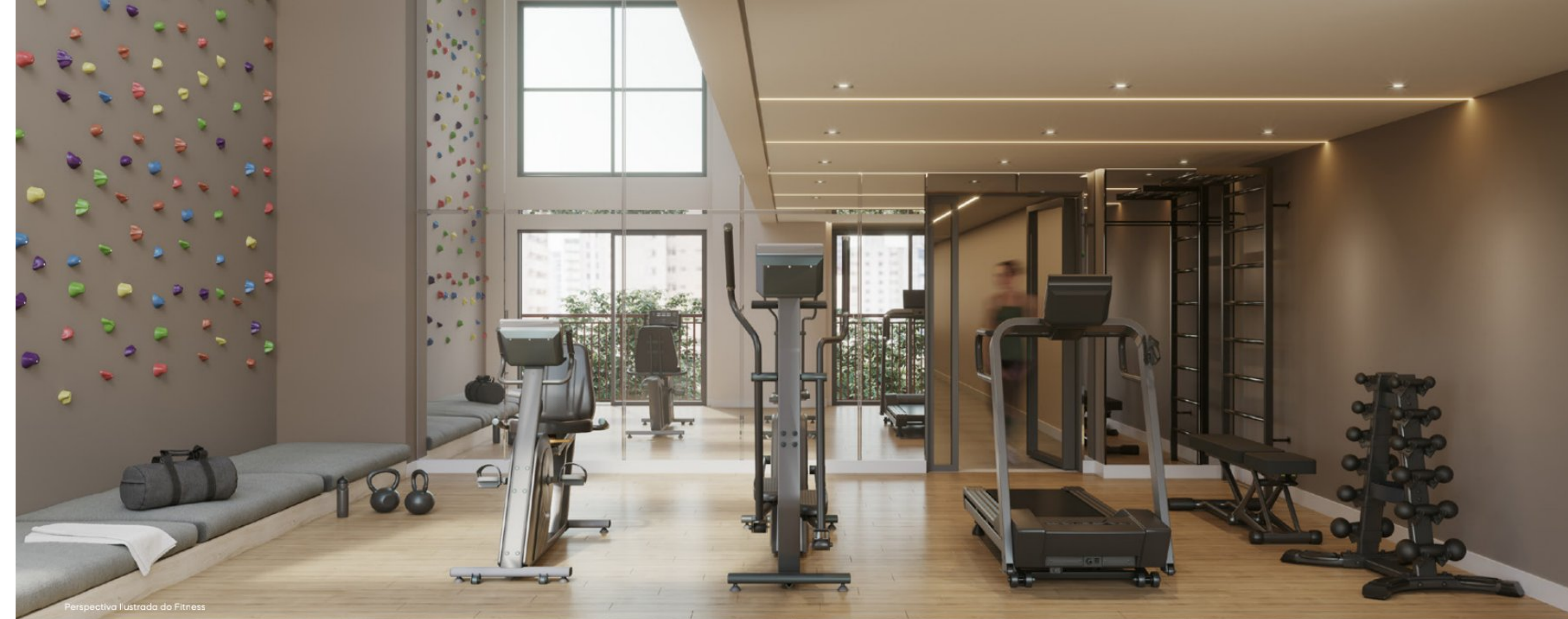
Perspectiva Ilustrada do Fitness

A praticidade essencial para o seu dia a dia.