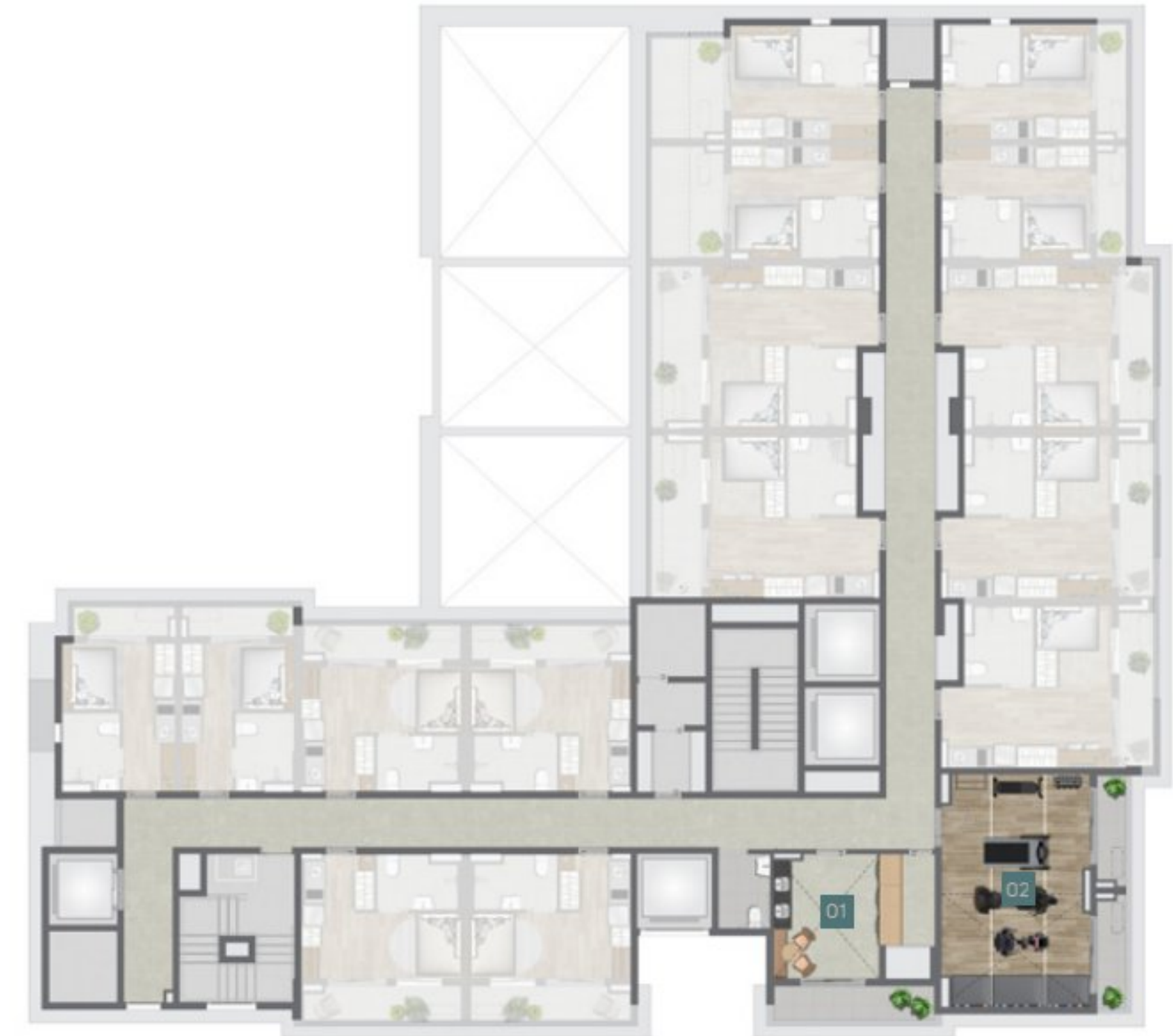
Imagem Ilustrada da Implantação do 3º Pavimento