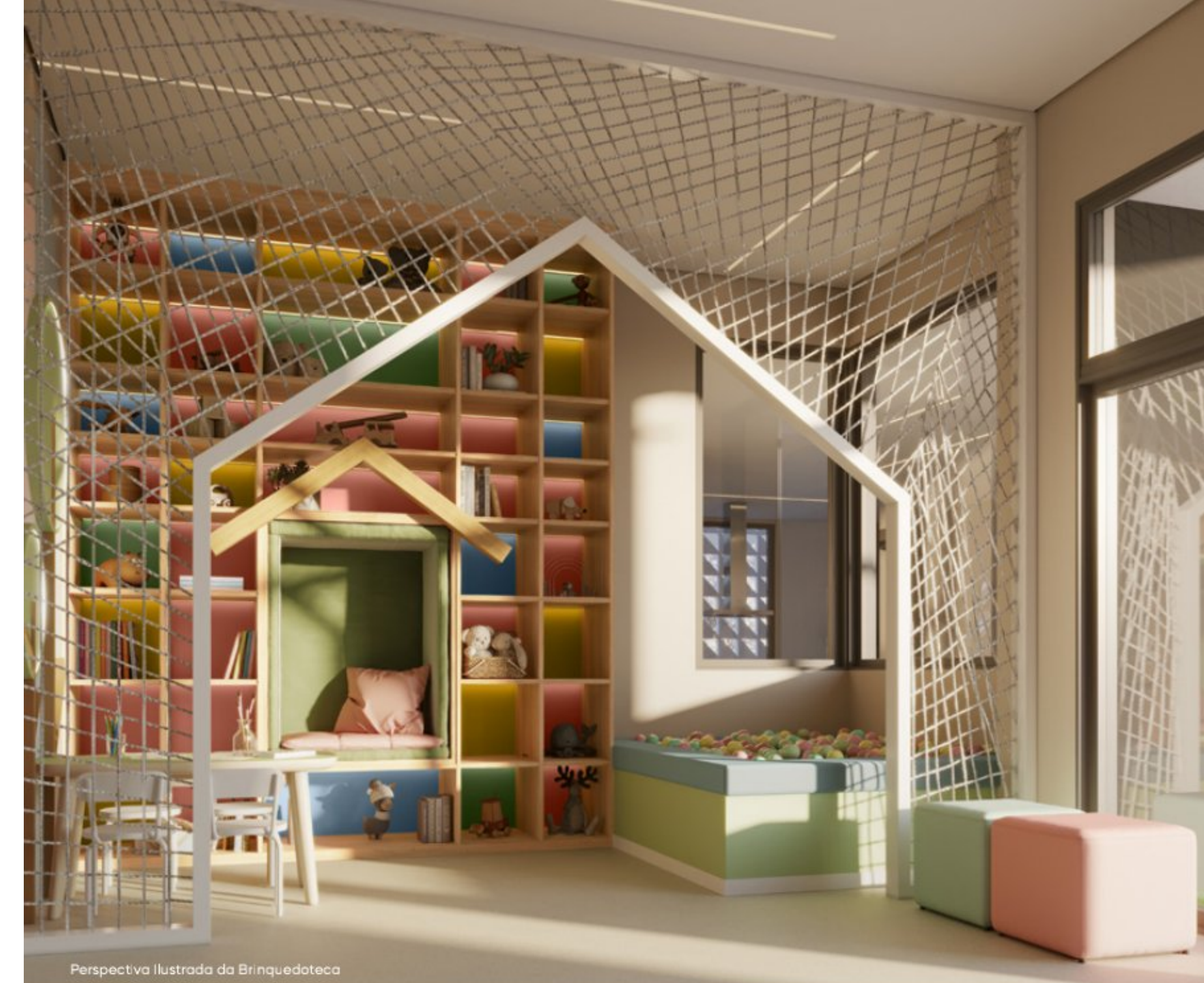
Perspectiva Ilustrada da Brinquedoteca

Pensado sob medida para um desenvolvimento sem limites.