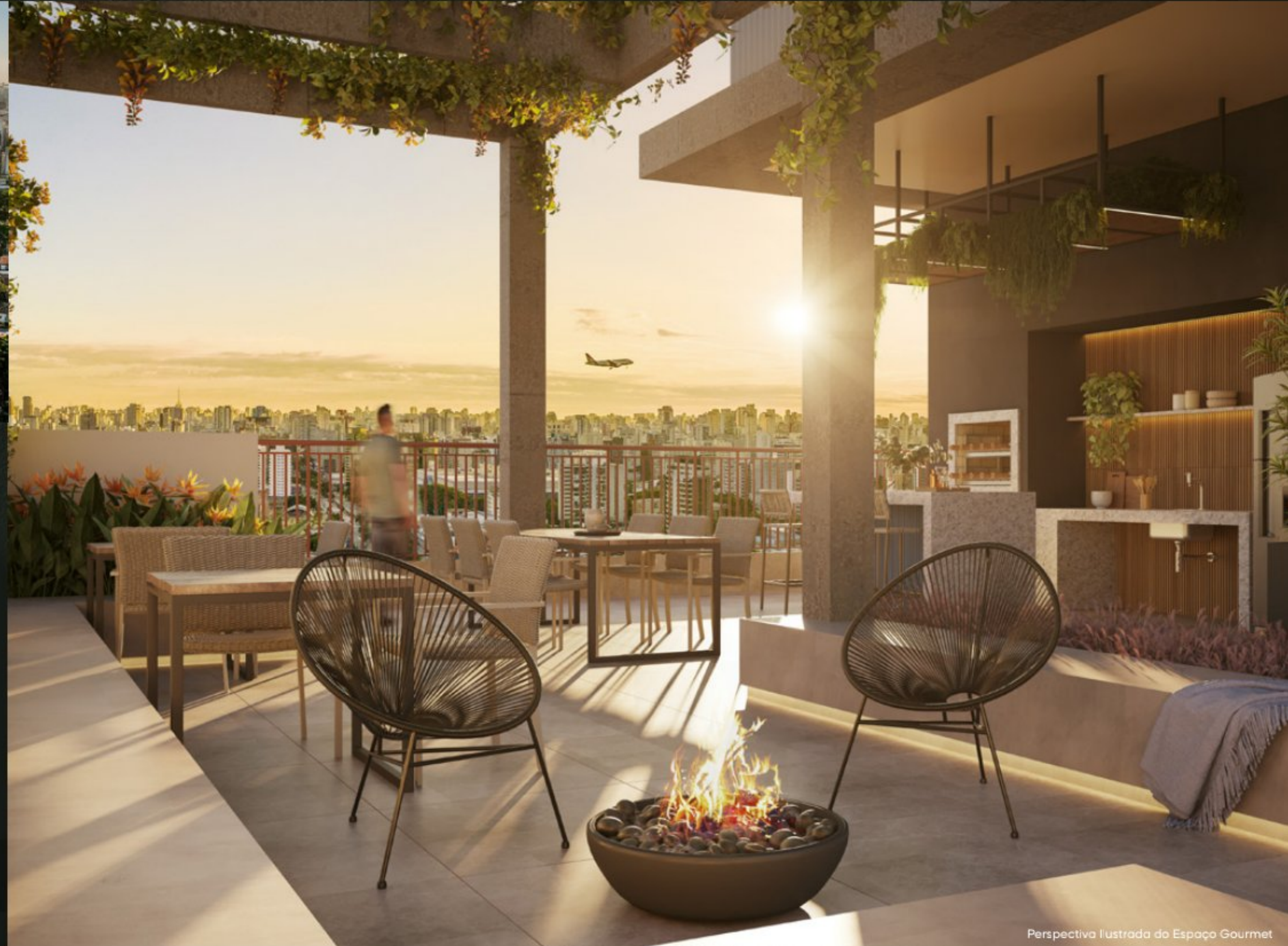
Perspectiva Ilustrada do Espaço Gourmet

Um Rooftop com lazer diferenciado que eleva você a outro nível.