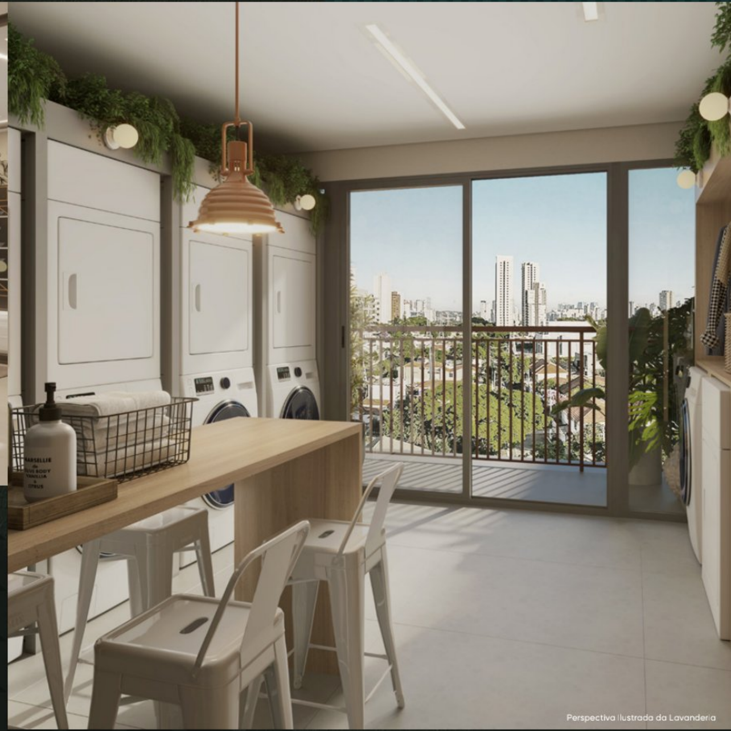
Perspectiva Ilustrada da Lavanderia