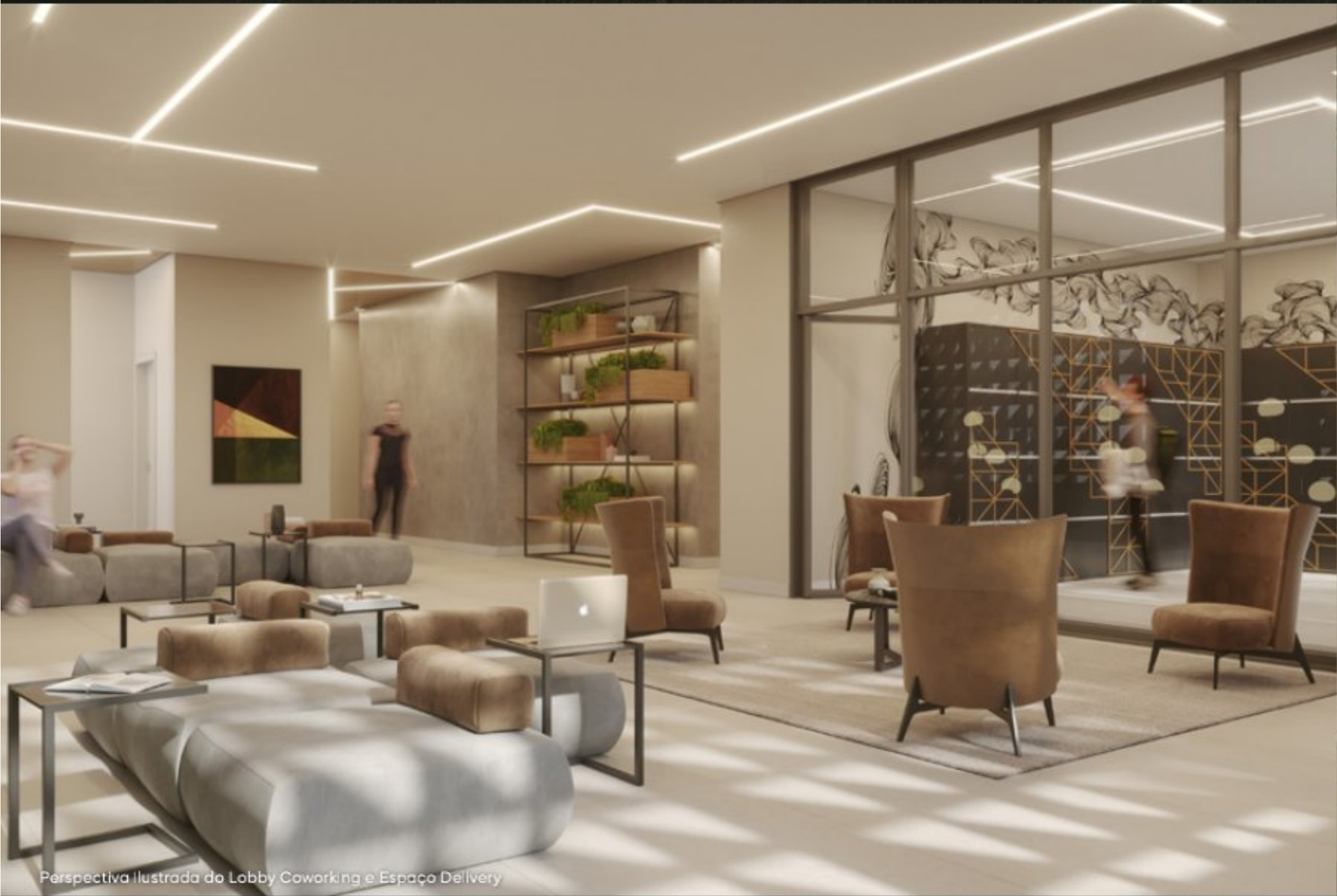
Perspectiva Ilustrada do Lobby Coworking e Espaço Delivery