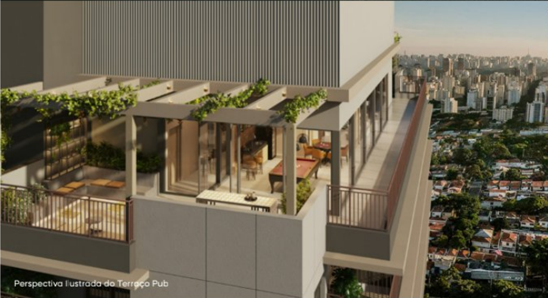
Perspectiva Ilustrada do Terraço Pub

Um Rooftop com lazer diferenciado que eleva você a outro nível.