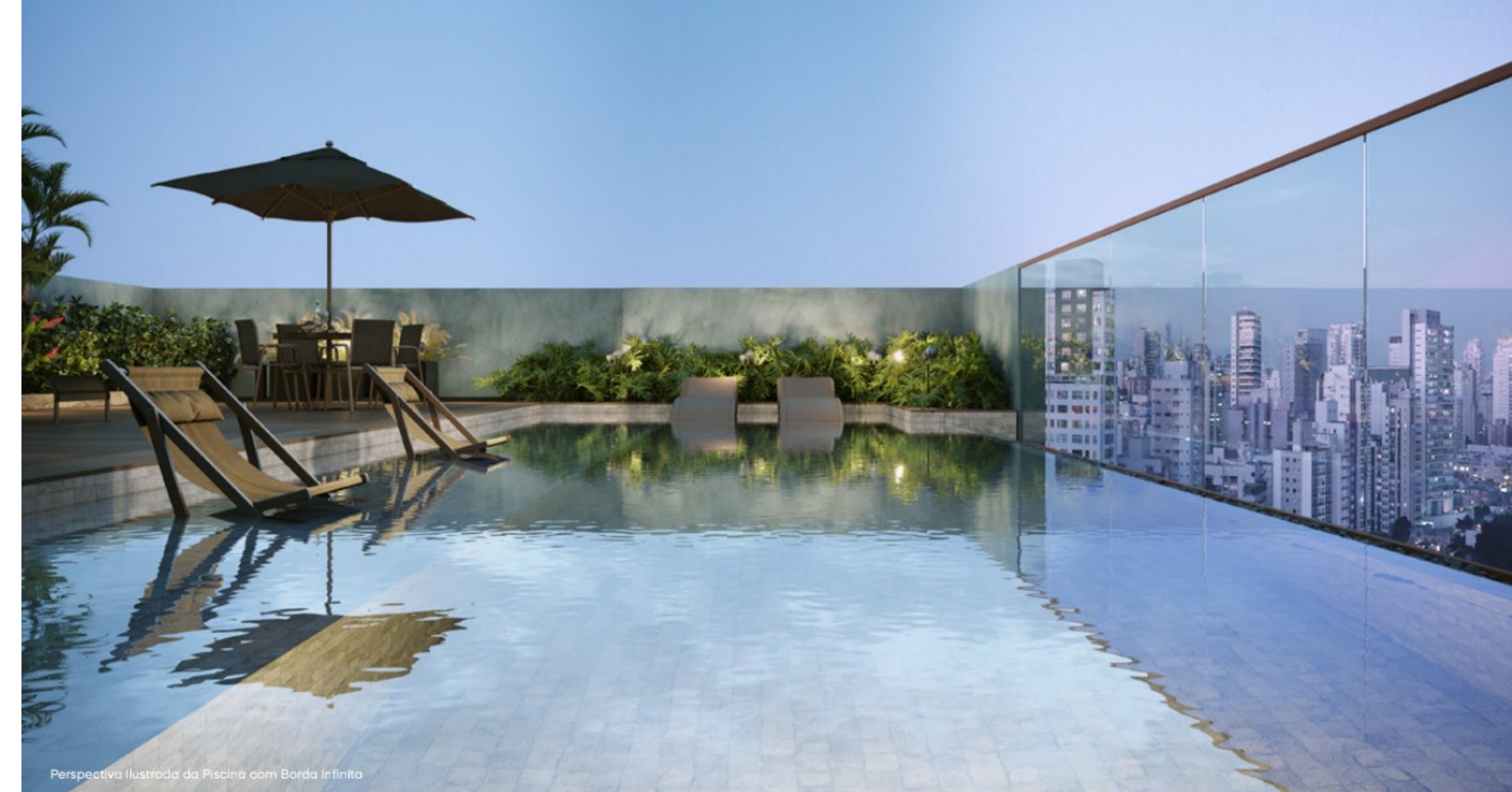
Perspectiva Ilustrada da Piscina com Borda Infinita

Concebido com o esmero e a essência de ser único.