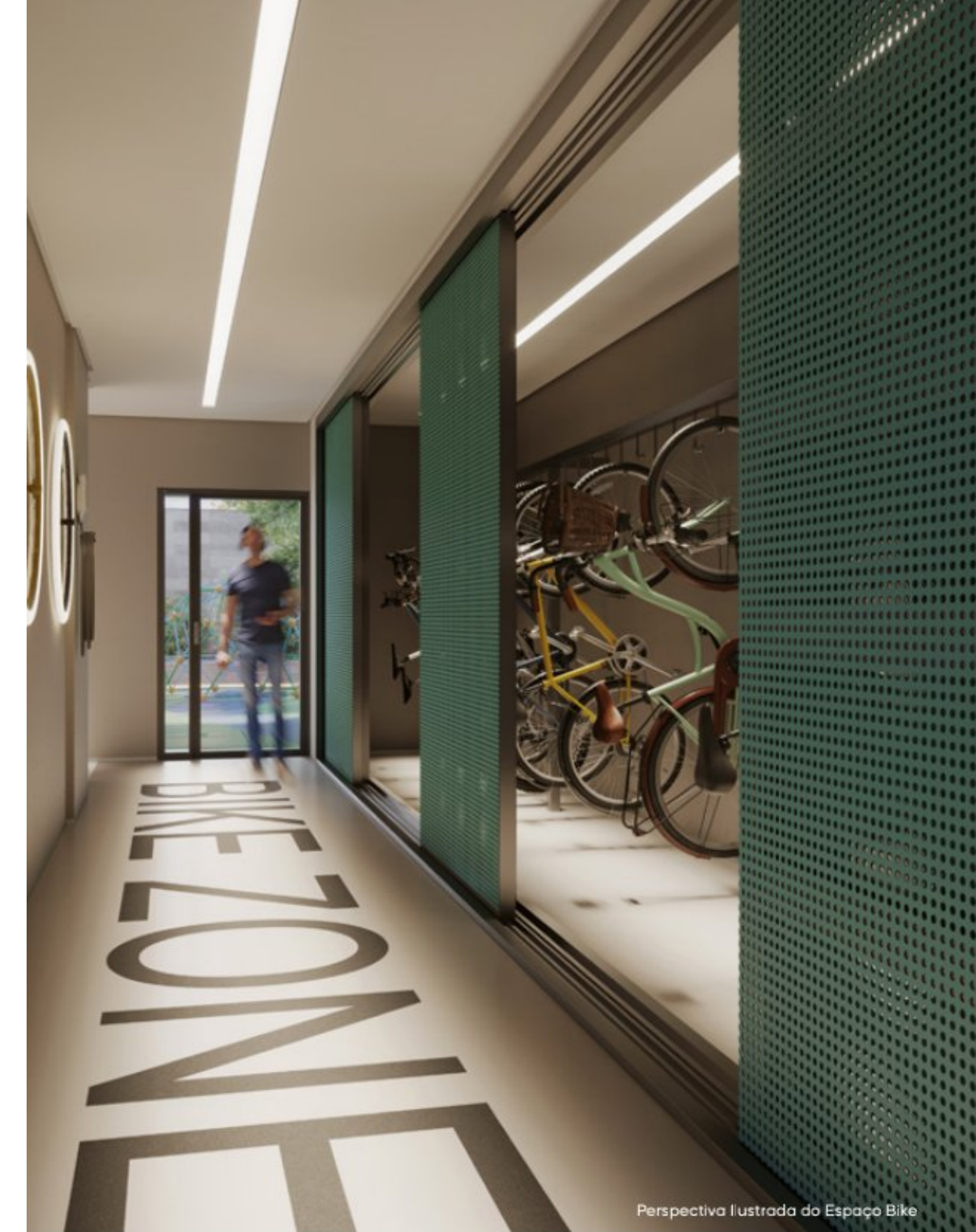
Perspectiva Ilustrada do Espaço Bike

Alto nível de equipamentos em ambientes para alta performance.