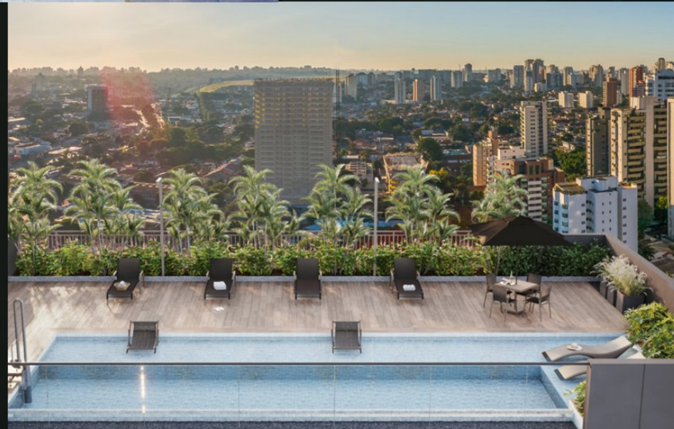
Perspectiva Ilustrada do Rooftop

Imagine viver o alto nível do bom gosto. Com lazer elevado, Oriz é sinônimo de um horizonte sob medida para você. Aqui, a piscina com borda infinita mergulha no céu do Campo Belo, proporcionando uma experiência de lazer única.