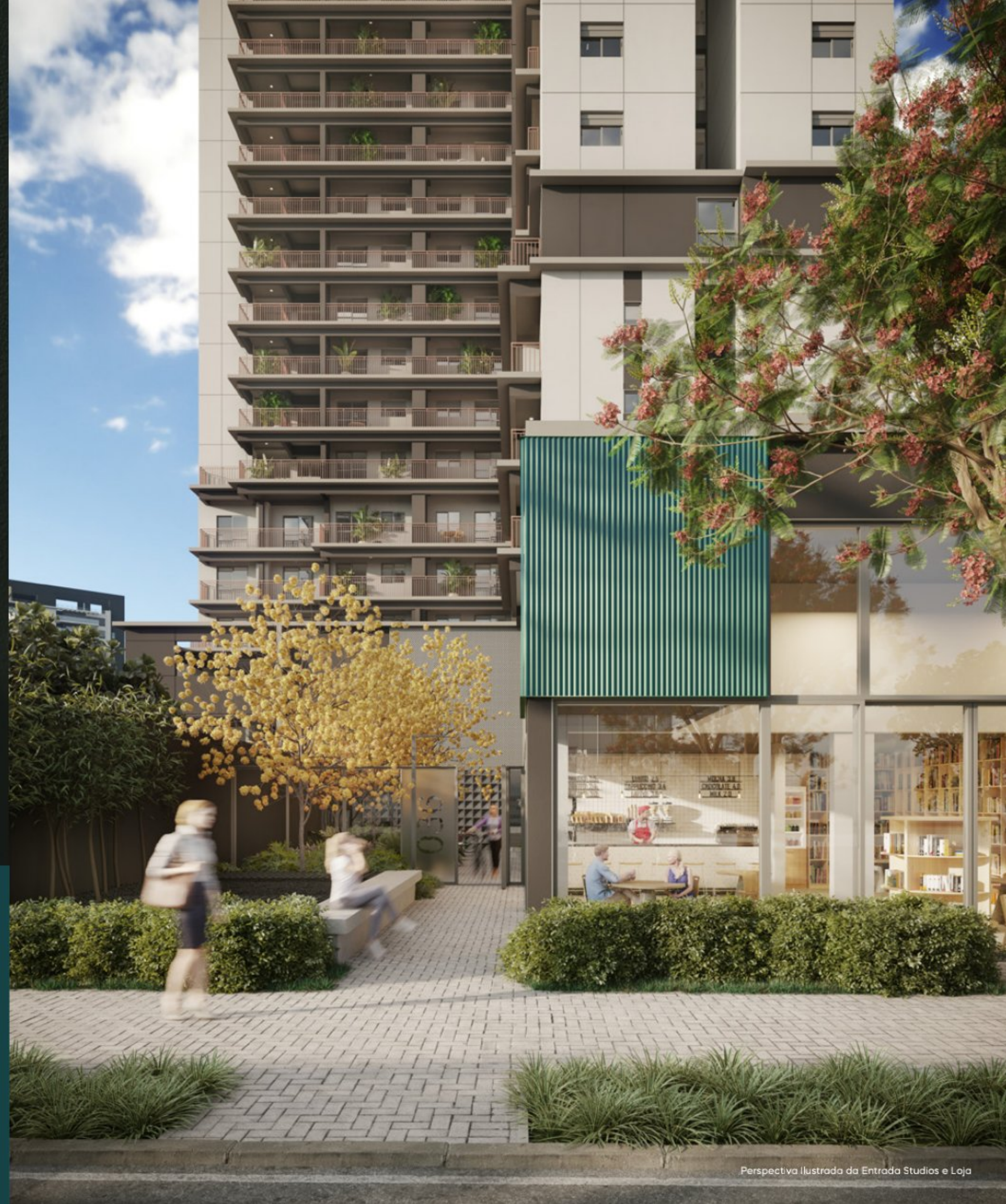
Perspectiva Ilustrada da Entrada Studios e Loja

Moderno e prático que valoriza o que realmente importa.