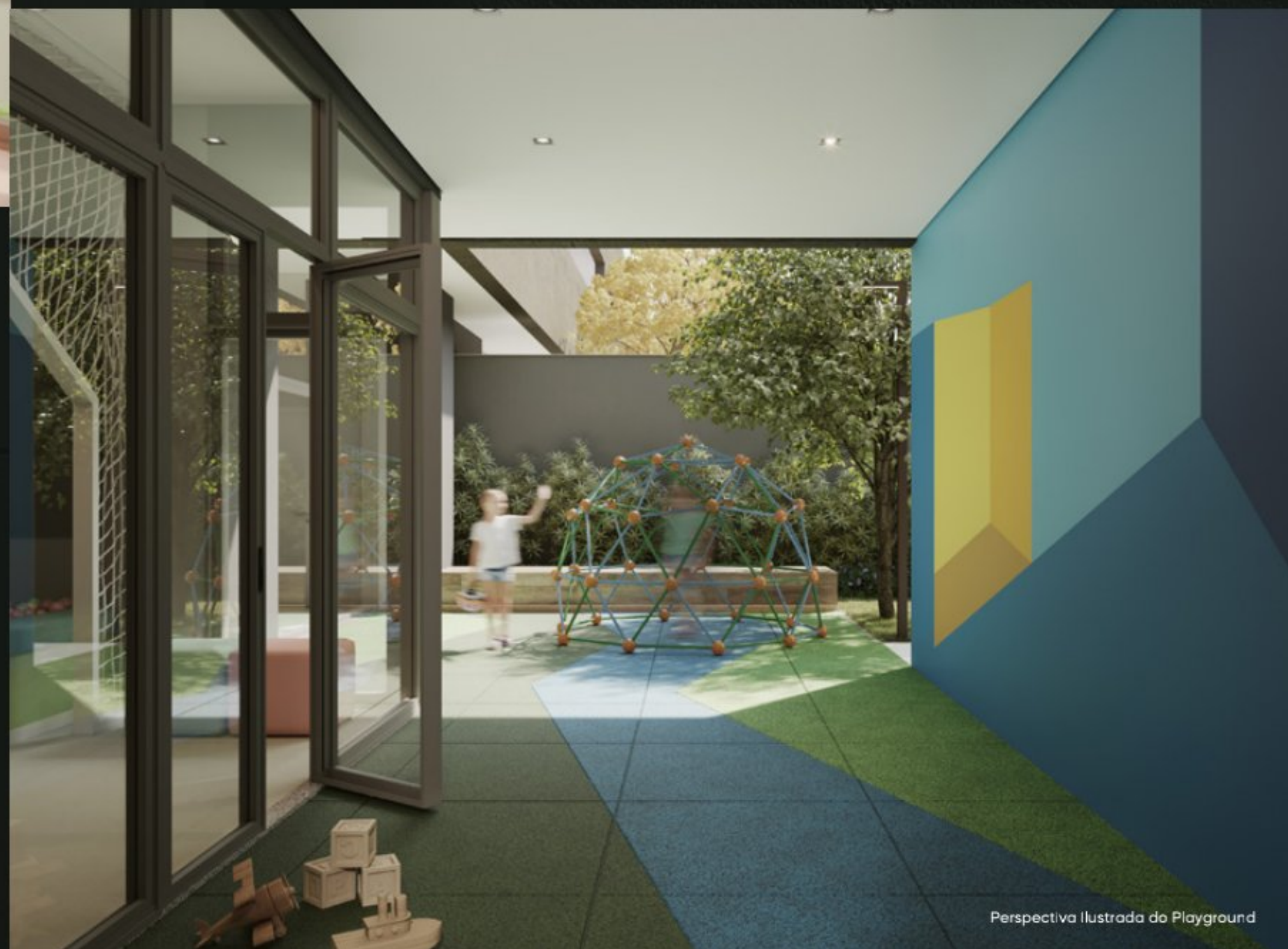
Perspectiva Ilustrada do Playground

Um lugar familiar que acalma, onde as horas passam num ritmo tranquilo criando conexões e sensações de bem-estar. Uma decoração encantadora que convida e interage com os pequenos.