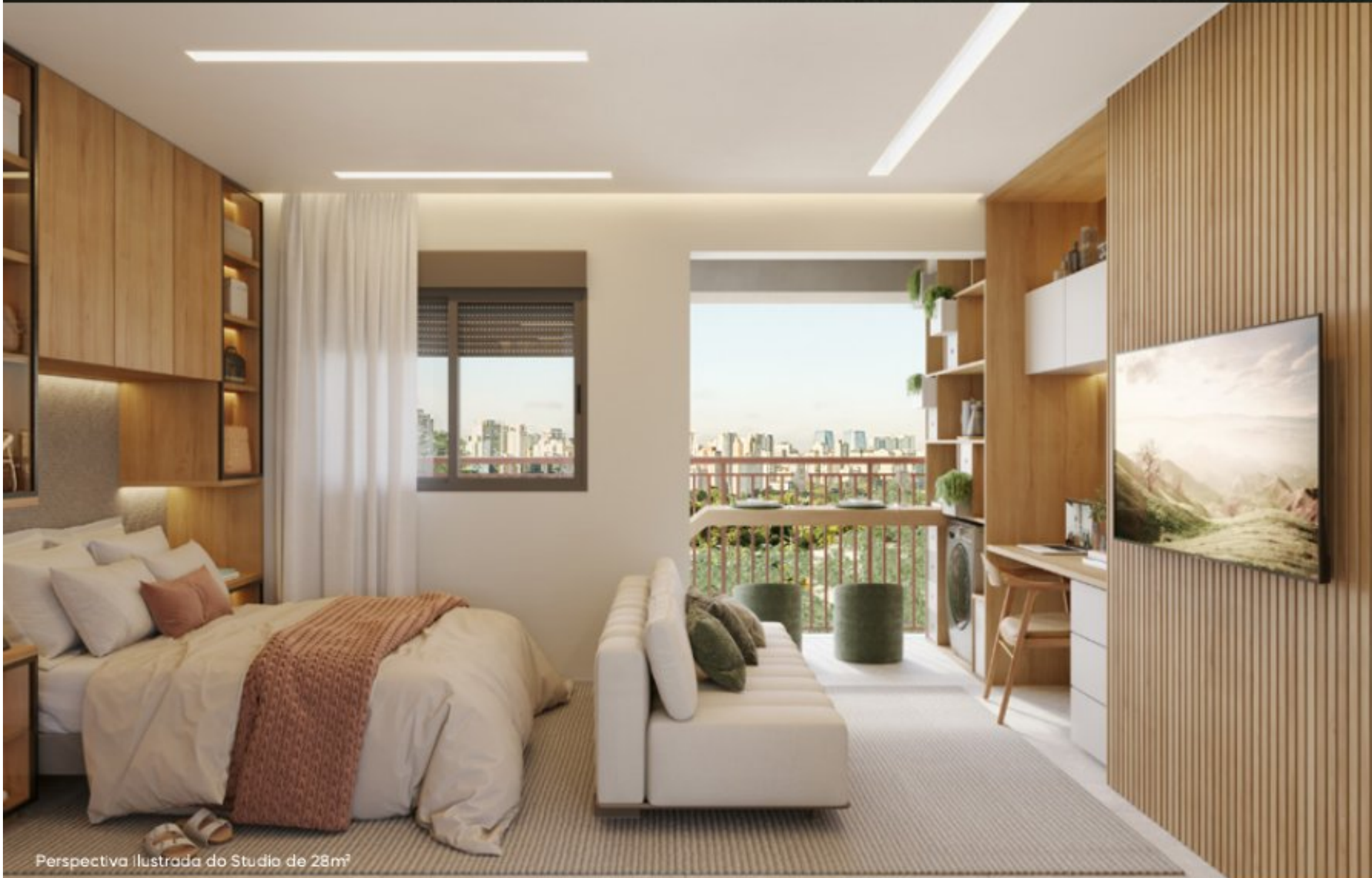
Perspectiva ilustrada do Studio de 28m 2