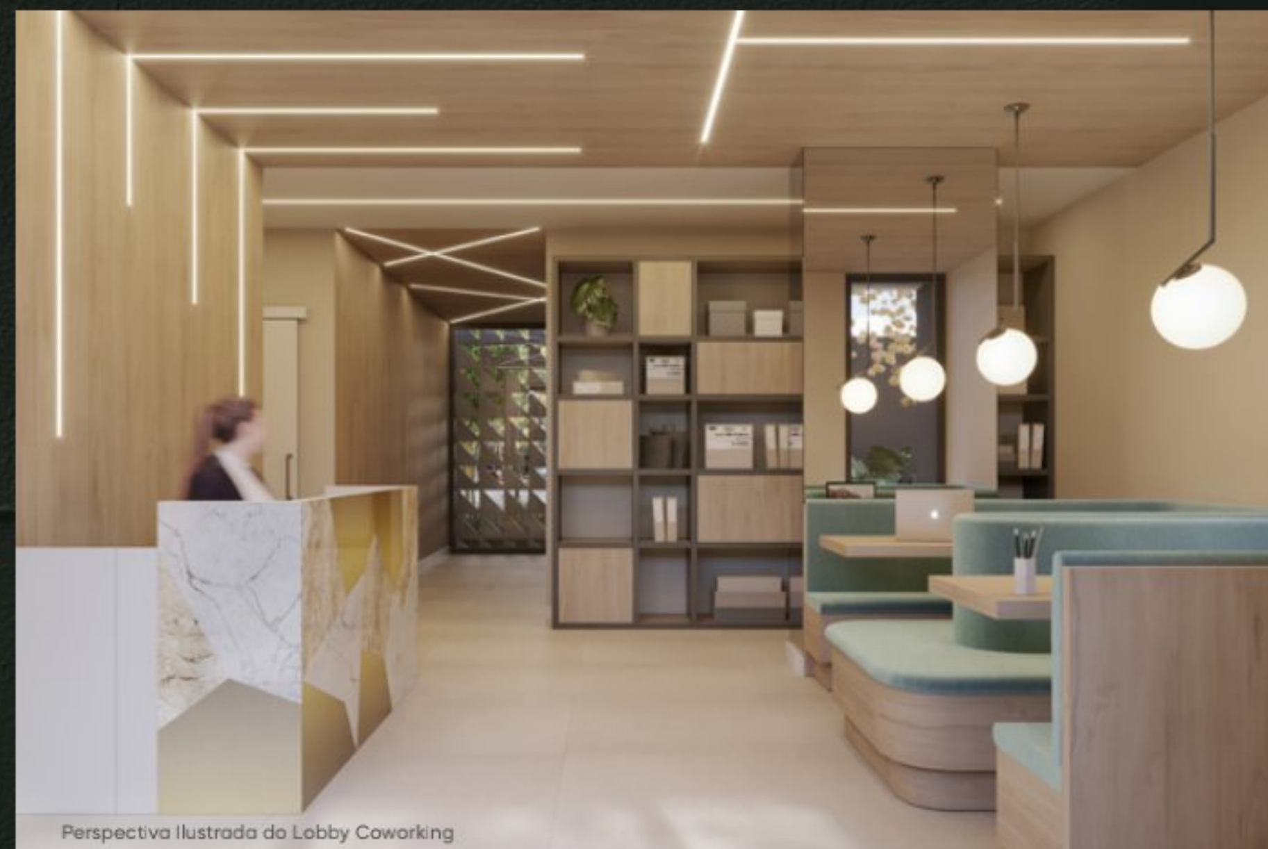
Perspectiva Ilustrada da Lobby Coworking

A praticidade essencial para o seu dia a dia.