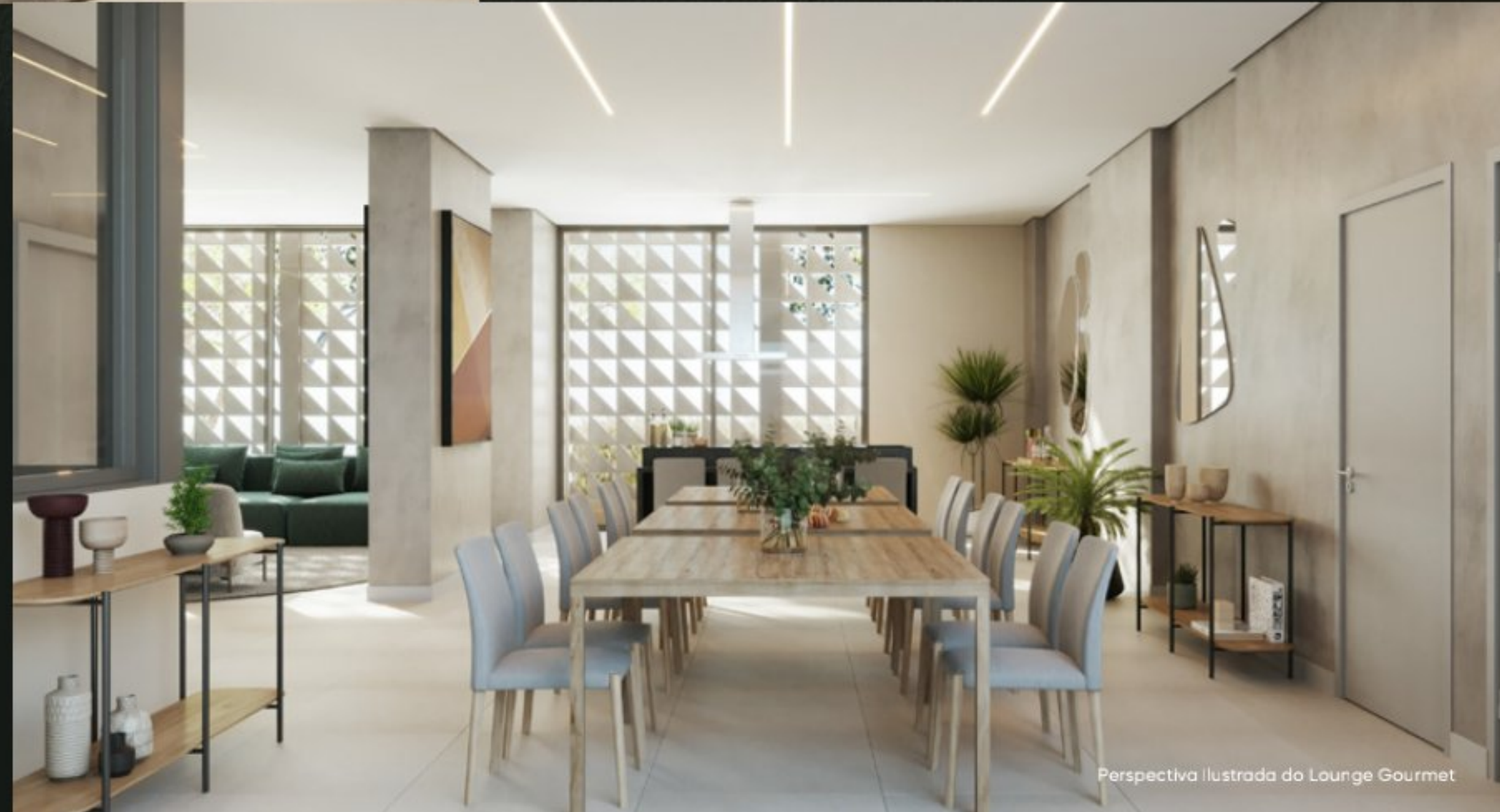
Perspectiva Ilustrada do Lounge Gourmet

Tudo é envolvente. Sensações de bem-estar a todo momento.