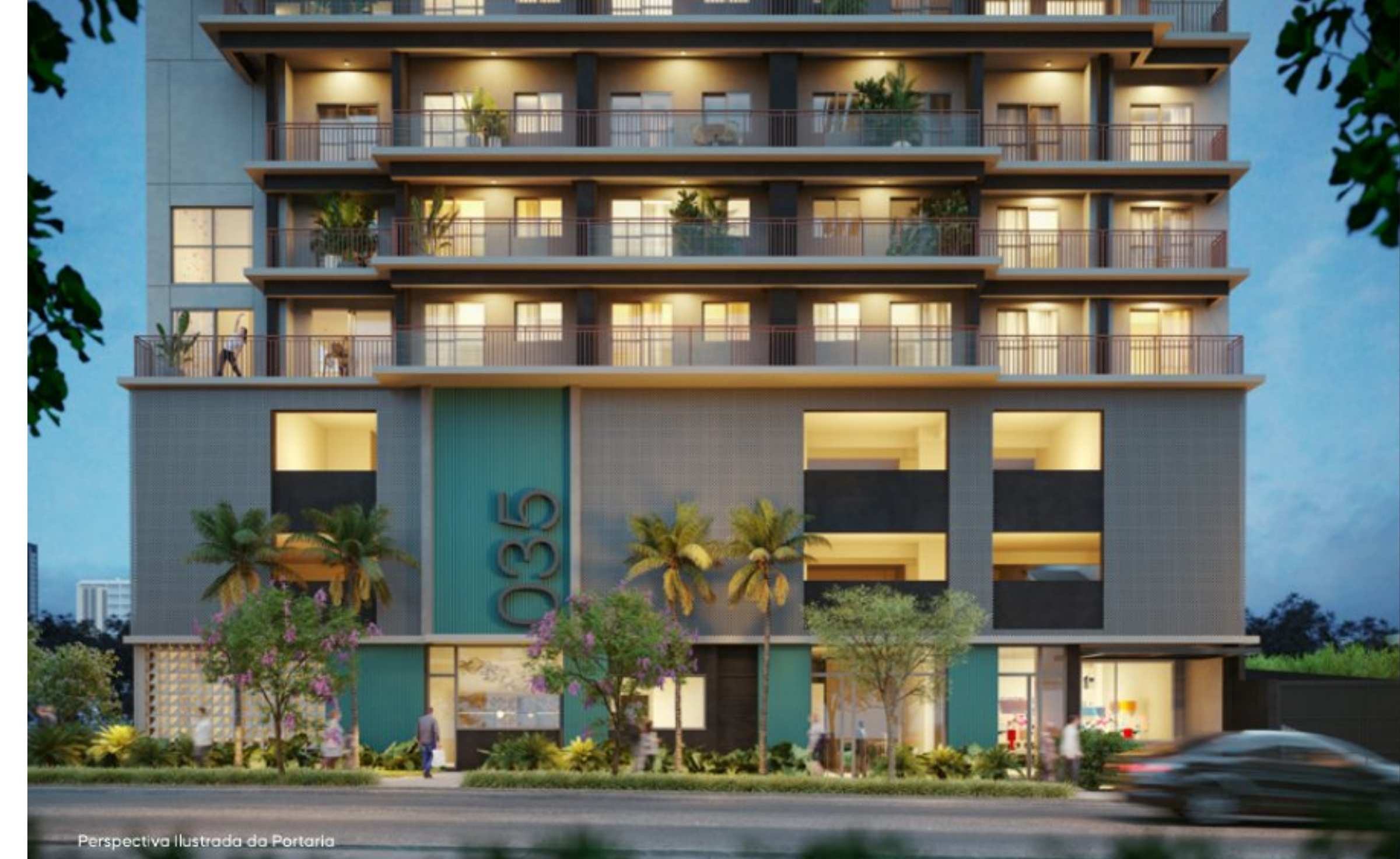
Perspectiva Ilustrada da Portaria

Arquitetura com a qualidade de um autêntico By Plano&Plano.