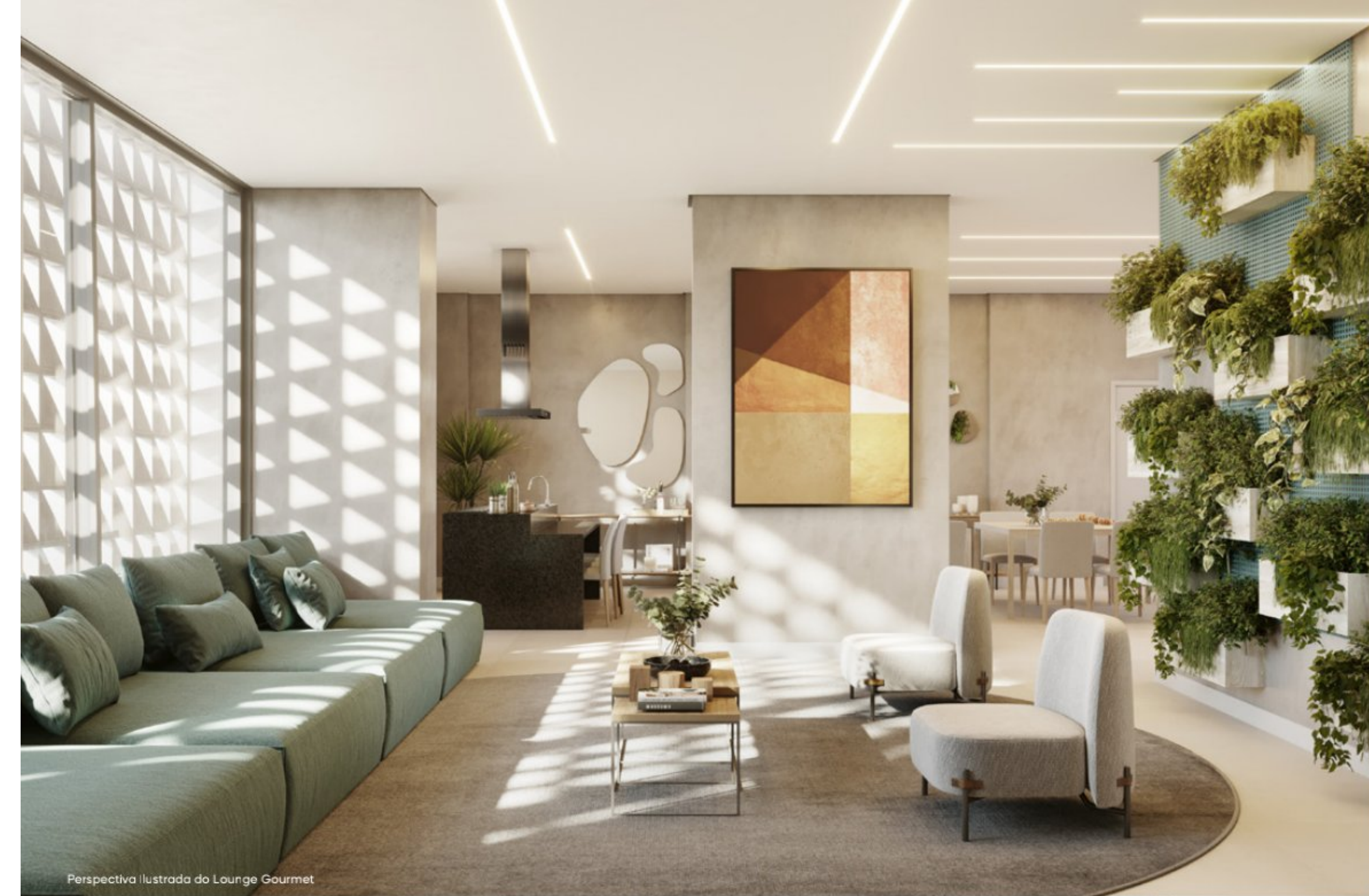
Perspectiva Ilustrada do Lounge Gourmet

Luminosidade e texturas se completam em uma sintonia original.