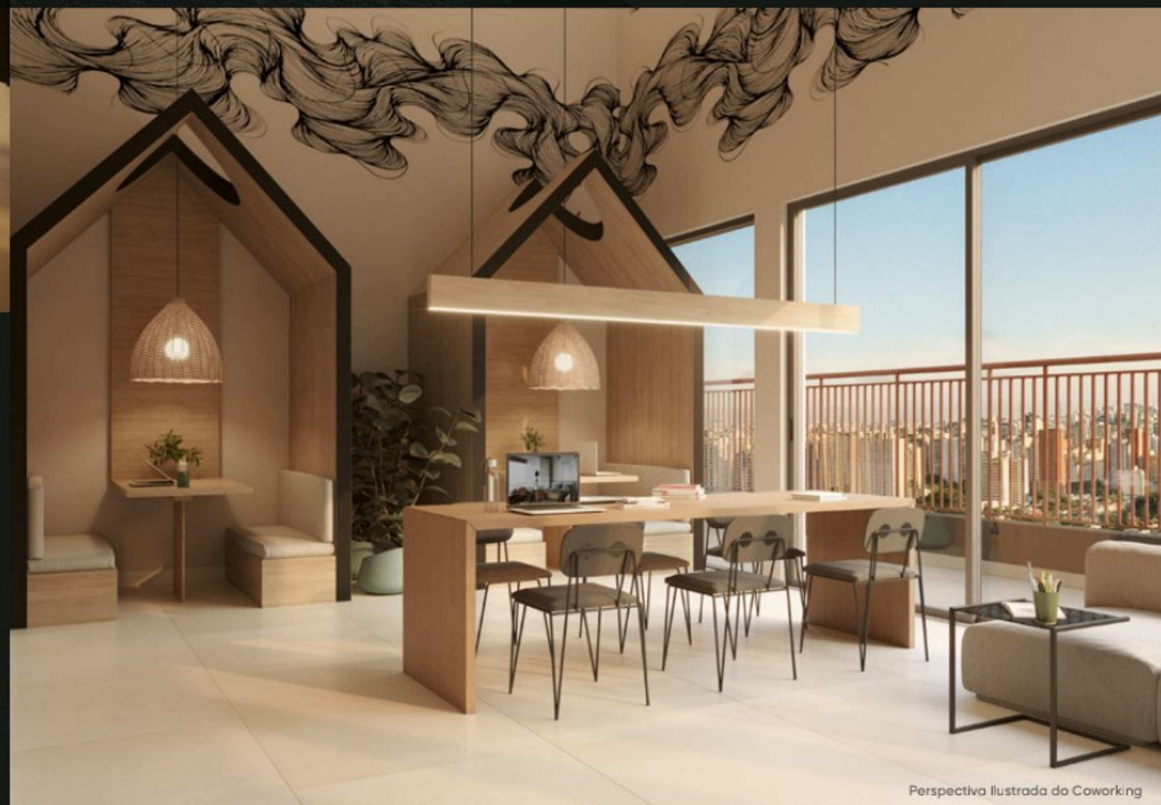
Perspectiva Ilustrada do Coworking

Trabalhar ou relaxar? A escolha é sua. Tudo no Oriz proporciona uma vivência completa para qualquer hora do dia. Seja nos compromissos de trabalho e estudos no Coworking ou nos momentos sem compromisso algum, apreciando seu drink preferido no pub.