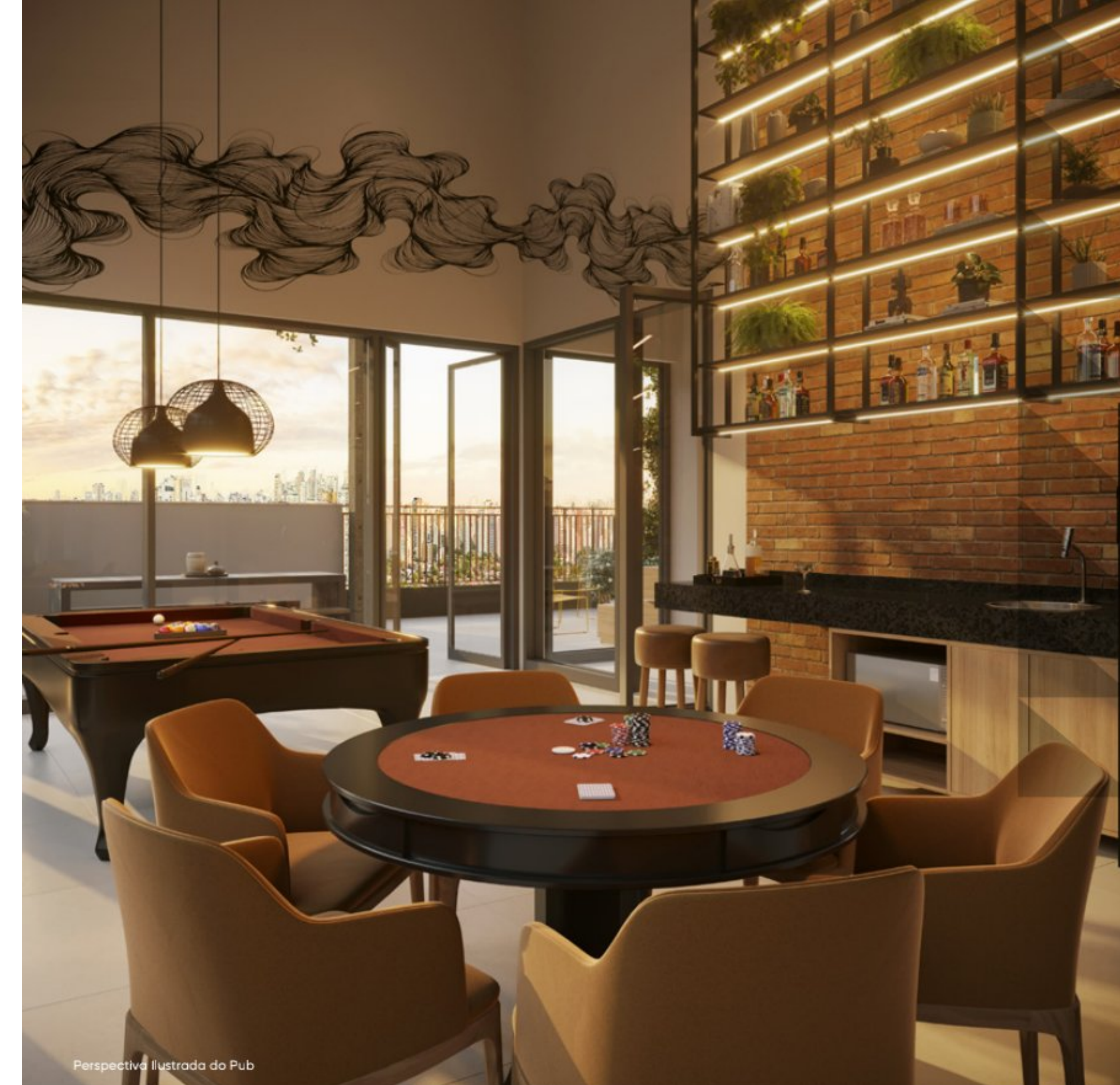
Perspectiva Ilustrada do Pub