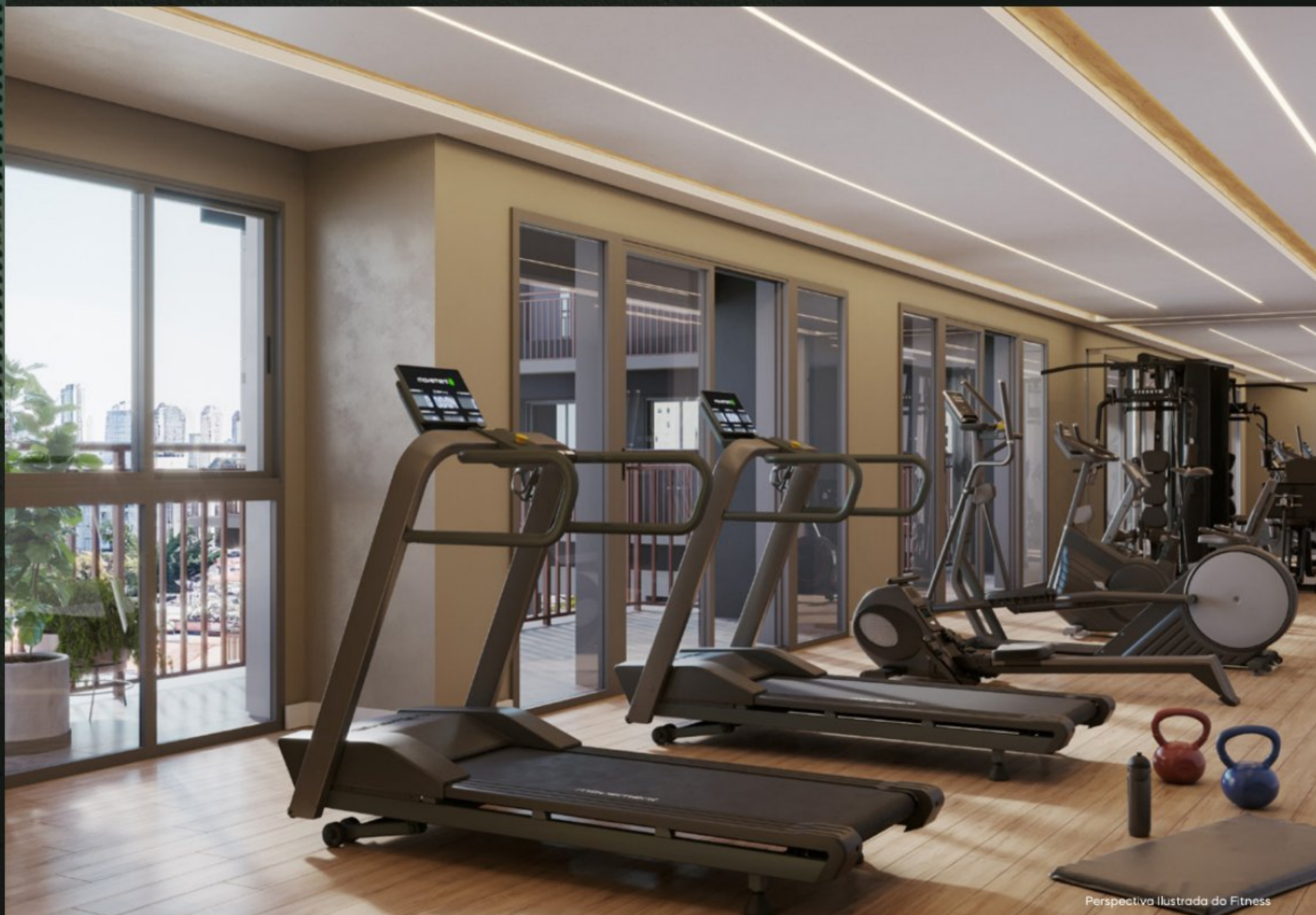
Perspectiva Ilustrada do Fitness

Alto nível de equipamentos em ambientes para alta performance.