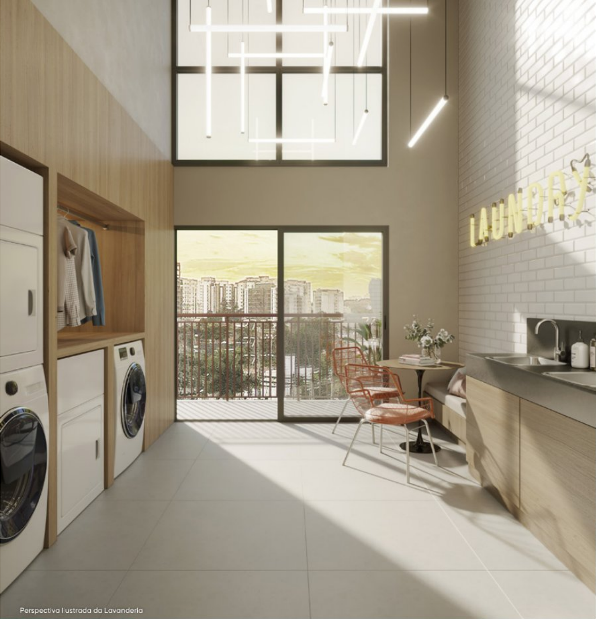
Perspectiva Ilustrada da Lavanderia