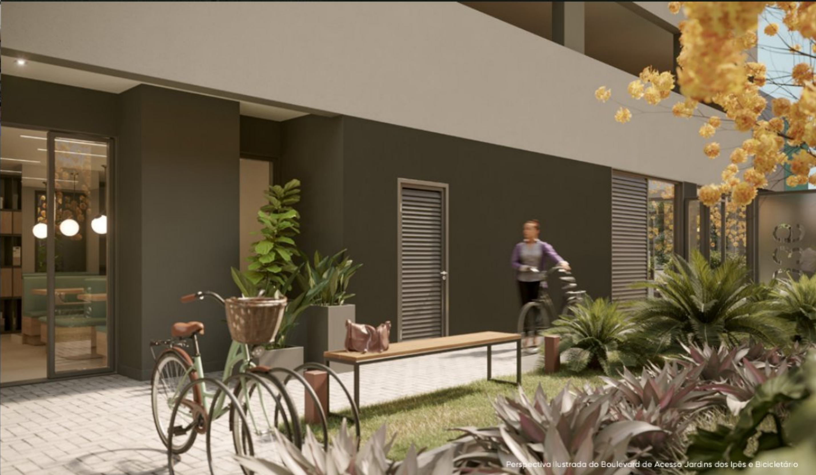
Perspectiva Ilustrada do Boulevard de Acesso Jardins dos Ipês e Bicicletário

Mobilidade que vai de dentro para fora do condomínio.