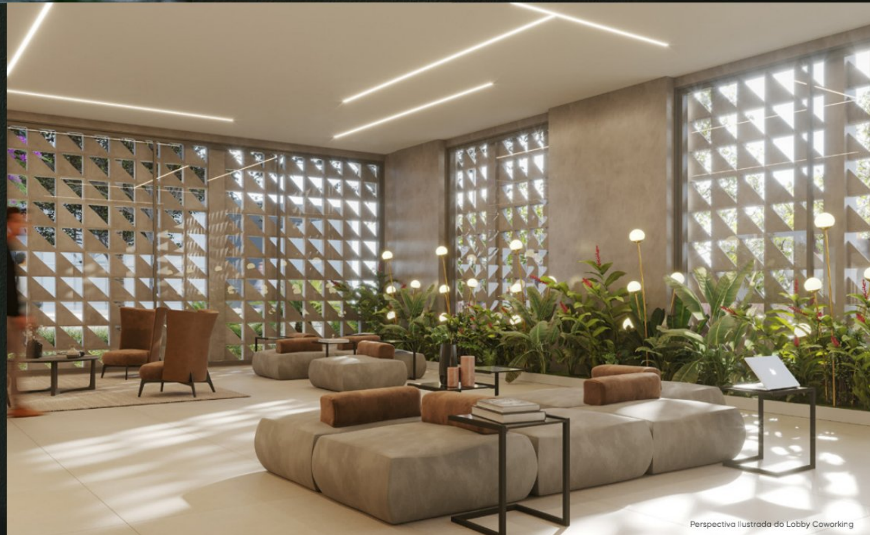
Perspectiva Ilustrada do Lobby Coworking

Do Rooftop ao térreo, composto por um paisagismo que conforta e dá boas-vindas.