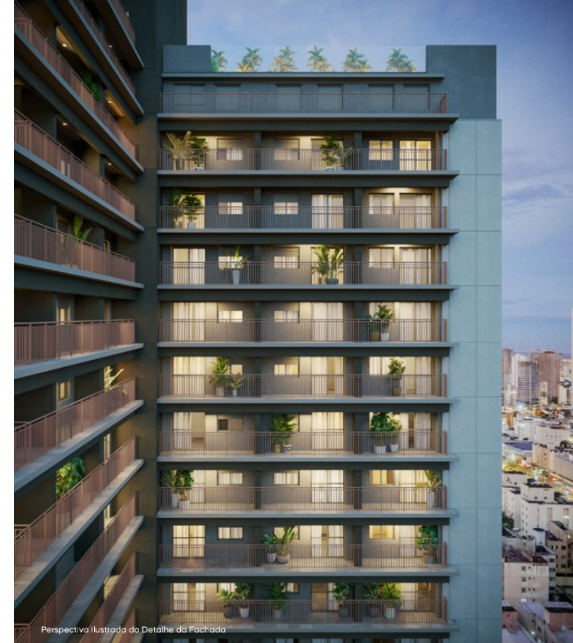
Perspectiva Ilustrada do Detalhe da Fachada