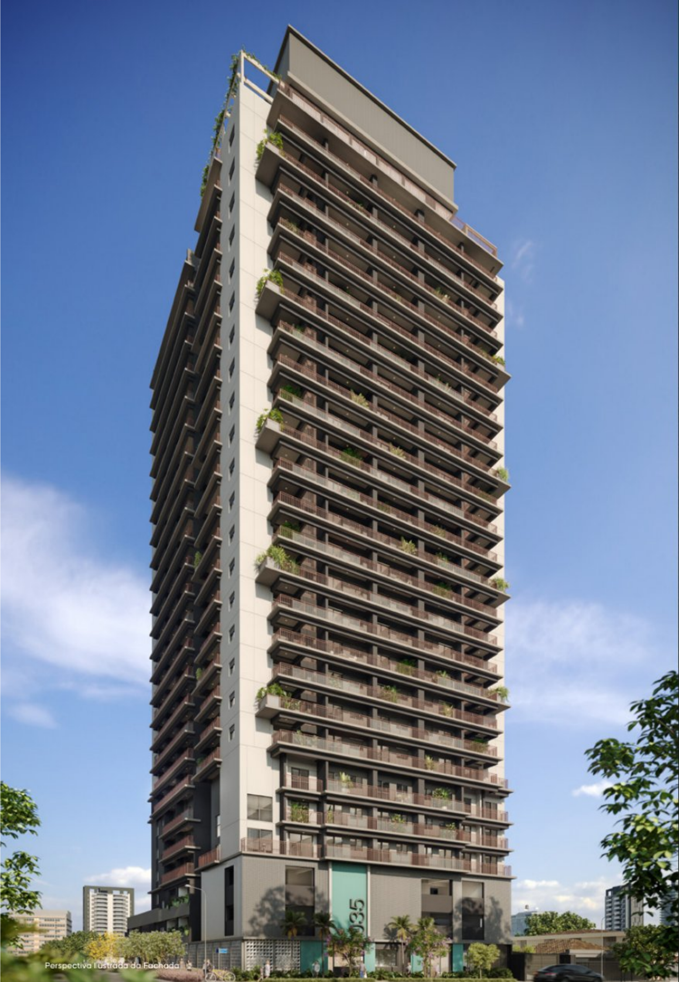
Perspectiva Ilustrada da Fachada