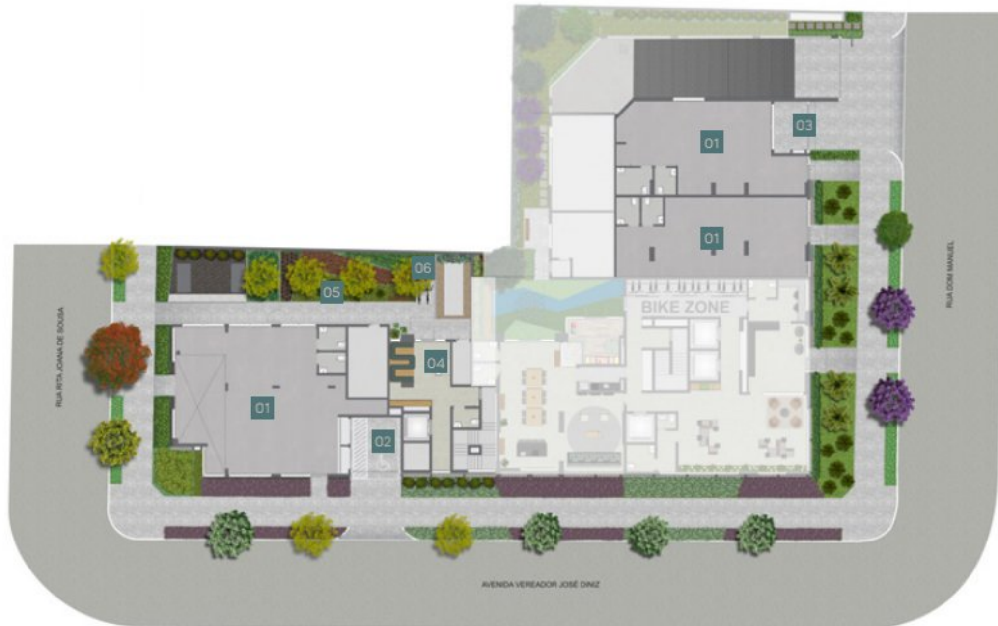
Imagem Ilustrada da implantação do Térreo