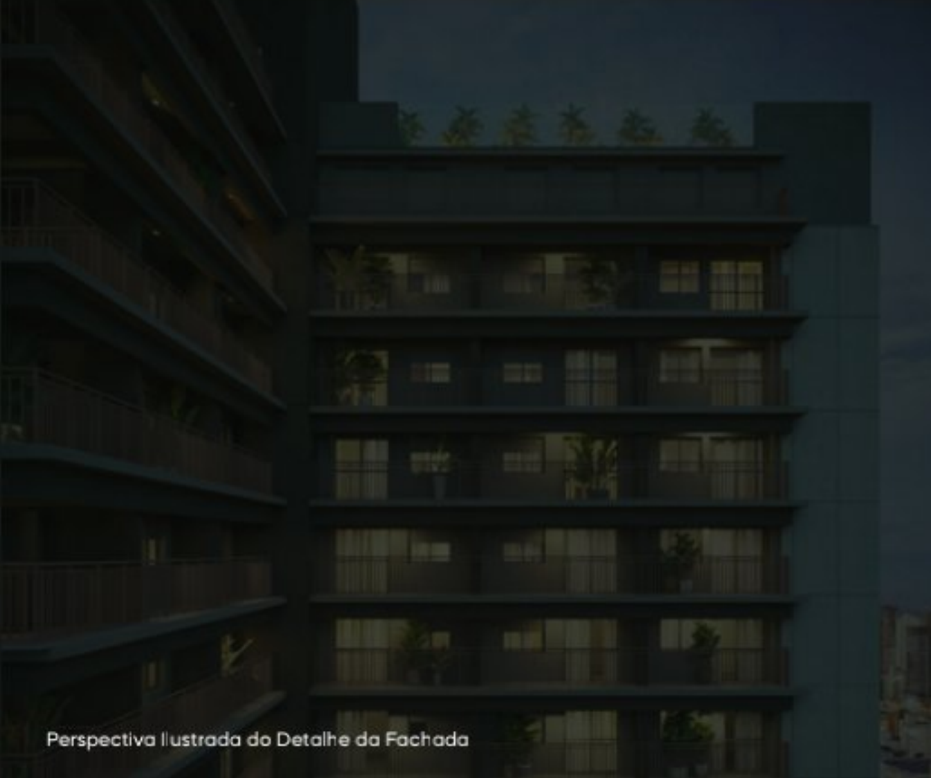
Perspectiva Ilustrada do Detalhe da Fachada

Arquitetura: Ide Studio Arquitetura Paisagismo: Núcleo Arquitetura da Paisagem Decoração & Área Comum: Gabriela Bosso Arquitetura