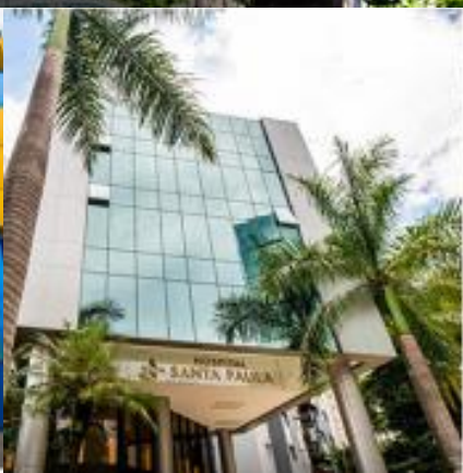
HOSPITAL SANTA PAULA