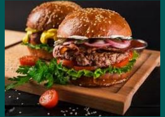
FESTIVAL DE HAMBURGUER