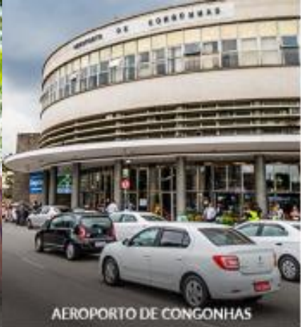
AEROPORTO DE CONGONHAS