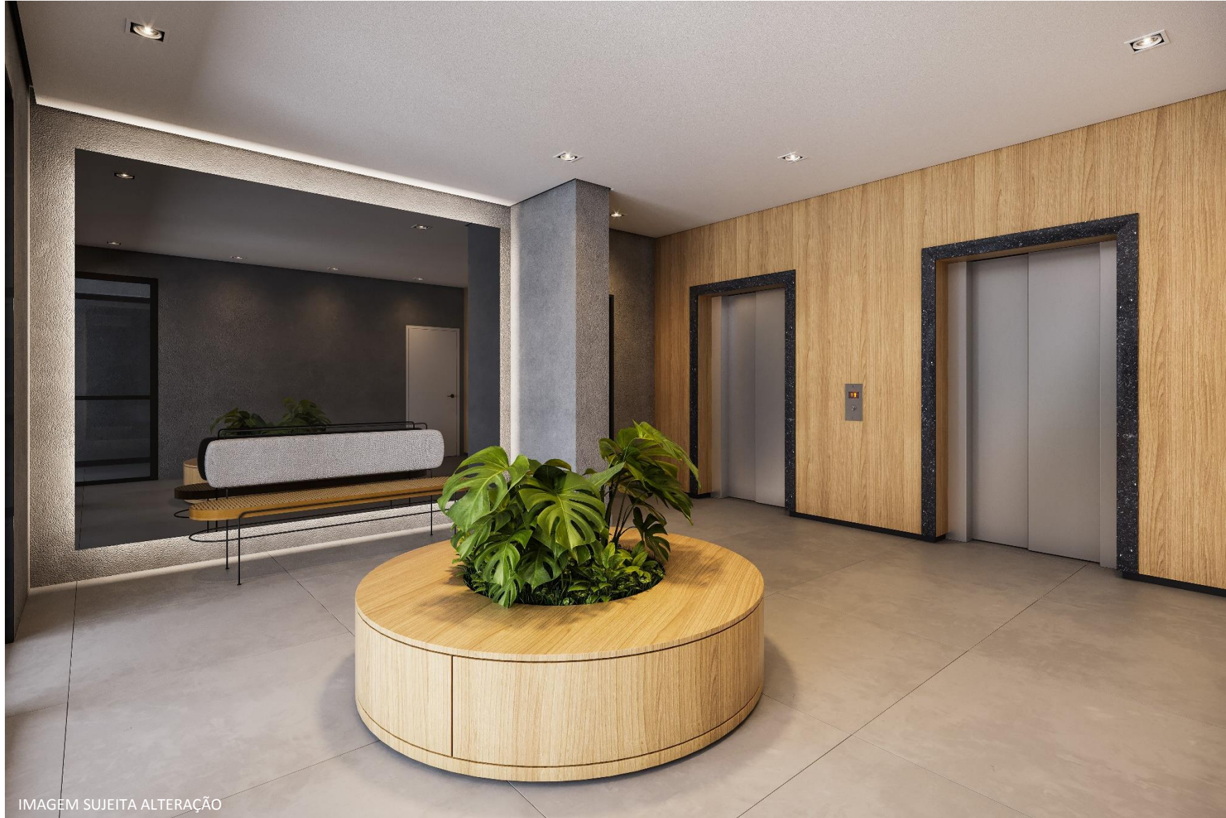
IMAGEM SUJEITA ALTERAÇÃO