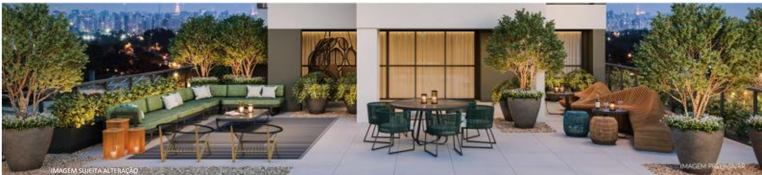
IMAGEM SUJEITA ALTERAÇÃO