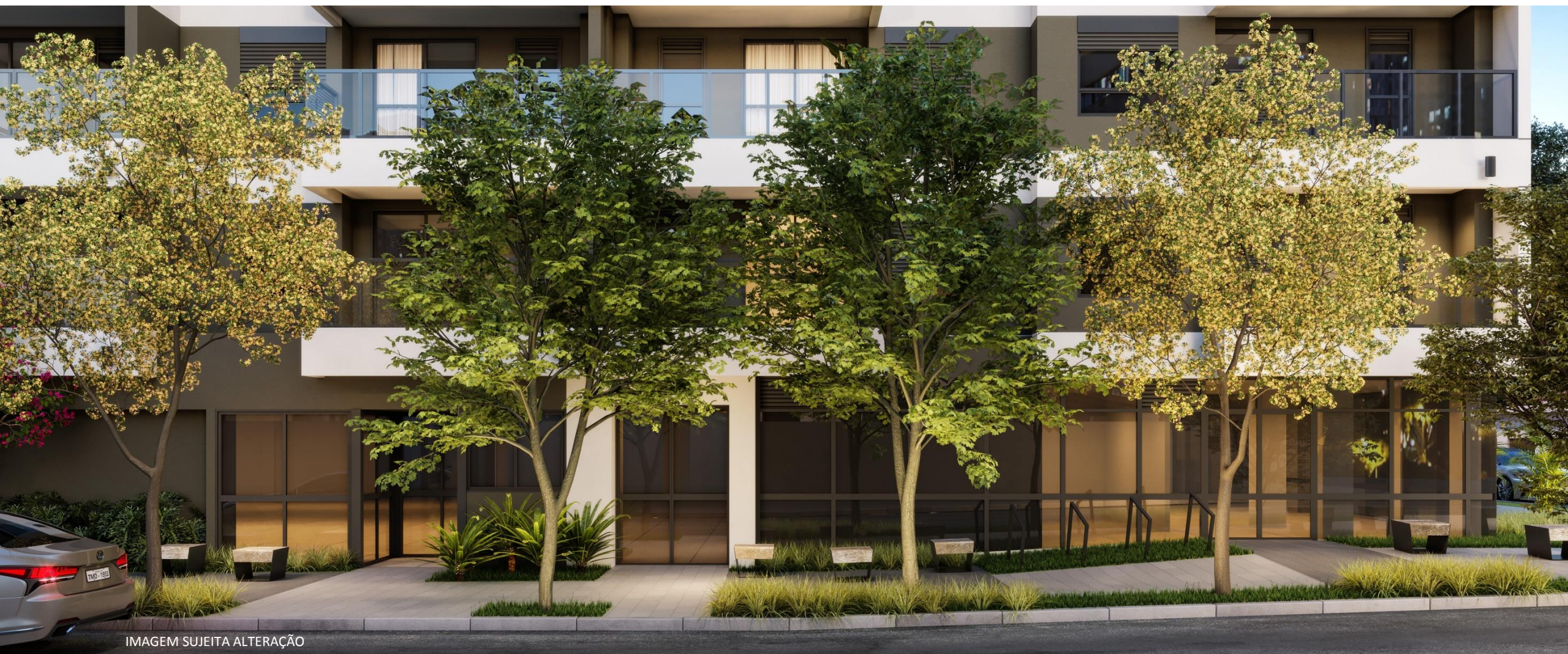
IMAGEM SUJEITA ALTERAÇÃO