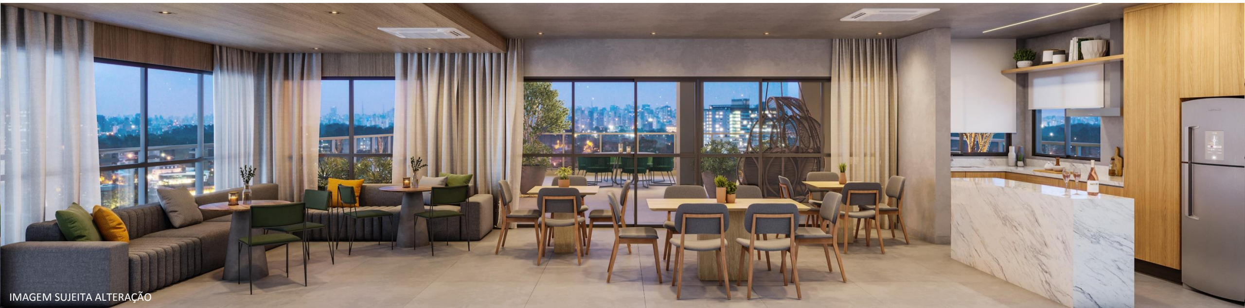
IMAGEM SUJEITA ALTERAÇÃO