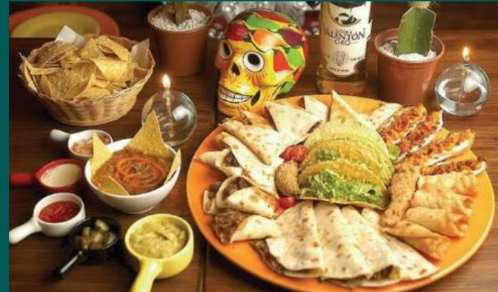
FESTIVAL DE MEXICANO