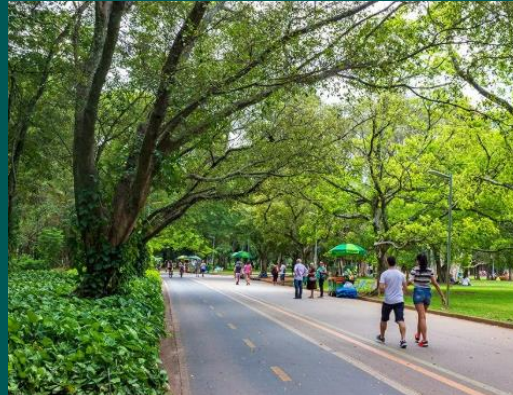
BLITZ PARQUE IBIRAPUERA