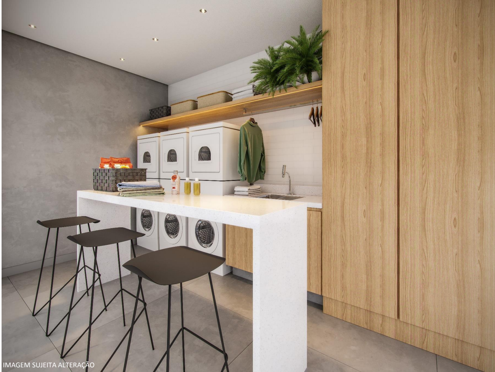
IMAGEM SUJEITA ALTERAÇÃO

FF FIGUEIREDO FISCHER ARQUITETOS & INTERIORES