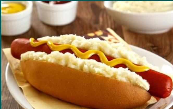
FESTIVAL DE HOT DOG