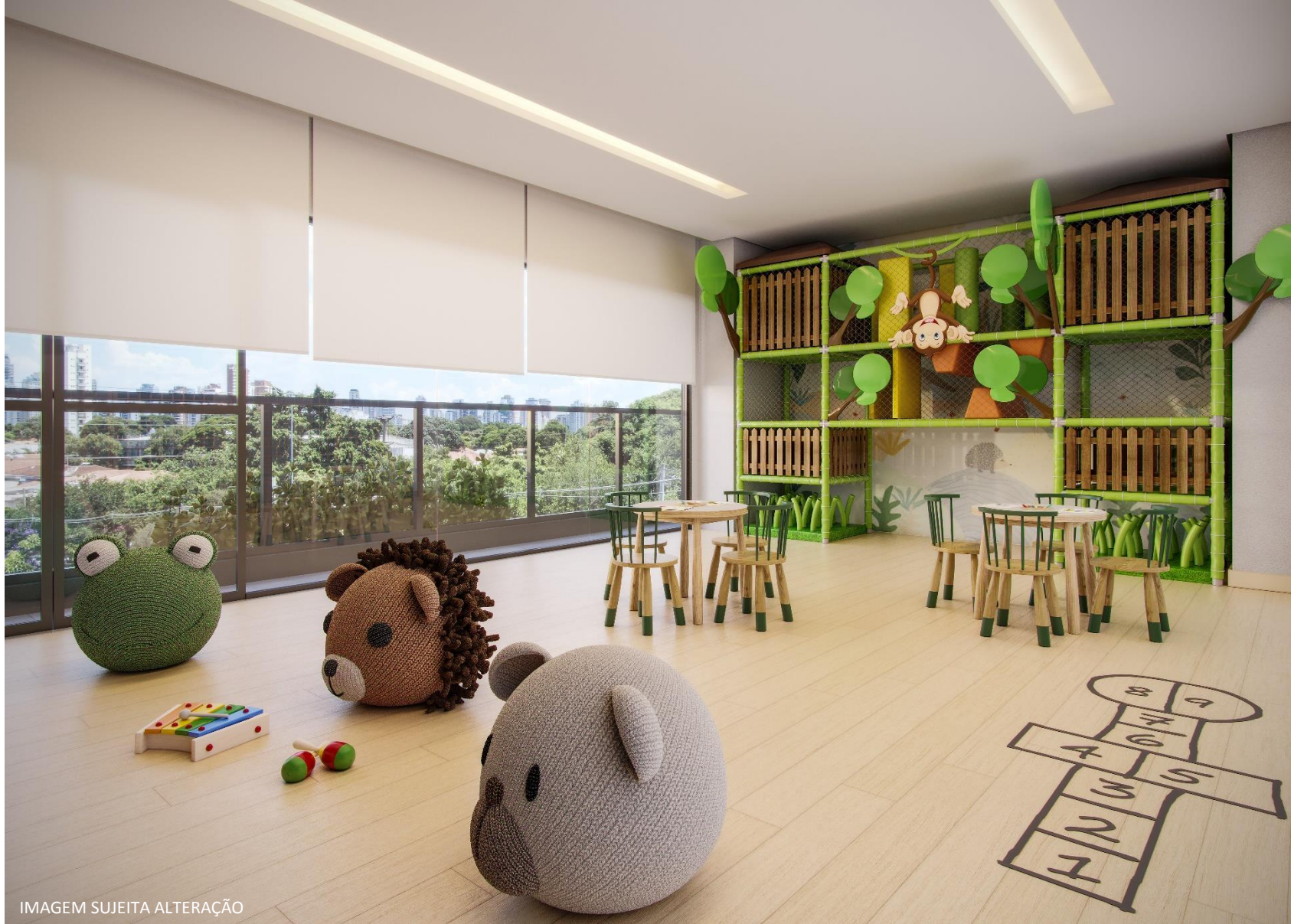
IMAGEM SUJEITA ALTERAÇÃO