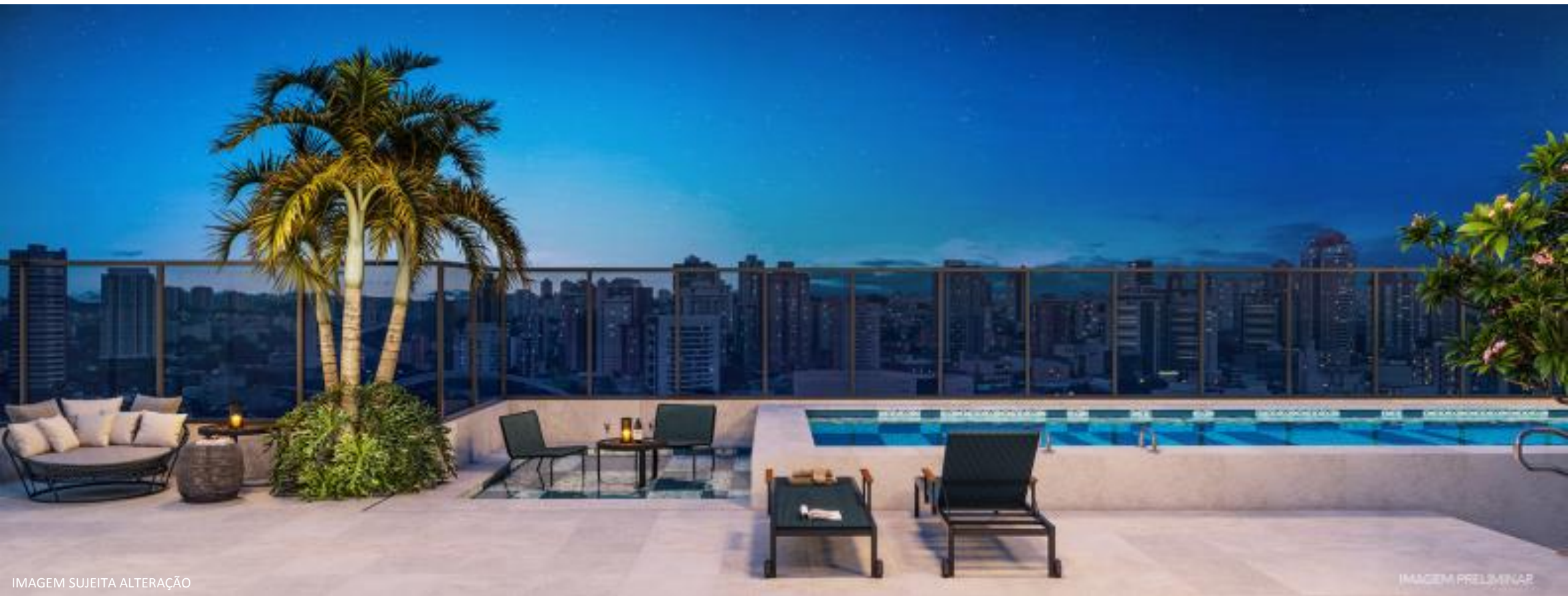
IMAGEM SUJEITA ALTERAÇÃO