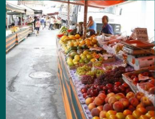
BLITZ EM FEIRAS LIVRES