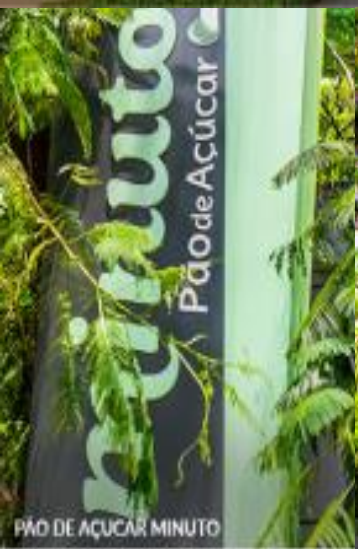
PÃO DE AÇÚCAR MINUTO