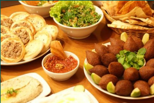
FESTIVAL DE ÁRABE