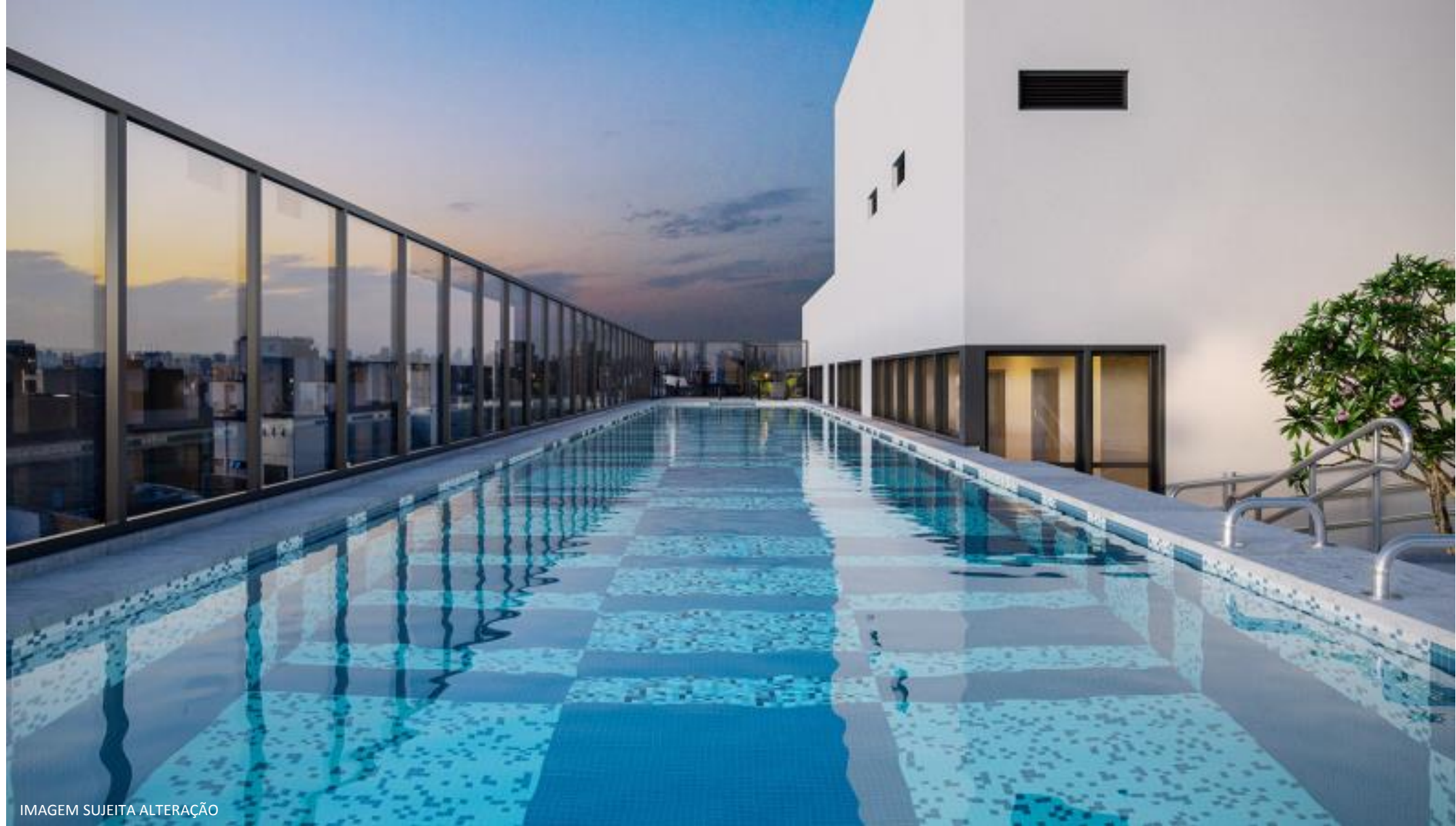
IMAGEM SUJEITA ALTERAÇÃO