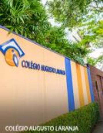
COLÉGIO AUGUSTO LARANJA