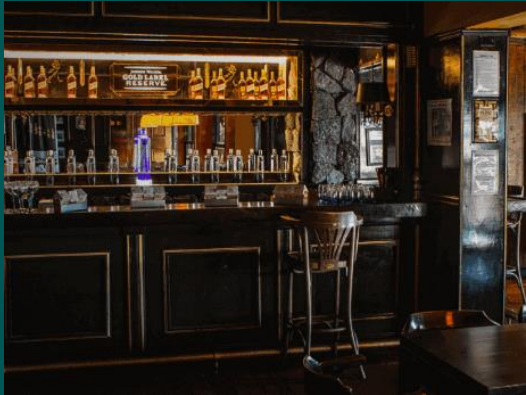
BLITZ EM BARES