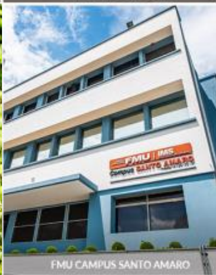
FMU CAMPUS SANTO AMARO