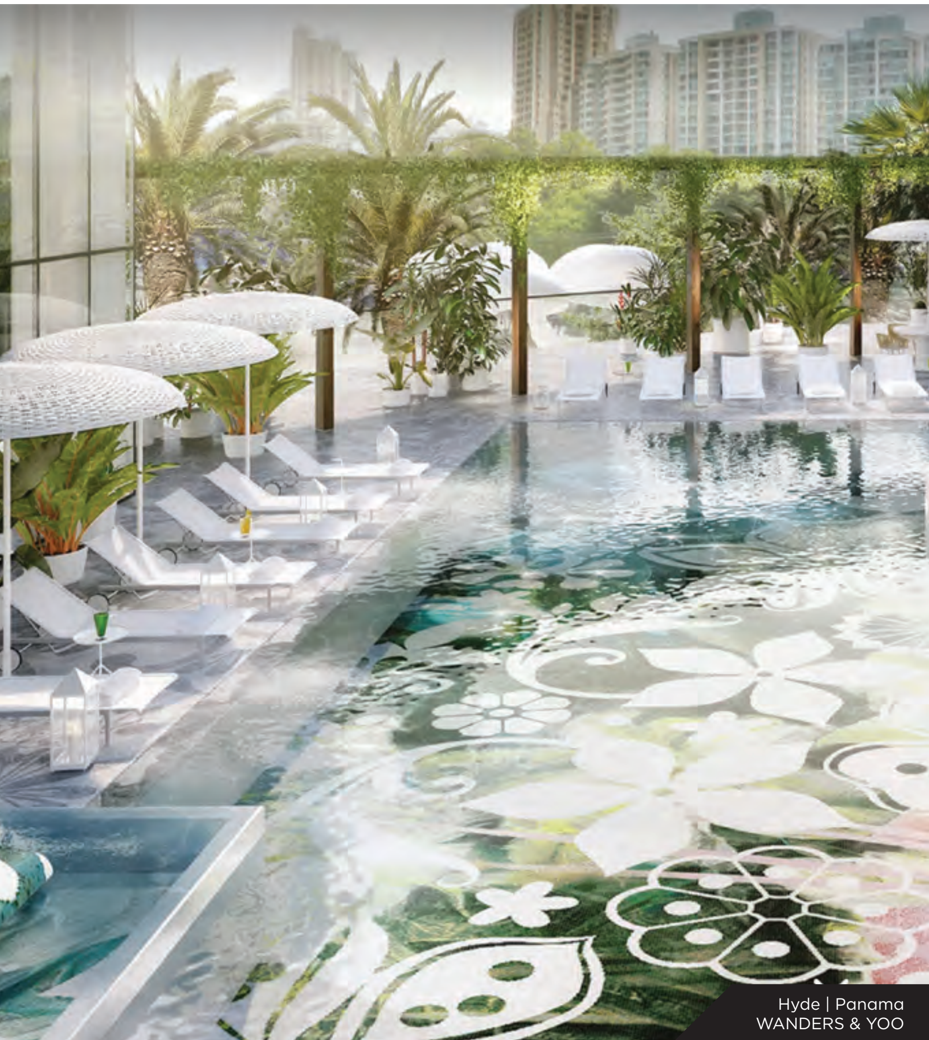
Hyde | Panama WANDERS & YOO