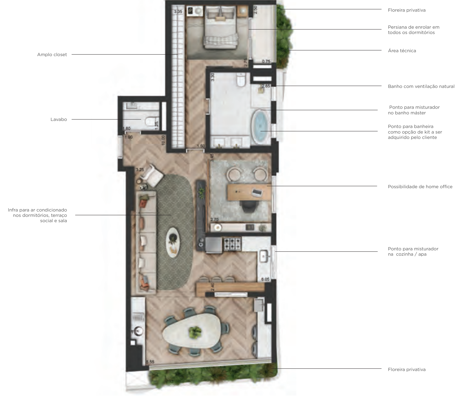
Planta opção ilustrada do apartamento de 102,00m 2 , com 1 suite e sugestão de decoração. O apartamento será entregue conforme memorial descritivo. Os móveis e utensílios são de dimensões comerciais e não fazem parte do Contrato de Compra e Venda da unidade. As medidas são internas e de face a face das paredes