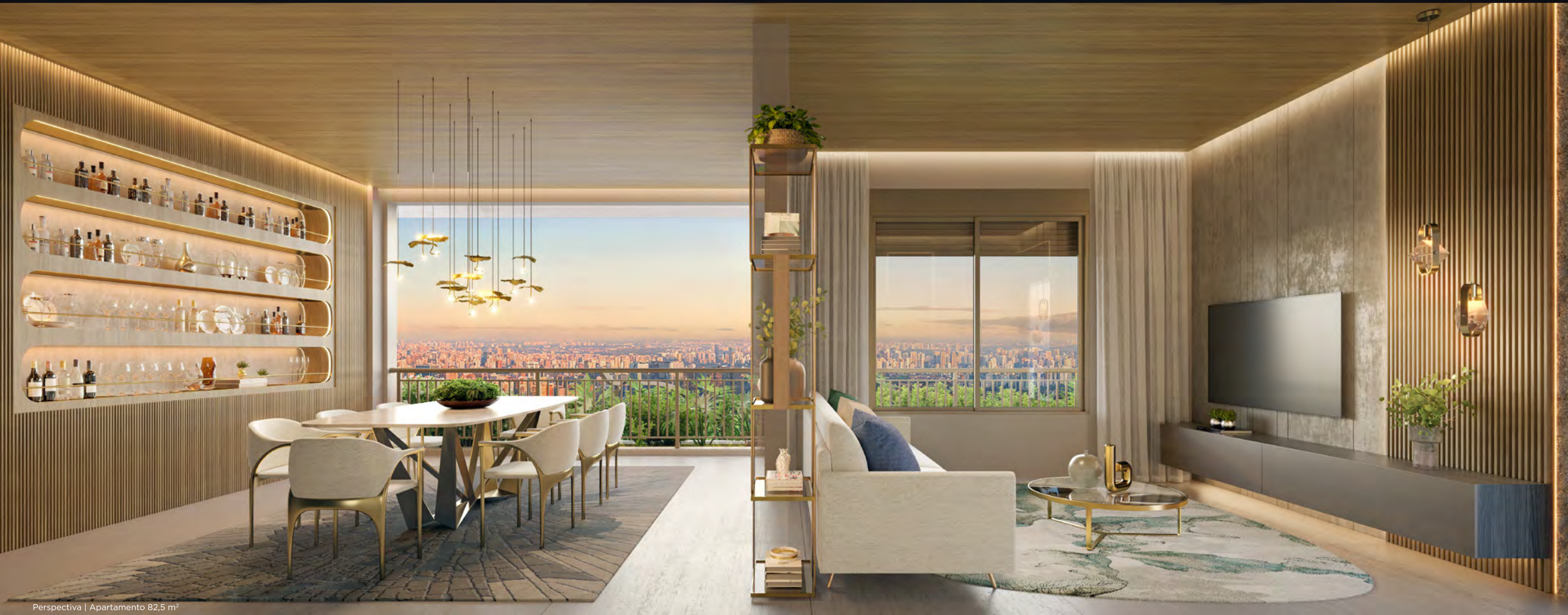
Perspectiva | Apartamento 82,5 m 2