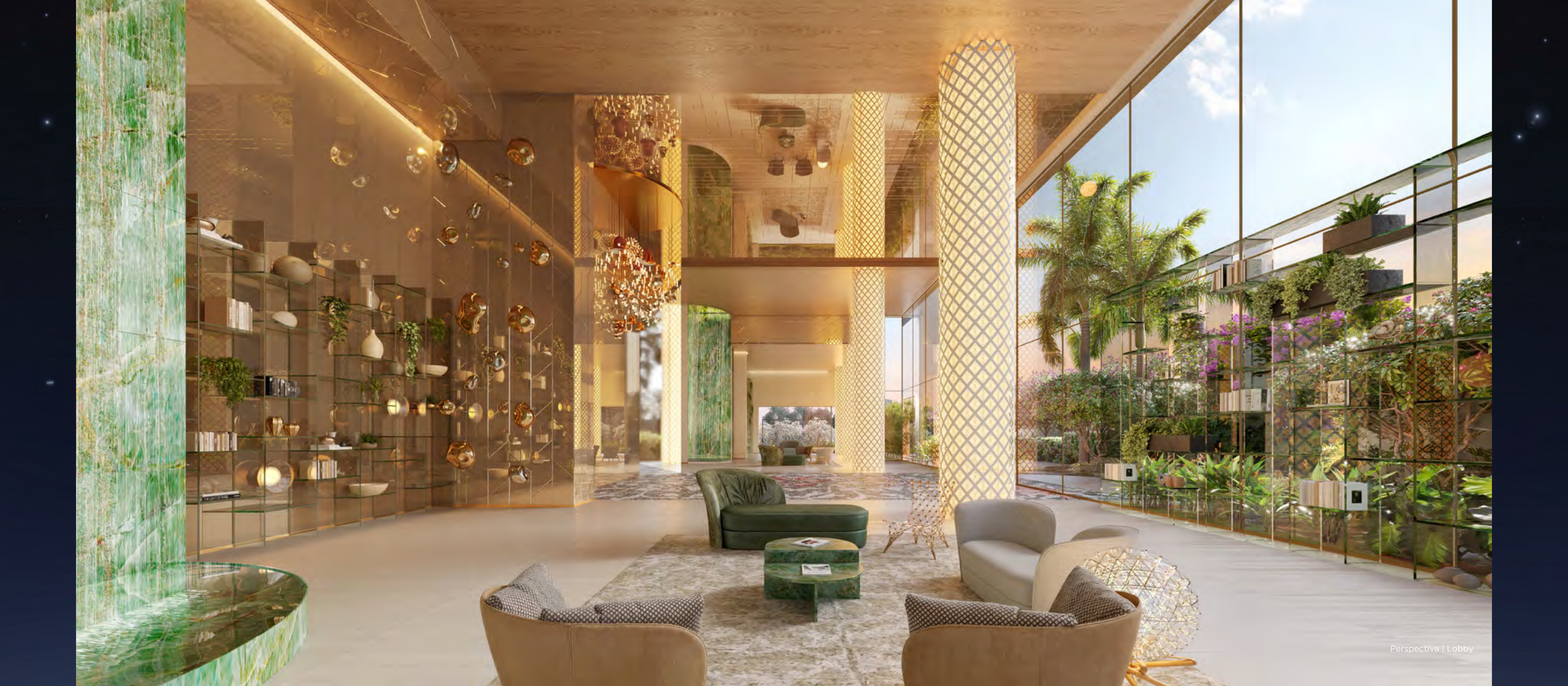
Perspectiva | Lobby