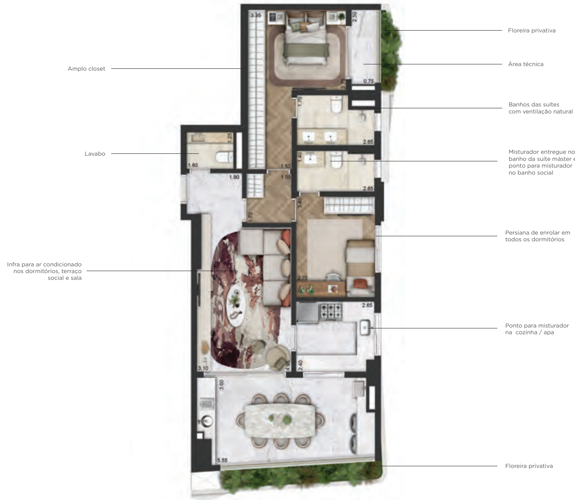
Planta tipo ilustrada do apartamento de 102,00m 2 , com 2 suítes e sugestão de decoração. O apartamento será entregue conforme memorial descritivo. Os móveis e utensílios são de dimensões comerciais e não fazem parte do Contrato de Compra e Venda da unidade. As medidas são internas e de face a face das paredes