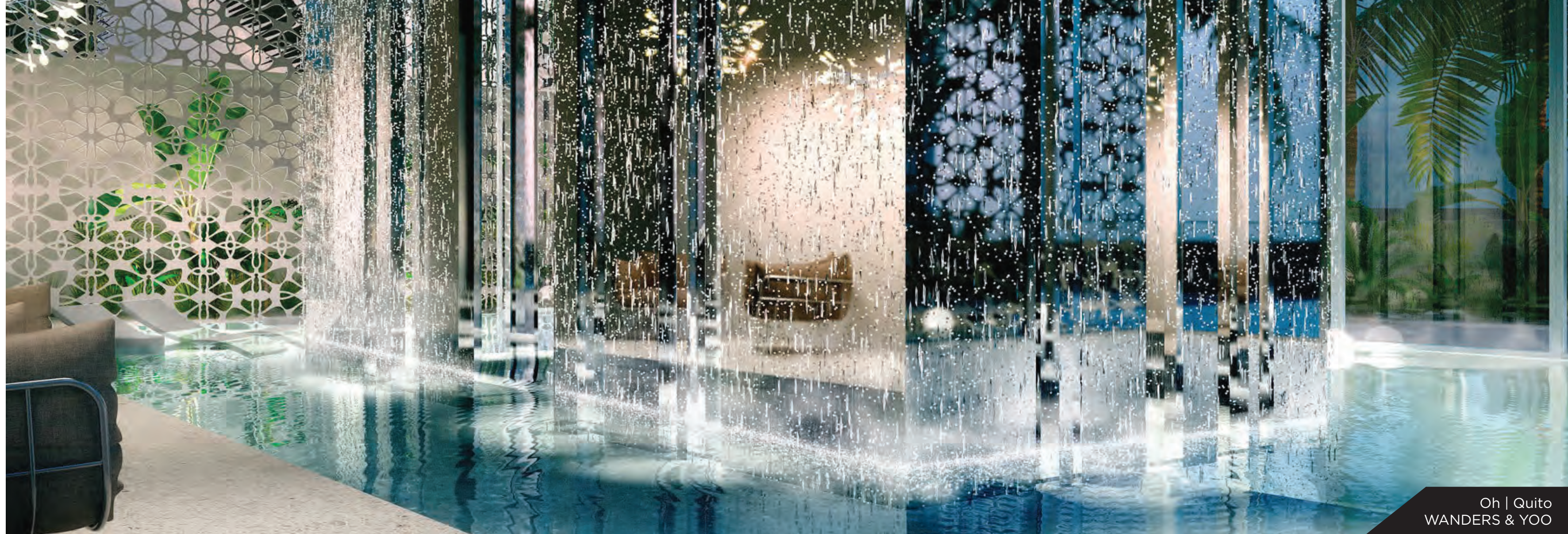
Oh | Quito WANDERS & YOO