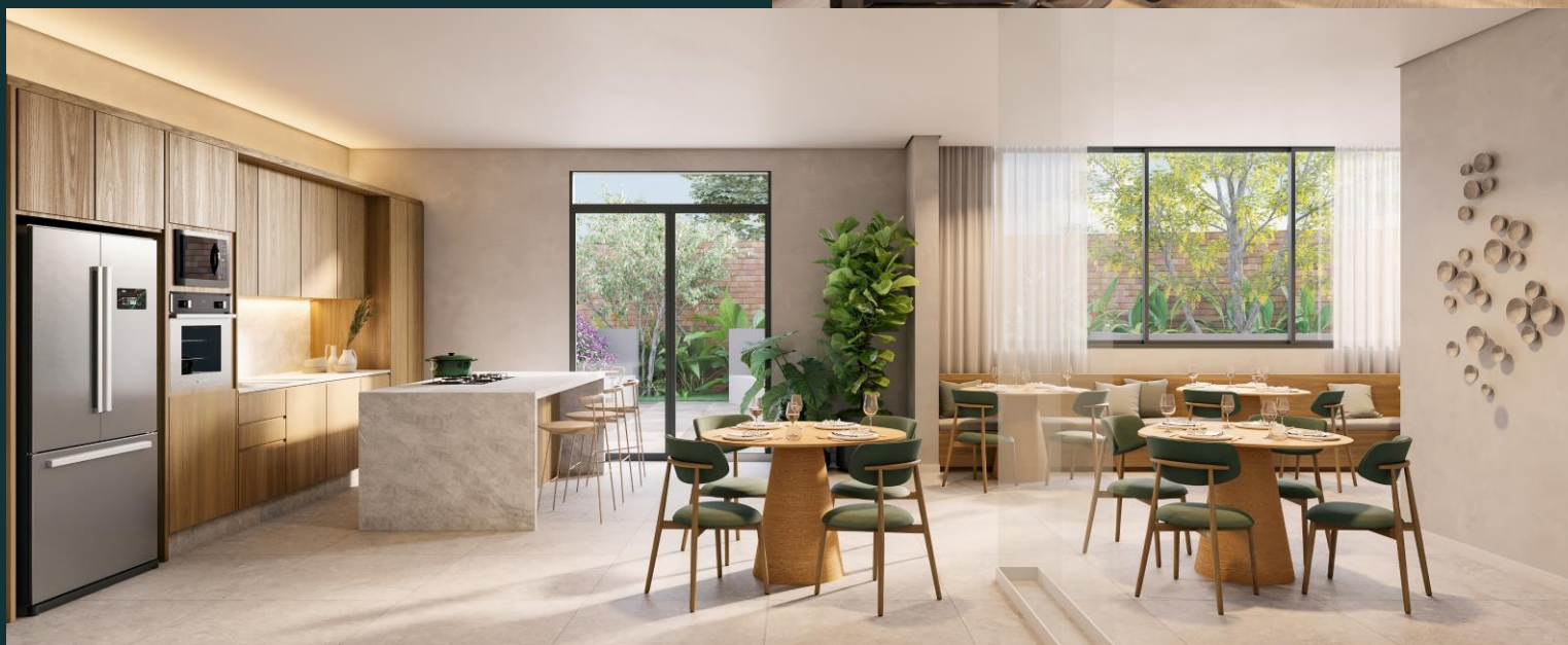
Festas + Gourmet