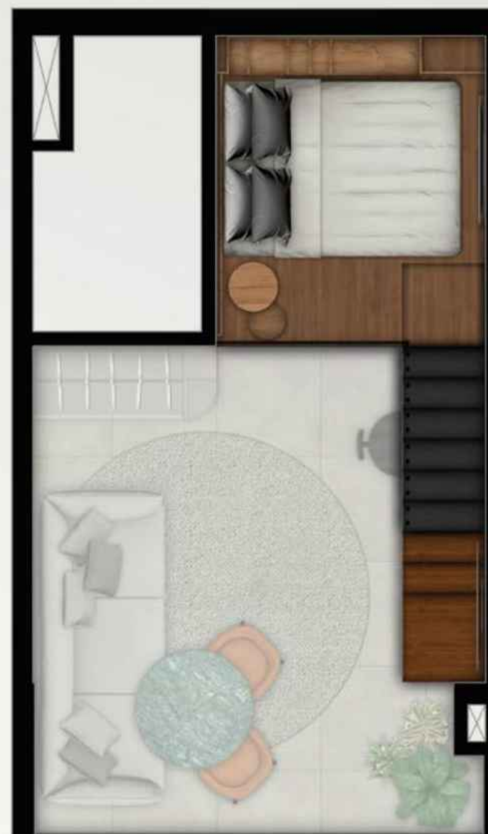
Ilustração artística da planta do studio+, 23,95m 2 - final 10, com sugestão de decoração. Imagem preliminar sujeita a alterações. Entregue conforme a planta de contrato e o memorial descritivo. *Itens a serem oferecidos em momento oportuno através do You,Do.