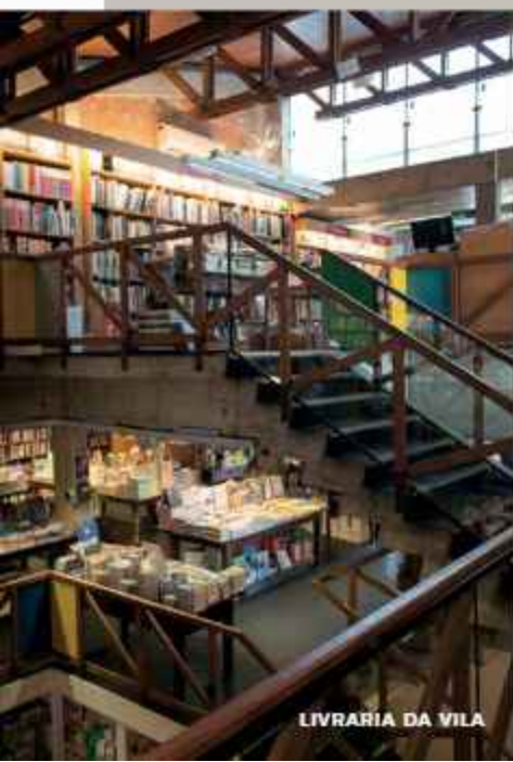
LIVRARIA DA VILA