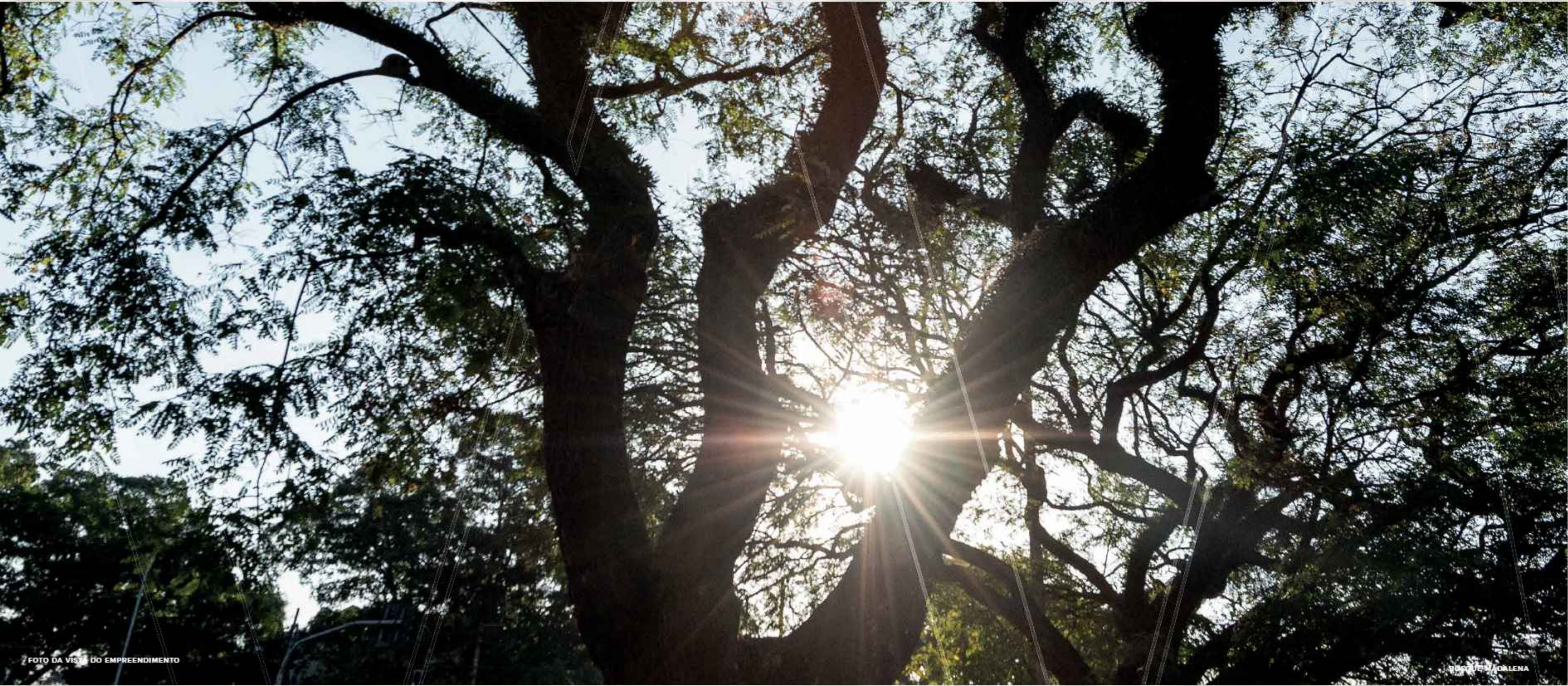
FOTO DA VISTA DO EMPREENDIMENTO