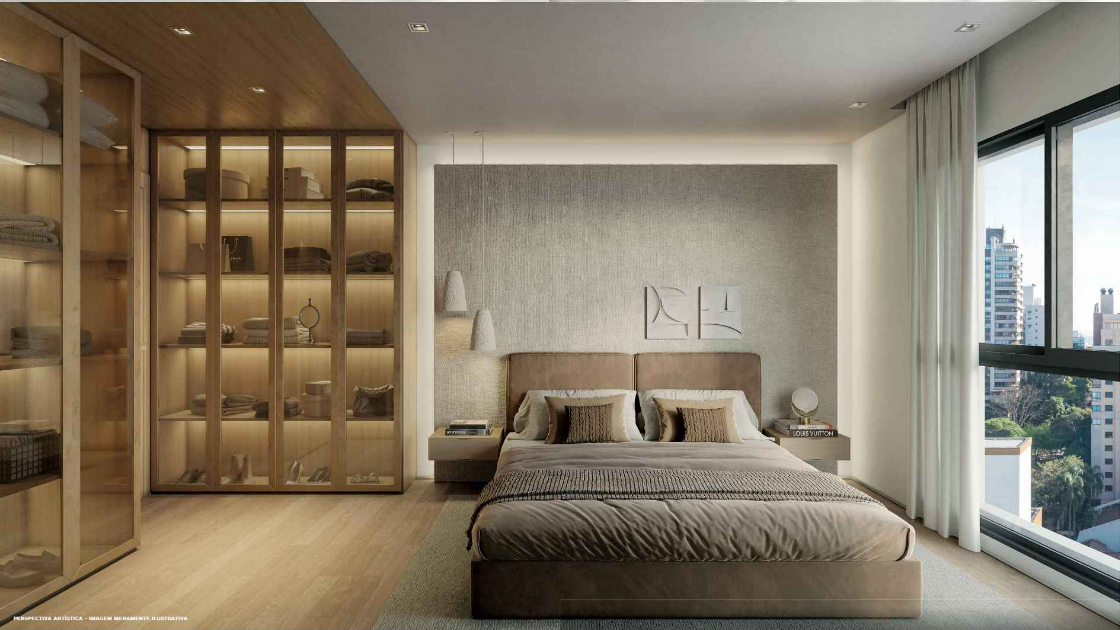
PERSPECTIVA ARTÍSTICA - IMAGEM MERAMENTE ILUSTRATIVA