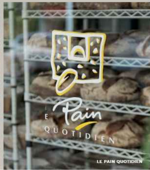
LE PAIN QUOTIDIEN