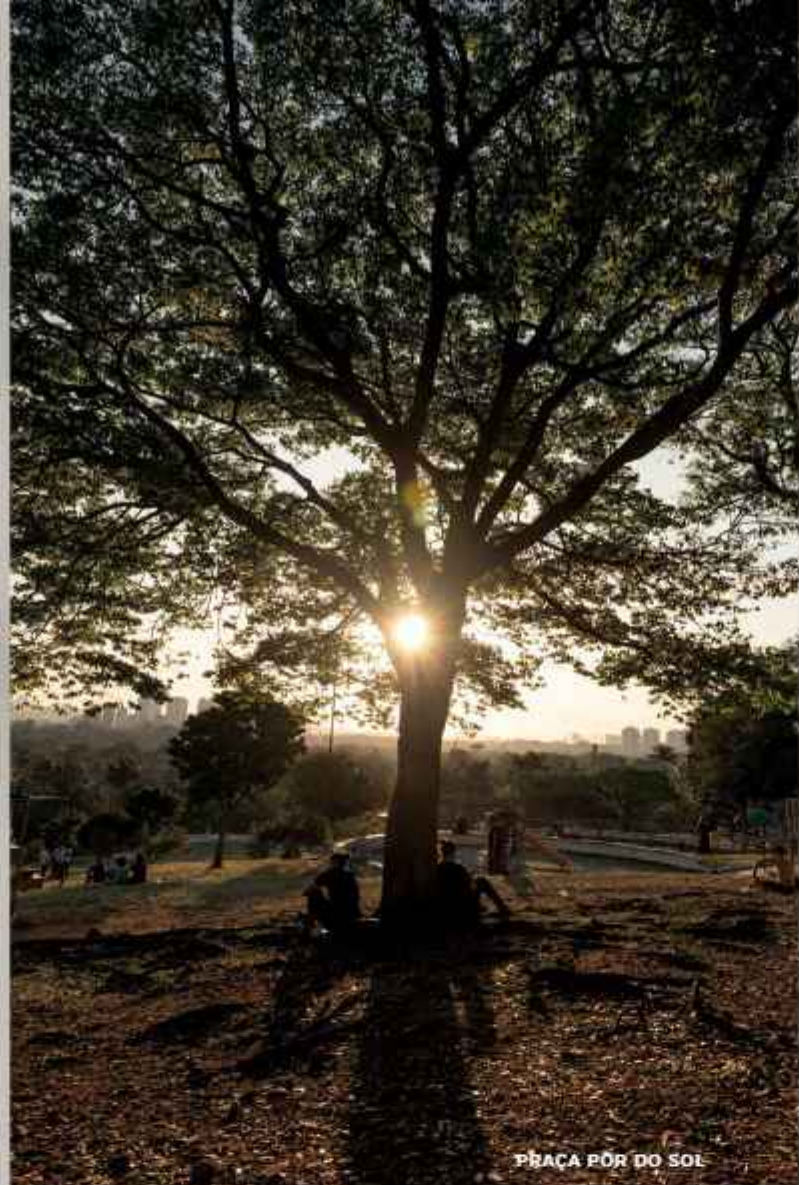
PRAÇA PÔR DO SOL