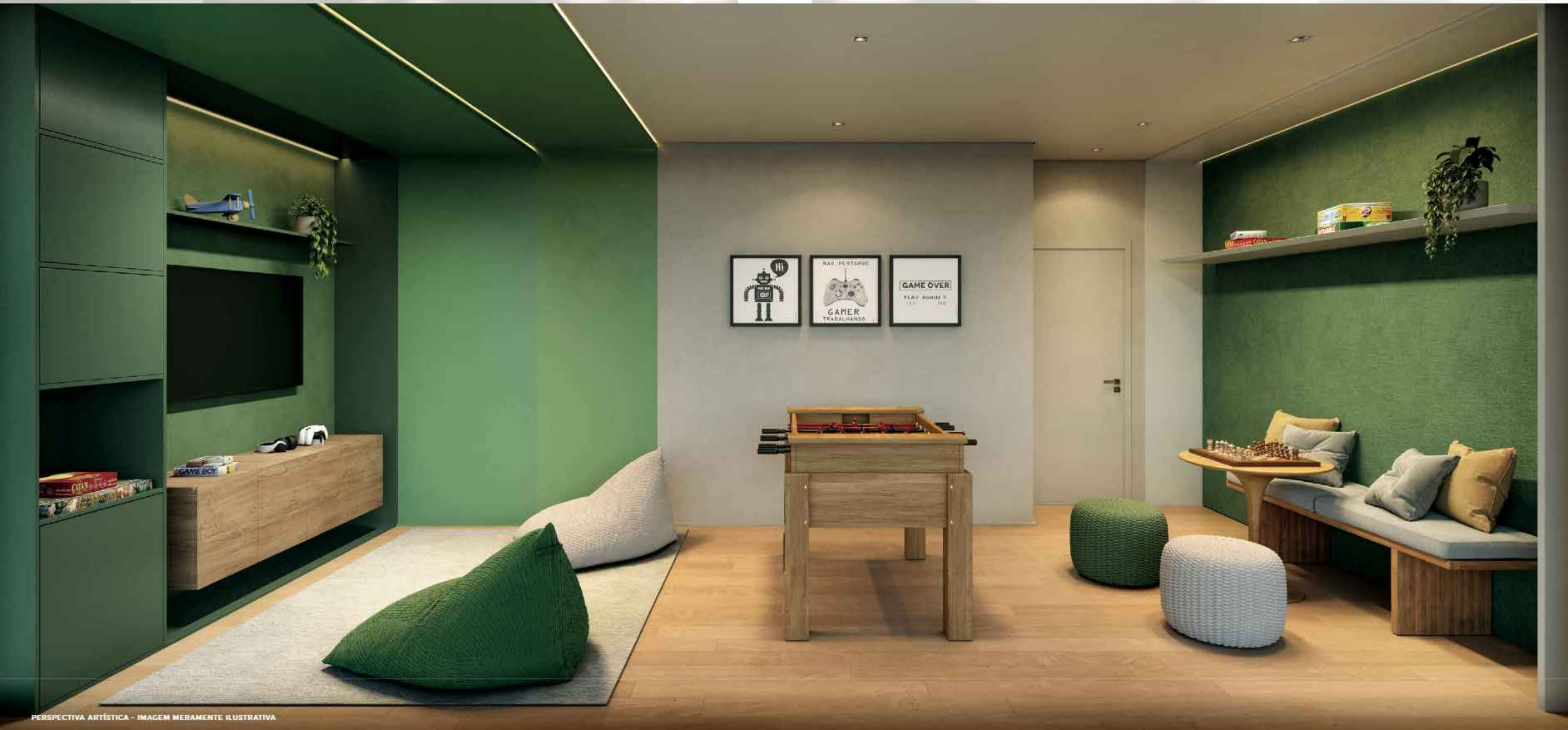
PERSPECTIVA ARTÍSTICA - IMAGEM MERAMENTE ILUSTRATIVA