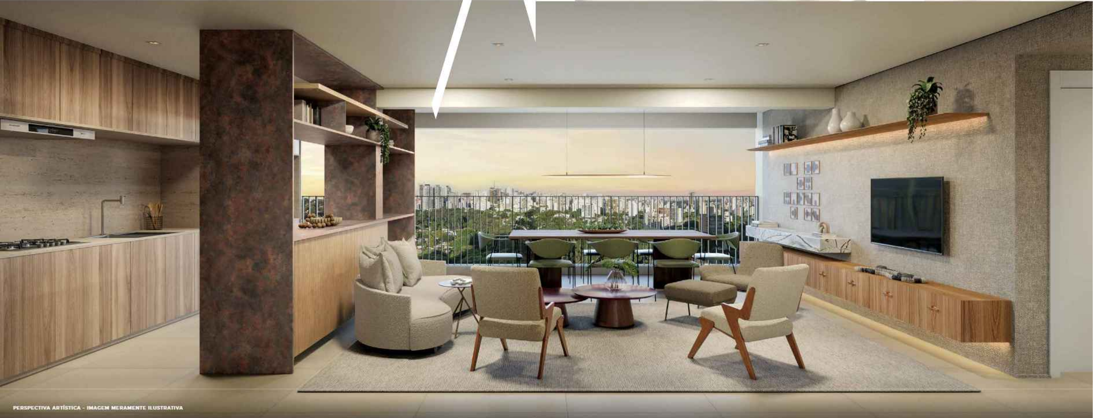
PERSPECTIVA ARTÍSTICA - IMAGEM MERAMENTE ILUSTRATIVA