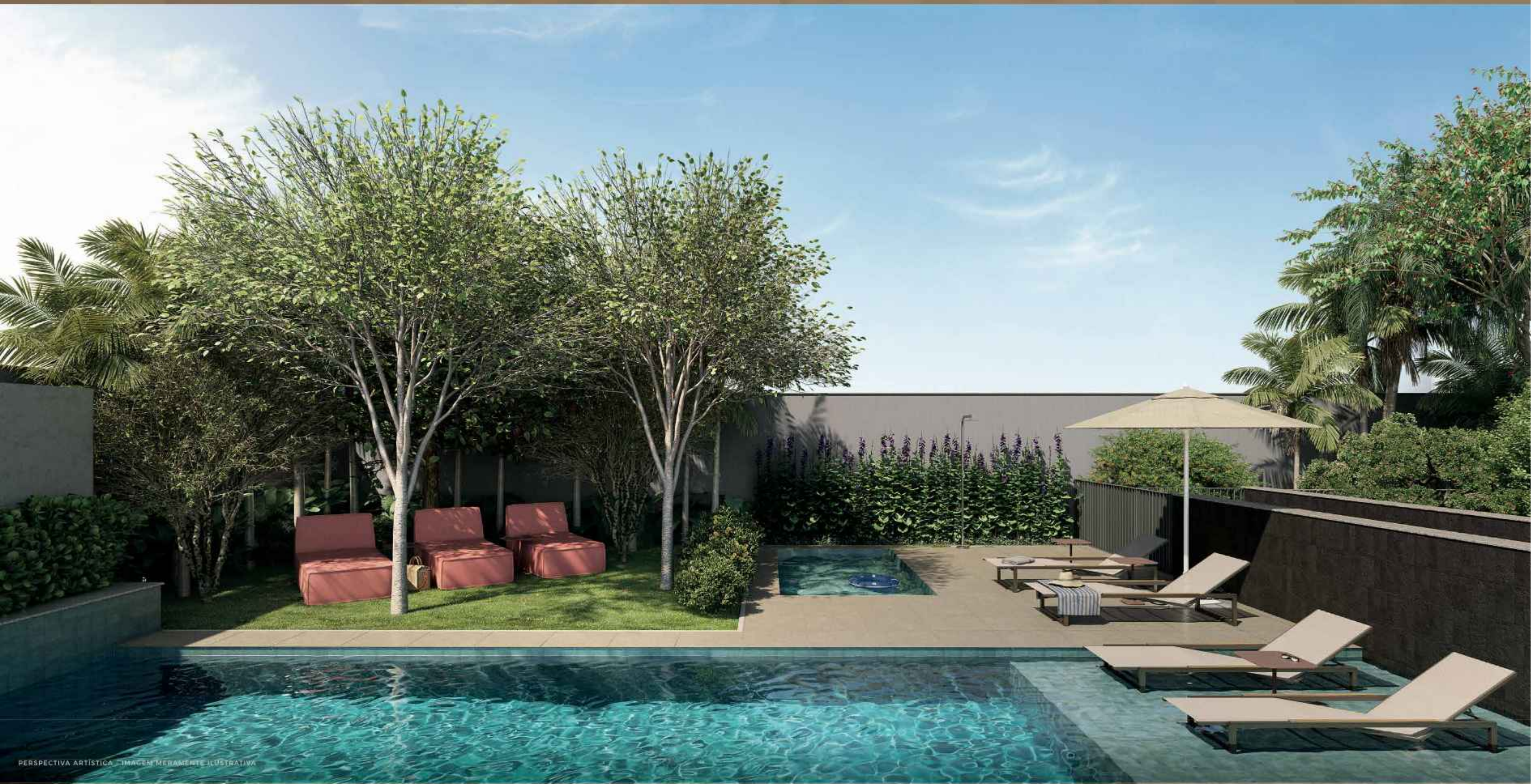
PERSPECTIVA ARTISTICA - IMAGEN MERAMENTE ILUSTRATIVA