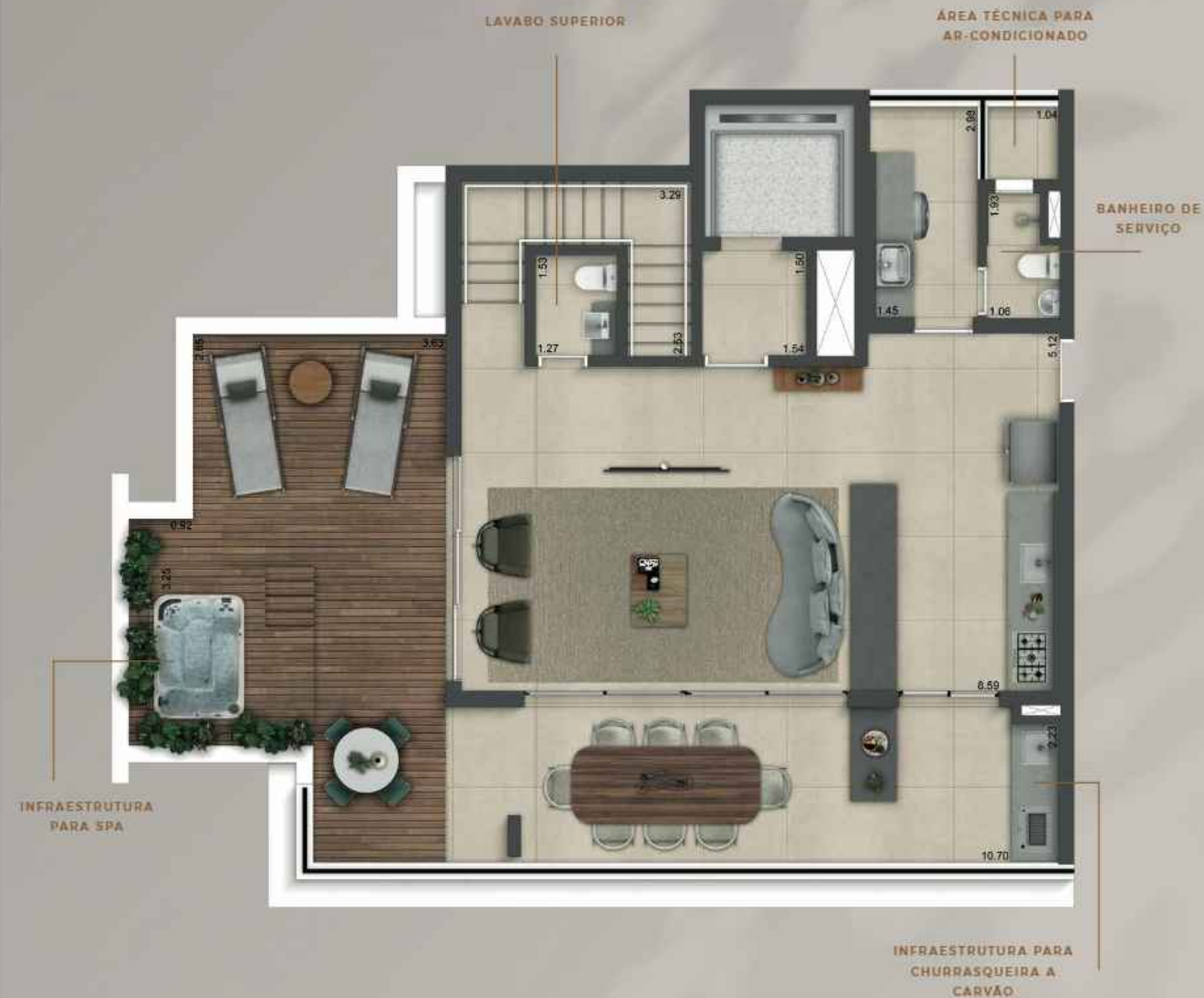
ILUSTRAÇÃO ARTÍSTICA DO APARTAMENTO. OS MÓVEIS, OS OBJETOS DE DECORAÇÃO, OS REVESTIMENTOS DE PISOS, PAREDE, CUBAS DA SUÍTE MASTER, A INTEGRAÇÃO ENTRE A SALA E O TERRAÇO, O DETALHAMENTO DOS SERVIÇOS, OS EQUIPAMENTOS E OS ACABAMENTOS ETC. SÃO MERAS SUGESTÕES E NÃO CORRESPONDEM NECESSARIAMENTE AO QUE SERÁ ENTREGUE PELA INCORPORADORA. A UNIDADE SERÁ ENTREGUE CONFORME CONTRATO, PLANTA, MEMORIAL DESCRITIVO E CONVENÇÃO DE CONDOMÍNIO.