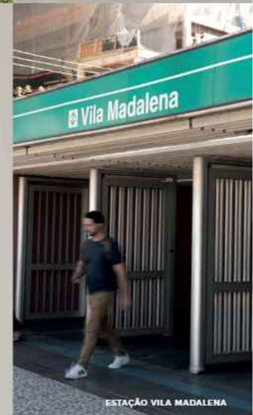
ESTAÇÃO VILA MADALENA

O PRIVILÉGIO DE UM ENDEREÇO DESEJADO. INFINITAS OPÇÕES DE LAZER, MOBILIDADE, GASTRONOMIA, ARTE E NATUREZA.