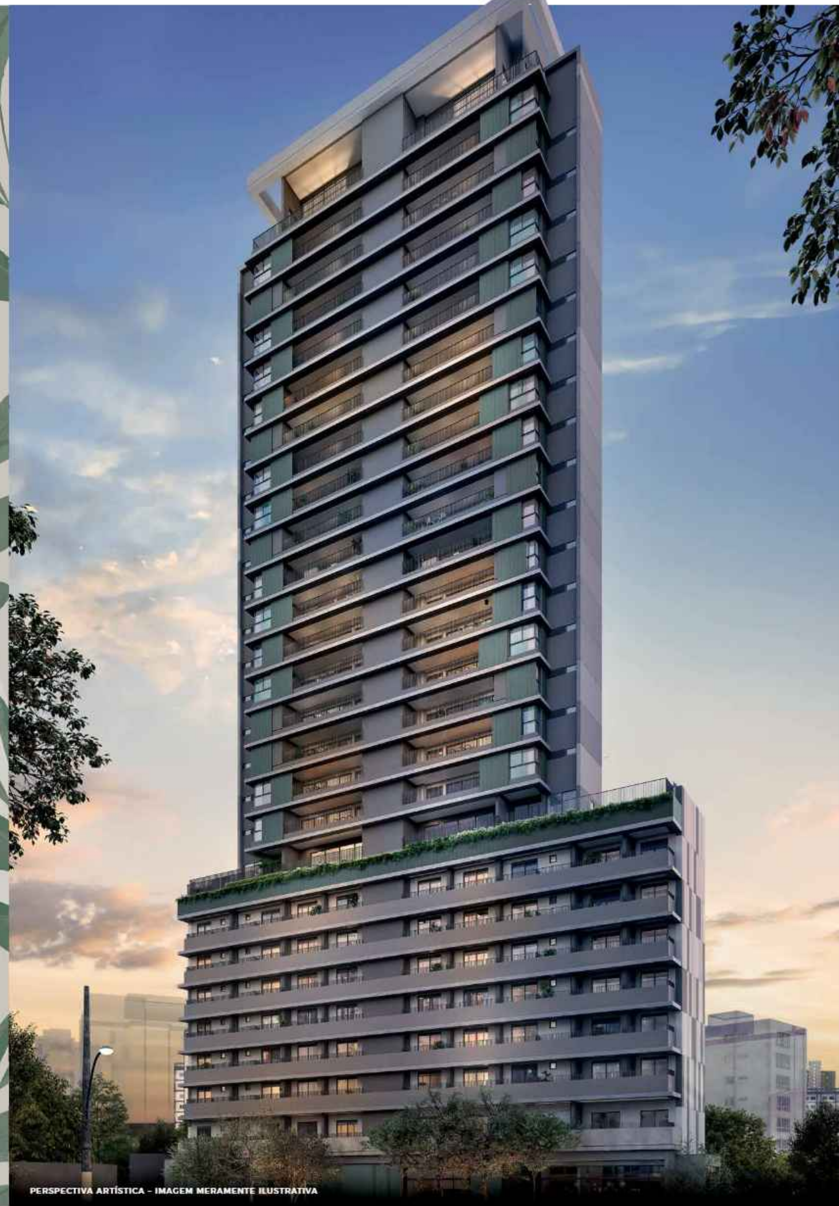
PERSPECTIVA ARTÍSTICA - IMAGEM MERAMENTE ILUSTRATIVA