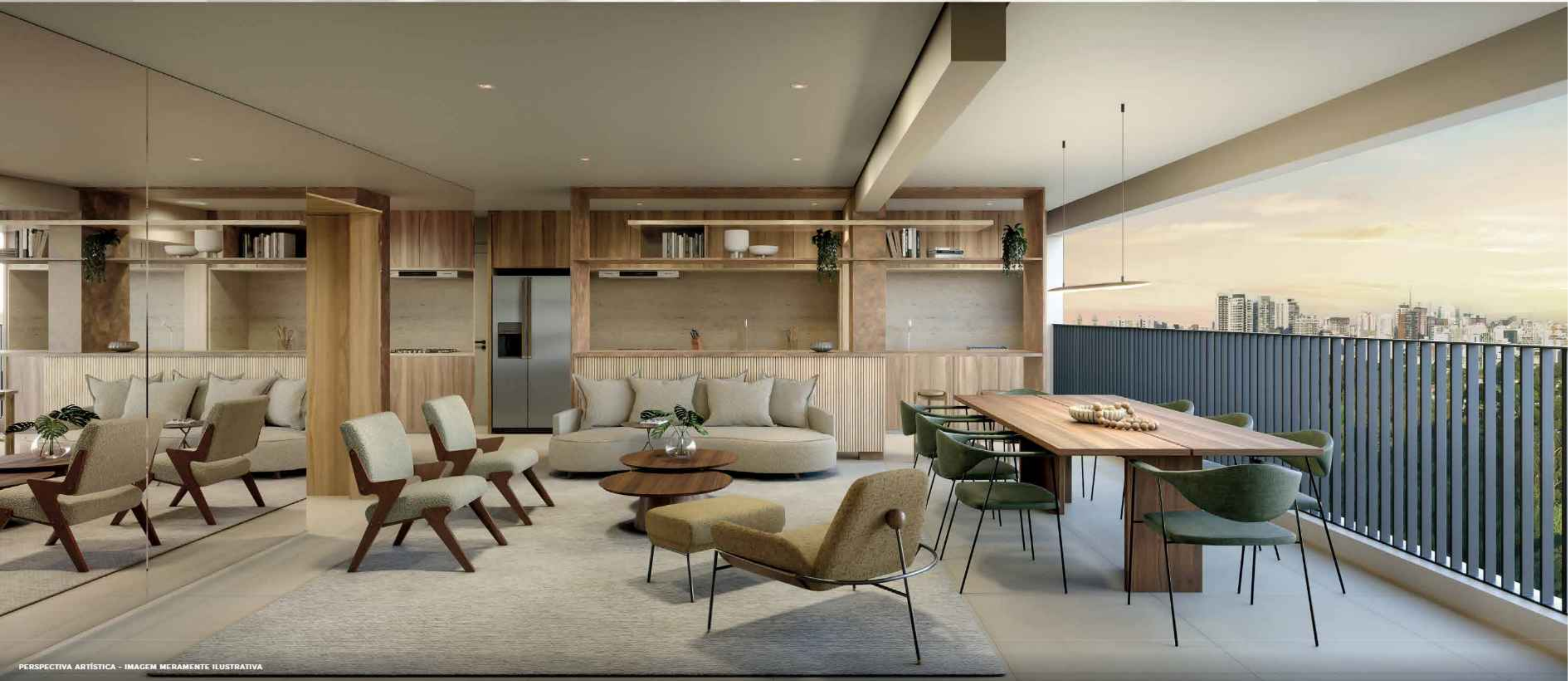
PERSPECTIVA ARTÍSTICA - IMAGEM MERAMENTE ILUSTRATIVA