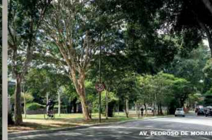
AV. PEDROSO DE MORAIS