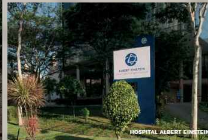
HOSPITAL ALBERT EINSTEIN

EM UM DOS BAIRROS MAIS ARBORIZADOS E CHARMOSOS DA CIDADE.