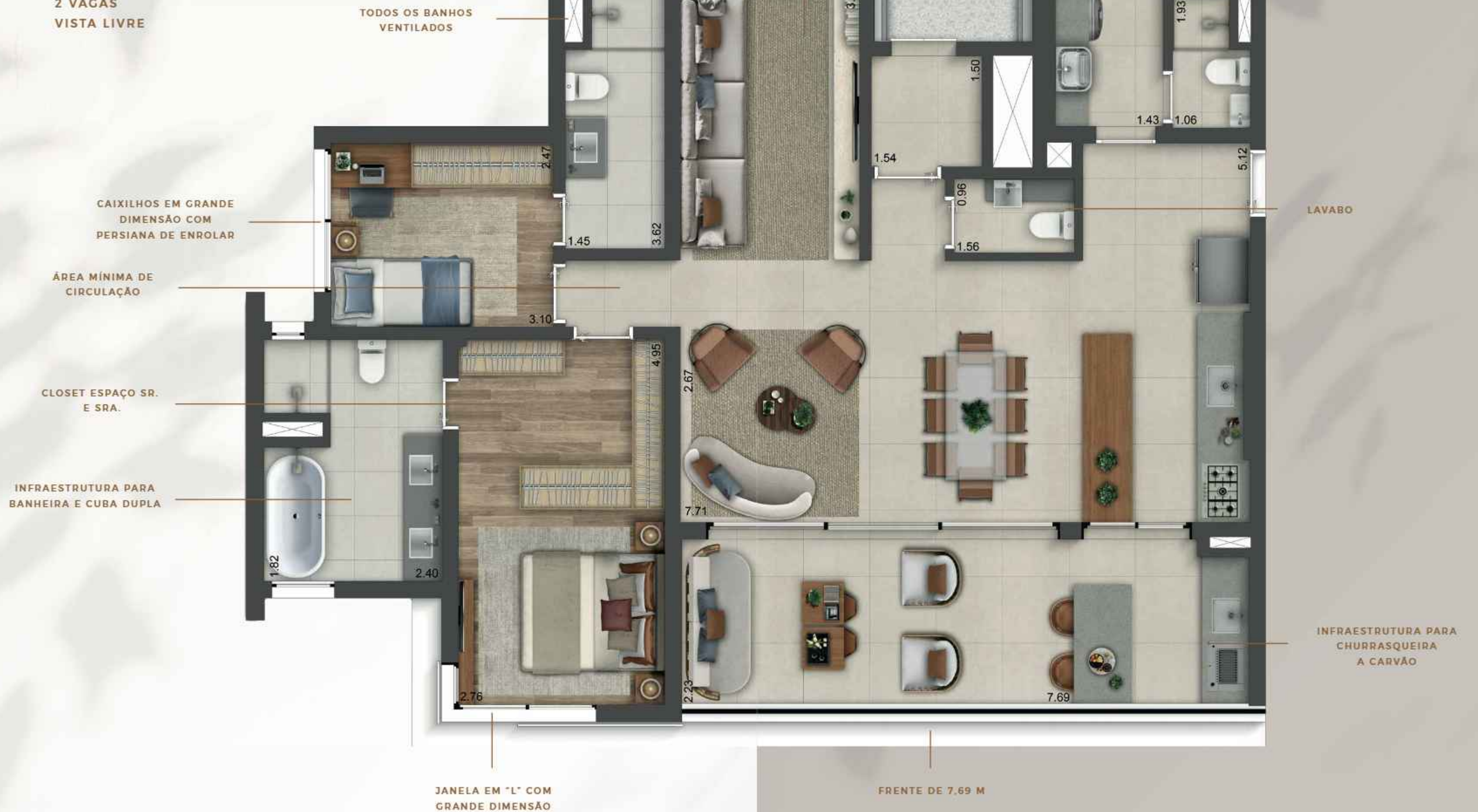
ILUSTRAÇÃO ARTÍSTICA DO APARTAMENTO. OS MÓVEIS, OS OBJETOS DE DECORAÇÃO, OS REVESTIMENTOS DE PISOS, PAREDE, CUBAS DA SUÍTE MASTER, A INTEGRAÇÃO ENTRE A SALA E O TERRAÇO, OS EQUIPAMENTOS E OS ACABAMENTOS ETC. SÃO MERAS SUGESTÕES E NÃO CORRESPONDEM NECESSARIAMENTE AO QUE SERÁ ENTREGUE PELA INCORPORADORA. A UNIDADE SERÁ ENTREGUE CONFORME CONTRATO, PLANTA, MEMORIAL DESCRITIVO E CONVENÇÃO DE CONDOMÍNIO