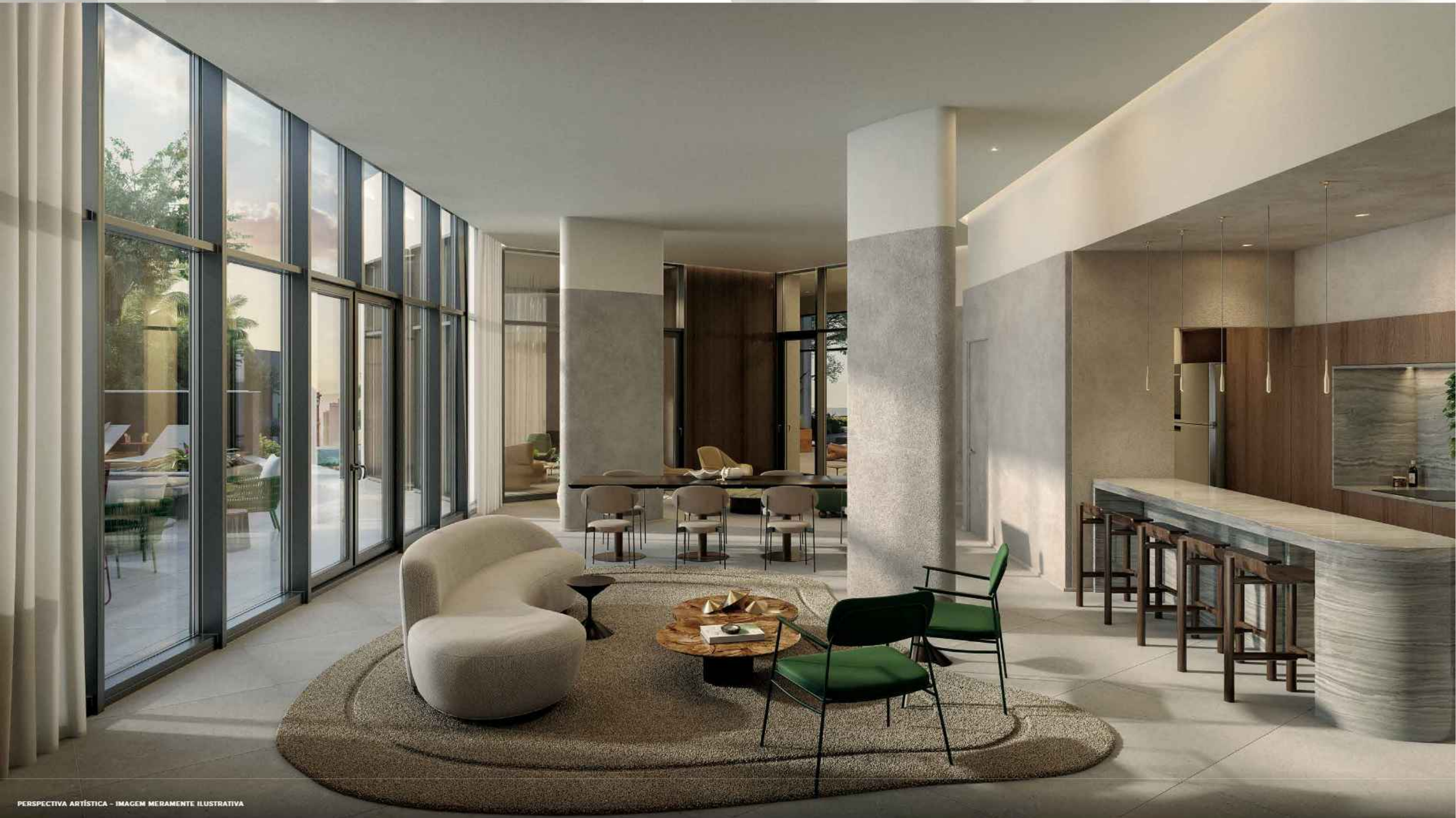
PERSPECTIVA ARTÍSTICA - IMAGEM MERAMENTE ILUSTRATIVA