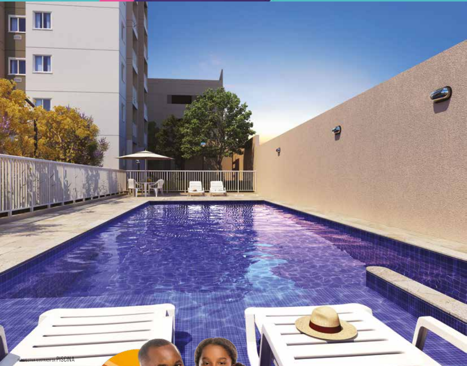
PERSPECTIVA ILUSTRADA DA PISCINA