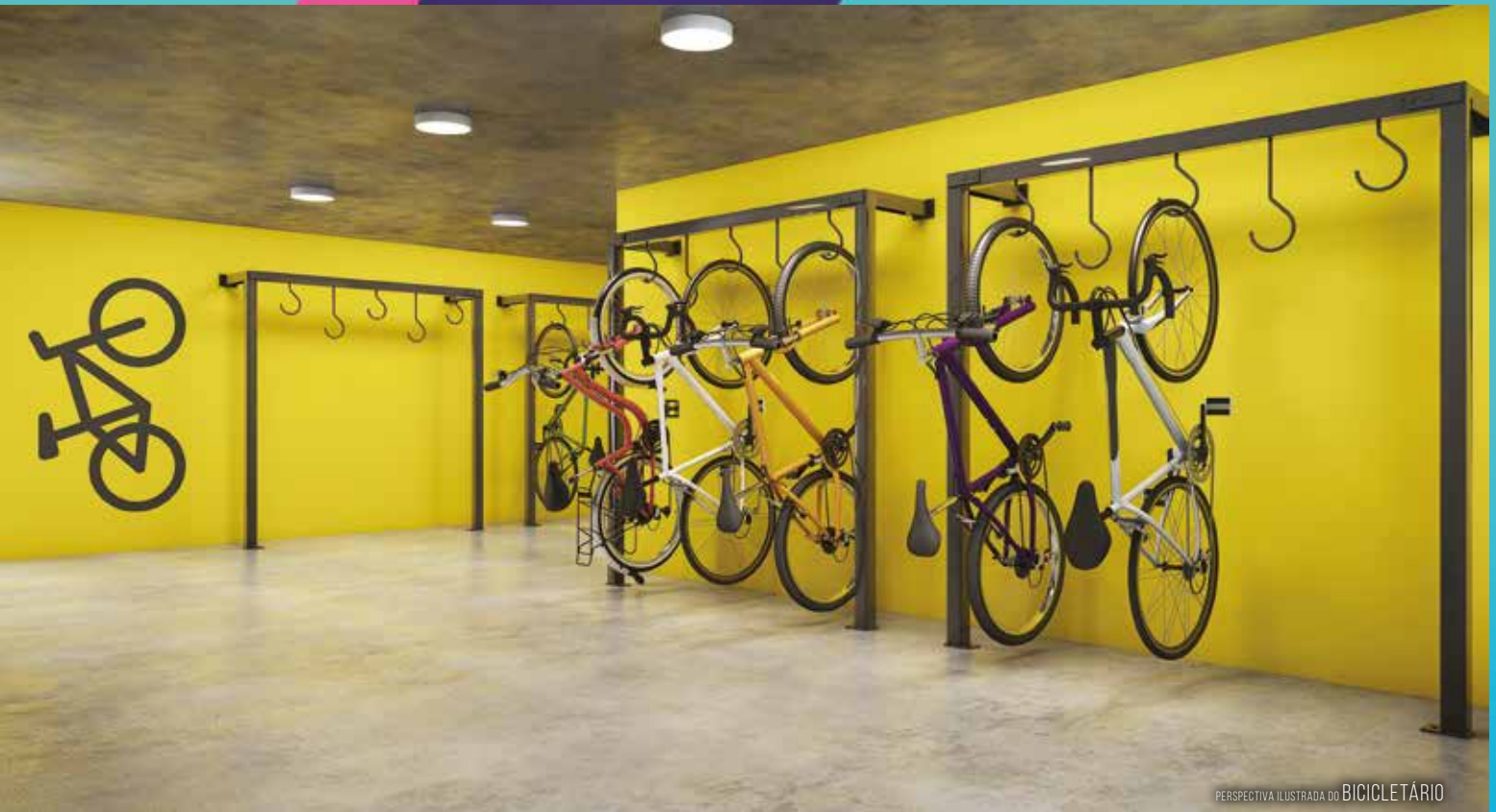
PERSPECTIVA ILUSTRADA DO BICICLETÁRIO