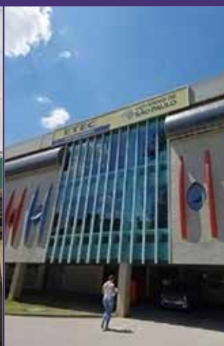
ETEC ABDIAS DO NASCIMENTO