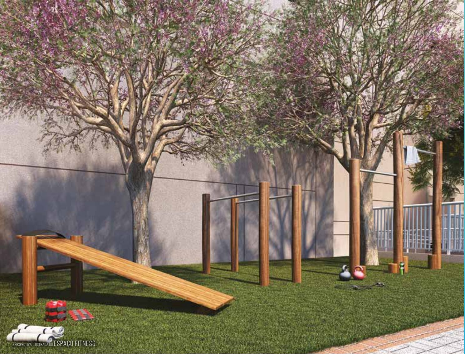
PERSPECTIVA ILUSTRADA DO ESPAÇO FITNESS