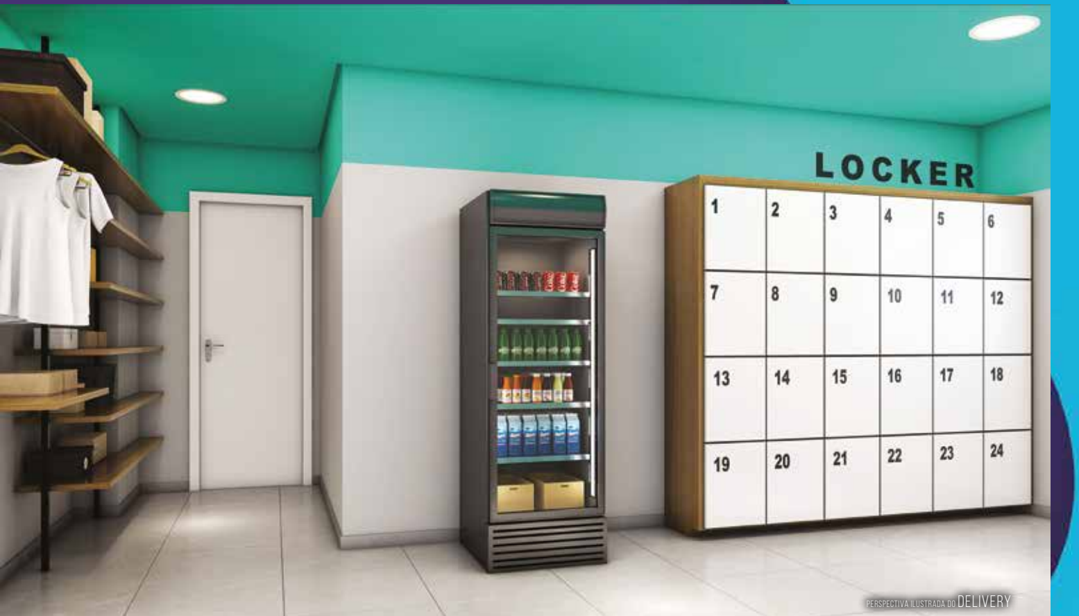
PERSPECTIVA ILUSTRADA DO DELIVERY