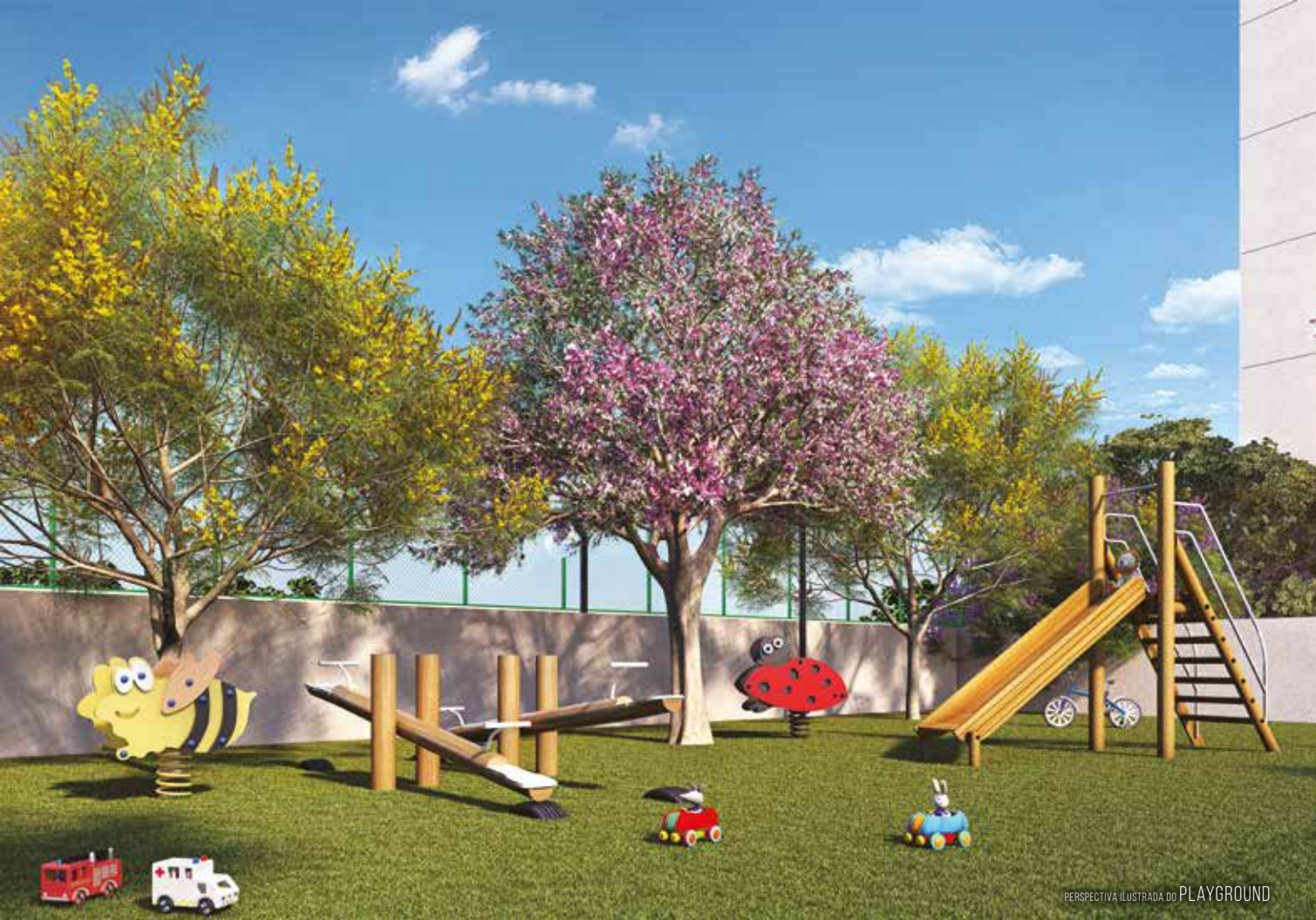
PERSPECTIVA ILUSTRADA DO PLAYGROUND