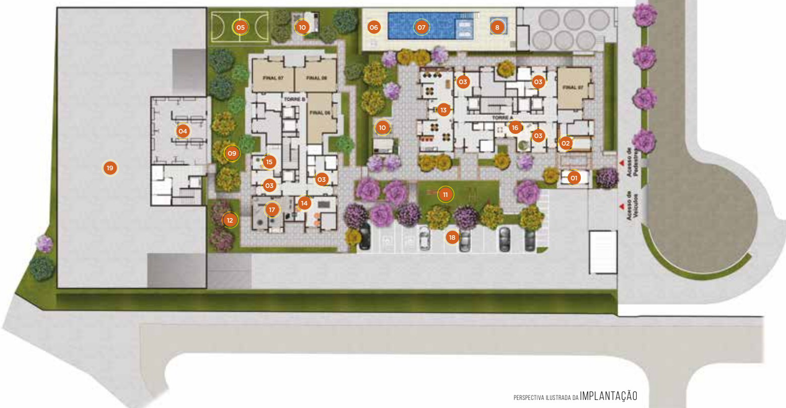
PERSPECTIVA ILUSTRADA DA IMPLANTAÇÃO