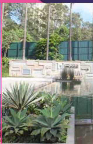
PARQUE BURLE MARX