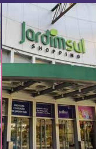
SHOPPING JARDIM SUL