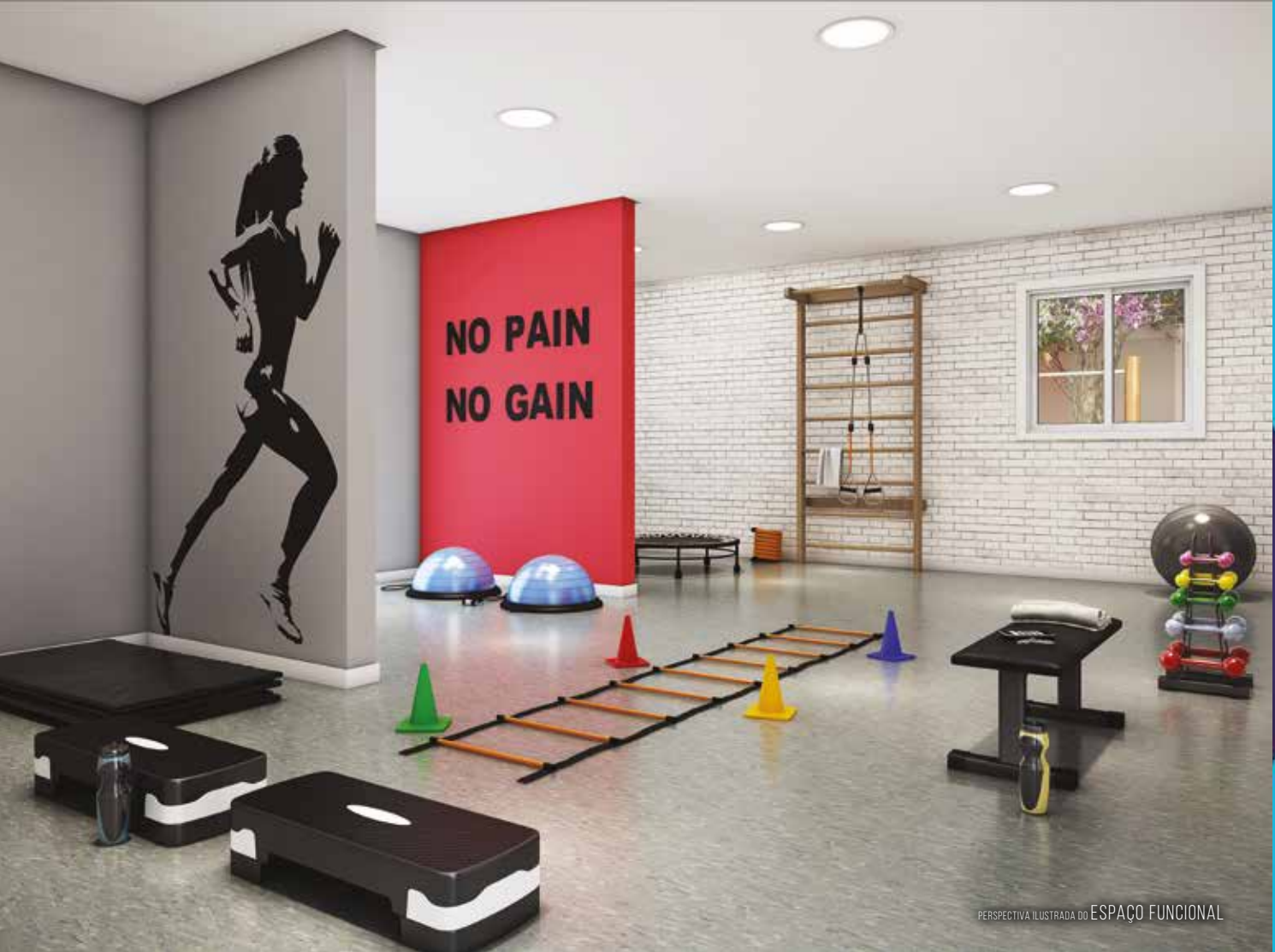
PERSPECTIVA ILUSTRADA DO ESPAÇO FUNCIONAL