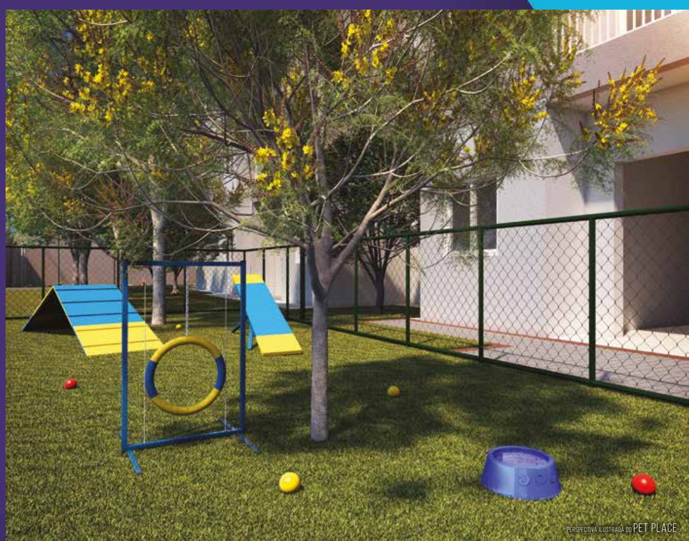
PERSPECTIVA ILUSTRADA DO PET PLACE