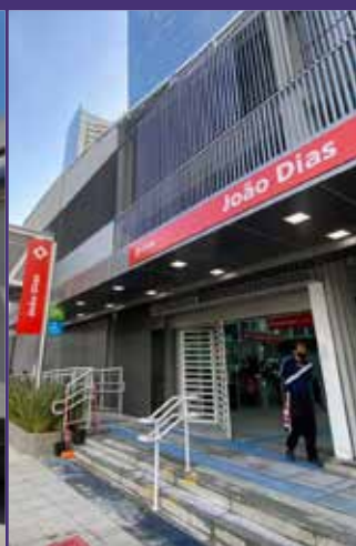
TERMINAL JOÃO DIAS