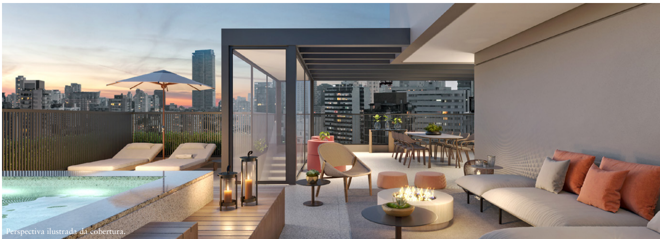
Perspectiva ilustrada da cobertura.