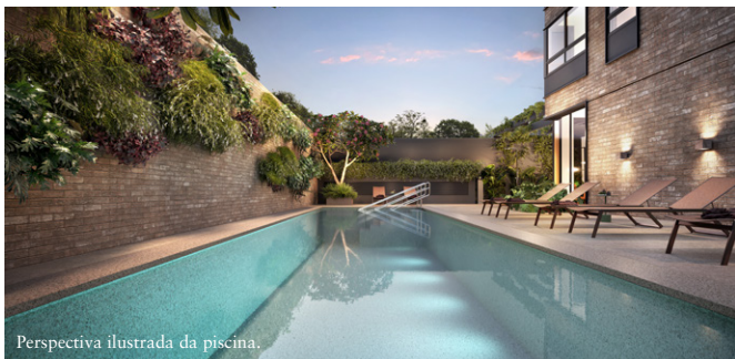
Perspectiva ilustrada da piscina.