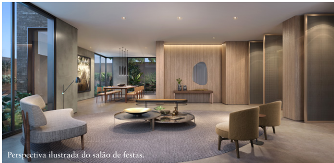
Perspectiva ilustrada do salão de festas.