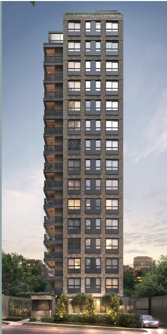
Perspectiva ilustrada da fachada.