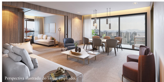
Perspectiva ilustrada do living ampliado.