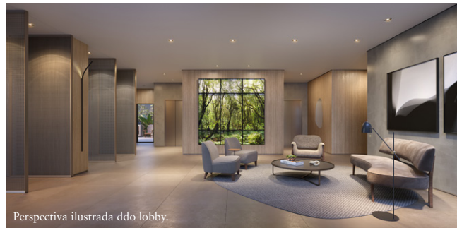
Perspectiva ilustrada do lobby.